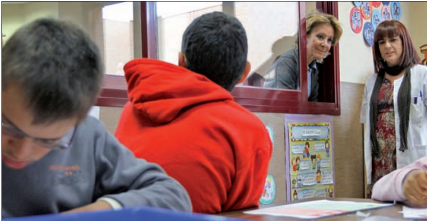
Aguirre ha inaugurado esta semana un Colegio de Educación Especial en San Sebastián de los Reyes