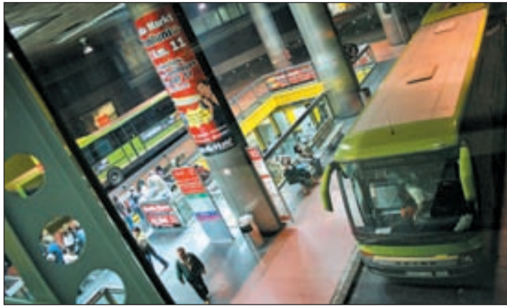
Cuatro líneas de la EMT se han trasladado al exterior

USUARIOS, COMERCIOS Y TAXISTAS SE QUEJAN DE LOS CAMBIOS