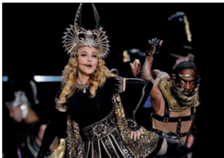
Así se presentó la artista en el intermedio de la Super Bowl

Esta será una de las canciones que Madonna interpretará el próximo 20 de junio en el Palau Sant Jordi, único concierto hasta ahora confirmado en España