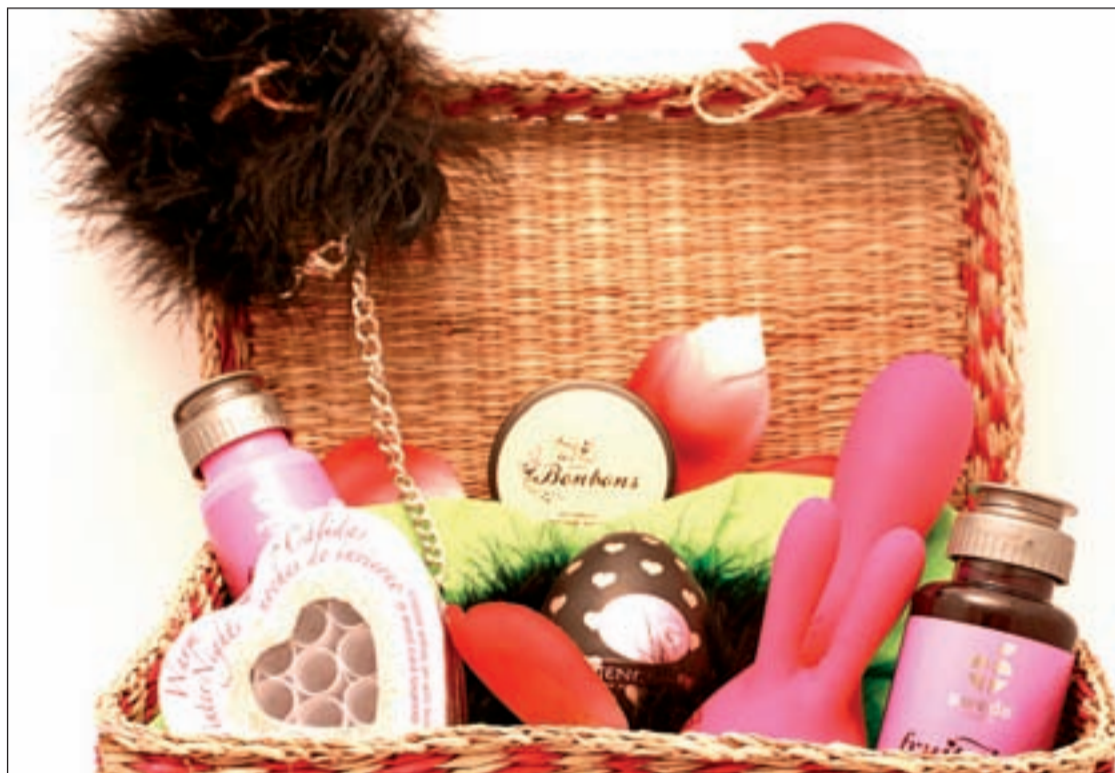
Cesta regalo especial San Valentín de 'Los placeres de Lola'

Para adentrarnos en la demanda de los regalos más sexys contactamos con la tienda erótica 'Los placeres de Lola'. Nos explican que en San Valentín existe mu-