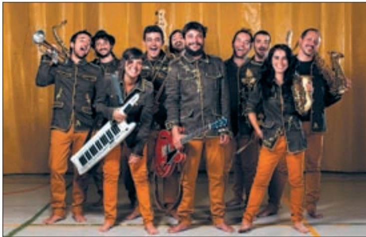
Todos sus componentes disfrutaban como niños sobre el escenario

Las decenas de personas que bailaron sin parar y tararearon los 'salmos' de la banda el pasado viernes en la sala Kapital, conocida discoteca madrileña donde resulta extraño escuchar este tipo de música, demostraron el buen estado de salud que posee 'Alamedadosoulna', una de las bandas más importantes del popular barrio de Barajas que utilizaron para su nombre artístico. Diez artistas, tan músicos como comediantes sobre el escenario, componen esta polifacética familia numerosa, término (a lo polifacético me refiero) que también puede utilizarse para definir un rico producto sonoro: una mezcla de ska, reggae, soul y rock.