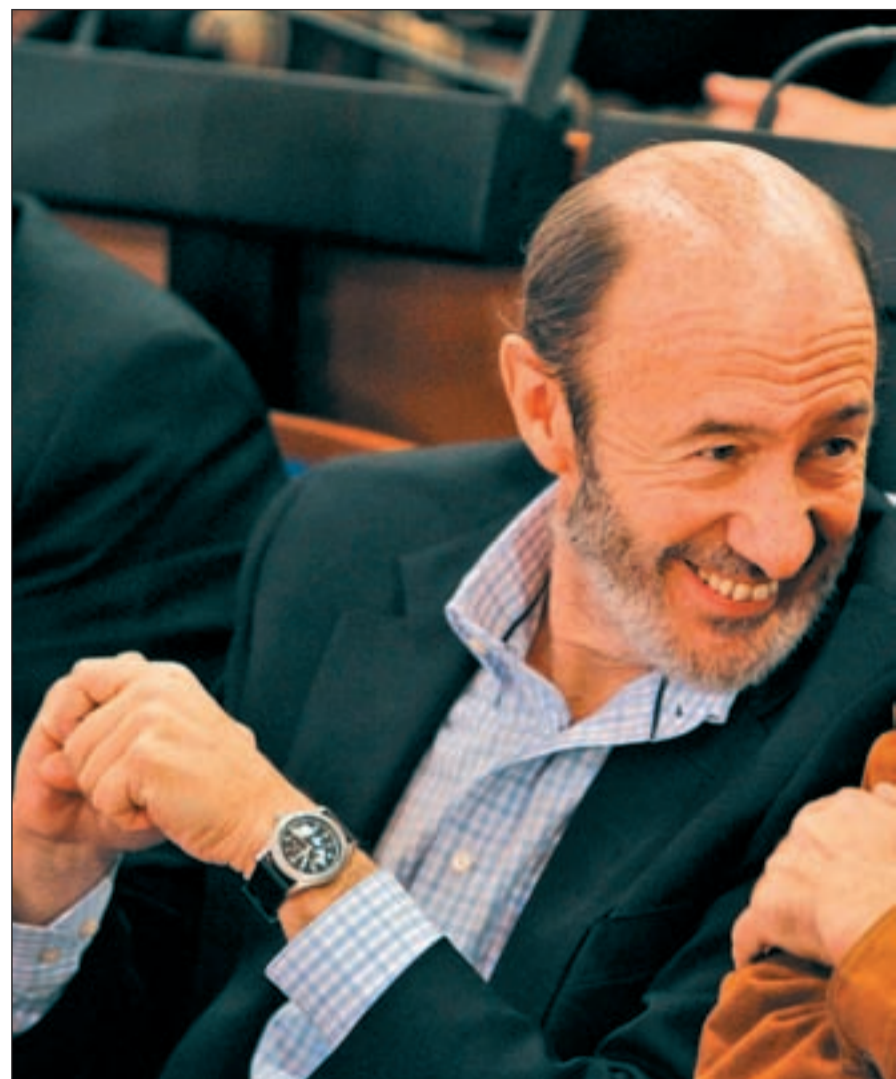
Alfredo Pérez Rubalcaba y Valeriano Gómez en una imagen de archivo

Mientras tanto, se escuchan muchas voces, cada vez con más fuerza. Un grupo de socialistas madrileños ha elaborado un documento que bajo el título 'Por el cambio y la convivencia' apuesta por un proyecto de "unidad" para el PSM, y por que la federación madrileña tenga un "discurso coherente" y sea una organización "más amplia, abierta y modernizada". El documento ha sido impulsado por di-