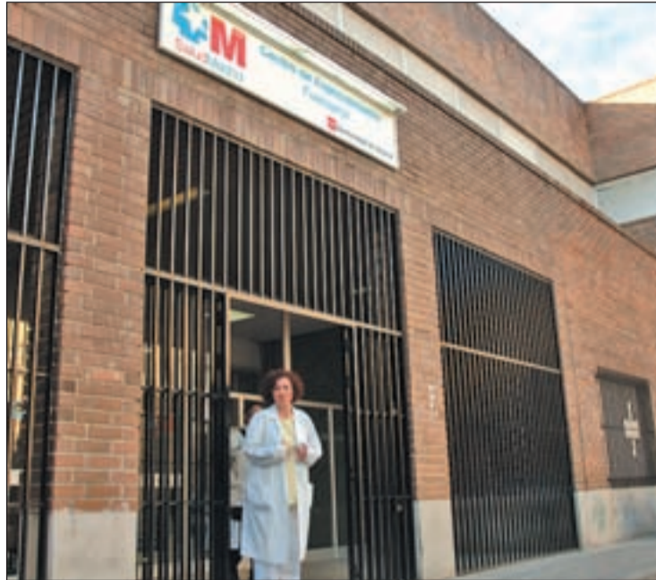
El centro de Olesa de Monserrat dejara de funcionar en marzo

Durante una reciente asamblea, a las que acudieron 400 vecinos, se llegó a esta conclusión para reivindicar una solución más próxima a las previstas, que supondrían el traslado de los pacientes (en torno a 70.000 personas acuden a este centro) a La Paz, al José Marva o al espacio