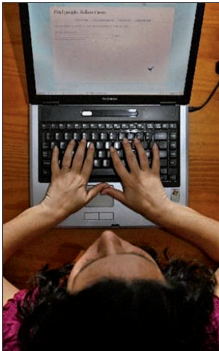
Una usuaria de las redes sociales

FriendScout24, Déjatequer.com, Hispanoamor.es, más