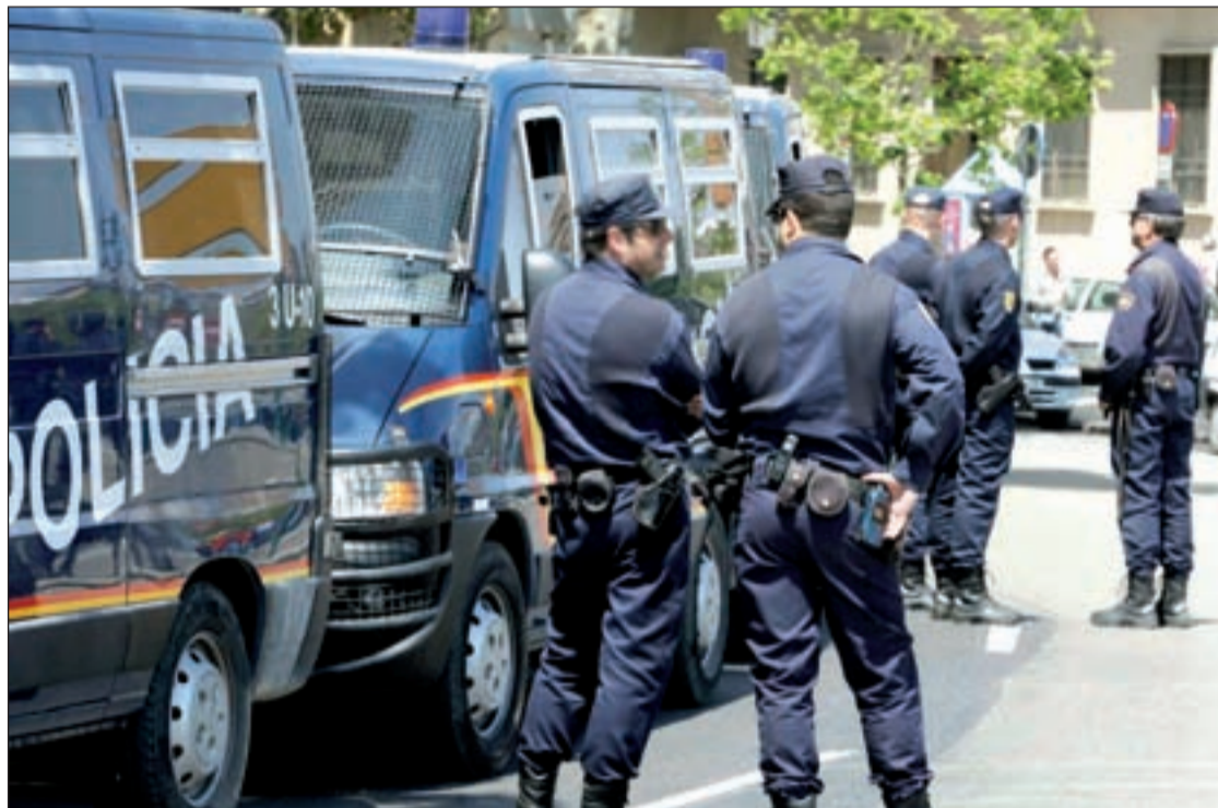
El mayor incremento de efectivos policiales tendrá como finalidad un efecto disuasorio

Desde la Federación Regional de Asociaciones de Vecinos de Madrid (FRAVM) aseguran que, recientemente, no se han recibido reclamaciones desde los múl-