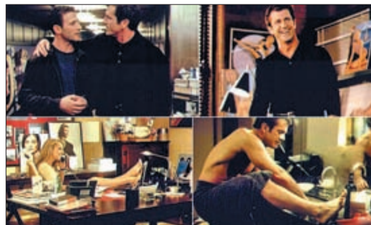
Cuatro escenas de la película '¿En qué piensan las mujeres?'