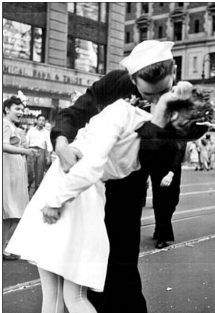
El beso es una de las manifestaciones del amor en nuestra cultura

Por otra parte, dejando a un lado la leyenda, volvemos al te-