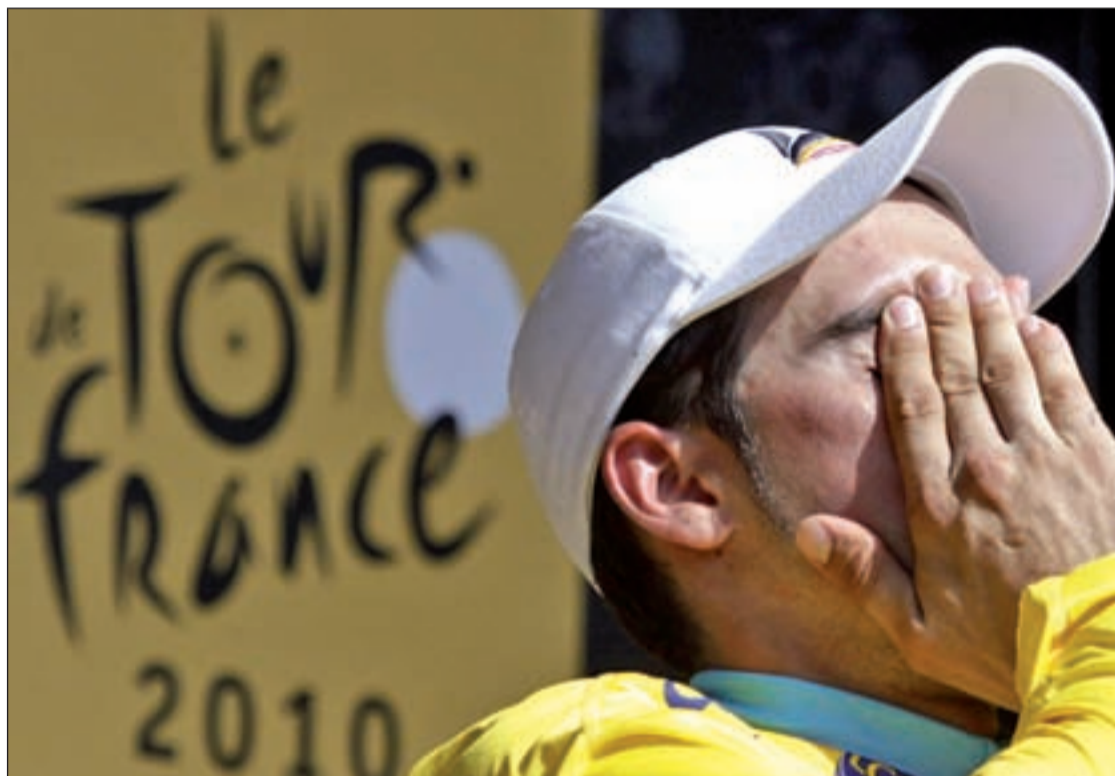
La victoria en el Tour de Francia de 2010 pasa ahora a manos del luxemburgués Andy Schleck

Curiosamente, la sentencia del TAS acepta la teoría de Contador sobre la contaminación alimen-