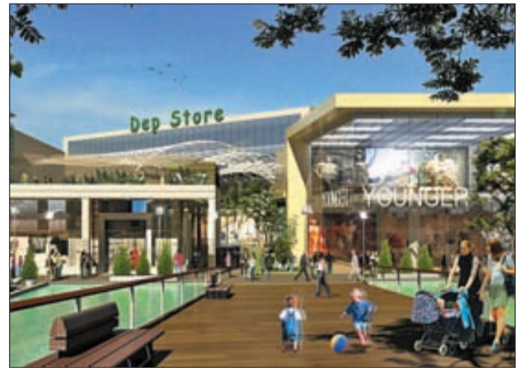
Maqueta del proyecto que verá la luz en 2015

Para los promotores de esta iniciativa, que ofrecerá 140.000 metros cuadrados de superficie bruta alquilable (SBA), el Valdebebas Center ofrecerá el mejor 'mix' comercial posible: operadores nacionales e internacionales y la oferta más completa de ocio y restauración, además de prestigiosas marcas de lujo para