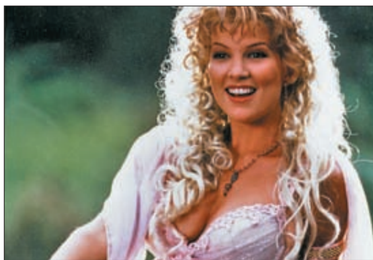
Alexandra Tydings da vida a Afrodita en ‘Hércules, sus viajes legendarios’

Por otro lado, estas fechas están rodeadas de más mitos, como el de la “fiesta de los valentines” en la Inglaterra de los siglos XVII y XVIII. Durante la misma, se elegían a hombres y mujeres para que formaran parejas porque, aunque ahora nos parece curioso el hecho de no poder elegir de forma autónoma a nuestro compañero sentimental, antes no existía tanta libertad en