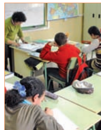
Niños en centro escolar

Otra de las relevantes novedades que incorpora la normativa de la Comunidad es la inclusión de la Renta Mínima de Inserción (RMI) en los criterios de admisión. A partir del próximo curso 2012/2013, las familias que reciban la RMI sumarán 2 puntos al elegir centro.