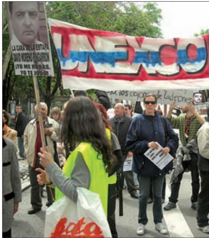
Una concentración reciente