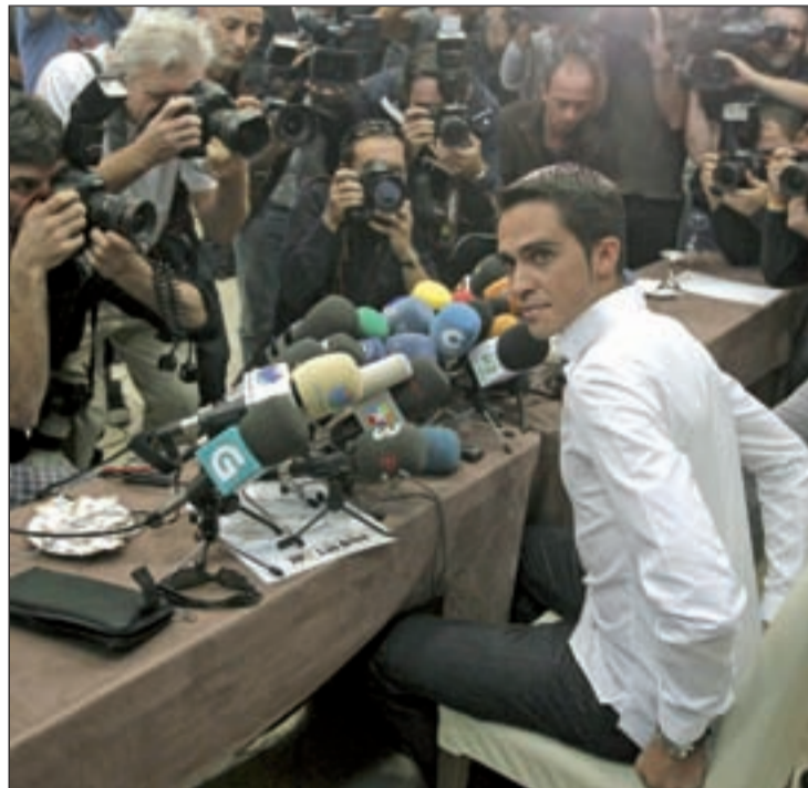
La victoria en el Tour 2010 pasa ahora a manos de Andy Schleck

Curiosamente, la sentencia del TAS acepta la teoría de Contador sobre la contaminación alimentaria, argumentando que la presencia del clenbuterol puede venir determinada por la ingesta de unos suplementos energéticos. De este modo, el TAS no sigue a pies juntillas la declaración de Contador, pero también se desmarca del recurso de la Unión Ciclista Internacional (UCI) que dejaba abierta la puerta a una posible acusación