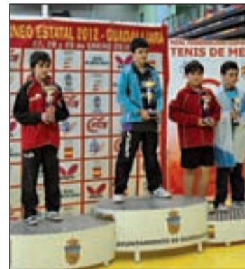
El podio de la prueba

supone un éxito teniendo en cuenta que muchos de sus contendientes procedían de equipos profesionales. Por otra parte, el club Cassidian-Getafe ha inscrito cuatro equipos, dobles e individuales en el Campeonato de España de discapacitados físicos e intelectuales de Almería.