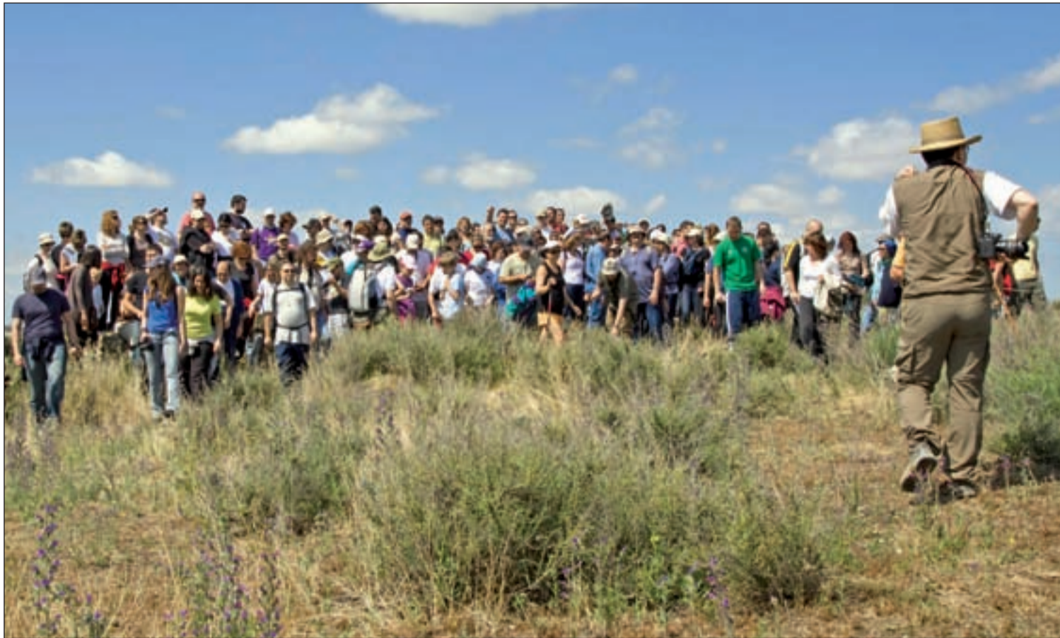
Los recorridos permiten descubrir a los ciudadanos los secretos que atesora la Cuenca Baja del afluente del Jarama. GRUPO INVESTIGACIÓN PARQUE LINEAL