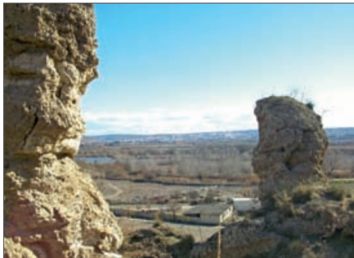
Una vista del río desde una zona aledaña GRUPO INVESTIGACIÓN PARQUE LINEAL

Hay ocasiones en las que la historia y la cultura, de la mano, se convierten en inmejorables fórmulas de ocio y en alternativas de ocupar el tiempo libre. Es la propuesta que abandera la asociación cultural Grupo de Investigadores del Parque Lineal, creada en Villaverde en 2008, con la intención de divulgar entre la ciudadanía los valores históricos y medioambientales del Parque Lineal del Manzanares. Un entorno que conciben como un "todo indivisible conformado por los diferentes paisajes que se integran en la Cuenca Baja del río Manzanares".