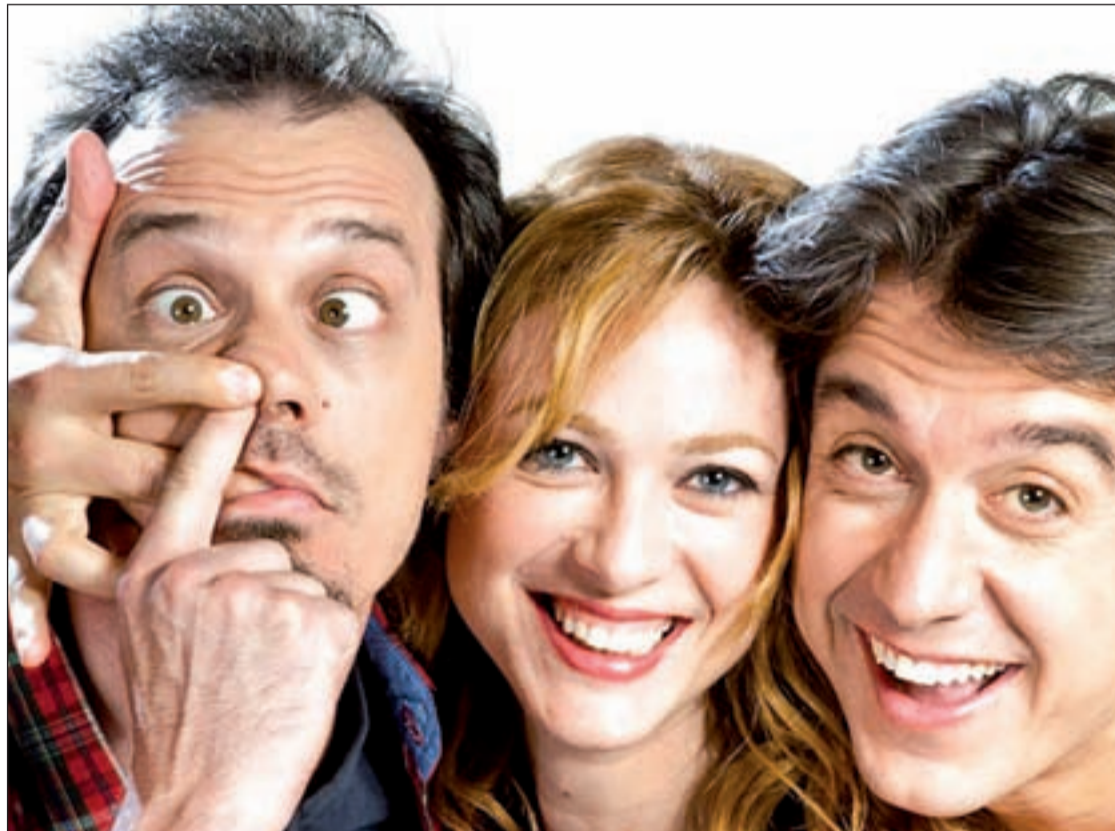
'Amigos hasta la muerte' se estrenó en Madrid en 2009

Veiga confiesa, además, que su propuesta ofrece una "comedia trampa", ya que persigue que la gente se ría pero, a la vez, se emocione con la trama, al tiem-