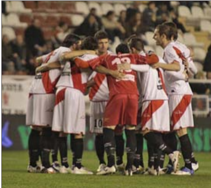
El Rayo está a dos puntos del equipo azulón

Esta cita le llega al Getafe en un momento en el que equipo de Luis García no ha acabado de definir si está más cerca de pelear por la sexta plaza o de echar cuentas con los equipos de la zona de descenso. Aunque sus 27 puntos no aseguran de forma matemática la permanencia, sí que colocan al equipo del Coliseum a muy poca distancia de uno de los equipos de moda y que más elogios acapara en las últimas semanas: el Athletic de Bilbao de Marcelo Bielsa. De hecho, si los rojiblancos caen en su visita al campo del Real Betis y el Getafe prolonga su buena racha como visitante, ambos equipos