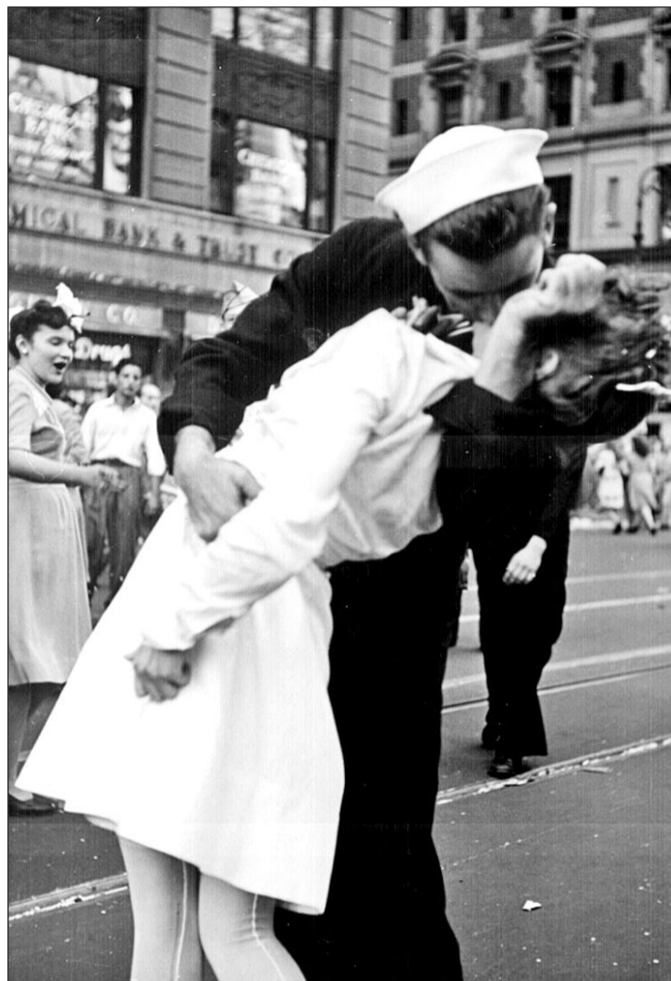
El beso es una de las manifestaciones del amor en nuestra cultura

Por otra parte, dejando a un lado la leyenda, volvemos al te-