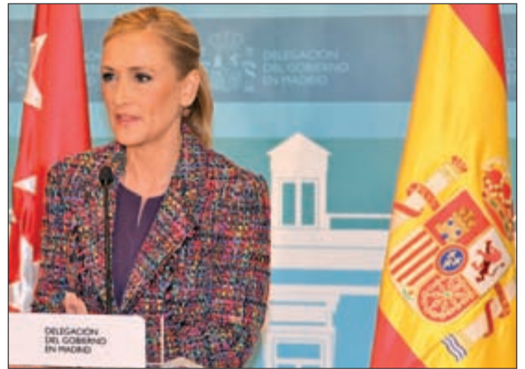
Cristina Cifuentes en su primer encuentro con un alcalde

Además, Soler ha invitado a Cifuentes a presidir las Juntas Locales de Seguridad que se celebran en el municipio a fin de mejorar la coordinación y aunar esfuerzos. La próxima está pre-