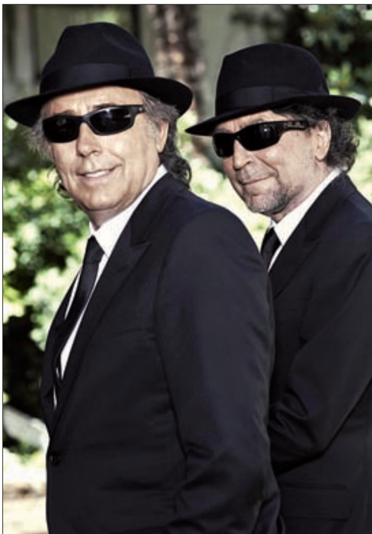
Serrat (izquierda) y Sabina (derecha) comparten una suma elegancia

tocando y haciendo música". Con este bonito mensaje, dos genios de la música española e iconos de la canción de autor en este último medio siglo han decidido retomar la profunda amistad personal y artística escenificada durante la gira 'Dos pájaros de un tiro' (2007) en la que uno cantaba canciones del otro y el otro del uno. Para esta ocasión, han decidido unir dos corazones, dos cerebros y dos maneras de ver la vida en un mismo todo cuya puesta en escena incluirá una extensa gira. 'La Orquesta del Titanic' incluye once canciones, donde es