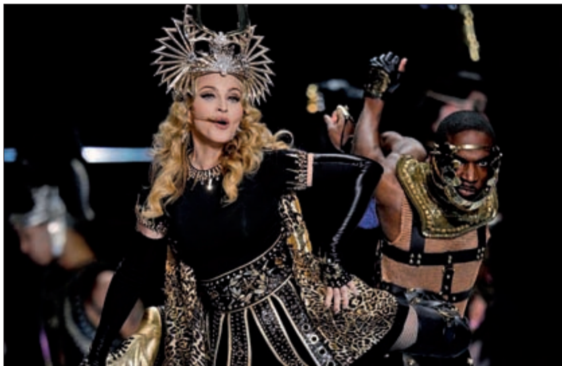
Así se presentó la artista estadounidense en el intermedio de la Super Bowl

Según la promotora Live Nation, las entradas para el citado evento se pondrán a la venta el 16 de febrero a partir de las 10 de la mañana. Madonna (Michigan,