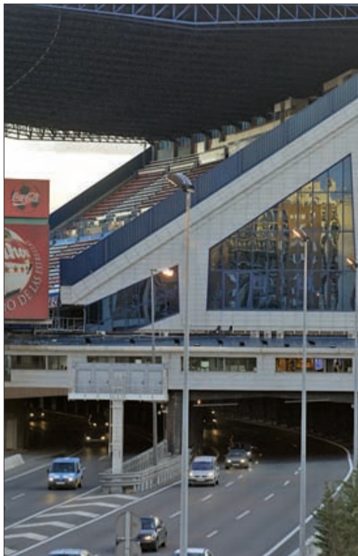
El proyecto incluye el soterramiento de la M-30