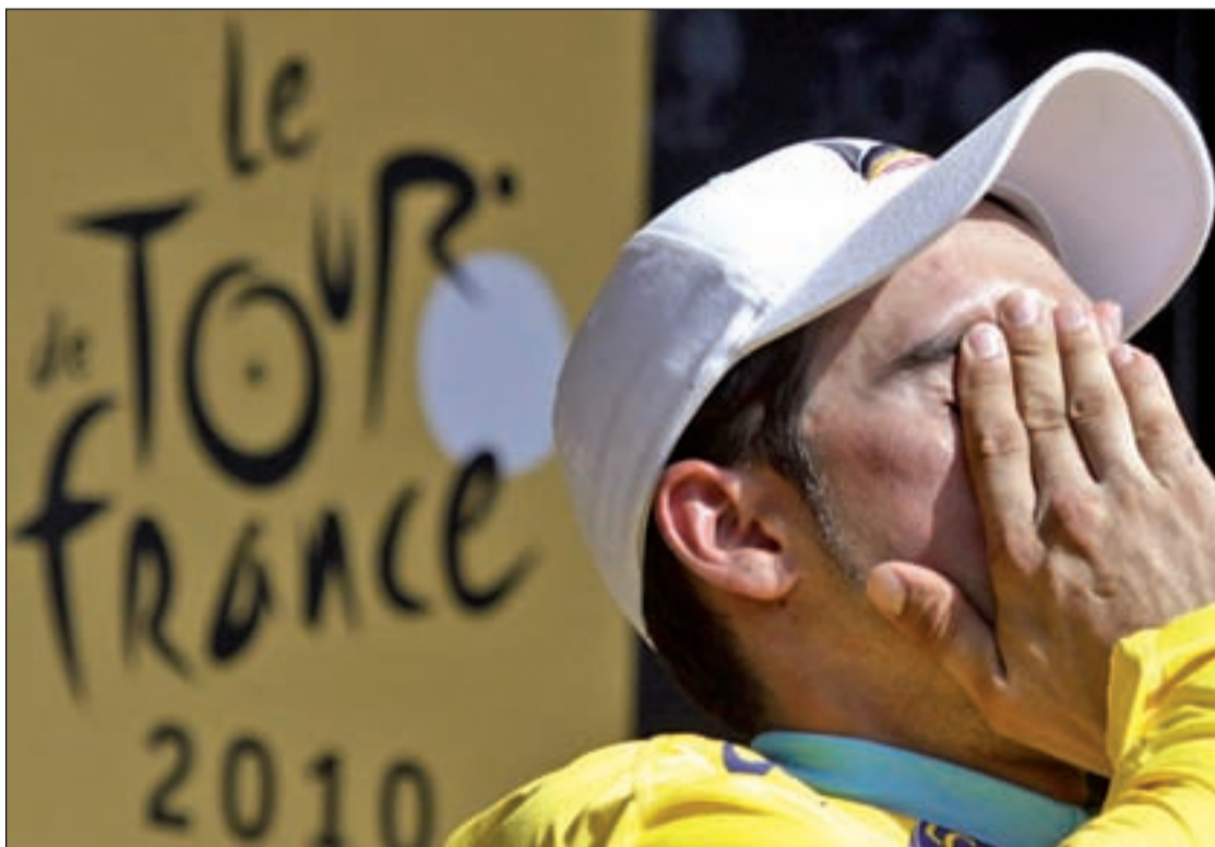
La victoria en el Tour de Francia de 2010 pasa ahora a manos del luxemburgués Andy Schleck

Curiosamente, la sentencia del TAS acepta la teoría de Contador sobre la contaminación alimen-