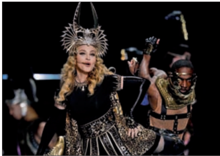
Así se presentó la artista en el intermedio de la Super Bowl

Esta será una de las canciones que Madonna interpretará el próximo 20 de junio en el Palau Sant Jordi, único concierto hasta ahora confirmado en España