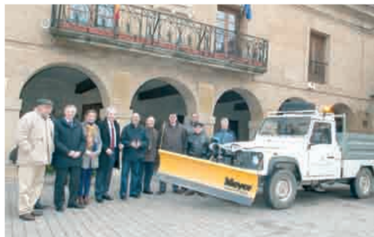
Entrega del lote al alcalde de San Vicente de la Sonsierra.