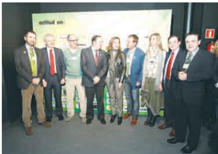
Representantes de la iniciativa junto a autoridades.

El inicio de esta corriente de optimismo, "un mensaje de confianza en que cada uno sea capaz de romper un eslabón de la cadena que nos atenazan e impide mirar al futuro, sin pensar en el pasado,