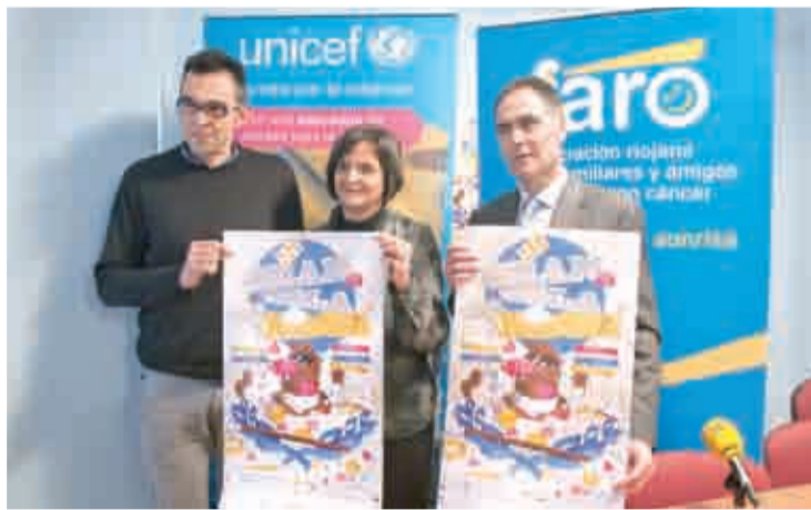
Presentación de la gala de magia.

adquirirse en las librerías Santos Ochoa de Doctores Castroviejo y Gran Vía; en las sedes de las asociaciones beneficiarias -FARO en San Antón 6 2ªA y UNICEF La Rioja en Hermanos Moroy nº 22-1º izda.-; y en el Auditorium una