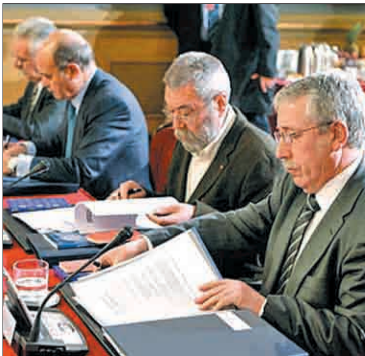
Los agentes sociales durante la firma de la reforma laboral

Los sindicatos critican que se apruebe la reforma si Rajoy "sabe que va a crear más paro", y le acusan de dar "una patada a la negociación colectiva y al diálogo".