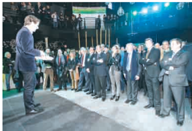
Puesta de largo en la Sala Norma abarrotada de gente.

En una sala abarrotada, 'Actitud on' llenó de energía positiva a todos los presentes.