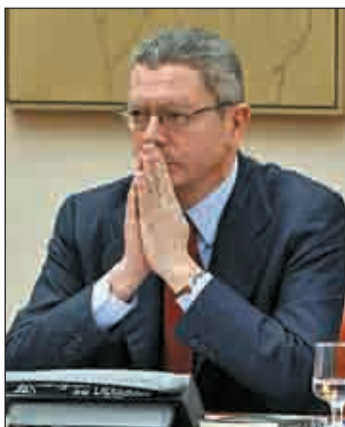
El ministro de Justicia

vo se ha apresurado a desmarcarse de las opiniones que desde su "criterio particular" lanzó el titular de Justicia. Colectivos homosexuales piden al PP que retire el recurso que interpuso en 2005 en el TC, al igual que la oposición. En contra, sectores de la iglesia.