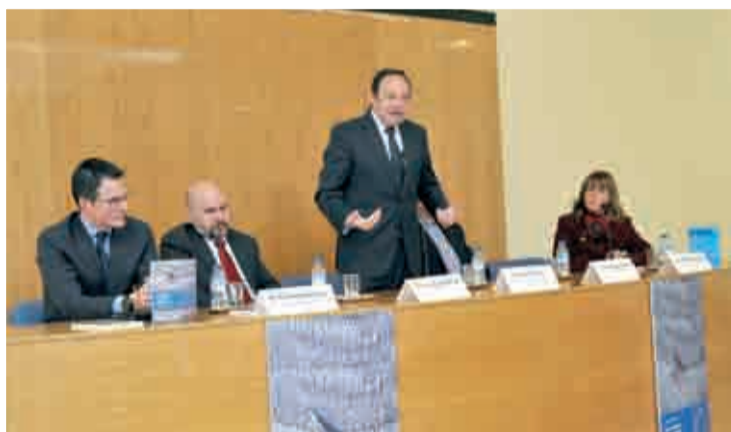
Presentación de la publicación del CERMI.

a cualquier empresa interesada, especialmente las medianas y pequeñas, incorporar la dimensión inclusiva de la discapacidad a lo largo de toda su cadena de valor.