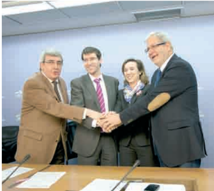
Saludo tras la firma del convenio .

Mediante este acuerdo, el Gobierno de La Rioja, el Ayuntamiento de Logroño, la FEHR y la FEPET se comprometen a colaborar en el