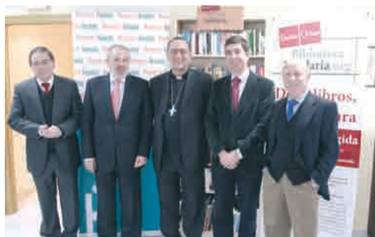
La Biblioteca Solidaria ya se encuentra en Proyecto Hombre.

Las personas o entidades que quieran donar libros que se encuentren en buen estado pueden hacerlo en los puntos de recogida de las librerías Santos Ochoa (Logroño, Bilbao, Barcelona, Huesca, Soria, Torreveja y Tudela).