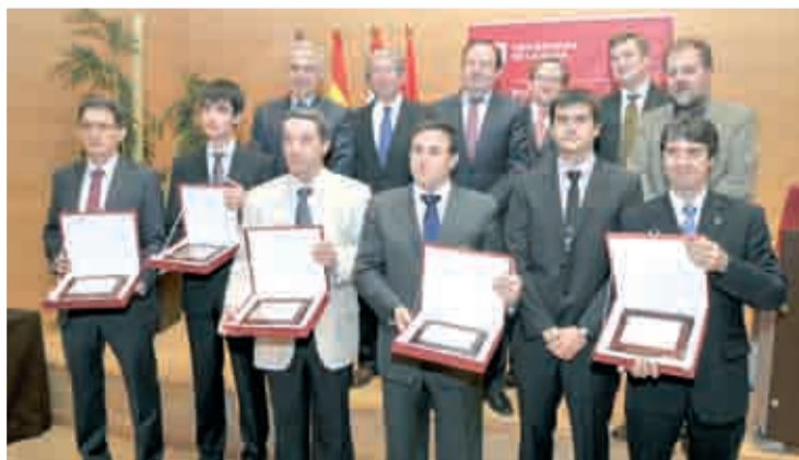
Foto de familia con los premiados.

El premio a la transferencia del conocimiento, se ha concedido al Grupo de Modelado, Simulación y Optimización de Sistemas Industriales Eléctricos y de Fabricación Automatizada.