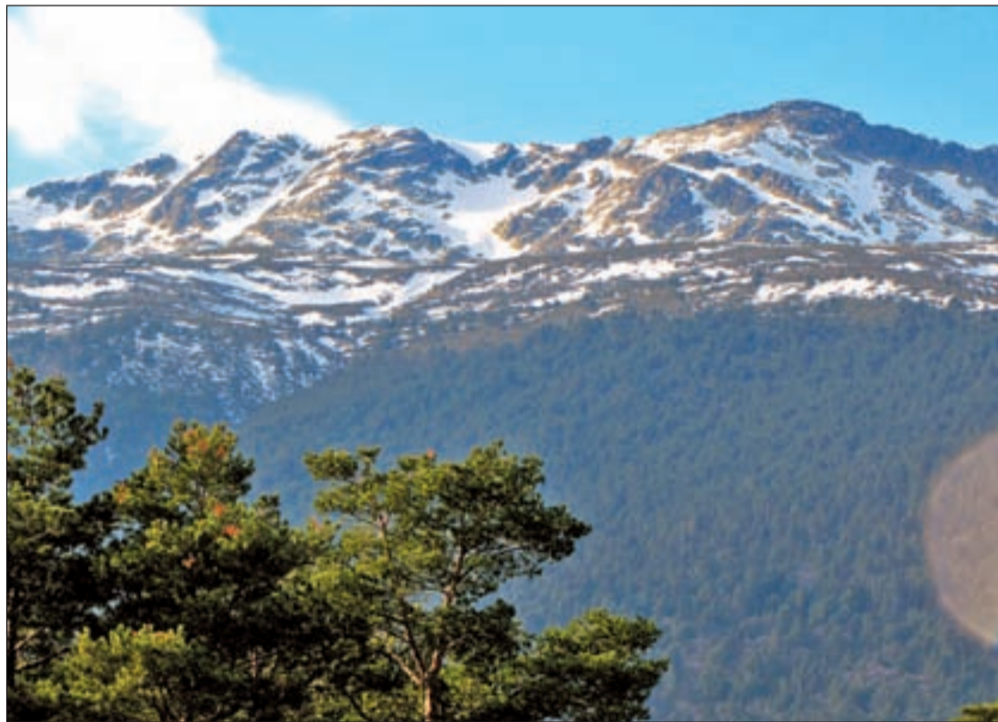
El sol brilla con fuerza en esta zona de España

El valle nos ofrece actividades de todo tipo para el invierno, podemos visitar el monasterio del Pualar y el pueblo de Rascafría, ascender a alguno de los magníficos miradores de las montañas como son los puertos de Canencia, Morcuera, Navafría o el monumento al Guarda forestal, in-