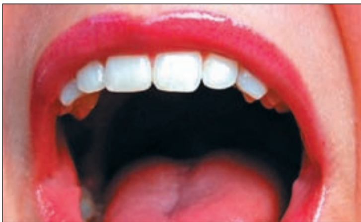
Una boca sana es atractiva estéticamente

El Doctor nos explica que la limpieza y el blanqueamiento son cosas totalmente distintas. El blanqueamiento dental que mas se usa hoy en día se lleva a cabo en clínica y, posteriormente en casa. En primer lugar, los dientes se blanquean en el centro gracias a un compuesto de peróxido de hidrógeno al 38% o 40%. Después el paciente trata su dentadura en casa gracias a unos moldes impregnados con esta sustancia que debe llevar