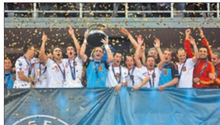
La selección española volvió a triunfar en Croacia

la rueda de prensa en la que se confirmaba la noticia, Mengual aseguraba que “me pondré nerviosa al verla. Pensaré, podría haber estado aquí, pero bueno. Se me hará extraño ver una Olimpiada desde fuera, si puedo ir también será raro verla desde la grada”. Respecto a su futuro, la nadadora confirma que “todavía no hemos hablado de esto, pero tampoco lo descarto. A la larga seguro que sí. Este deporte me ha dado más de lo que esperaba”.