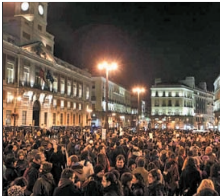
LA CALLE CONTRA LA REFORMA Pocas horas después de aprobarse la reforma laboral centenares de ciudadanos tomaron la calle para protestar contra el texto. Para el domingo hay convocadas 57 manifestaciones en toda España

La opinión del Gobierno también se ha bifurcado. Por un lado, tanto el ministro de Economía como el mismo presidente han negado el carácter milagroso de la reforma, alegando que "no producirá efectos a corto plazo" en la creación de empleo. Mientras la voz optimista del PP era entonada por la número dos del partido, Dolores de Cospedal, que ha adelantado que se pueden crear en España "entre 300.000 y 400.000 empleos". Unánimes han sido las críticas de la