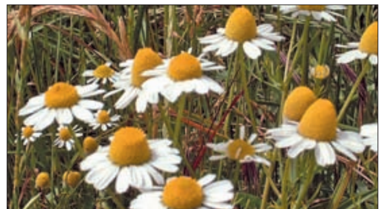
Flor de la Camomila o Manzanilla (Chamaemelum nobile)

Está claro que la Manzanilla no es la panacea, o al menos no es un tinte químico, y no puede volver a una morena rubia de repente. Sin embargo, sí aclara el cabello de una forma real y duradera sobre una base rubia.