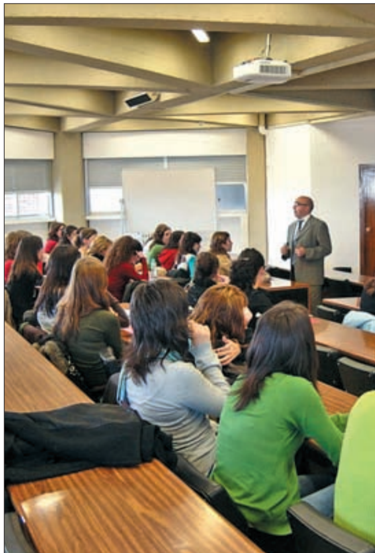
Alumnos en un aula universitaria