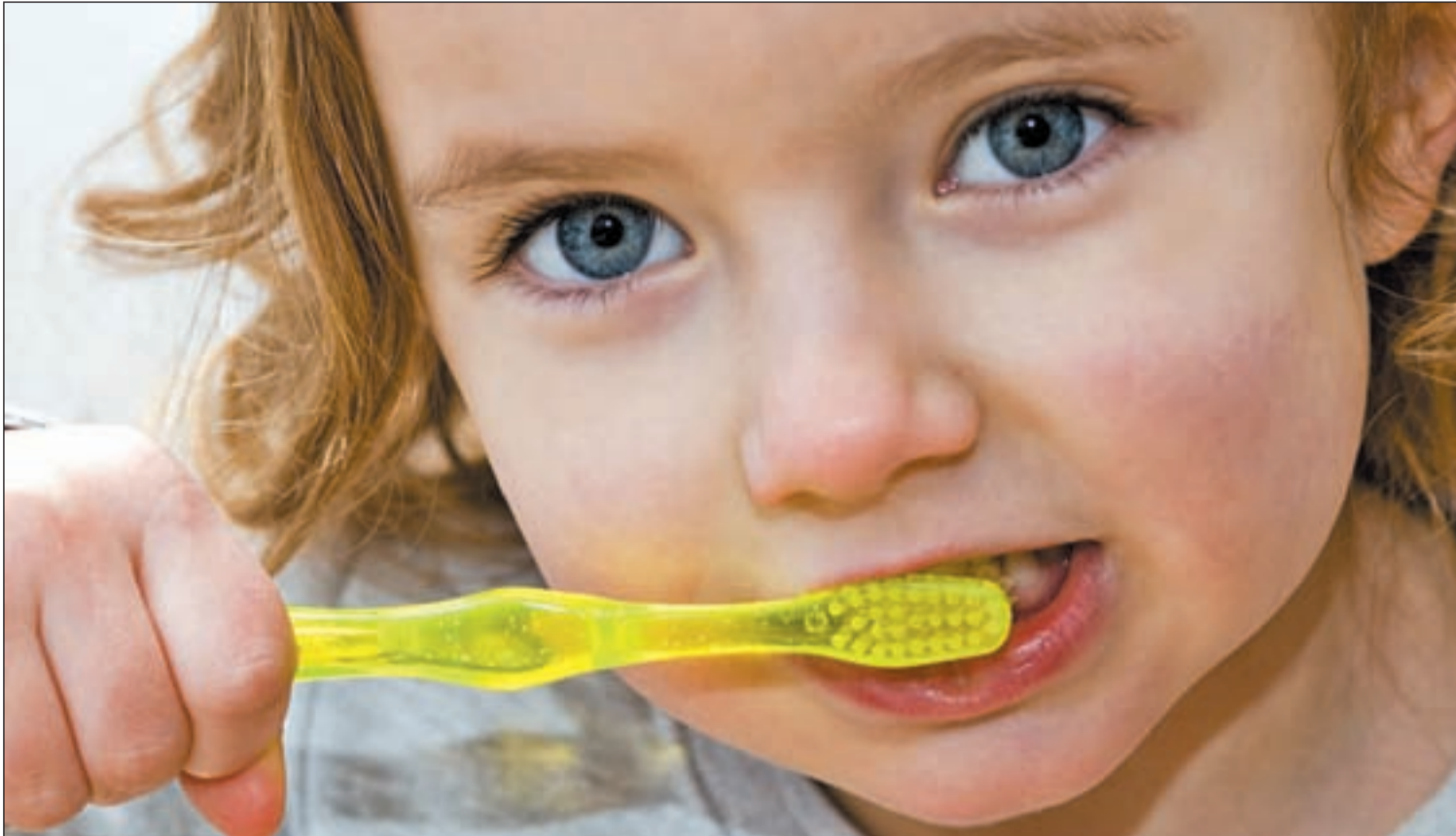
Cepillarse los dientes es un hábito saludable