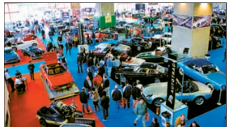
El evento congregará a los seguidores de estos vehículos

co en Europa. El número de expositores participantes se mantiene en los mismos parámetros que el pasado año y en esta ocasión también se ha logrado la plena ocupación de la superficie expositiva. La organización ha colgado el cartel de completo en sus 30.000 metros cuadrados, tanto interiores como exteriores.