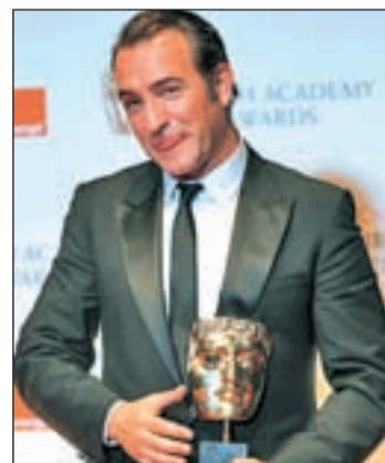
Jean Dujardin recibió un premio

En cuanto a la Mejor Actriz Protagonista, el premio ha sido para Meryl Streep por su interpretación de Margaret Thatcher en 'La Dama de Hierro'. Streep ha protagonizado el incidente de la gala al perder uno de sus zapatos cuando se dirigía a recoger