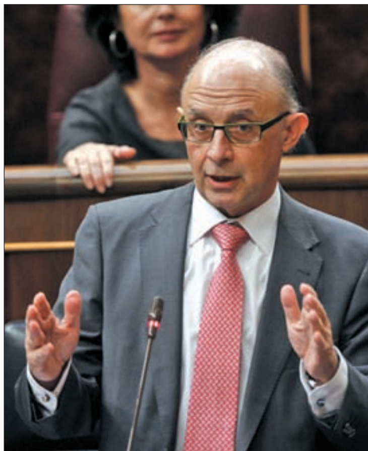
El ministro de Hacienda, Cristóbal Montoro

La presión comunitaria para que se publiquen los Presupuestos se enmarca en un contexto donde se han disparado las dudas sobre si el Gobierno de Rajoy ha falseado el déficit cara a Bruselas para aprovechar el desfase y mejorar posteriormente los resulta-