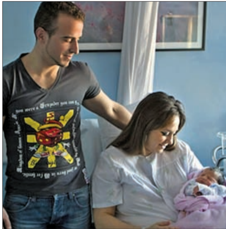
EL DGP (Diagnóstico Genético Preimplantatorio) es un procedimiento que consiste en realizar un análisis genético a embriones obtenidos por fecundación in vitro para transferir al útero aquellos libres de la enfermedad.

Según los especialistas, la probabilidad de éxito para su hermano Antonio ronda un porcentaje de éxito del 70 por cien-