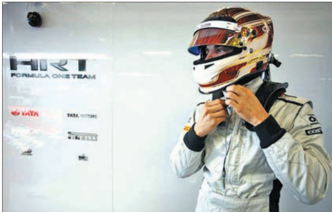
El piloto de 23 años ya estará presente en los entrenamientos de Montmeló

FÓRMULA 1 SERÁ EL PILOTO DE PRUEBAS DE LA ESCUDERÍA