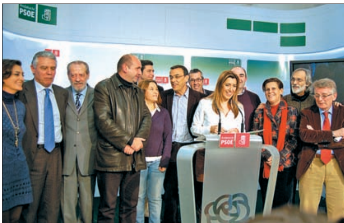
Caras del PSOE andaluz tras el cierre de sus listas electorales

En relación a los comicios celebrados hace cuatro años sólo re-