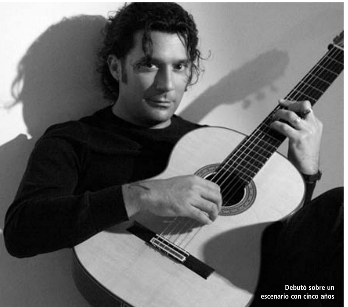
Debutó sobre un escenario con cinco años

«El hecho de tocar hace que me sienta vivo»