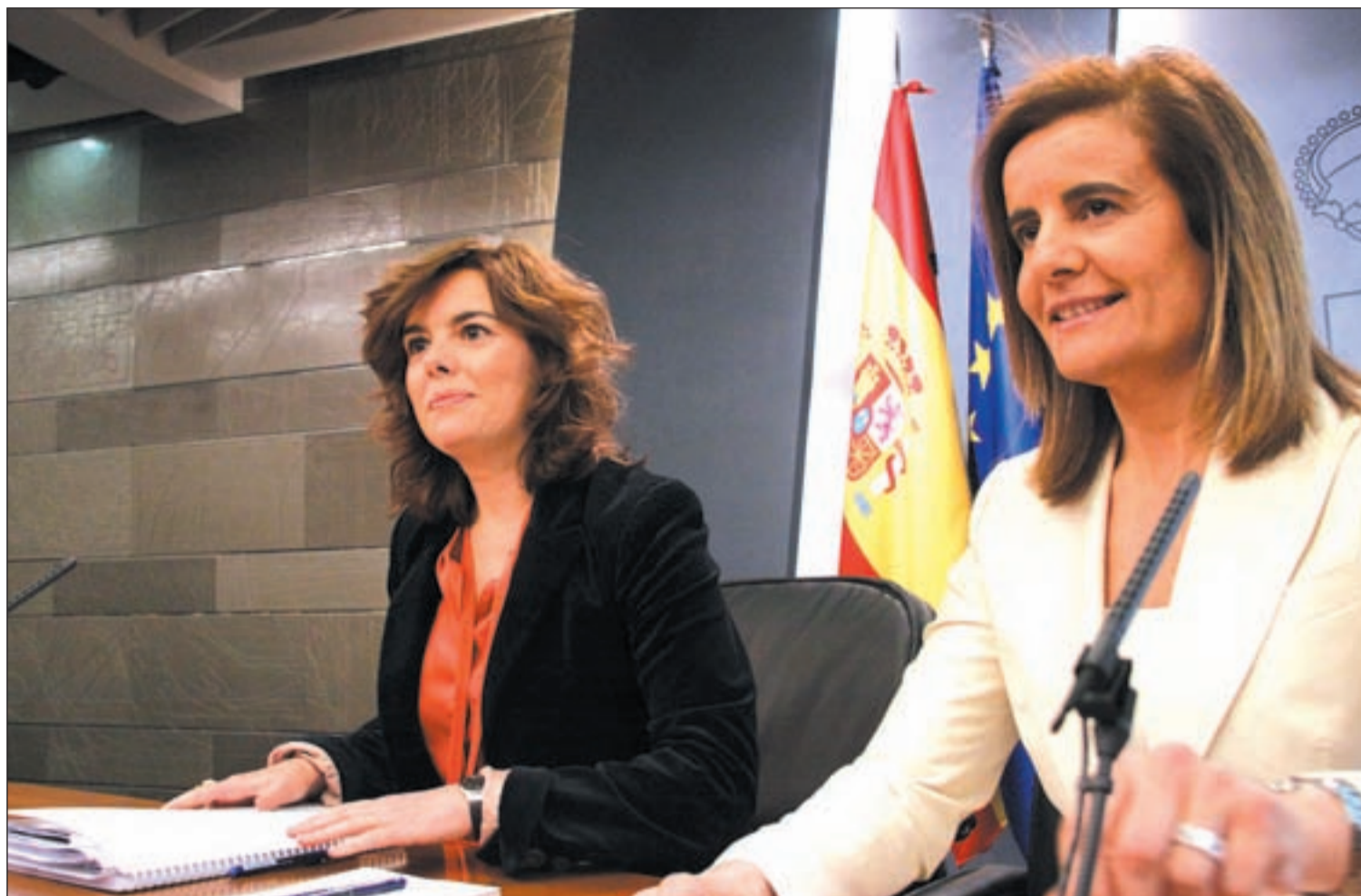
La ministra de Empleo, Fátima Báñez, junto a la vicepresidenta del Gobierno, Soraya Sáenz de Santamaría, presentando la reforma