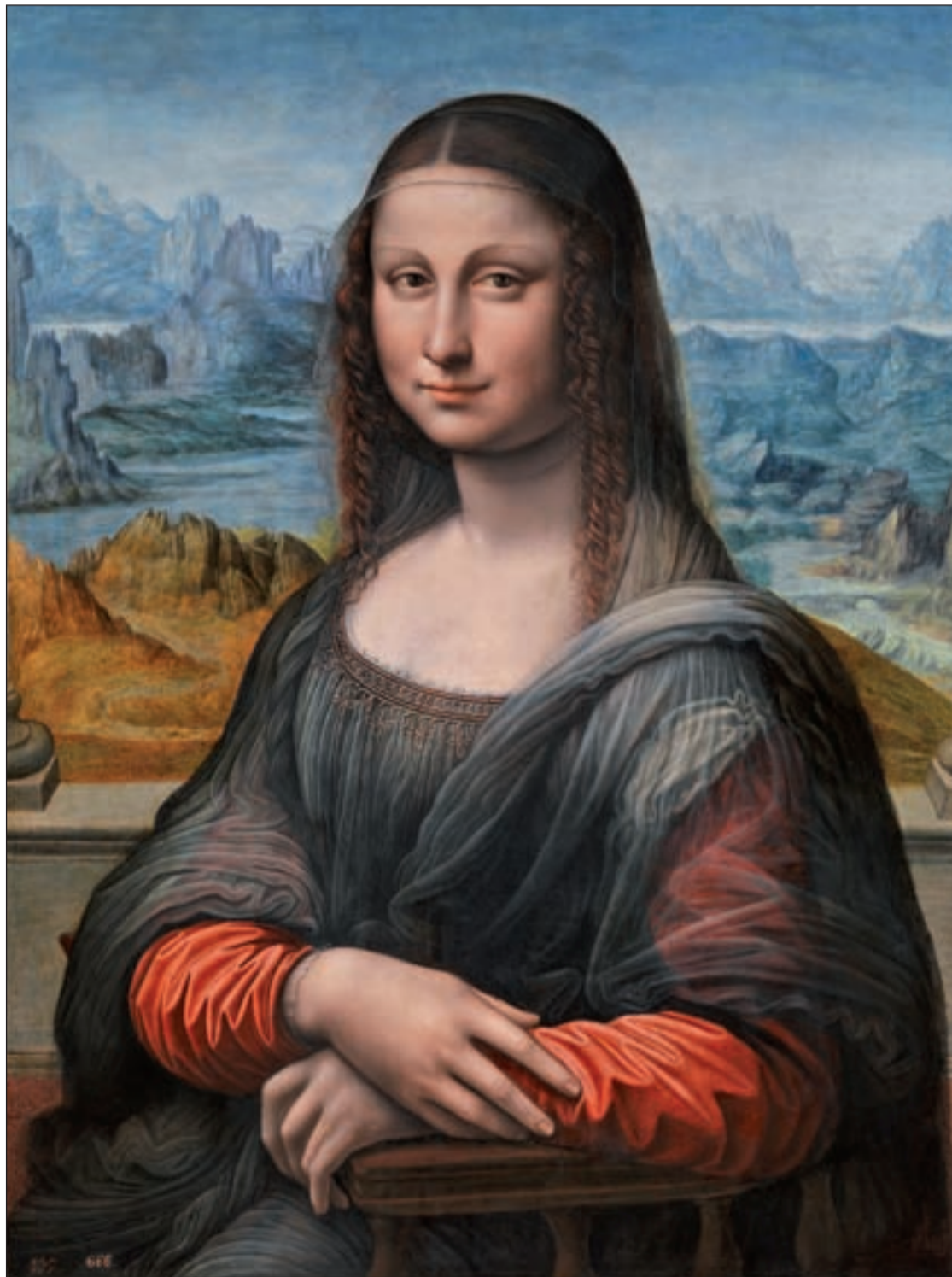
La copia de 'La Gioconda' está ubicada en la sala número 49 del museo madrileño

La diferente factura, las cejas (La Mona Lisa del Prado tiene, pero la de Da Vinci no) y la ausencia de paisaje impedían, según fuentes del museo, la hipótesis finalmente confirmada debido a una casualidad. Se consideraba una versión, diferenciada por el fondo negro, una menor calidad y la falta del clásico 'sfumato' que ofrecía Leonardo en sus pinturas. Sin embargo, debido a la muestra prevista en el centro museístico parisino -'La última obra de Leonardo da Vinci. La Santa Ana'- se llevó a cabo un minucioso estudio técnico (comenzó hace dos años) capaz de descubrir un paisaje tras el color negro, certera pista para concluir que la obra se realizó en el mismo taller de Da Vinci. Con casi total seguridad, fue, sino la primera, unas de las primeras copias en salir del mismo. Todo por culpa de las reflectografías y las radiografías oportunas que determinaron esta averiguación. "Durante mucho tiempo se pensó que era una obra hecha en Italia, teniendo en cuenta que el