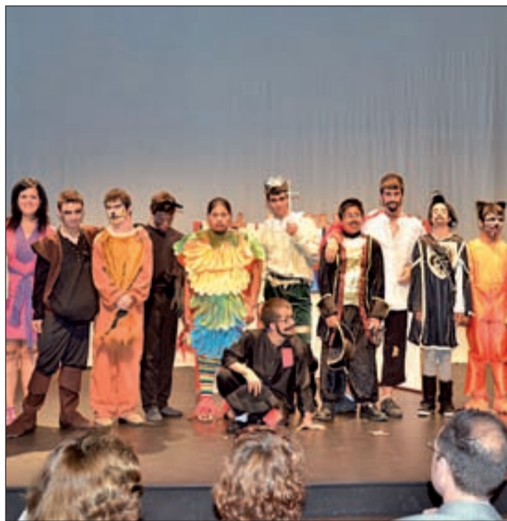
Cita teatral de dos centros de personas con discapacidad intelectual

La segunda línea ofrece tres Escuelas de Familias con necesidades especiales: Padres y madres, abuelos y hermanos. También incluye el Proyecto Respiro/Descanso familiar y ocio, adaptado para personas con discapacidad gravemente afectadas. La tercera, la de Ocio, cultura y deporte, supone la creación