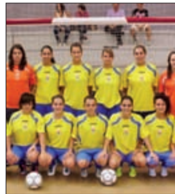
Plantilla del Ciudad