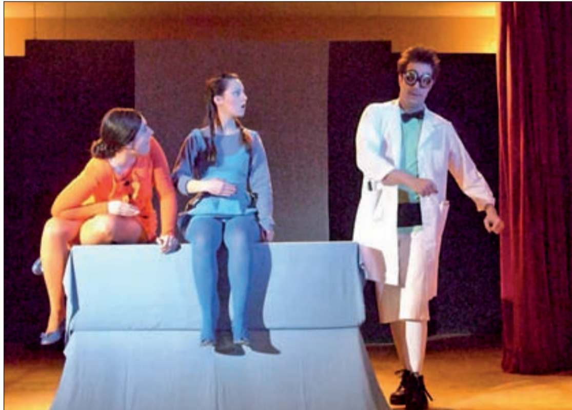
Una escena de 'La muñeca vestida de azul'

Otra propuesta infantil para este fin de semana es 'Los Ratonau-