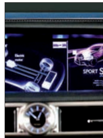
Pantalla del Lexus GS 450h

Esta nueva pantalla tiene un tamaño y una resolución superior a la de un iPad2 colocado en horizontal. En definitiva, gracias a esta tecnología sus usuarios podrán disfrutar de gráficos e imágenes en alta resolución más realistas que las mostradas en las actuales pantallas de navegación. Además la pantalla del nuevo Lexus GS 450h es lo suficientemente amplia como para mostrar menús y submenús (de forma conjunta y dividida) disminuyendo notablemente el tiempo que el conductor deja de observar la circulación y aumentando, por tanto, la seguridad.