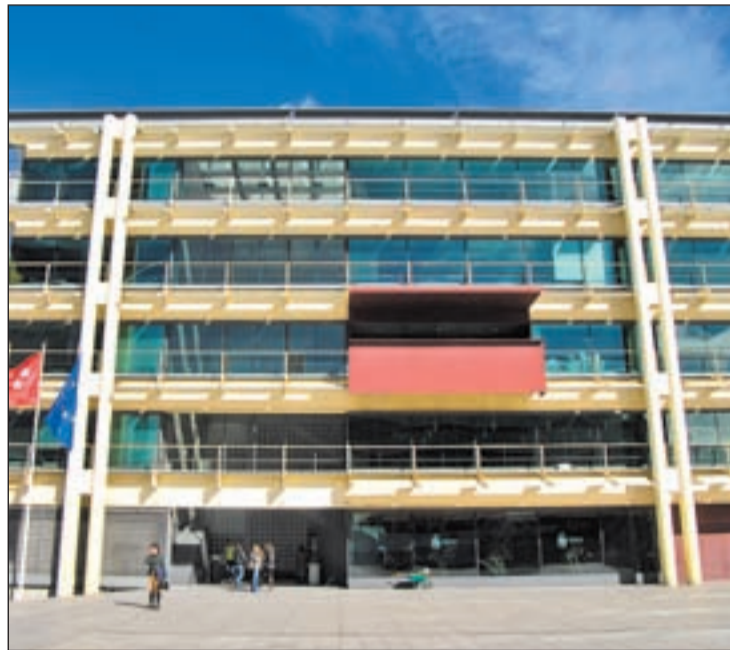
El Ayuntamiento de Fuenlabrada

Asimismo, la oficina de la energía y la sostenibilidad llevará a cabo acciones encaminadas