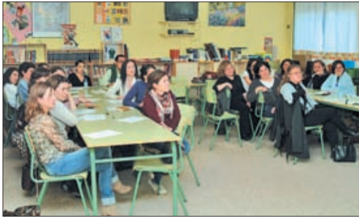
Padres y madres durante una charla informativa

PARA FOMENTAR EL AHORRO Y EL DESARROLLO SOSTENIBLE