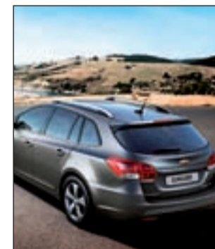
Chevrolet Cruze Station

El programa incluye la celebración de veinte concentraciones de clubes, un concurso de elegancia de Jaguar, la presentación del libro de Valadés 'Paco Abadal. Biografía de un sportsman' y la presentación de la prueba Centenario del Concurso de Automóviles del Guadarrama.