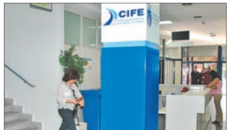
Imagen del interior del Centro para la Formación y el Empleo

Gracias al convenio, los alumnos realizarán prácticas no laborales en especialidades relacionadas con la actividad del Hospital, y recibirán asesoramiento y formación en materia de igualdad de oportunidades.