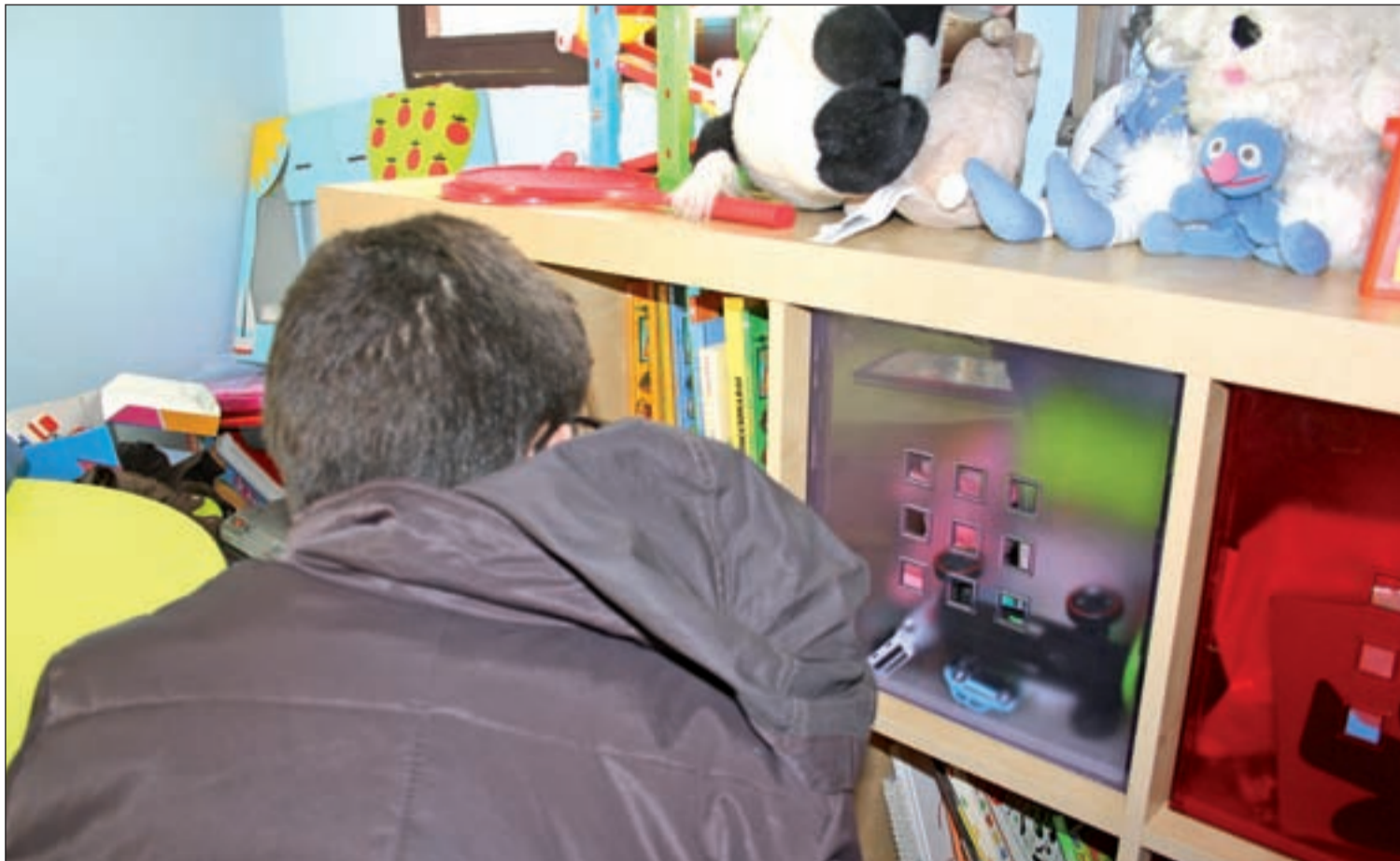
El Síndrome de Asperger es uno de los más difíciles de detectar