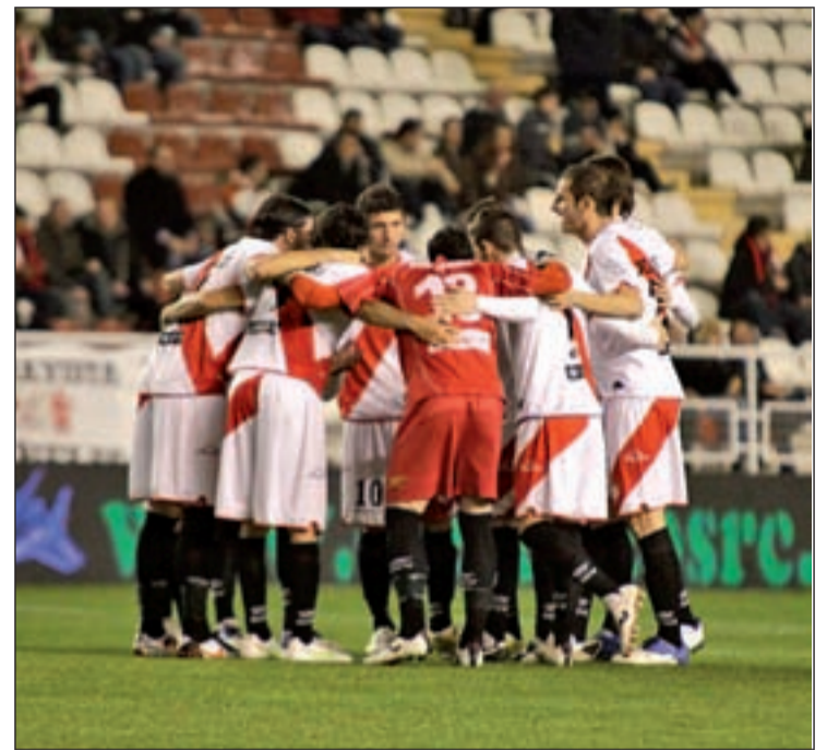
El Rayo llega a este partido en un buen momento

Pero lejos de lo que cabría pensar y de aquel lejano precedente de la campaña 2002-2003, al Real Madrid no le esperará un partido plácido en Vallecas. El Rayo sigue demostrando que a pesar de ser un recién ascendido puede desplegar un buen juego, tal y como quedó patente en su encuentro de la semana pasada en el estadio del Levante. Nada menos que cinco tantos anotaron los hombres de Sandoval, a quienes les han venido realmen-