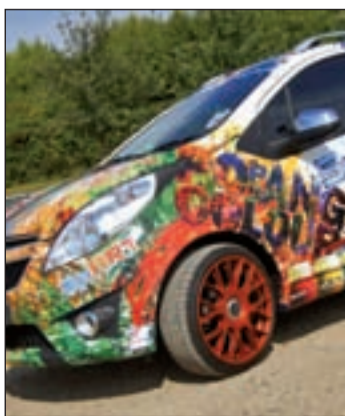
El Spark, una 'galería' de arte móvil