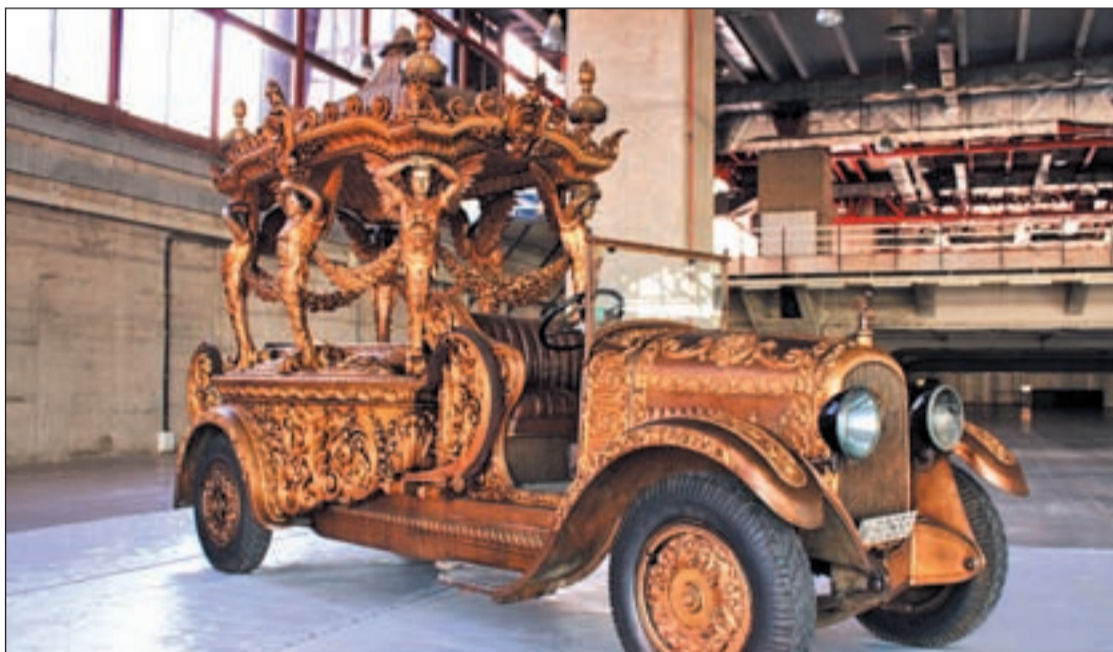
Uno de los coches fúnebres restaurado por la facultad de Bellas Artes (UCM) y expuesto en ClassicAuto Madrid 2012

Las motocicletas protagonizarán otra de las exposiciones más destacadas en una muestra de prototipos fabricados en España con descabelladas propuestas en su diseño y mecánica. Ade-