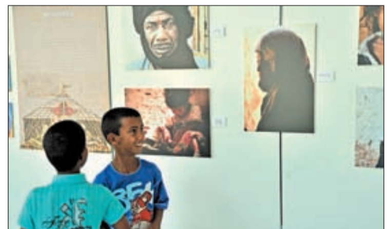
Niños saharauís en una exposición OLMO GONZÁLEZ /GENTE

Además, el pasado mes de diciembre, el Pleno municipal aprobó por unanimidad de los cuatro grupos con representación municipal -PSOE, PP, IU y UPyD-, una moción en la que se denunciaba la situación de privación de libertad y de derechos civiles y políticos que sufre el pueblo saharauí, ocupado de manera ilegal por Marruecos-