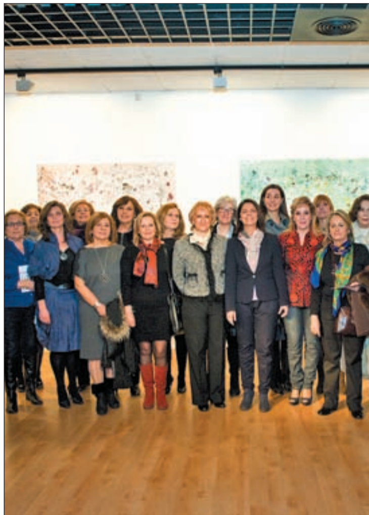
La alcaldesa junto a las artistas que exponen en el Espacio Cultural Mira

El 13 de marzo, a las 19.30 horas, la Sala "La Capilla" del Ayuntamiento de Pozuelo acogerá la conferencia "Las mujeres de