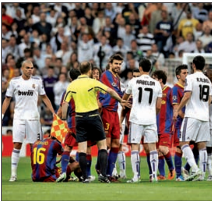
La crispación vuelve a hacerse notar en la Liga

de los colegiados en los partidos del Real Madrid y del Barcelona. Este escenario no es novedoso respecto a temporadas anteriores, aunque sí hay un elemento diferenciador en relación a campañas pasadas. El concepto del 'Villarato', acuñado para definir una supuesta conspiración arbitral favorable al Barcelona, ha sido rescatado en la Ciudad Condal para denunciar un presunto trato de favor del estamento que preside Victoriano Sánchez Ar-