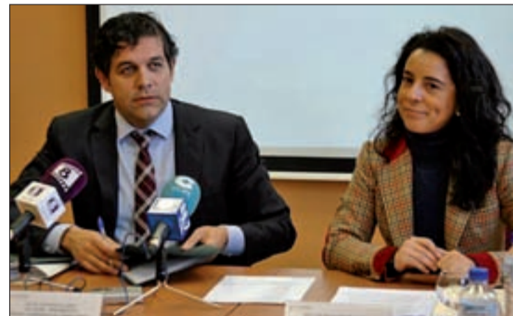
El alcalde y la directora general de Juventud durante la presentación

En Collado ya se han tramitado más de 3.000 carnés y en la Comunidad de Madrid 400.000.