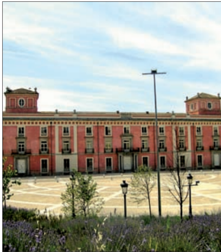
Imagen de la fachada exterior del Palacio Infante Don Luis de Boadilla

Gracias a esta firma, por valor de 4 millones de euros se restaurarán las fachadas del Palacio, una de las partes más dañadas del edificio. El proyecto lo dirigirá José Ramón Duralde, arquitecto experto en reformas de patrimonio artístico y supondrá 400.000 euros. Más adelante, se trabajará para recuperar el estado de la entrada, por un valor de 70.000 euros y para eliminar las grietas