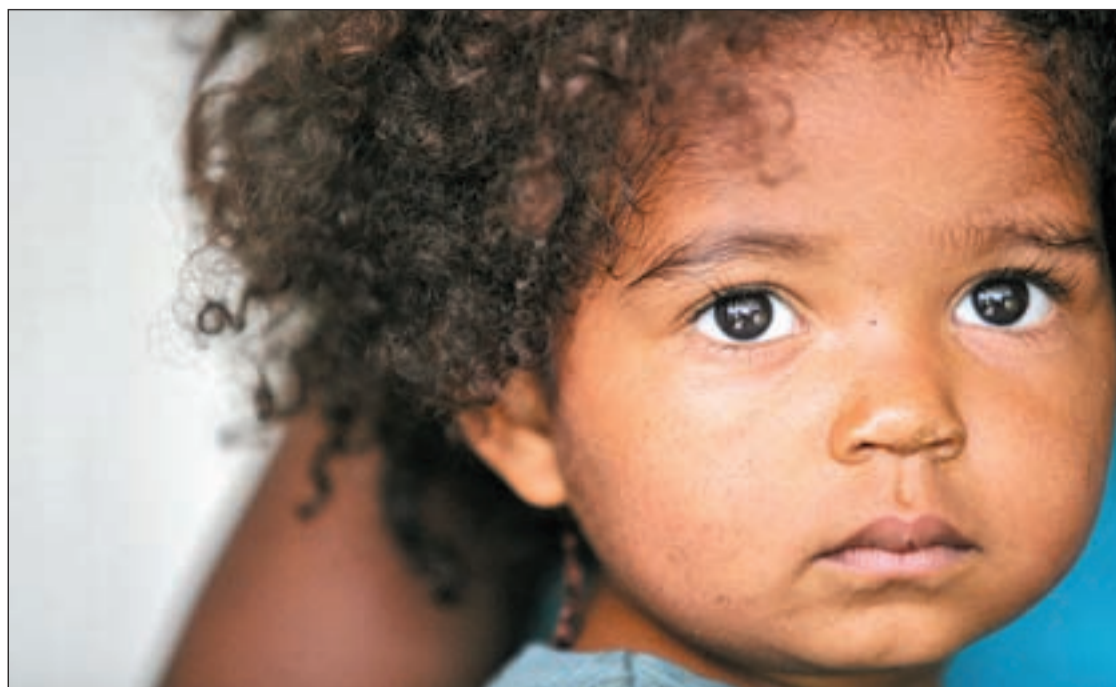
Esta organización sin ánimo de lucro trabaja con los países en vías de desarrollo realizando varios proyectos

Steven Soderbergh también ofrece la máxima intriga en 'Indomable', un guión sobre espionajes, persecuciones y venganzas. Además, Angelina Jolie debuta como realizadora con 'En tierra de sangre y miel', una historia de amor y lealtad en la guerra de los Balcanes.