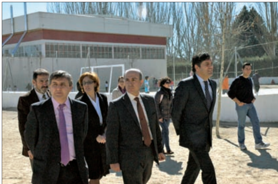
El viceconsejero de Empleo de la Comunidad de Madrid y el alcalde de Collado Villalba visitando las obras