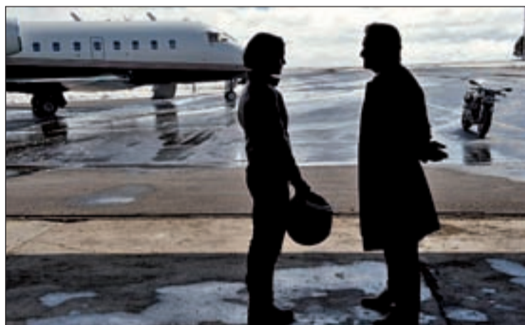
Una escena de 'Indomable', la nueva cinta de Soderbergh

El Grupo de Información GENTE edita periódicos gratuitos de gran tirada y de periodicidad semanal, que prestan especial atención a los contenidos locales. Estamos en Madrid, Barcelona, Valencia, Sevilla, Bilbao, Burgos, Zaragoza, Málaga, Santander, León, Logroño, Murcia, Vitoria, La Coruña, Toledo, Pamplona, Valladolid, Oviedo, Gijón, Vigo, Badajoz, Alicante, Palencia, Segovia, Ávila y Avilés.