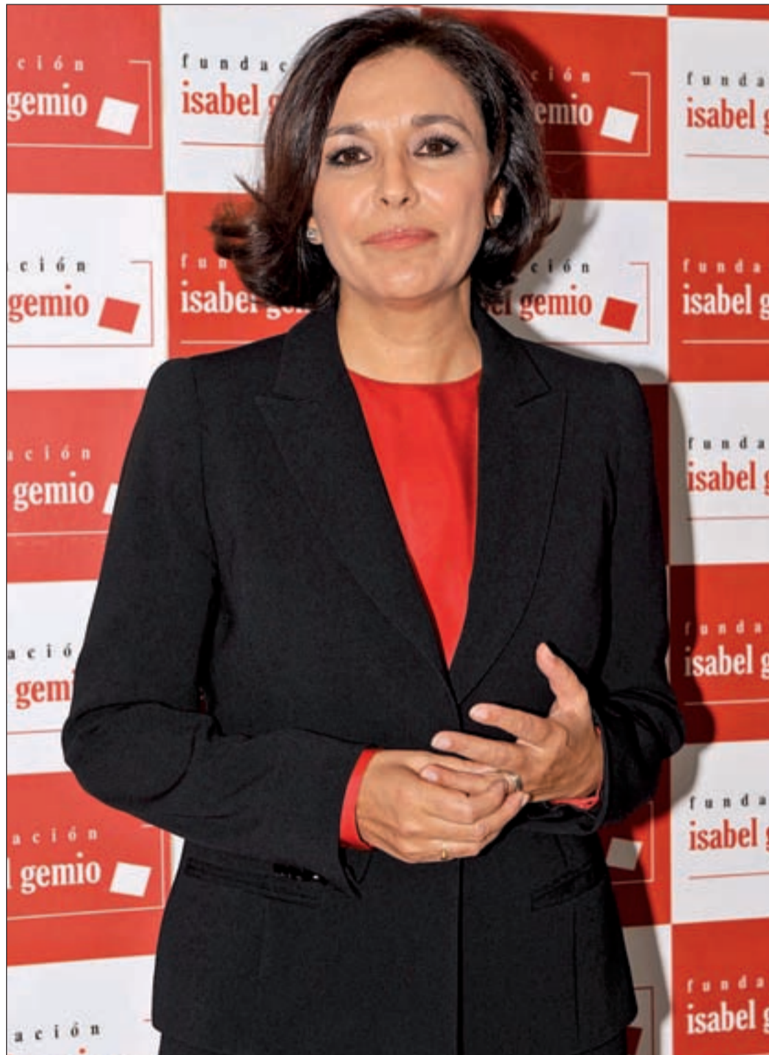
Gemio está luchando por dar visibilidad a una problemática sumamente compleja

Es la más grave de todas las distrofias musculares, aunque hay bastantes, entre 50 y 60. Las musculares son las mayoritarias, de las que más enfermos hay dentro de todas las raras e incide sobre todo en los niños. Se sabe muy pronto por síntomas como el retraso a la hora de andar, en el movimiento, la pérdida de fuerza, las caídas... A veces tardan mucho en hacer el diagnós-