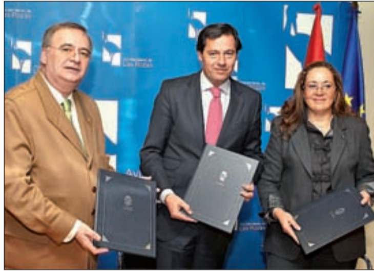
El alcalde de las Rozas en un momento de la presentación

Según el alcalde, "estos sistemas electrónicos de seguridad son una herramienta útil para la identificación de posibles auto-