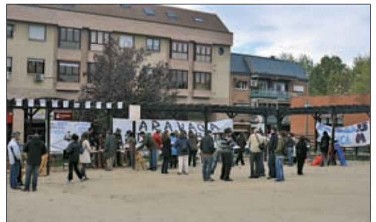
La asociación de vecinos de Aravaca durante una de las concentraciones

Según los vecinos de Aravaca, la distancia que tienen que recorrer los alumnos del barrio para llegar a estos centros llega en algunas ocasiones a 12 kilómetros, "y el transporte en la zona es muy deficiente y privado, por lo que supone un gran esfuerzo económico y de movilidad para padres y alumnos".