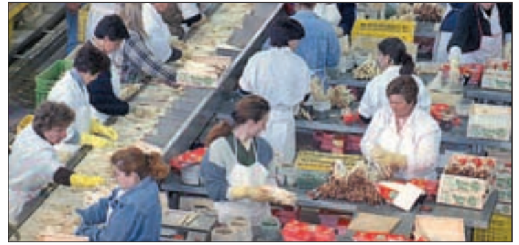
Las mujeres cobran menos por los mismos puestos que los hombres

Según Comisiones Obreras, estas diferencias salariales "tienen edad" porque entre los dieciocho y los veinticinco años es de 1.354 euros al año, de 36 a 45 años de 8.185 y entre los 56 y los 65 la cantidad asciende hasta los 12.000 euros, llegando la diferencia hasta los 20.699 euros en más de 65 años.