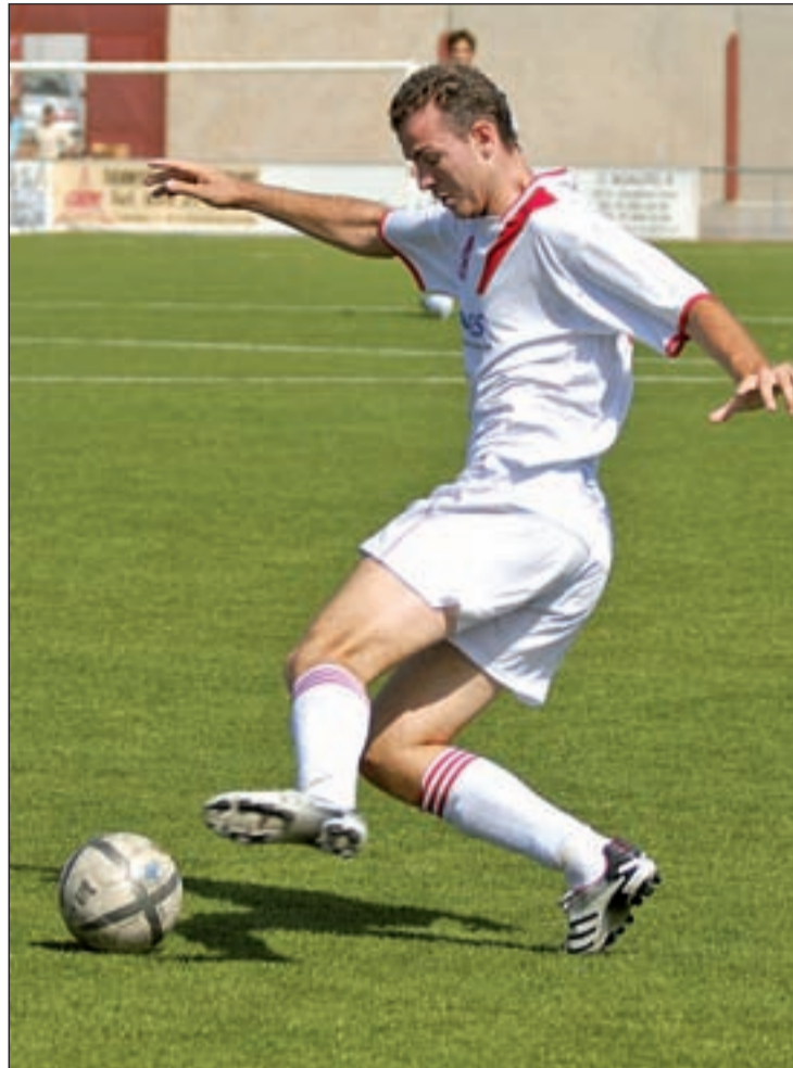
El Colmenar ya es séptimo en la clasificación