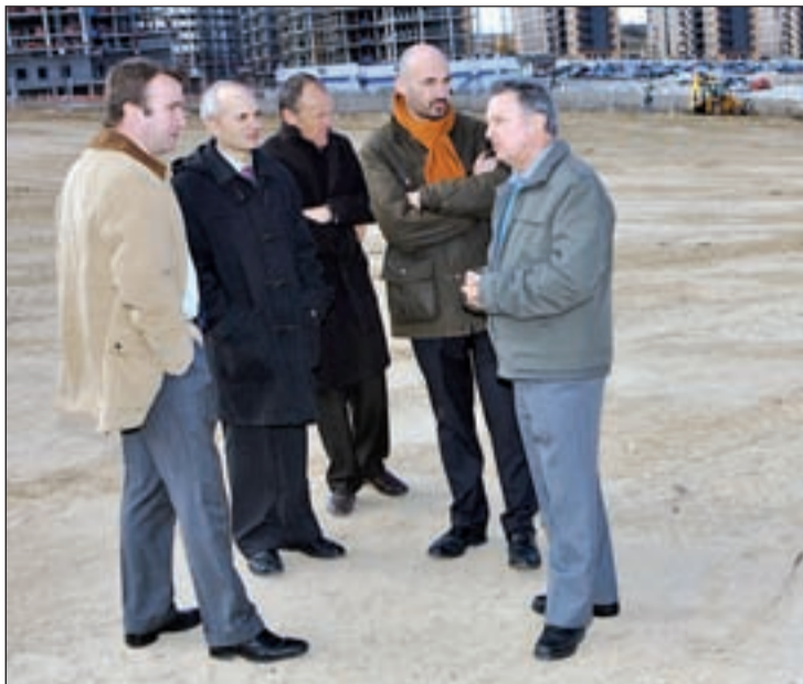
El nuevo desarrollo de Tres Cantos sigue creciendo con más viviendas