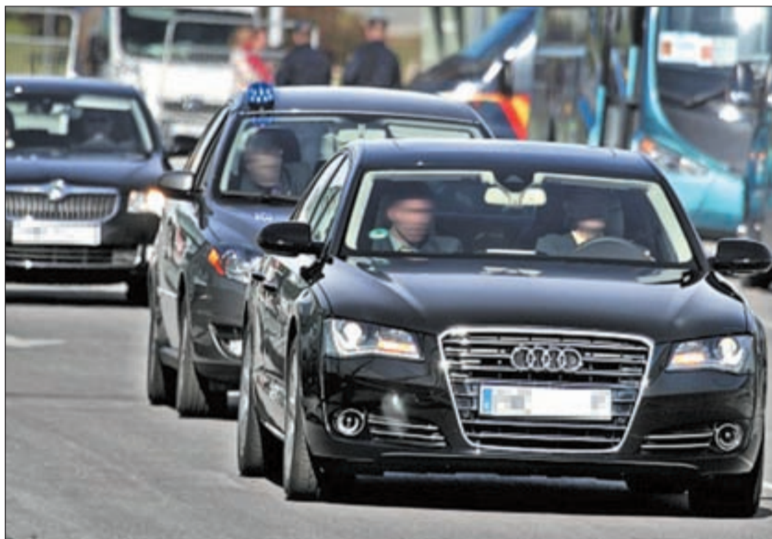
Unas de las principales medidas de Esperanza Aguirre fue reducir los coches oficiales

Ante esta situación, Aguirre ha anunciado que habrá que hacer nuevos ajustes, aunque se ha comprometido a "no subir los impuestos, sino bajarlos". Eso sí, las tasas y precios públicos sí podrán aumentar. "Estos datos son