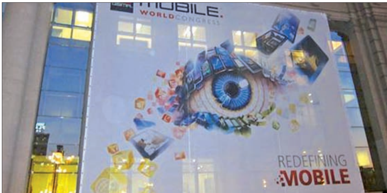
Telefónica y Samsung traen la primera red LTE, que permite alcanzar velocidades de hasta 100 megas