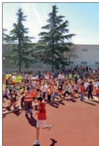
La prueba sigue creciendo

Este campeonato, cuyo objetivo es promocionar el atletismo entre los escolares del municipio, es una de las citas deportivas que el Servicio Municipal de Deportes organiza con más ilusión, tanto por la gran participación de atletas, muchos de ellos de