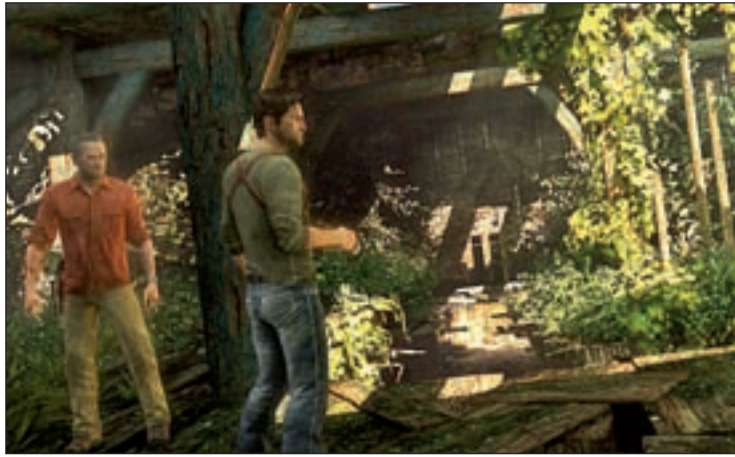
Uncharted 3, 'La traición de Drake'