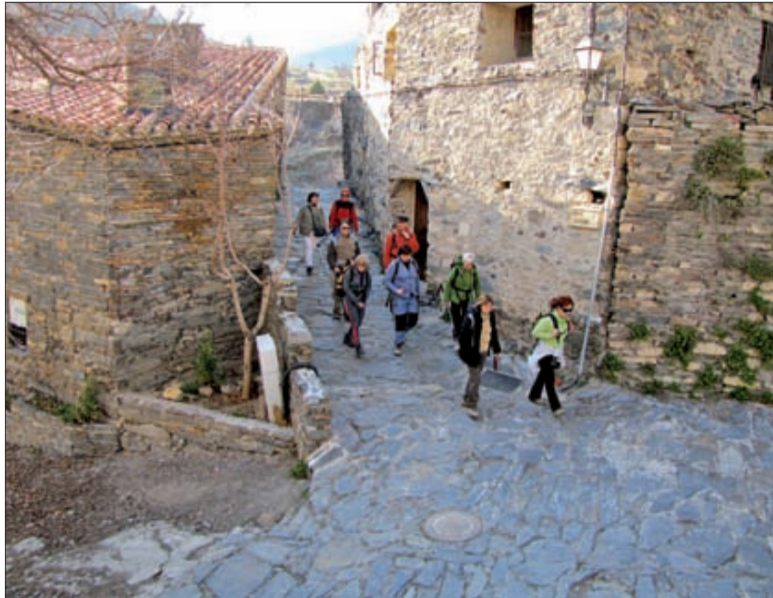
El senderismo es una de las actividades más idóneas para conocer este lugar

Sus gentes vivieron de la caza, la recolección y el cultivo de unas pocas huebras de centeno. La fuente, la iglesia, la era, las retorcidas callejuelas empuñadas son una delicia para el visitante que puede parar a tomar algo o comer en alguno de sus mesones y restaurantes. Pero Patones no es el único tesoro