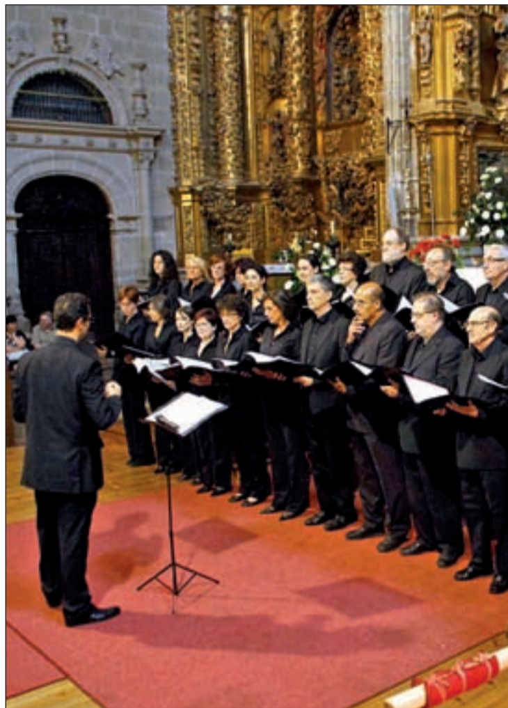
La Schola Gregoriana de Madrid

patrimonio musical español más olvidado y al que el público tiene menos acceso porque casi no se programa. Este concierto brindará una excepcional oportunidad para escuchar una parte de ese magnífico patrimonio sin salir de la localidad y a un precio muy asequible para todos los públicos y vecinos de la localidad”, a los que se anima a asistir a verlo.