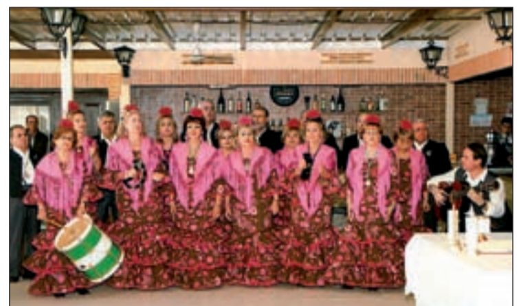
El coro rociero de la Casa de Andalucía de Tres Cantos

El sábado será el turno de las nubes. Así se titula el espectáculo surrealista que se presenta en el Auditorio de la localidad. En él