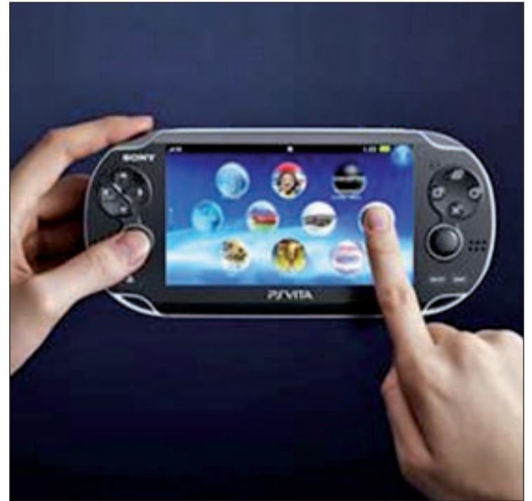
PS Vita mide tan sólo 182 milímetros de ancho

La CPU de esta consola está compuesta por un núcleo ARM CortexTM-A9 de cuatro núcleos, una memoria principal de 512 MB y una VRAM de 128 MB. Dado el tipo de juegos que la consola ejecutará, con gráficos de alta calidad, PS Vita requería un hardware de estas características. Los usuarios que hayan uti-