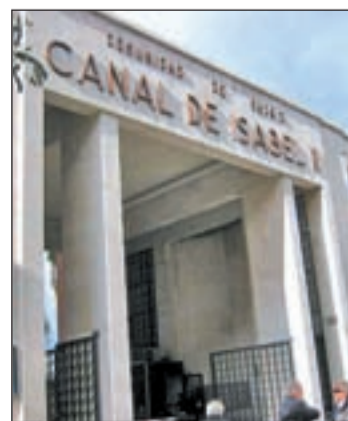
Canal de Isabel II

En este sentido, si bien ha precisado que dicha rentabilidad no es "muy alta", sí que la hay siempre. "Es una rentabilidad muy segura porque todo el mundo consume agua como tienen que consumir luz o gas", ha subrayado.