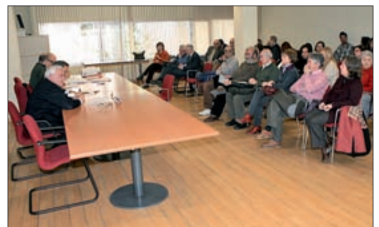
La firma de las ayudas tuvo lugar la semana pasada