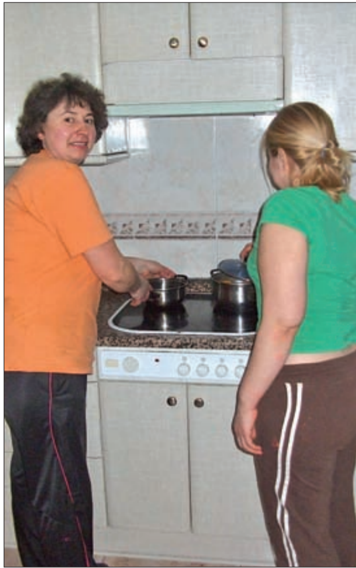
María a la derecha de verde con una amiga cocinando

En lo que quizá no haya avanzado mucho la población y no