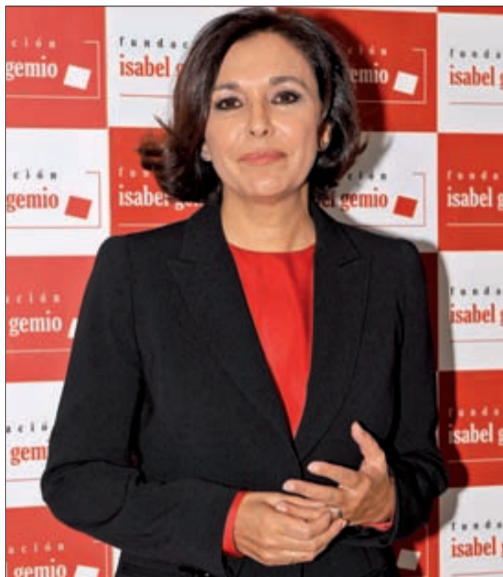
Gemio está luchando por dar visibilidad a esta problemática

Es la más grave de todas las distrofias musculares, aunque hay