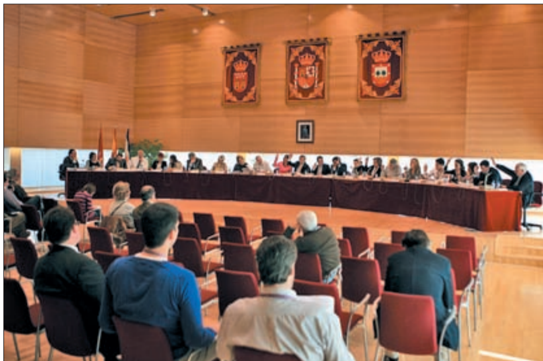
El pleno aprobó llegar a un acuerdo para evitar el pago de casi 60 millones por El Tagarral

Sin embargo, la oposición no estuvo de acuerdo. El portavoz