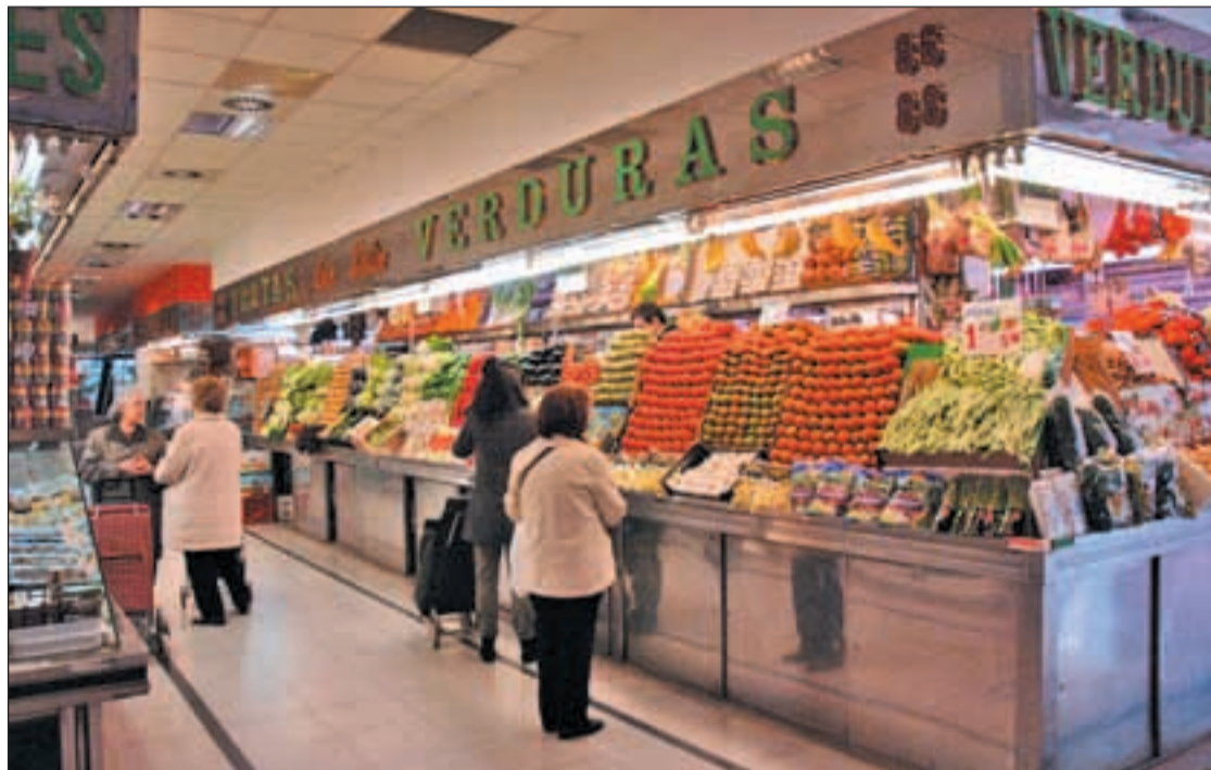
Había poco movimiento el pasado martes por la mañana en el mercado de Tetuán

Su pensamiento es bastante común entre los comerciantes de la zona norte de la ciudad, angustiados por las grandes superficies y una ‘comodidad’ ciudadana que prima el producto más barato en lugar de uno similar o