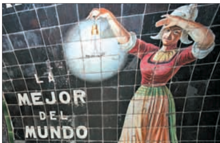
Una de las paredes de la antigua estación

Este museo nació para recuperar la historia del suburbano y mostrar a todos los visitantes la importancia del transporte como motor de la economía y el cambio social en la Comunidad de Madrid. El consejero de Transportes e Infraestructuras,