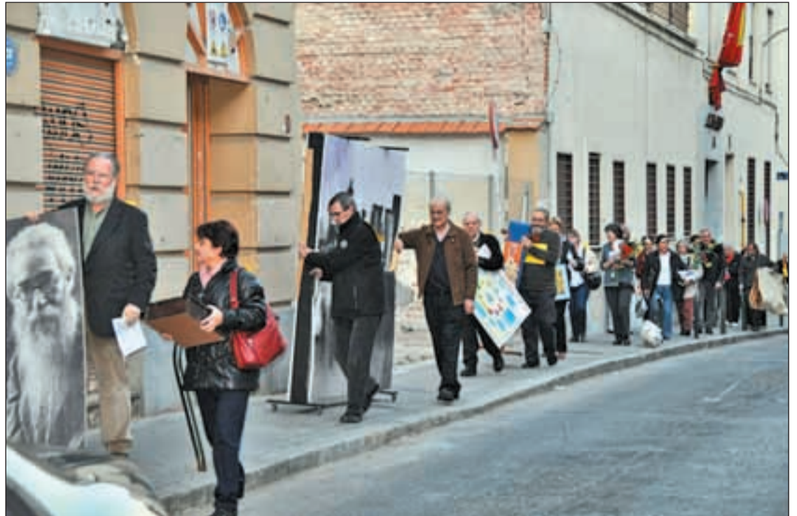
Cerca de 100 vecinos mostraron su disconformidad con la decisión regional mediante una cadena humana