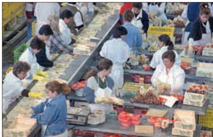
Las mujeres cobran menos por los mismos puestos que los hombres

En concreto, los varones perciben 16.656 millones de euros más que las mujeres por trabajos de igual valor, según el sindicato, lo que, según los datos del ejercicio tributario 2010, significa que las mujeres cobraron 7.952 euros