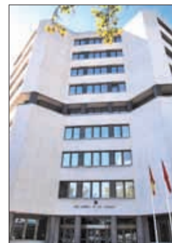
Juzgados de Plaza de Castilla

La Ciudad de la Justicia ya no costará 500 millones de euros ni sus edificios tendrán arquitectos de renombre como planteaba el