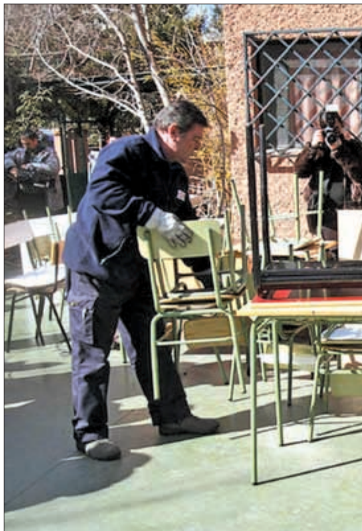
El desalojo provocó un gran revuelo mediático

Las aguas han vuelto a su cauce, aunque los padres no descartan emprender acciones jurídicas contra la Tesorería General de la Seguridad Social y, sobre todo, contra la persona que tomó la decisión de que se retirase el mobiliario con los niños dentro del centro escolar. La propia presidenta regional Esperanza Aguirre exigió este jueves que se realice una investigación para saber quién autorizó los hechos del