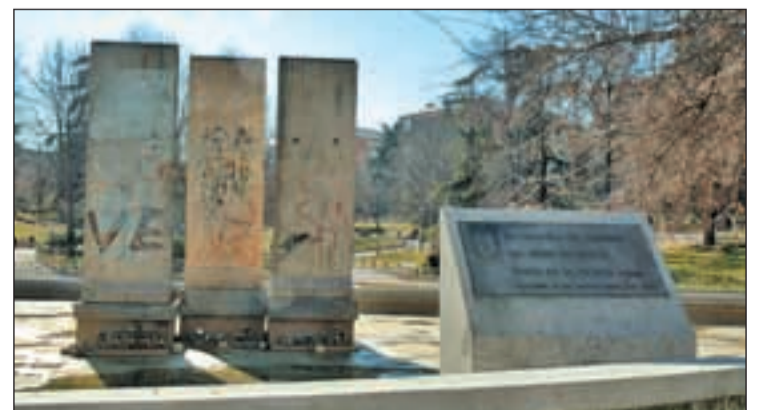
La placa recuerda su inauguración

mento a las dos Alemanias. Este tributo al 'Derribo del Muro de Berlín' forma parte de la placa existente desde el 9 de noviembre de 1990, fecha en la que este conjunto histórico fue inaugurado por José María Álvarez del Manzano, entonces alcalde de Madrid. Mantiene sus pintadas originales.