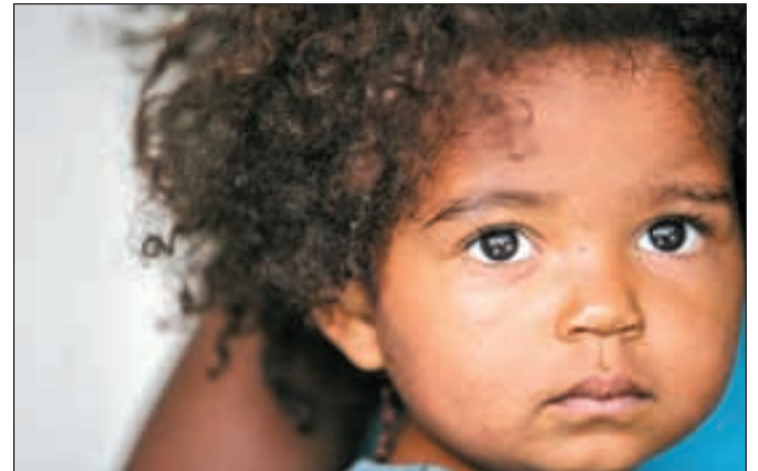
Esta organización trabaja con los países en vías de desarrollo

Así, pretende ayudar en el proceso de concienciación social para detener esta situación tan grave como evitable: la desnutrición infantil aguda en los países en vías de desarrollo. La campaña de esta organización, que cuenta con una gran presencia internacional y no tiene ánimo de lucro, anima a que donemos nuestros mejores días (con las aportaciones económicas que cada uno puede realizar) para que otros tengan días mejores, utilizando de forma simbólica los 1.000 días que van desde el embarazo hasta los dos años de vida de un pequeño, cruciales en su vida. Según UNICEF, con la alimentación necesaria y los cui-