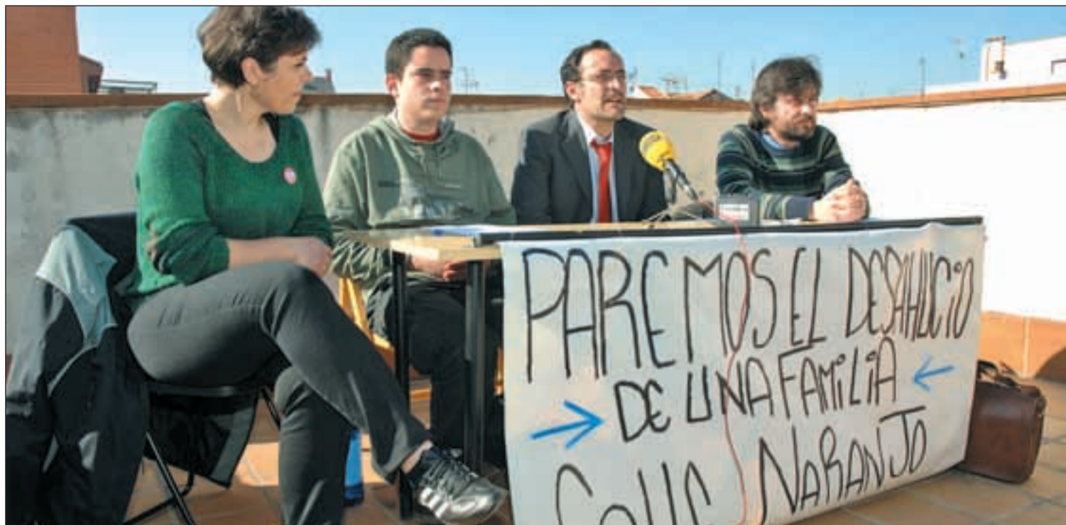
Acto realizado por la rama madrileña de la PAH para movilizar a la ciudadanía el día antes del segundo e inminente desahucio