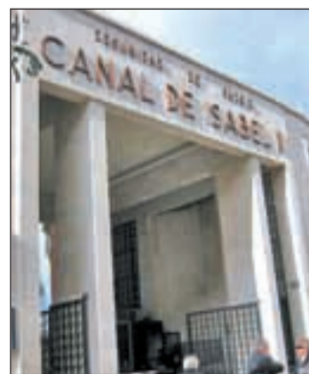
Canal de Isabel II

En este sentido, si bien ha precisado que dicha rentabilidad no es "muy alta", sí que la hay siempre. "Es una rentabilidad muy segura porque todo el mundo consume agua como tienen que consumir luz o gas", ha subrayado.