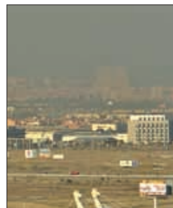
Una imagen de la ciudad