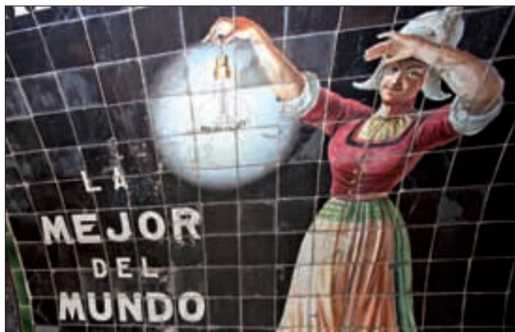
Una de las paredes de la antigua estación

Este museo nació para recuperar la historia del suburbano y mostrar a todos los visitantes la importancia del transporte como motor de la economía y el cambio social en la Comunidad de Madrid. El consejero de Transportes e Infraestructuras,