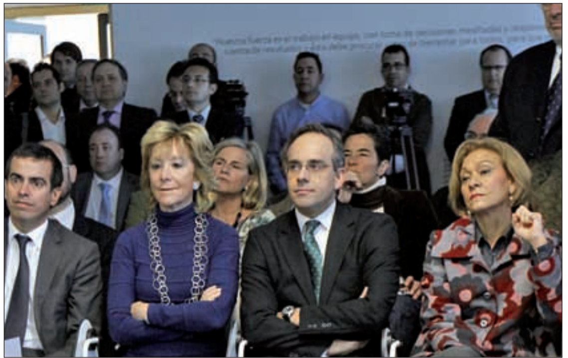
La presidenta de la Comunidad, en la presentación de la nueva industria

La regidora argumenta su petición poniendo como ejemplo algunas de las iniciativas llevadas a cabo por el propio Ayuntamiento en la zona, como el programa para luchar contra el ab-