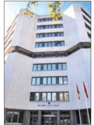
Juzgados de Plaza de Castilla

La Ciudad de la Justicia ya no costará 500 millones de euros ni sus edificios tendrán arquitectos de renombre como planteaba el