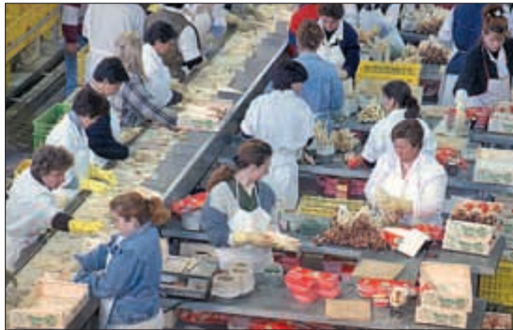
Las mujeres cobran menos por los mismos puestos que los hombres

En concreto, los varones perciben 16.656 millones de euros más que las mujeres por trabajos de igual valor, según el sindicato, lo que, según los datos del ejercicio tributario 2010, significa que las mujeres cobraron 7.952 euros