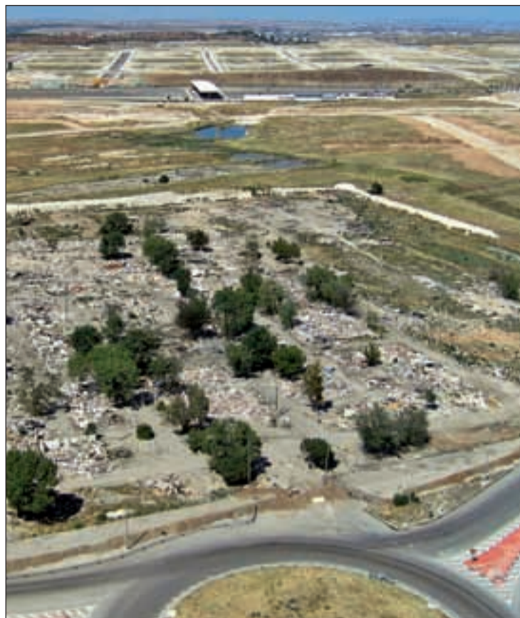
El Cañaveral, tras la demolición de las infraviviendas existentes

Por su parte, la segunda fase está integrada por el parque central y un importante paquete terciario que conforman la centralidad de El Cañaveral. "Si bien