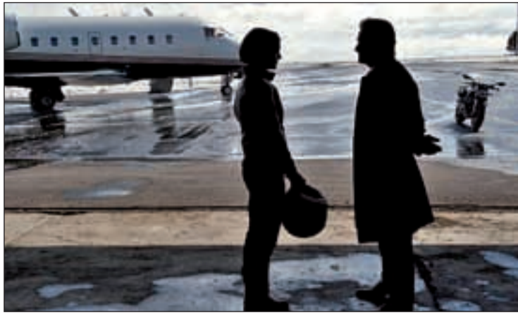
Una escena de 'Indomable', la nueva cinta de Soderbergh

THE ARTIST SE LLEVÓ CINCO PREMIOS EN LA GALA