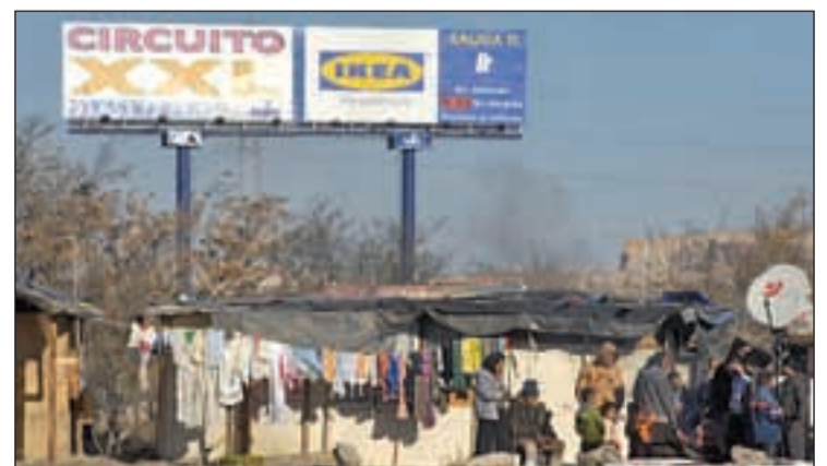
El Gallinero, una de las zonas más degradadas de Cañada. OLMO GONZÁLEZ

Las nuevas instalaciones están dotadas de equipos de última generación y tienen una capacidad de almacenamiento de 4.000 'pallets' a 18 grados bajo cero, lo que la convierten en una de las mayores plataformas de la zona centro dedicada al suministro de masas congeladas. Desde Vallecas se va a abastecer a Madrid y su área metropolitana, así como a la zona Centro y zonas el Sur y Norte de España. Además, es la tercera empresa europea de su segmento de negocio con presencia en Francia, Alemania, Bélgica, Holanda.