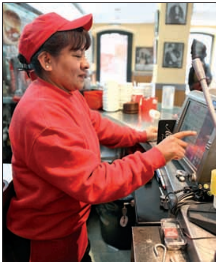
Una mujer, en su habitual puesto de trabajo

Por su parte, en el distrito de Puente de Vallecas, las iniciativas más importantes tendrán lugar en los espacios culturales Alberto Sánchez y Lope de Vega. En el primero de ellos, destaca