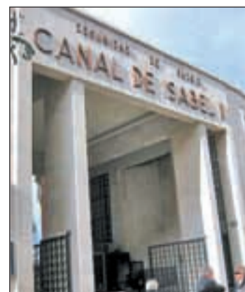
Canal de Isabel II

En este sentido, si bien ha precisado que dicha rentabilidad no es "muy alta", sí que la hay siempre. "Es una rentabilidad muy segura porque todo el mundo consume agua como tienen que consumir luz o gas", ha subrayado.