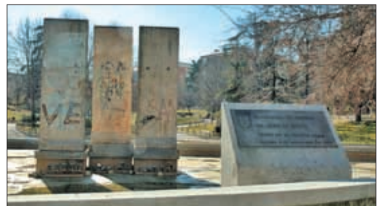
La placa recuerda su inauguración