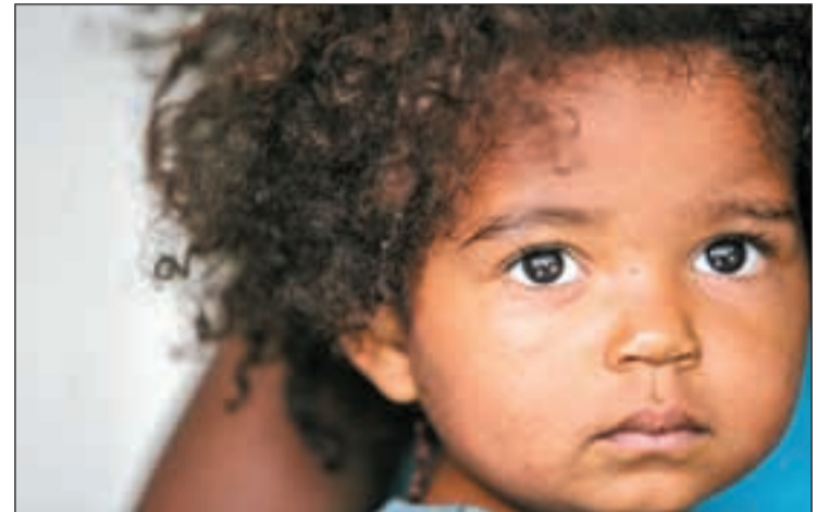
Esta organización trabaja con los países en vías de desarrollo

Así, pretende ayudar en el proceso de concienciación social para detener esta situación tan grave como evitable: la desnutrición infantil aguda en los países en vías de desarrollo. La campaña de esta organización, que cuenta con una gran presencia internacional y no tiene ánimo de lucro, anima a que donemos nuestros mejores días (con las aportaciones económicas que cada uno puede realizar) para que otros tengan días mejores, utilizando de forma simbólica los 1.000 días que van desde el embarazo hasta los dos años de vida de un pequeño, cruciales en su vida. Según UNICEF, con la alimentación necesaria y los cui-