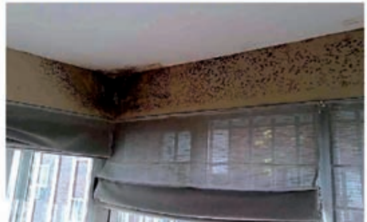
Problemas de humedades por condensación

micología en el instituto de la Salud Pública Louis Pasteur, explica este aumento por nuestro modo de vida: "Vivimos más en el interior, en casa o en el despacho. Desde los años 60, tendemos a un exceso de aislamiento para no dejar escapar el calor y además no se airea suficientemente".