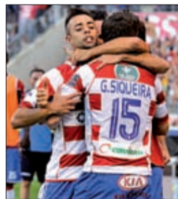
El Granada visita el Calderón