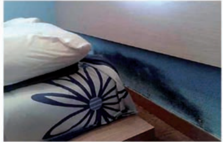
Problemas de humedades por capilaridad

Se han realizado estudios científicos sobre adolescentes que sufren afecciones respiratorias, dando como resultado un 83% de asma, bronquitis asmáticas y bronquitis crónicas y un 87% de rinitis crónicas, que alcanzan a jóvenes que viven en habitaciones demasiado húmedas. De un 20 a un 30% de nosotros sufrimos alergias respiratorias, ¡dos veces más que hace 20 años!. Edouard Drouhet, jefe de