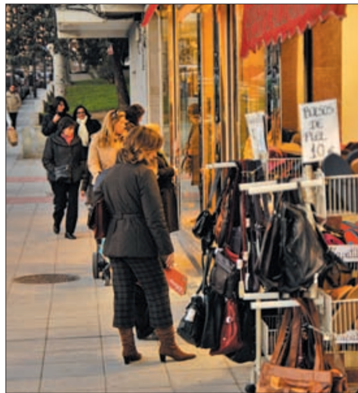
Los comercios podrán abrir los 365 días del año, las 24 horas

Sin embargo, en esta ocasión han ido más allá al anunciar movilizaciones si el Gobierno regional no da marcha atrás. En con-