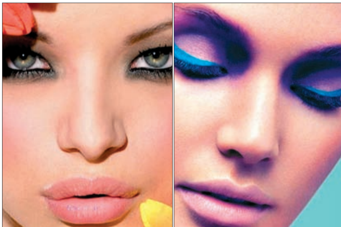
Dos must para la próxima temporada

Por otra parte, la belleza más artificial también tiene cabida gracias a una línea donde los colores fluor y los delineados felinos son los protagonistas. Del Monte señala que, en estos casos, lo más importante es que en el resto del rostro simulemos el