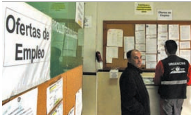
La imagen actual de las oficinas de empleo de Madrid