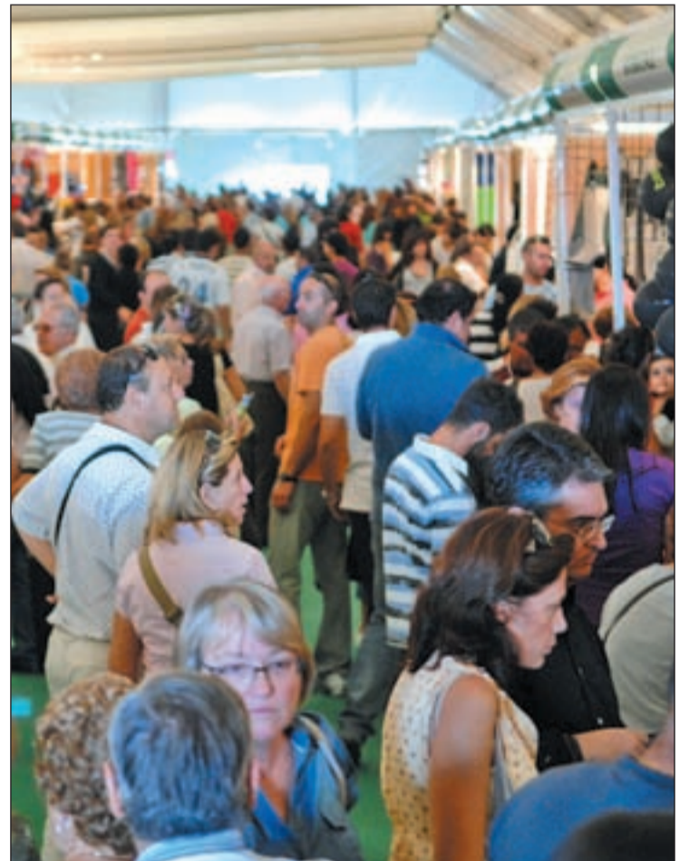
Muchos municipios de la región celebran ferias de stock