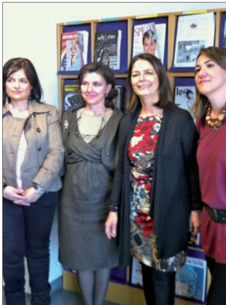
La alcaldesa y la concejal de cultura en la Biblioteca Rosalía de Castro

Más de la mitad de los vecinos de Pozuelo, un 62% son socios de las bibliotecas del municipio. En el último año se han su-