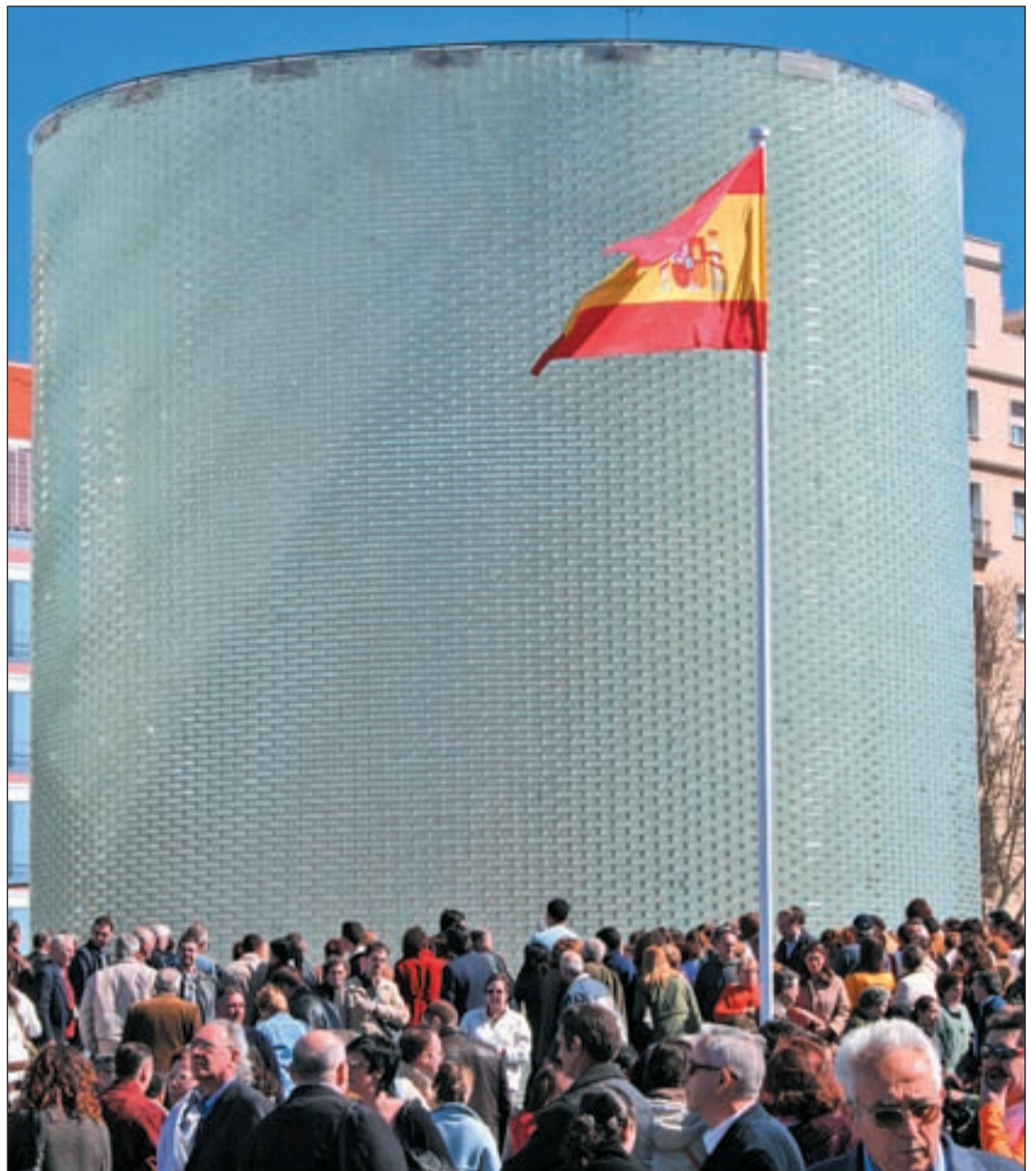
Miles de personas conmemoran los terribles atentados en el monumento a las víctimas situado en Atocha

La Comunidad de Madrid ha ido más allá y ha trasladado los actos de homenaje al 12 de mar-