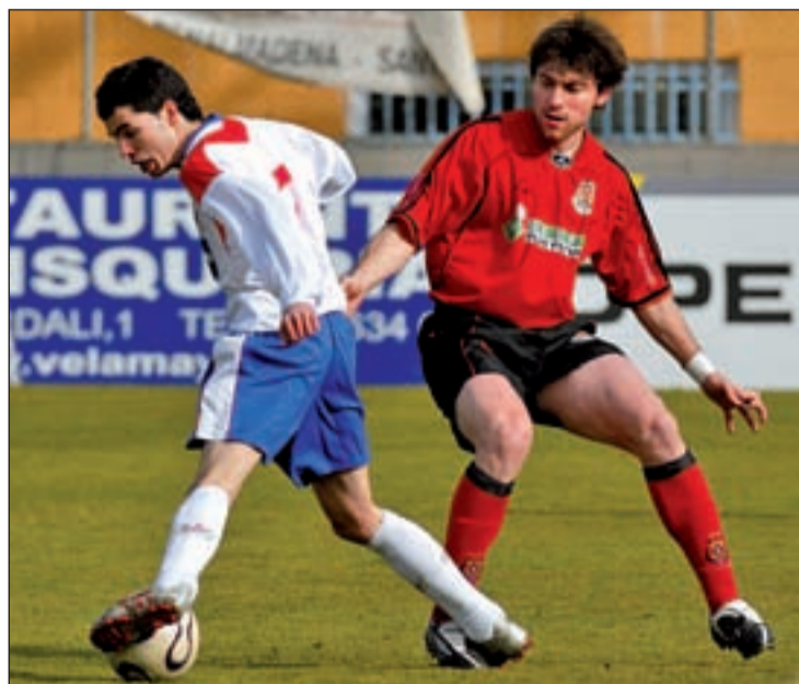
El equipo majariego atraviesa una crisis de juego BOSQUE/GENTE

En contraste con la caída del Rayo Majadahonda, destaca el buen momento que atraviesa el Villaviciosa de Odón. Por cuarta semana consecutiva los hombres de Fernando López se llevaron al menos un punto a su casillero tras empatar a cero en el campo del Carabanchel. De este