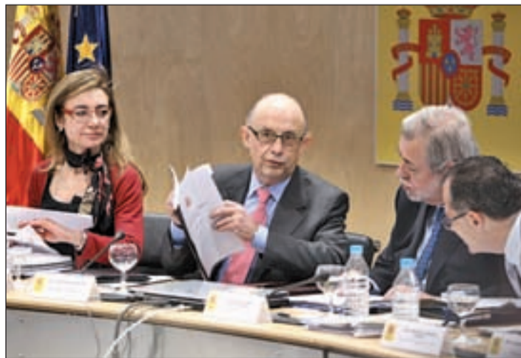
El ministro de Hacienda en la reunión con las Comunidades Autónomas

La Comunidad de Madrid puede presumir de ser la región con menos déficit de España. Sin embargo, la presidenta, Esperanza Aguirre, no se conforma y quiere convertirlo en cero. Esta semana, con motivo de la celebración del Consejo de Política Fiscal y Financiera, que ha reunido al ministro de Hacienda y a los responsables de las Comunidades Autónomas, Aguirre ha señalado que hay que "seguir luchando" para que los gastos de las administraciones públicas "no superen" a los ingresos. "Si seguimos apartándonos de la or-