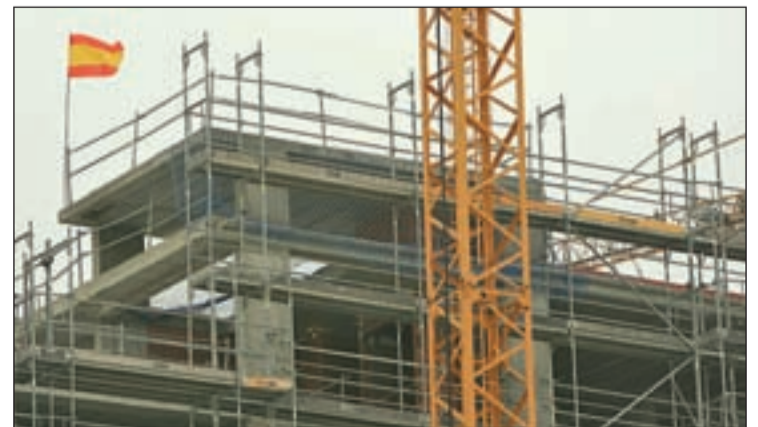
La bandera ondeando en lo alto

La promoción de las viviendas es todo un éxito con casi todas las viviendas confirmadas ya para su venta.