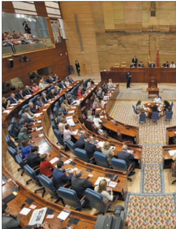
El pleno de la Asamblea de Madrid del pasado jueves