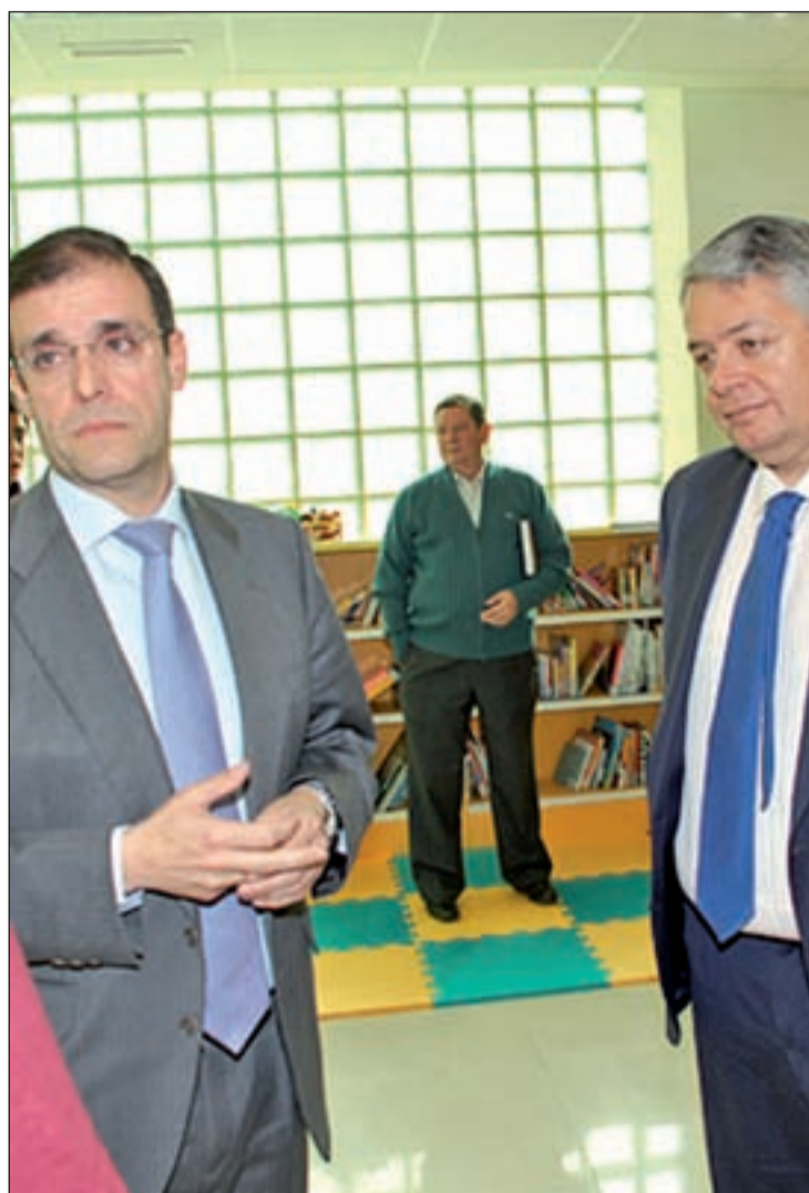
El Defensor del Menor con el alcalde de Colmenar Viejo

"El objetivo de las visitas que estamos realizando a diversos municipios de la región es saber qué