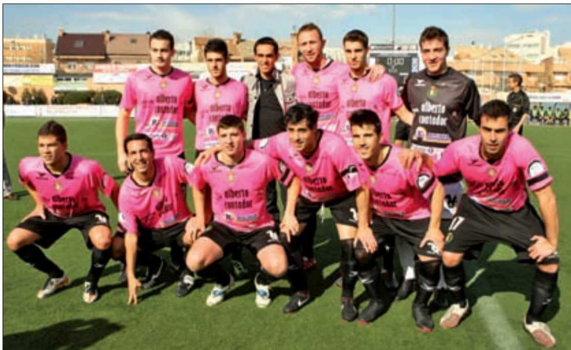
El Pinto, próximo rival del Colmenar, ha sido noticia por su apoyo a Alberto Contador