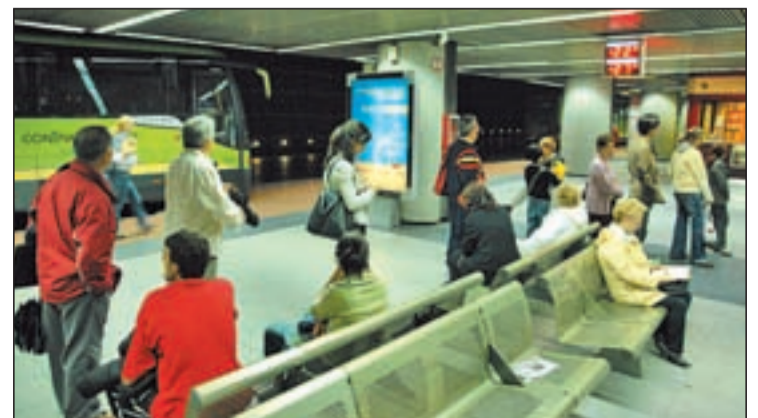
El intercambiador de Avenida de América

La Comunidad de Madrid amplía así, cada vez más, la red de conexiones wifi gratuitas que ya existía en los autobuses de algunas localidades y en algunas estaciones de metro de la red regional.