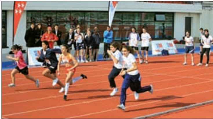
Los escolares se divertieron en Tres Cantos haciendo atletismo

EN COLMENAR SE CELEBRÓ EL CAMPEONATO DE CAMPO A TRAVÉS