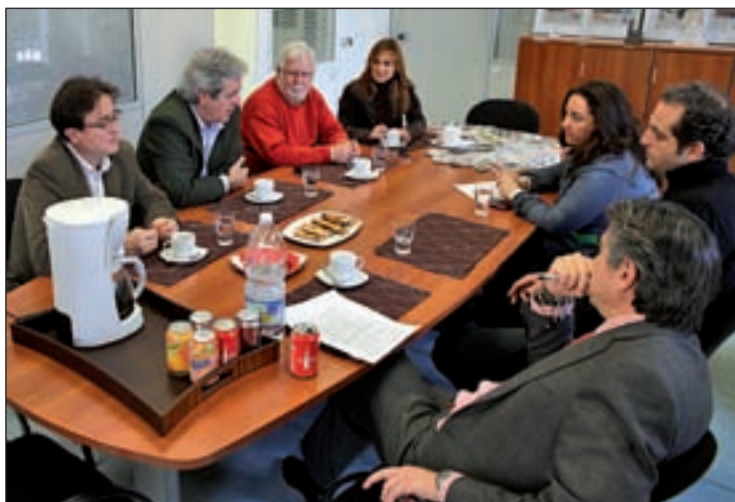
Los líderes de UGT y CCOO de Madrid durante la entrevista

son considerados un coste y solamente en base a los salarios se pretende tirar de la comunidad española, esto es la destrucción económica del país. ¿De qué estamos hablando?