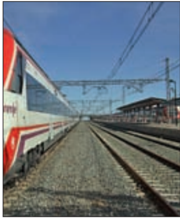
La estación de Colmenar