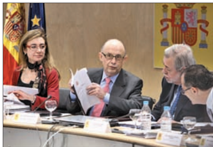
El ministro de Hacienda en la reunión con las Comunidades Autónomas

La Comunidad de Madrid puede presumir de ser la región con menos déficit de España. Sin embargo, la presidenta, Esperanza Aguirre, no se conforma y quiere convertirlo en cero. Esta semana, con motivo de la celebración del Consejo de Política Fiscal y Financiera, que ha reunido al ministro de Hacienda y a los responsables de las Comunidades Autónomas, Aguirre ha señalado que hay que "seguir luchando" para que los gastos de las administraciones públicas "no superen" a los ingresos. "Si seguimos apartándonos de la or-