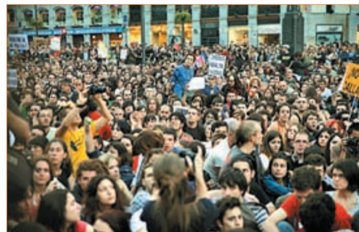
Manifestantes del 15-M en una concentración en Madrid

Sobre el protagonismo de las movilizaciones sociales aglutinadas en torno al movimiento 15-M, dice Javier López que “lo hemos visto con tremenda simpatía, no lo veremos con tremenda simpatía si el 15-M deri-