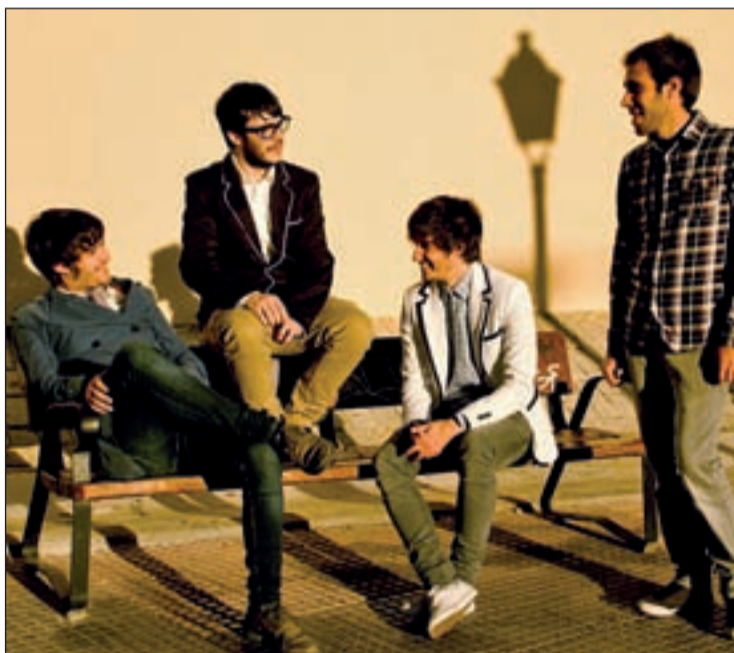
El cuarteto vuelve con la misma ilusión de siempre a los escenarios

Es un disco mucho más elaborado, con una mayor presencia de los coros y abarcando géneros y estilos musicales que en otras