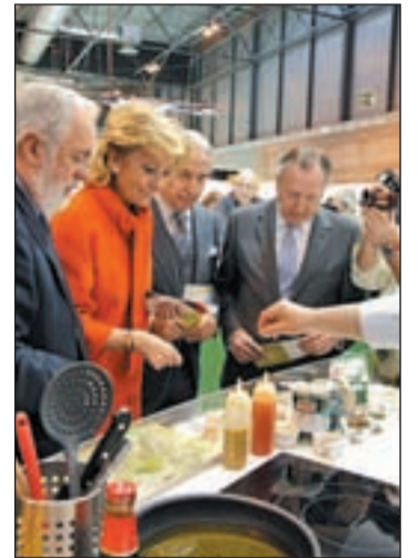
Cañete y Aguirre en el Salón

La región ha estado presente en esta cita con un espacio de más de 300 metros cuadrados en el que se han reunido los mejores exponentes de los vinos, aceites, carnes, licores, conservas o productos ecológicos de la región. Con la presencia en el Salón de Gourmets, la Comunidad refuerza la promoción de los Alimentos de Madrid y su sector agroalimentario con el objetivo de seguir abriendo nuevos mercados y posibilidades de negocio.