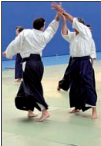
Imagen de la jornada

El VI Encuentro de Aikido 'Villa de Colmenar Viejo' cosechó el pasado fin de semana en el Pabellón B del Complejo Deportivo Municipal 'Lorenzo rico' un nuevo éxito de participación y de satisfacción entre los practicantes de este arte marcial al conseguir congregarse a 52 aikidokas procedentes no sólo de diferentes municipios de la región sino también de poblaciones como Valladolid, Guadalajara, Cáceres o Santiago de Compostela. El encuentro volvió a estar dirigido por dos expertos maestros de esta disciplina, Guillermo Re-