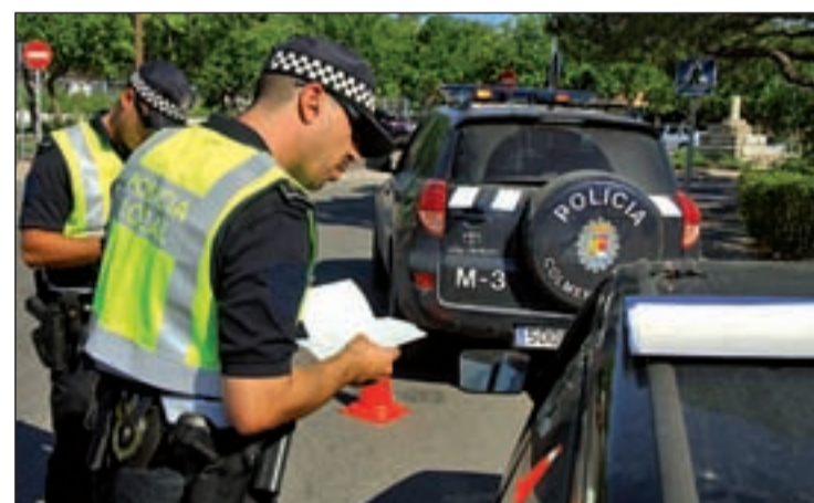
La Policía Local de Colmenar en un control