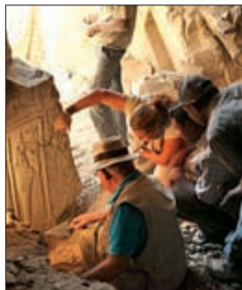
El equipo del I.E.A.E.

ciudad de Luxor. La charla tendrá lugar a partir de las 19:00 horas en el Espacio Joven La Plaza de Fuenlabrada y será una gran oportunidad para conocer de cerca los pormenores de este proyecto con una altísima importancia arqueológica, artística e histórica.