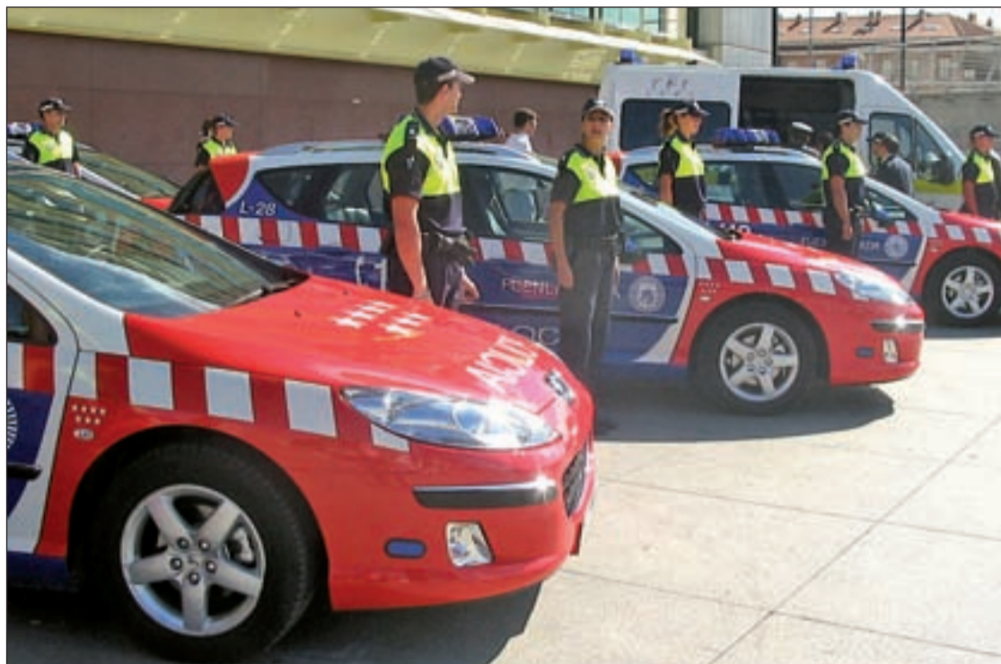
Los agentes colaborarán con la Guardia Civil para evitar que se manipulen móviles o GPS mientras se conduce

El Ayuntamiento de Fuenlabrada ha mostrado su temor a que la actual situación de crisis económica pueda suponer un freno en el progreso de las políticas de igualdad. Así lo puso de manifiesto el Consistorio en la declaración institucional difundida con motivo de la celebración del Día de la Mujer, el pasado jueves 8 de marzo.