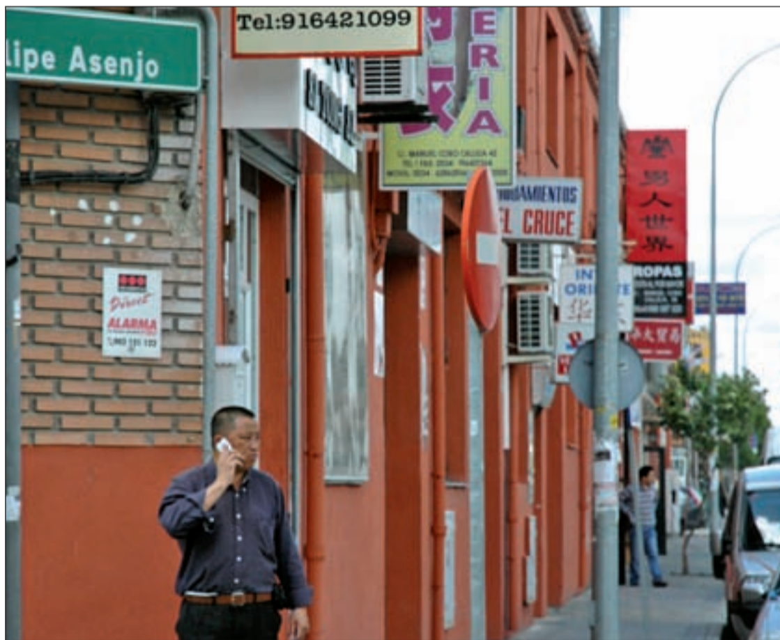
Fuenlabrada es uno de los municipios con mayor presencia de ciudadanos chinos

Serán construidas por el Grupo Main en El Vivero en base a la doctrina Feng Shui. Costarán 400.000 euros y tendrán unos 190 metros Pág.12