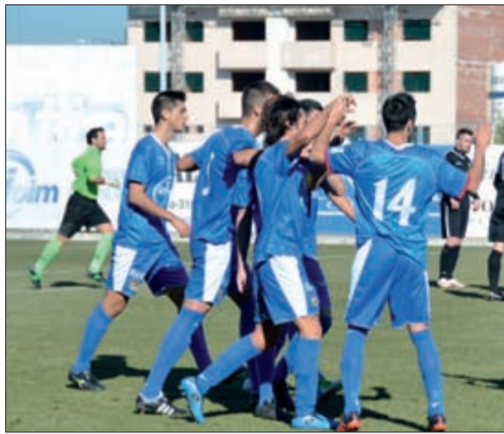
El Fuenlabrada busca su novena victoria seguida en casa

Por todos estos ingredientes, el del Fernando Torres ha recibido el calificativo de partido de la jornada, compartiendo atención con el choque de Los Prados en el que el Parla se jugará buena parte de sus opciones de acceder a la cuarta plaza ante el Real Madrid C. Media hora después de esa cita, el Fuenlabrada espera prolongar su buena racha como local, ya que los hombres de Antón Gonzalo no conocen la de-