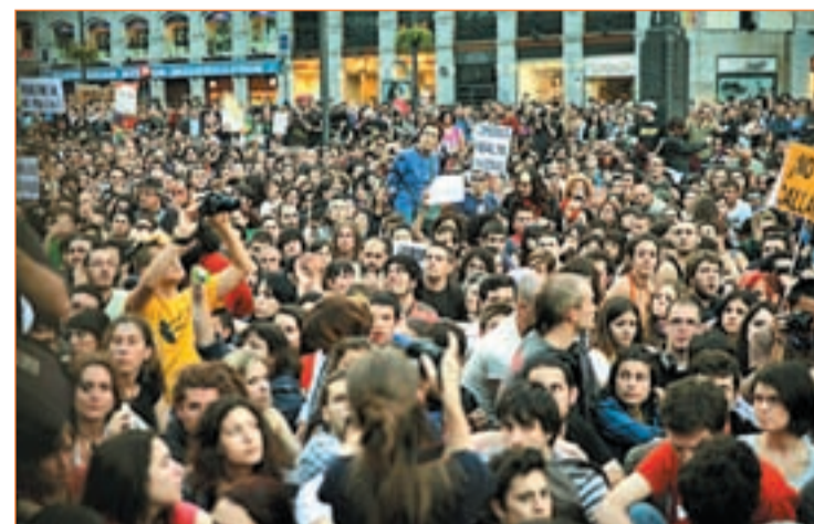
Manifestantes del 15-M en una concentración en Madrid