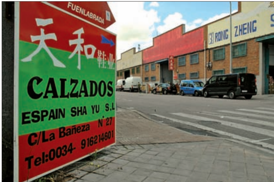
En el polígono Cobo Calleja se ubican cerca de 600 empresas orientales

Desde el Grupo Main han confirmado que la promoción de Fuenlabrada será la primera