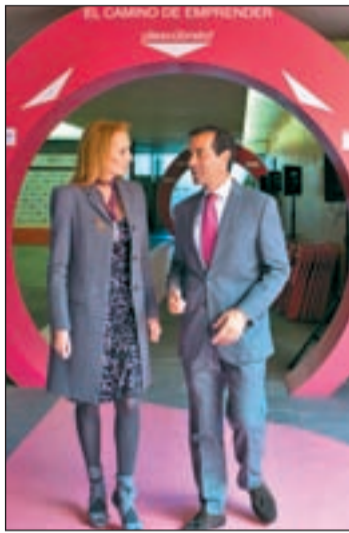
Victoria inauguró los actos

En este foro se ha potenciado, a lo largo de esta semana, el empleo y el emprendimiento femenino. Además, se ha planteado atajar la violencia de género con un pacto ético con los medios de comunicación como colaboradores necesarios e influyentes; expandir el mensaje por España, Europa y América; y captar la atención de los medios de comunicación a través de acuer-