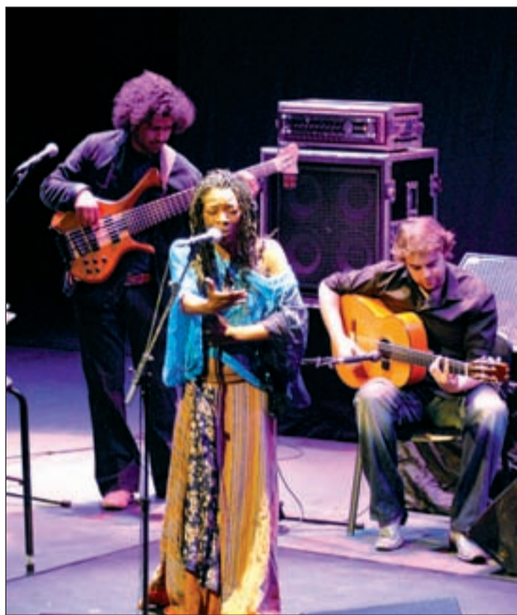
Concha Buika, destacada figura del género, en Fuenlabrada

De las maquetas recibidas, un jurado seleccionará los doce mejores trabajos que pasarán a la final, que se dirimirá en una gala a celebrar el 27 de abril a las 20:00 horas en el Teatro Tomás y Valiente de la ciudad, y en la que los seleccionados tendrán la oportunidad de defender dos