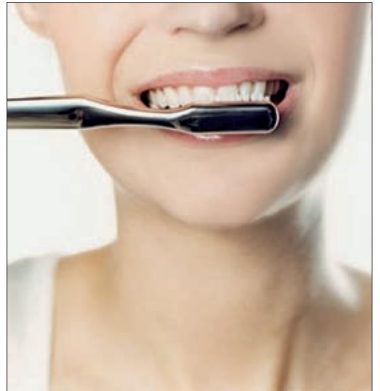
Las caries son consecuencia de una mala higiene dental

De hecho, añade, en este país "no aumentan ni las ventas de dentífrico ni las de cepillos, so-