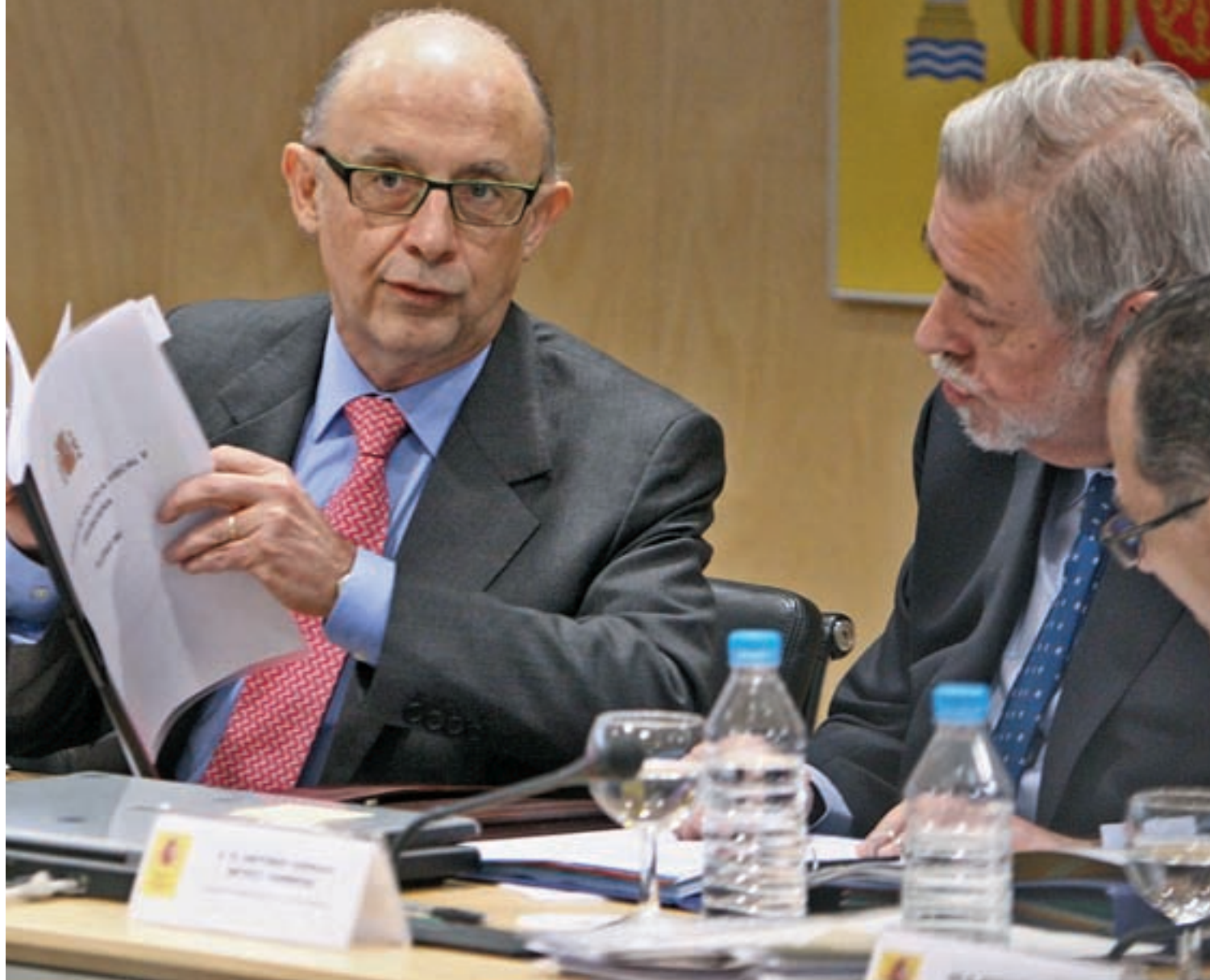
Cristóbal Montoro, ministro de Hacienda, y Antonio Beteta, secretario de Estado de Administraciones Públicas, en el Consejo de Política Fiscal

El ministro de Hacienda, Cristóbal Montoro, se reúne con las Comunidades Autónomas en el Consejo de Política Fiscal · Les pide que reduzcan el déficit del 2,9% al 1,5% este año Pág. 4