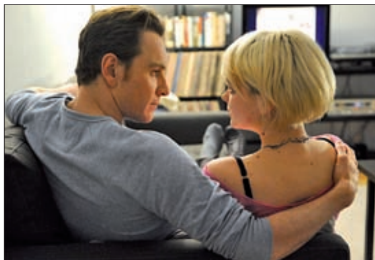
Fassbender y Mulligan en uno de los momentos cumbre del filme

con este retrato vital de Brandon, excepcionalmente interpretado por Fassbender, un treinteaño neoyorquino que mata su soledad y llena la aparente monotonía vital que transmite mediante infinitos actos sexuales, ya sea acostándose con múltiples mujeres o buscando una satisfacción más individual. La textura audiovisual (los planos, el sonido, los diálogos) engrandece un comportamiento no demasiado extraño en los tiempos que corren, sobre todo en las grandes ciudades. El protagonista se verá sorprendido por la llegada a su casa de Sissy,