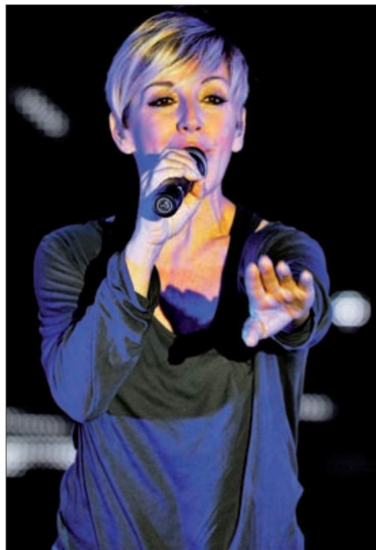
La cantante, durante uno de los ensayos para la gira L.TEJADA

vendidos. Afirmó que se acercaba una gira por grandes recintos. "El rumor era falso, sé que hay mucha ilusión pero una vuelta de este calibre sólo la podríamos comunicar nosotros. Si llega a ocurrir sería para el año que viene y nos encargaríamos de anunciarlo los tres. Si no tuviéramos ganas de que ocurra, no estaríamos hablando de esto". Por lo tanto, sus fans todavía pueden mantener la esperanza sobre esta complicada y esperada reunión temporal.