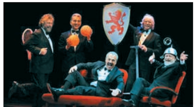
La risa está asegurada con estos cinco argentinos

Después, estarán en A Coruña (15 al 18) y Vigo (20 al 24). Posteriormente, regresarán a nuestro país para actuar del 25 de septiembre hasta el 21 octubre en Madrid.