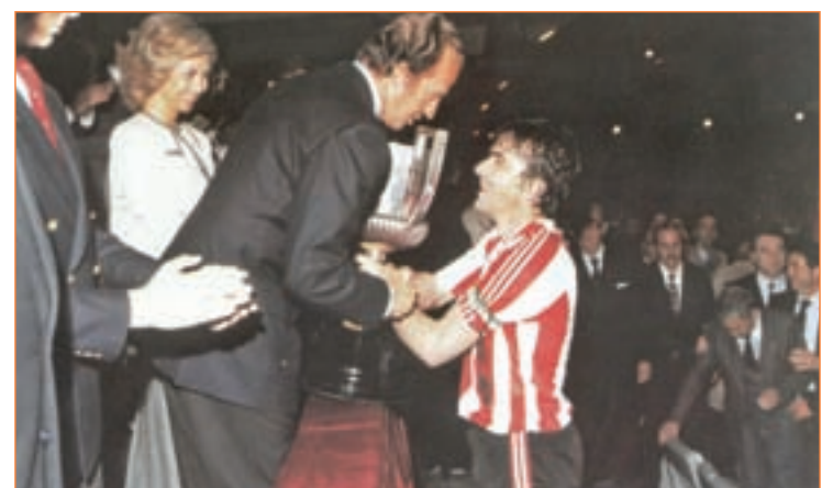
Dani tuvo el honor de levantar el título de 1984

cumplida revancha en la final de Mestalla, aunque nuevamente algunos incidentes extradeportivos acabaron robando parte del protagonismo a los jugadores. En esta ocasión, la polémica vino de la mano de la enorme pitada de una parte de los aficionados cuando el himno español sonaba por la megafonía del estadio del Valencia.