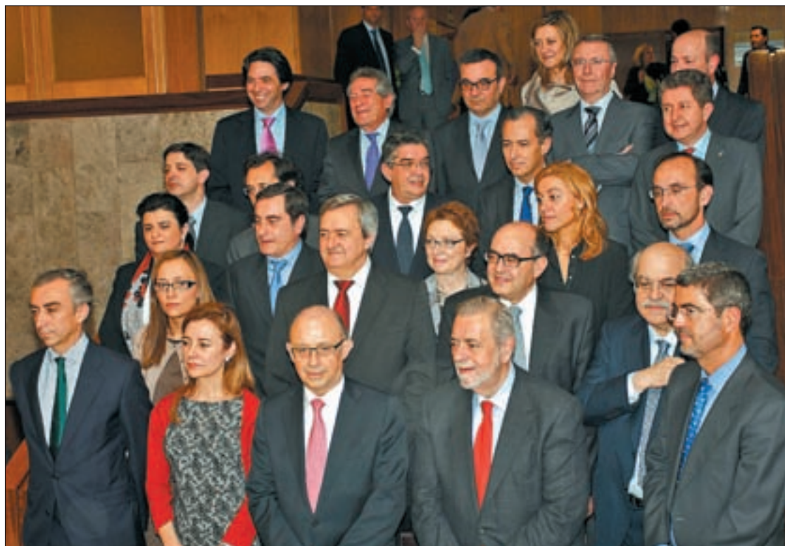
El ministro y los representantes de las Comunidades Autónomas en la reunión

Además, el ministro instó a la Junta de Andalucía a explicar a los ciudadanos los motivos de su negativa y a aumentar la transparencia en las cuentas del gobierno de esta región, algo que desde esta comunidad ya han