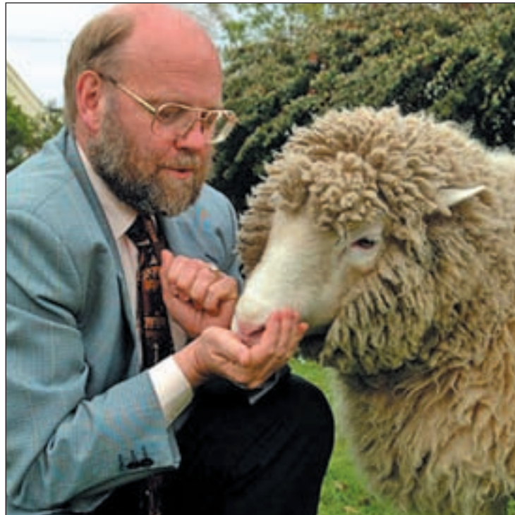
LA OVEJA DOLLY. De raza Finn Dorset. Nació el 5 de julio de 1996 en el Instituto Roslin de Edimburgo, situado en Escocia, pero su existencia no se divulgó hasta siete meses después, el 23 de febrero del año siguiente, 1997.