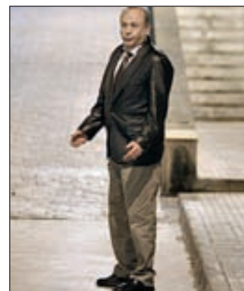
El juez Castro

entre el duque de Palma y su socio Diego Torres. Esta posibilidad llegó a ser apuntada verbalmente por Castro durante el interrogatorio de Urdangarín después de que éste descargase toda la responsabilidad en su mano derecha, atribuyéndole así la comisión de todas las conductas delictivas de las que le acusa.