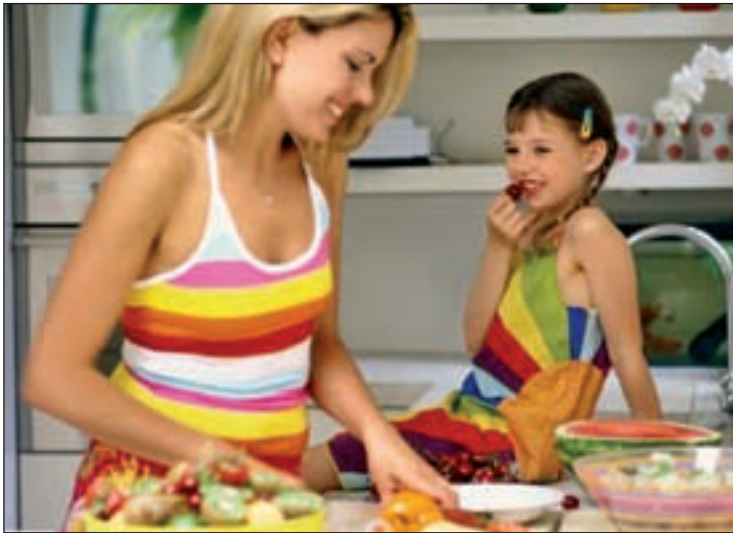
La madre es la figura que mejor conoce las necesidades de sus hijos