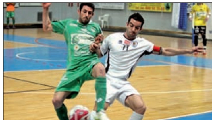
Trimán y Carnicer ya se midieron el pasado viernes en la Liga

Las semifinales están programadas para la tarde del sábado. El primer billete para la final se decidirá a partir de las 18:15 horas, quedando fijado el comienzo de la segunda semifinal para dos horas después. La final se disputará el domingo a partir de las 19:00 horas.