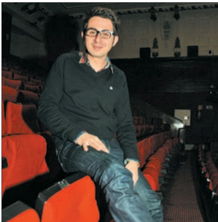
Berto comprueba 'in situ' la comodidad de las butacas

Vale, voy a intentarlo. Es un excelente ejercicio de ejecución cómica por parte del humorista Berto Romero, que se defiende en solitario en un escenario sin necesidad de artificios durante hora y media, con un monólogo bien construido e hilvanado, motejado con canciones humorísticas muy interesantes... Ahora, la parte negativa, ¿no? El aire acondicionado del teatro a veces