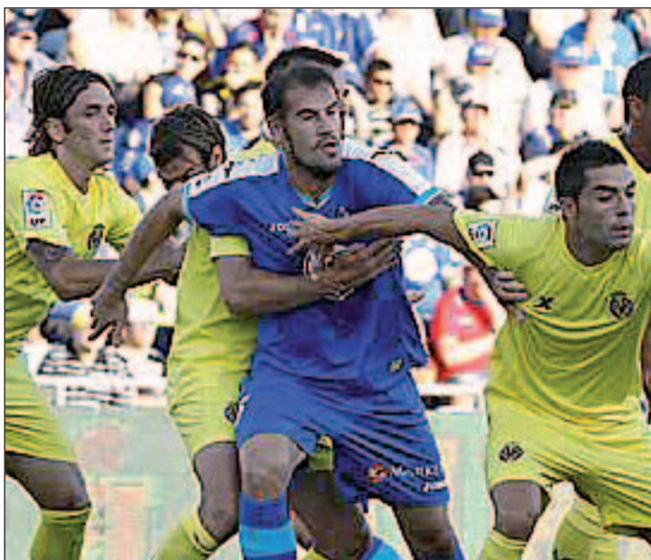
El partido de ida se saldó con un empate a cero

Curiosamente, la situación que está atravesando el Getafe no es ajena a su próximo rival. Después de un curso exitoso en el que logró clasificarse para la Liga de Campeones, al Villarreal le ha tocado vivir una temporada difícil. Después de quedar apeado de la competición continental y de caer en la Copa del Rey ante un modesto como el Mirandés, el equipo amarillo debe centrar todos sus esfuerzos en el torneo de la regularidad, aunque