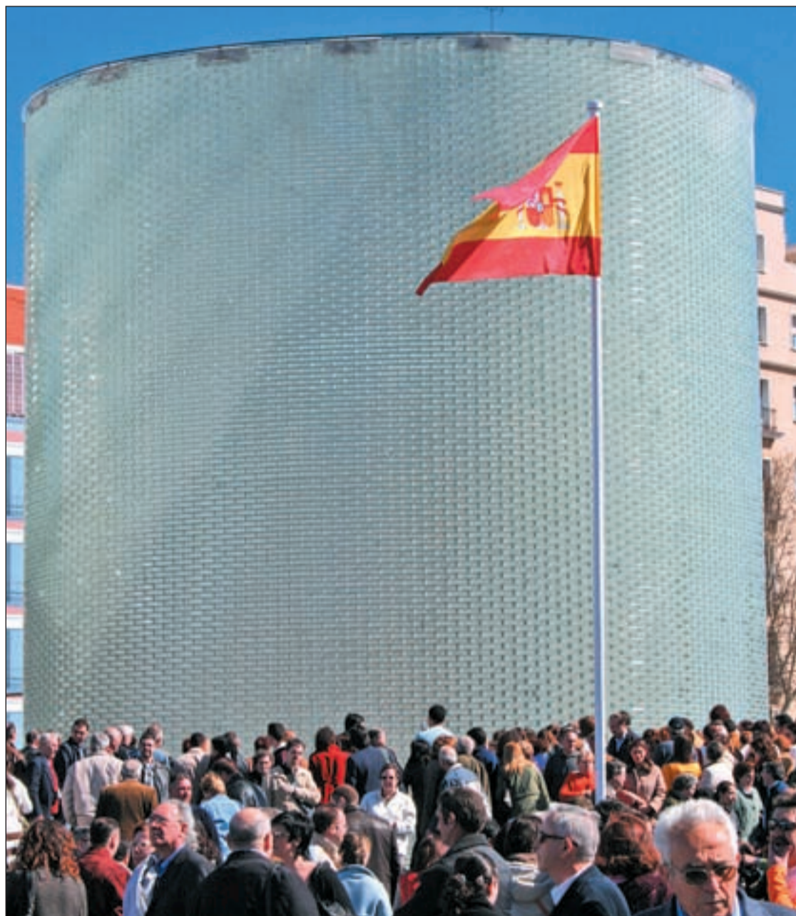
Miles de personas conmemoran los terribles atentados en el monumento a las víctimas situado en Atocha

La Comunidad de Madrid ha ido más allá y ha trasladado los actos de homenaje al 12 de mar-