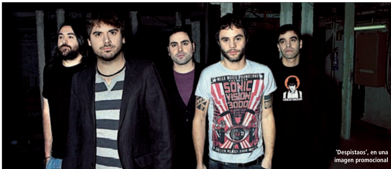
'Despistaos', en una imagen promocional