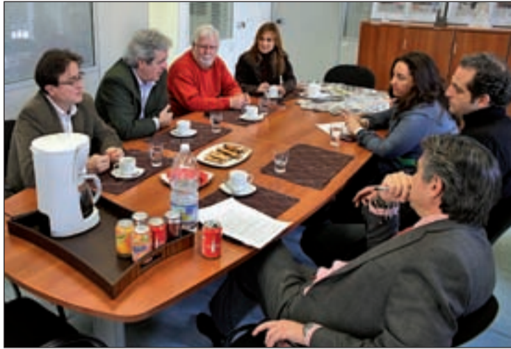
Los líderes de UGT y CCOO de Madrid durante la entrevista

son considerados un coste y solamente en base a los salarios se pretende tirar de la comunidad española, esto es la destrucción económica del país. ¿De qué estamos hablando?