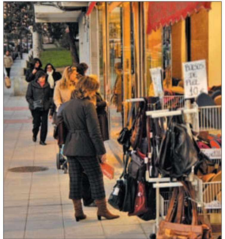
Los comercios podrán abrir los 365 días del año, las 24 horas

Sin embargo, en esta ocasión han ido más allá al anunciar movilizaciones si el Gobierno regional no da marcha atrás. En con-