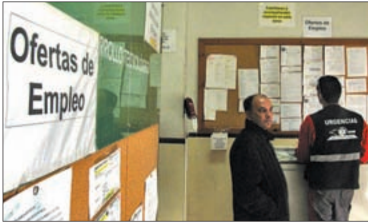
La imagen actual de las oficinas de empleo de Madrid