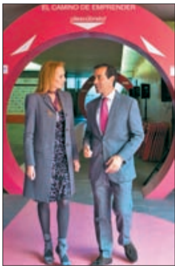
Victoria inauguró los actos

En este foro se ha potenciado, a lo largo de esta semana, el empleo y el emprendimiento femenino. Además, se ha planteado atajar la violencia de género con un pacto ético con los medios de comunicación como colaboradores necesarios e influyentes; expandir el mensaje por España, Europa y América; y captar la atención de los medios de comunicación a través de acuer-