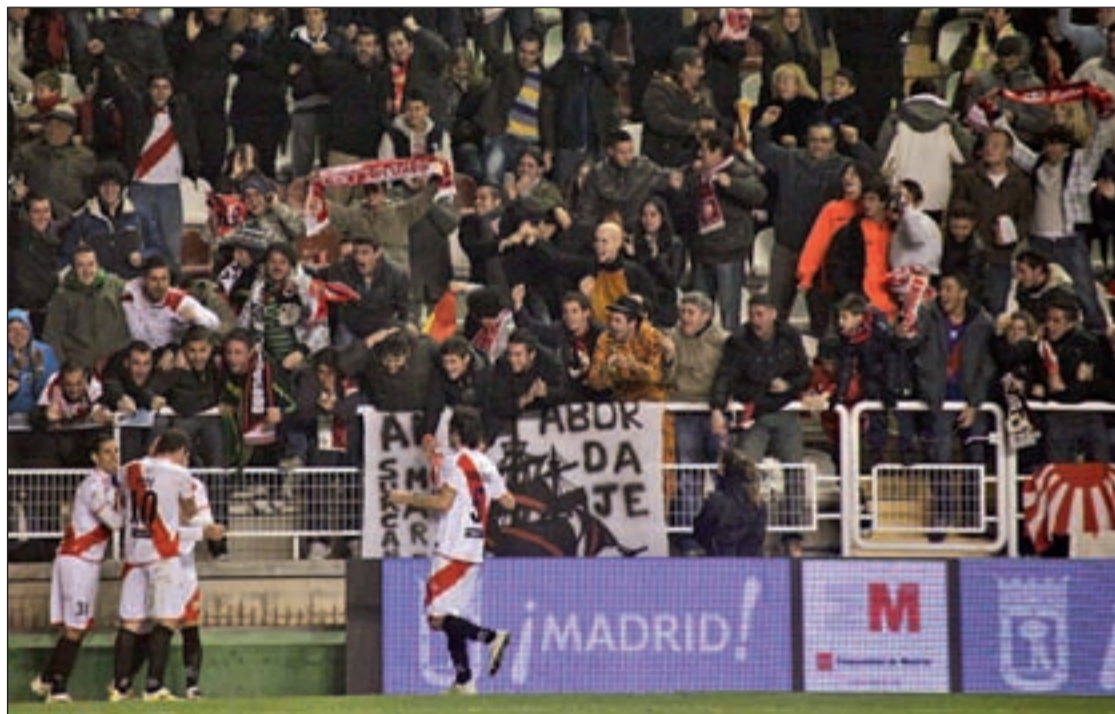
El equipo franjirrojo sigue dejando buenas sensaciones

Por todo esto y tras las críticas recibidas, el Rayo espera que salte al césped de Cornellá-El Prat un Espanyol dolido y ansioso por mejorar su imagen ante