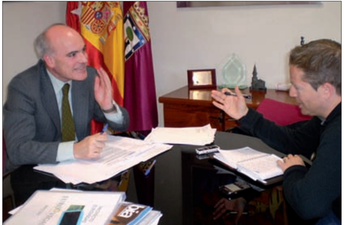
Un momento de la entrevista con GENTE en el despacho de la Junta Municipal de Villa de Vallecas

Objetivamente es el espacio apropiado. Lo que ofrece no lo tiene otro lugar ni en la Comunidad de Madrid. Dispone de suelo, está cerca del aeropuerto de Barajas, es paso de la línea de alta velocidad, y supondría la participación de todas las adminis-