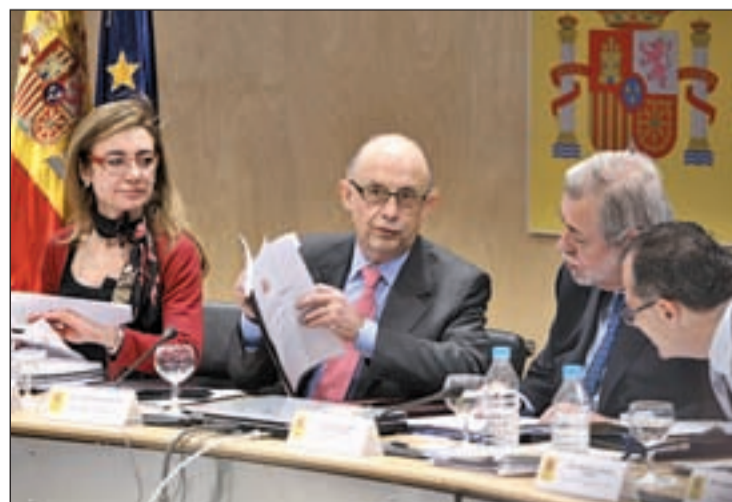
El ministro de Hacienda en la reunión con las Comunidades Autónomas

La Comunidad de Madrid puede presumir de ser la región con menos déficit de España. Sin embargo, la presidenta, Esperanza Aguirre, no se conforma y quiere convertirlo en cero. Esta semana, con motivo de la celebración del Consejo de Política Fiscal y Financiera, que ha reunido al ministro de Hacienda y a los responsables de las Comunidades Autónomas, Aguirre ha señalado que hay que "seguir luchando" para que los gastos de las administraciones públicas "no superen" a los ingresos. "Si seguimos apartándonos de la or-