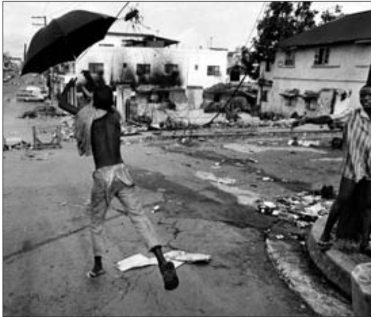
Una instantánea de la muestra, que se inauguró este martes

El recorrido por la exposición fotográfica de Gervasio Sánchez, que se inauguró este martes en Tabacalera (calle Embajadores, 53) y estará allí hasta el 10 de junio, permite visualizar, mediante las 148 instantáneas y seis audiovisuales relacionados con ellas, el dolor de tantas guerras y la esperanza vital de quienes, en diferentes rincones del planeta, han tenido que soportar situaciones inhumanas. Las imágenes de este infatigable fotoperiodista cordobés presentan numerosos escenarios bélicos en América Latina, Europa, Asia y África para hacerse una idea del horror, el drama y la crueldad que ha padecido gente como nosotros mientras muchos nos