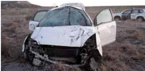
Durante su huida, sufrió un accidente de circulación en Villamuriel.

Fue trasladado al Hospital Río Carrión de Palencia al sufrir heridas leves, pero antes circuló más de 87 kilómetros de forma temeraria con un vehículo sustraído en Zamora capital, donde se formuló la correspondiente denuncia ante el Cuerpo Nacional de Policía. Entre los restos del vehículo, la Guardia Civil localizó un motor de embarcación de recreo, sustraído en Mogro (Cantabria). Ha sido puesto a disposición judicial.