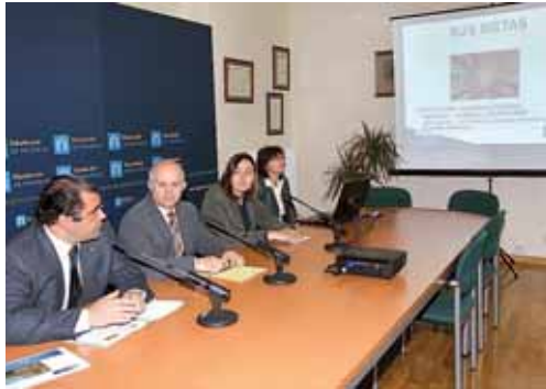
Un momento de la presentación del programa en la Institución Provincial.