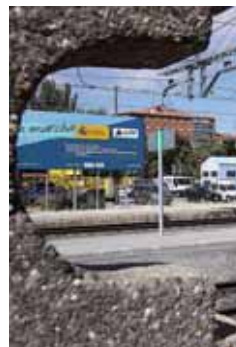
Imagen de una zona con ORA.

La medida responde a la iniciativa del Consistorio de complementar la reciente ampliación cerca de los dos parkings de la Zona de Ordenanza Reguladora de Aparcamiento (ORA) necesaria para cumplir con el número de plazas que figuran en el contrato que el anterior equipo de Gobierno firmó con la empresa concesionaria del servicio, Dormier .