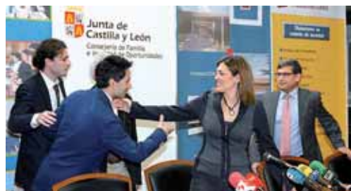
La consejera de Familia presenta el programa del Complejo Castilla.

"Se darán el mismo número de horas pero en jornadas independientes" añadió, concretamente los cursos se impartirán