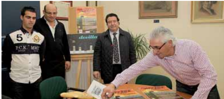
Un momento de la presentación en la Diputación Provincial.

Como es tradicional, se preparará una degustación de tortas de chicharrón maridadas con orujo. Seguidamente, se llevará a cabo la Procesión Nacional Cívica del Cerdo con el traslado del animal sacrificado y chamuscado hasta el recinto ferial, ubicado en el pabellón polideportivo de Villada. Allí se realizará una visita a los distintos espacios expositivos y se degustarán productos artesanales. Seguidamente se procederá a la inauguración de la exposición Raíces de