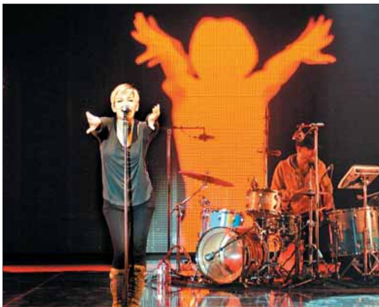
La cantante, durante uno de los ensayos para la gira.

Desde que inició su carrera en solitario (1997) ha publicado seis álbumes de estudio, pero el espíritu de Mecano siempre ha estado presente en su trayectoria por la devoción que despertó entre miles de personas por todo el mundo y como consecuencia de la influencia que, tras aquella época, ofrecen sus temas posteriores. Resulta inevitable esto último, ya que el pop elegante y dulce de Ana Torroja, independientemente de las posibles críticas a la calidad instrumental tras la exitosa etapa con los hermanos Cano, sigue presente en temas movidos como 'Sonrisa' o en piezas más lentas que tienen en 'Hoy' a su máxima expresión cuando escuchas este último disco. "No hago más que disfrutar de lo que doy y me gusta tanto, tanto lo que soy... Y es que soy parte de ti, parte del mar, parte del manantial, parte del bien, parte del mal, parte de todo lo que hay", canta en esta mencionada composición como una declaración de intenciones para asumir el pasado y sentir como nunca el presente.