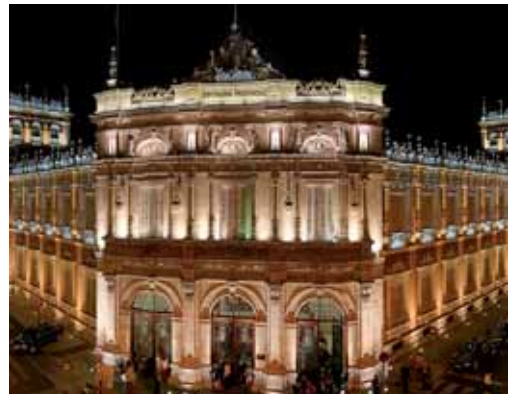
Imagen exterior de la Diputación de Palencia.

cio de Asistencia a Municipios se ha dispuesto una plataforma de ayuda en la web www.dip-palencia.es para unificar la documentación, con las instrucciones téc-