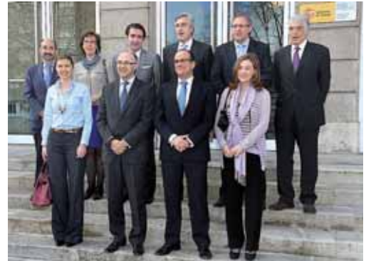
Foto de familia a las puertas de la sede de la subdelegación del Gobierno

Respecto a los datos de Tráfico en enero, comentó que se produjeron un 52 % menos de accidentes en las carreteras de Castilla y León que doce meses antes -12 accidentes en 2012 frente a los 25 del pasado año, con un porcentaje de muertos un 14 % menor (con 12 víctimas mortales frente a 28). Asimismo, expuso que el 75 % de