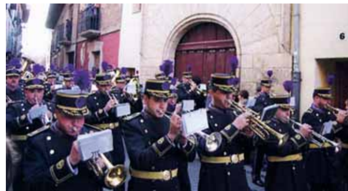
Agrupación musical Dulce Nombre de Jesús Nazareno de León.