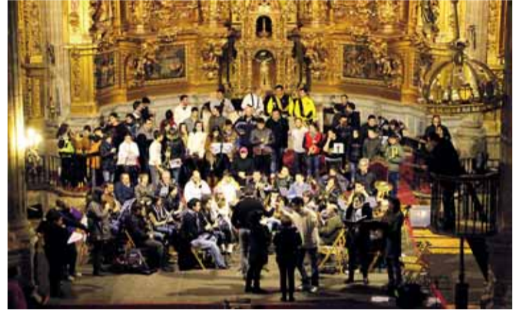
Imagen de uno de los ensayos de todos los músicos participantes.

Se trata de una obra escenificada cuya partitura requiere una amplia dotación instrumental con tres bandas de cornetas y tambores, banda sinfónica (Ban-