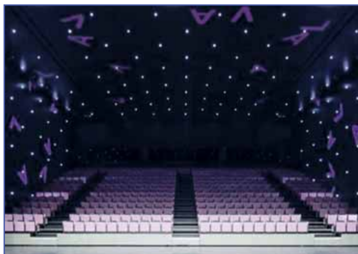
El laboratorio de las Artes de Valladolid, LAVA, apuesta por la cultura del Ayuntamiento.

CreArt busca la cooperación europea para la promoción de la creatividad artística, en artes plásticas y visuales, y para ello programa una serie de exposiciones, estancias, intercambios, seminarios y estudios que se desarrollarán en