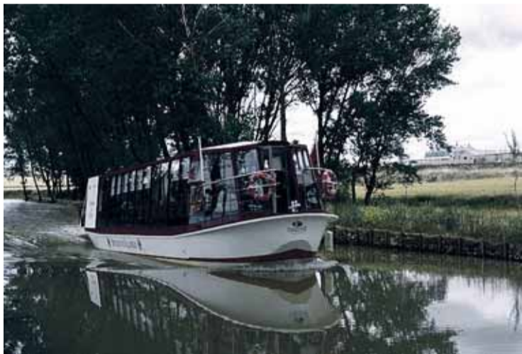
El 'Antonio de Ulloa' fue inaugurado en el año 2003.

ningún elemento sonoro de la Semana Santa riosecana, en la obra cuenta con el sonido de las horquillas, la presencia de la salve, el inicio de un miserere o la presencia de "La Lágrima".