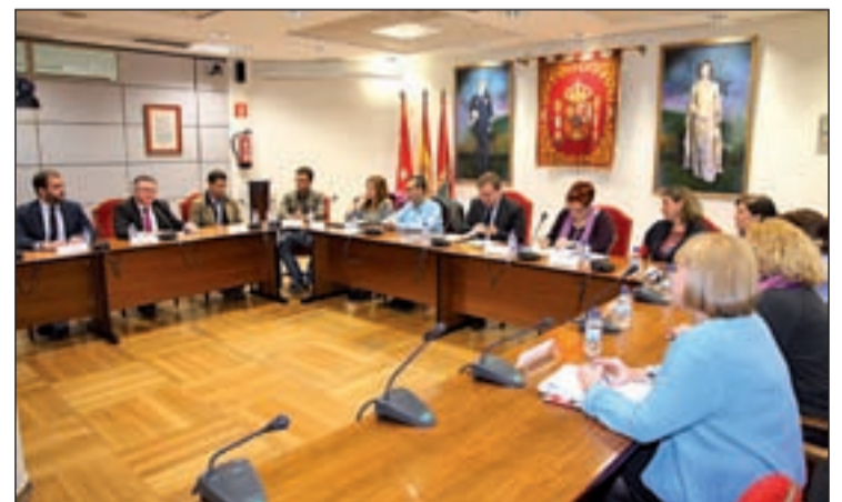
Un momento de la firma del acuerdo

medidas necesarias para eliminar las desigualdades detectadas por razón de sexo; garantizar las actuaciones oportunas para la prevención y tratamiento de situaciones de acoso sexual; atender y dar respuesta a consultas, reclamaciones y situaciones discriminatorias formuladas por la plantilla, velar por evitar posibles represalias contra las personas implicadas en casos de discriminación; sensibilizar a la plantilla sobre la importancia de incorporar medidas de igualdad de oportunidades en la política de personal del Consistorio o proponer que se incluyan en el