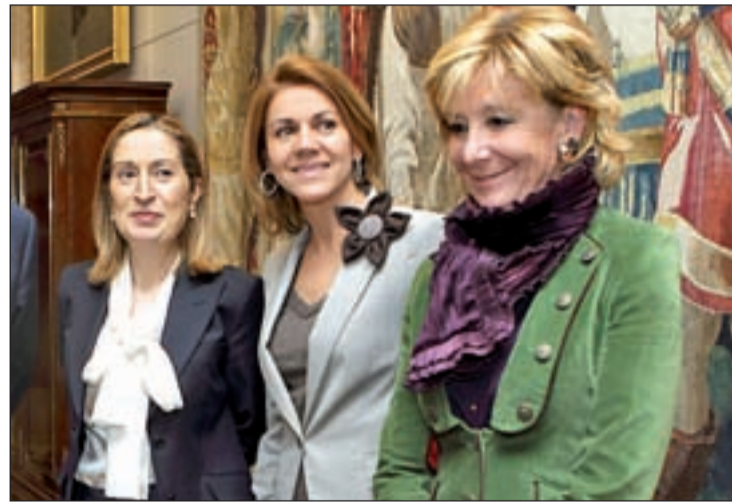
Ana Pastor con las presidentas de Madrid y Castilla La Mancha

En estas obras de adecuación, lo que se va hacer, en un primer lugar, es mejorar los tramos que aún quedan pendientes por remodelar. También se van a continuar los contratos de estas autovías de primera generación para acabar las obras de primer establecimiento u que concluirán próximamente. Desde ahora