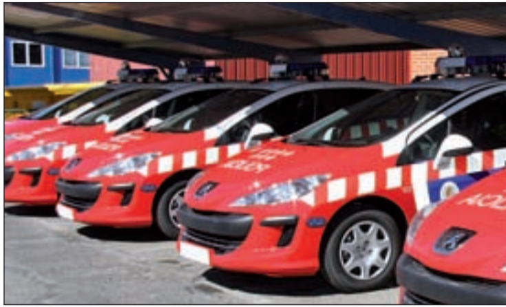
El dispositivo lo lleva a cabo la Policía Local Uniformada