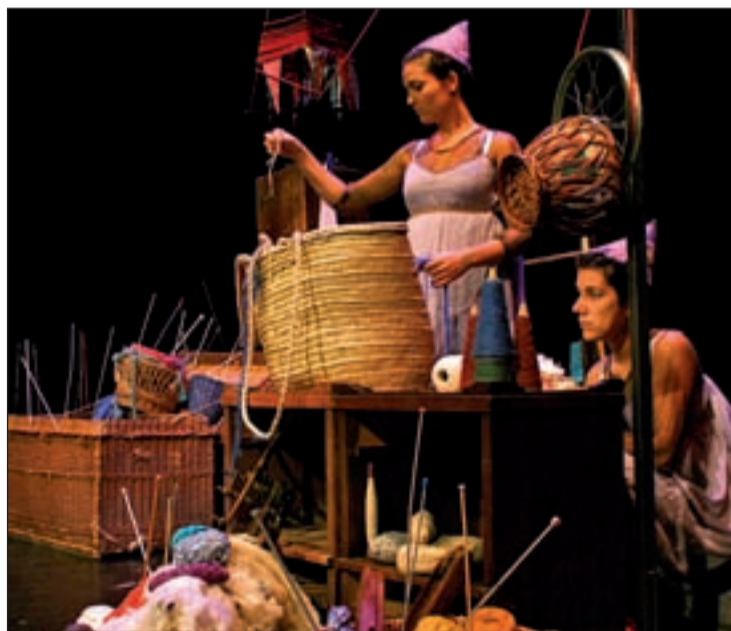
Una escena de la obra

El espectáculo reconstruye la historia de 'la Bella' desde el punto de vista de "las hadas 12 y