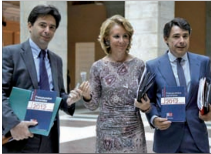
Los presupuestos 2012 recogen recortes para rebajar la deuda