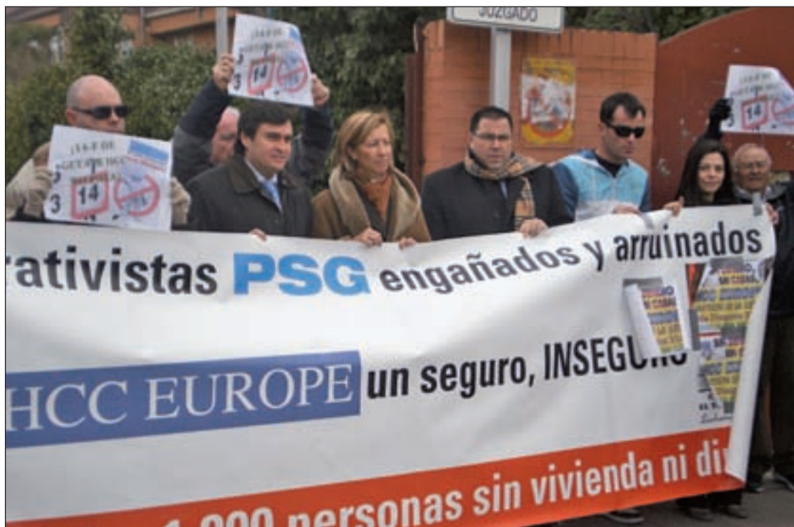
Concentración reciente de cooperativistas afectados

En estos eventos los alumnos exponen los proyectos de creación de empresas que han realizado en sus centros con la colaboración de profesores y técnicos de GISA, y se les ofrece la posibilidad de defender una idea de proyecto ante un colectivo de gente en los mismos términos que tendrán que hacer en un futuro si así lo deciden. El jueves le tocó el turno a los alumnos del instituto de educación secundaria Alarnes, y este viernes 16 de marzo lo harán los institutos del ciclo de formación profesional del Inglan, en el Centro Municipal de la Mujer (ubicado en la calle San Eugenio, 8). El programa está dirigido a estudiantes de bachiller, ciclos formativos, escuelas taller, últimos cursos de educación secundaria obligatoria y universidad.