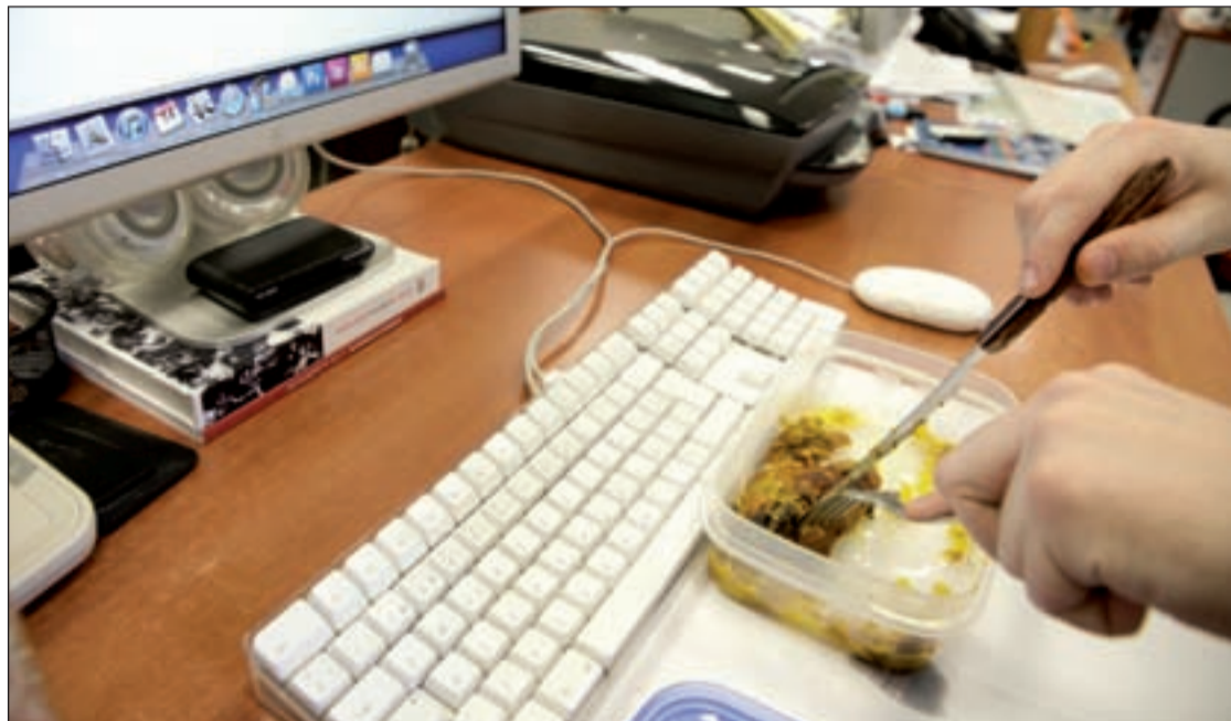
Un trabajador come en su oficina

Pero no son las únicas. Pablo atraviesa sol, bolsa en mano. Se