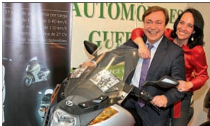
Soler y Gómez-Acebo, Directora General de Comercio, en la feria

A la feria concurren, según el Ayuntamiento, más de 40 stands dedicados a los sectores del textil, calzado, decoración, muebles, alimentación, perfumería, óptica, joyería, automoción, imprenta, o servicios, entre otros. Los visitantes también podrán acceder a la zona de ocio y restauración, así como a una área infantil en la que habrá monitores, talleres infantiles, pinturas e hinchables para los más pequeños. El evento, que busca dinamizar el comercio local, está pa-