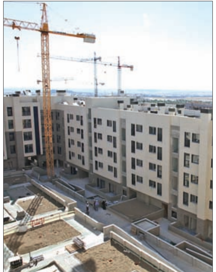
Construcción de viviendas en Los Molinos

Plata apunta que la edificación de las parcelas ha seguido "los más estrictos criterios de sostenibilidad y eficiencia energética". Durante la visita intercambió opiniones con los propietarios de las viviendas sobre la calidad de los pisos y señaló, junto a los adjudicatarios, "la cuidada estética y las grandes posibilidades que ofrecen las casas, que cuen-