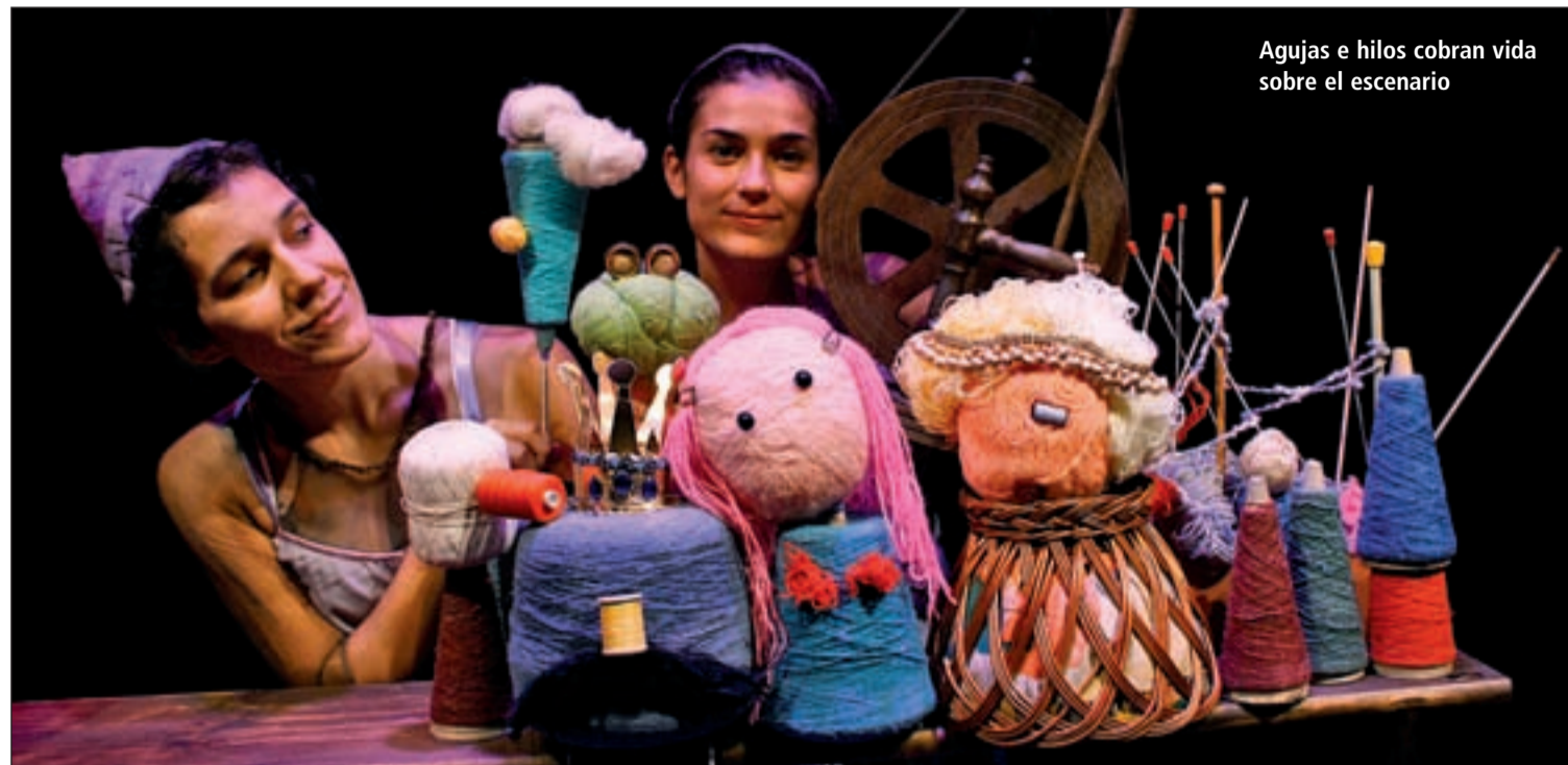
Agujas e hilos cobran vida sobre el escenario