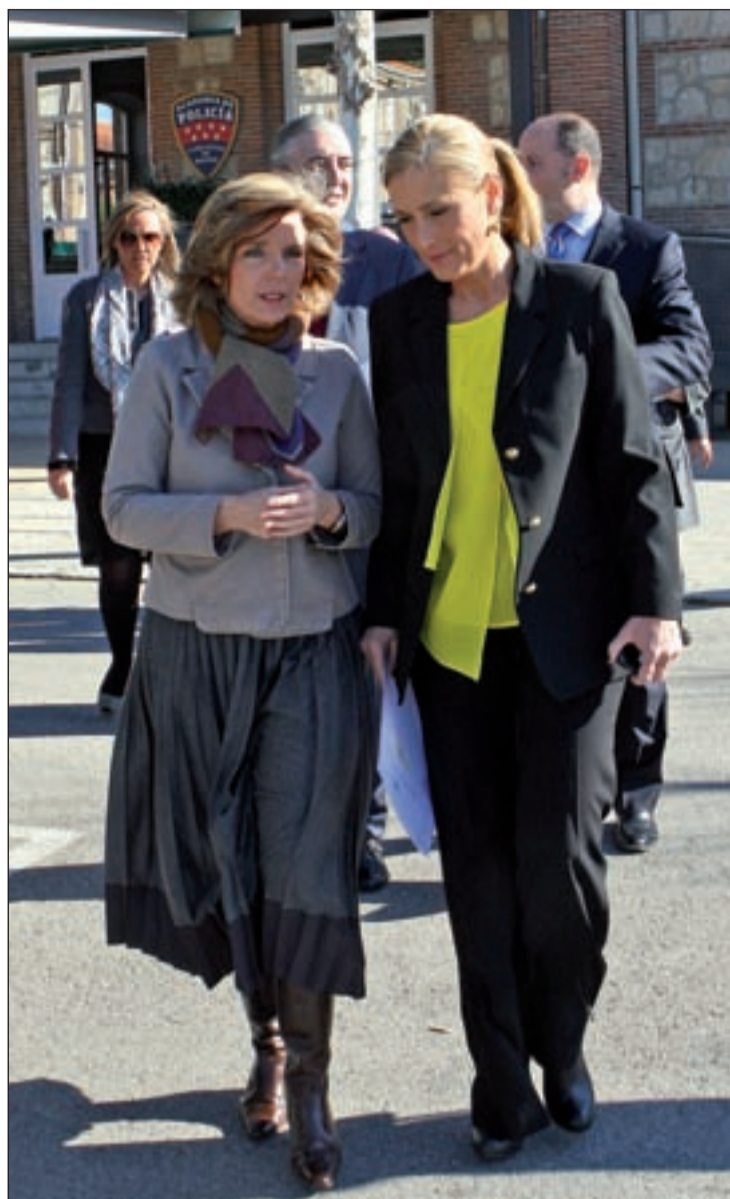
La delegada del Gobierno y la consejera de Presidencia

intensificará la colaboración con las restantes administraciones públicas y con la autoridad judicial para prevenir y para perseguir este tipo de actuaciones y también reforzará la coordinación entre los 21.000 agentes del Cuerpo Nacional de Policía y de la Guardia Civil que velan por la seguridad de la capital y los municipios madrileños, y los miembros