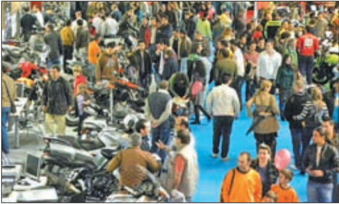
El evento reunirá a lo más granado del sector

DEL 30 DE MARZO AL 1 DE ABRIL EN LA CASA DE CAMPO