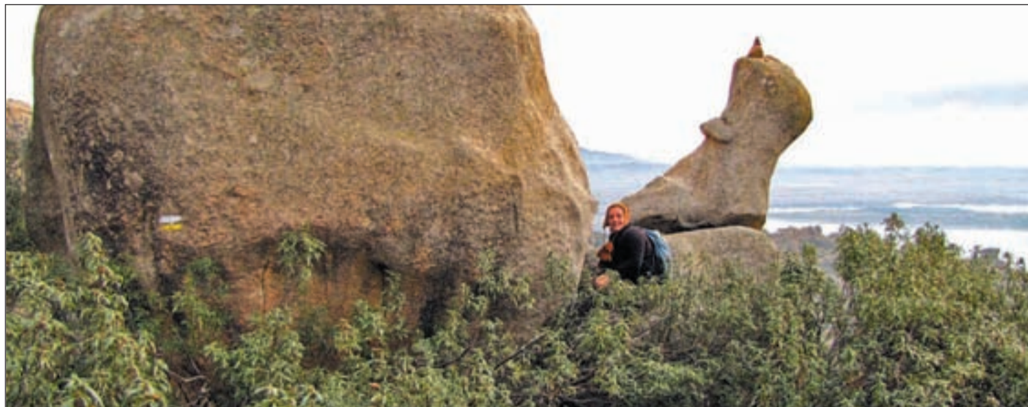
Una instantánea de la panorámica que se puede observar en este paisaje madrileño