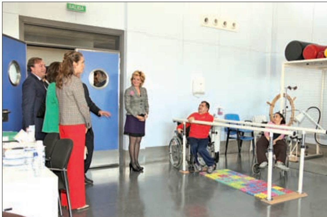
La Infanta Elena, junto al alcalde Juan Soler y Esperanza Aguirre, durante el recorrido por la residencia

Las nuevas plazas, financiadas por la Comunidad de Madrid, han supuesto una inversión de 3,7 millones de euros. En total, la