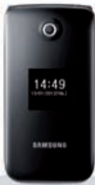
Samsung E 2530