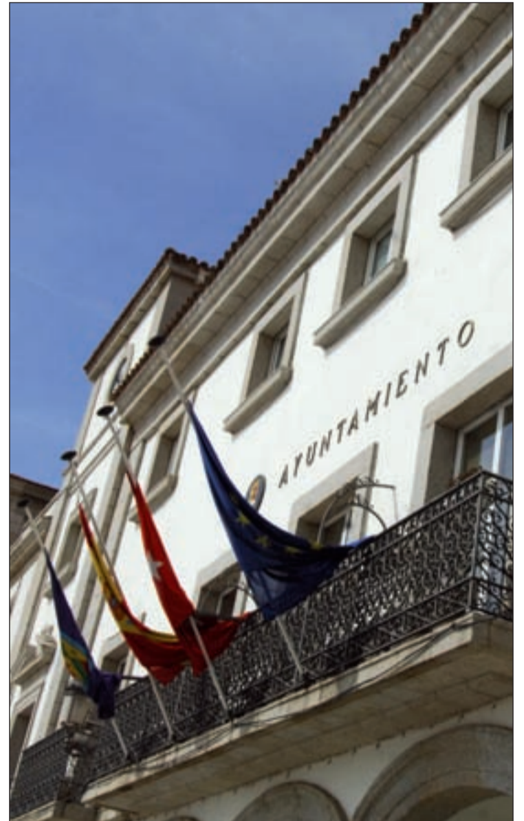
El Ayuntamiento de Colmenar tiene sus cuentas saneadas CHEMA MARTÍNEZ

Otro dato a tener en cuenta, es que Colmenar Viejo no tiene deuda histórica. En el año 2010, según recuerda el alcalde, "el