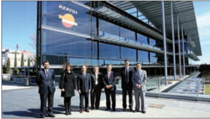
El ex alcalde y los representantes de Repsol en la sede tricantina

LA MULTINACIONAL ENERGÉTICA TIENE SU SEDE EN LA CIUDAD