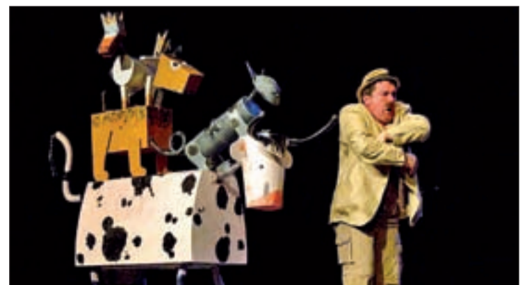
La obra esta destinada para los más pequeños de la casa