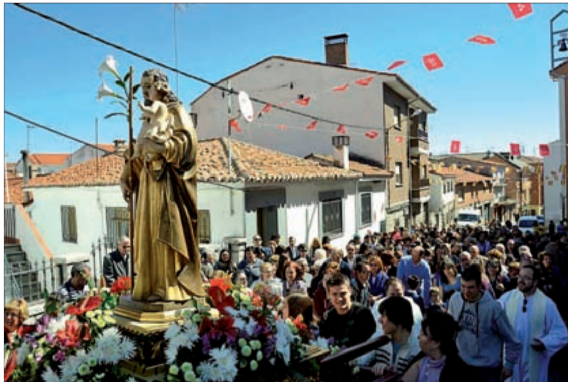
La procesión es seguida por muchos vecinos de Colmenar Viejo

El sábado 17 de marzo, los actos comenzarán en torno a las 10:00 h con un Concurso de Tortillas y Bizcochos, en el Rastrillo Solidario. Entre las 11:00 h y las 13:00 h, se organizarán diferentes actividades para los niños, como juegos y talleres, habiendo también castillos hinchables para los más pequeños. A las 19:30 h se oficiará una Misa y Triduo en honor a San José, amenizada por el grupo Los Monegros (Misa baturra). Ya para cerrar el día, a las 20:30 h, tendrá lugar una actuación de Bailes Regionales Interculturales, en el escenario montado para la ocasión en la