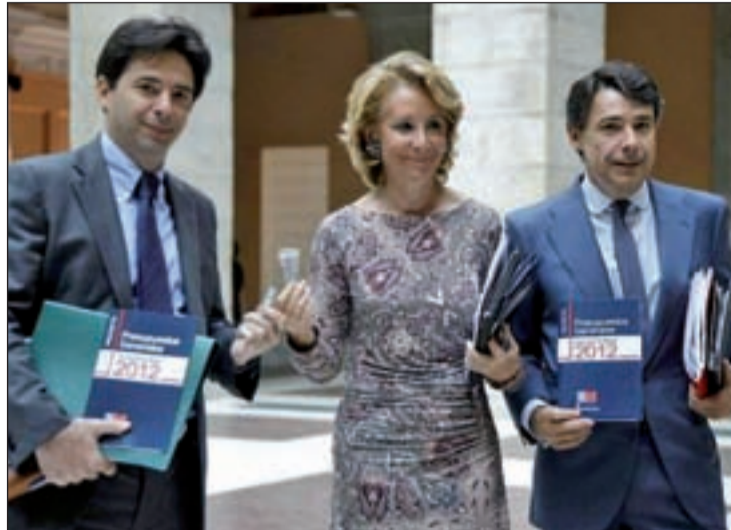
Los presupuestos 2012 recogen recortes para rebajar la deuda