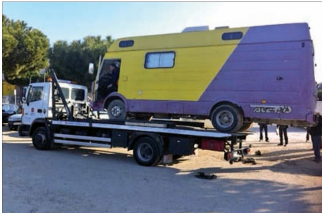
Una de las furgonetas retiradas de la explanada de las Eras, junto al Centro de Salud

Según los datos de la DGT, los controladores de velocidad son la mejor herramienta para disminuir el índice de siniestralidad. Un índice que en el caso de Boadilla del Monte se ha reducido un 30%, en los últimos tres años. Este resultado es gracias a las medidas que ha tomado el Consistorio, con el aumento de los reductores de velocidad en las vías más importantes del municipio. Esta iniciativa se ha tomado como respuesta de las nu-