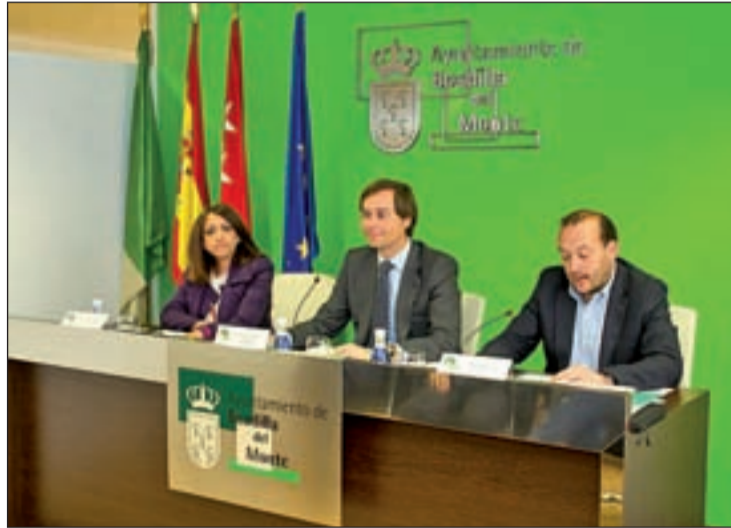
El alcalde de Boadilla durante la presentación de 'Da Luz a tu idea'

El ganador recibirá asesoramiento y las herramientas necesarias para poner en marcha su proyecto. Durante un año recibirá un espacio gratuito en la página web 'www.decomprasporboadilla.com'. Y para garantizar el futuro de la empresa, se le realizará un plan personalizado de marketing on line, "con desarro-