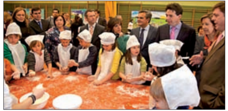
El consejero de Economía y Hacienda y el alcalde en uno de los talleres