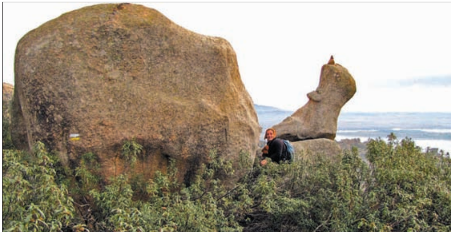
Una instantánea de la panorámica que se puede observar en este paisaje madrileño