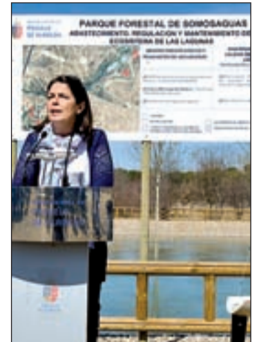
La alcaldesa, Paloma Adrados

La alcaldesa, Paloma Adrados ha sido la encargada de inaugurar el nuevo aspecto de las dos lagunas y ha asegurado que los trabajos de mejora han respetado las reglas medioambientales, con el "objetivo de aumentar la biodiversidad, mejorar el paisaje de la zona y las posibilidades de ocio de los vecinos". Una de ellas es la tradicional competición de vela con radio control. La Fed-