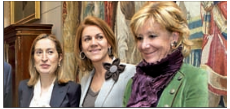
Ana Pastor con las presidentas de Madrid y Castilla La Mancha

El nuevo complejo de la estación de Atocha también se llevará parte de este dinero para conseguir su mantenimiento.