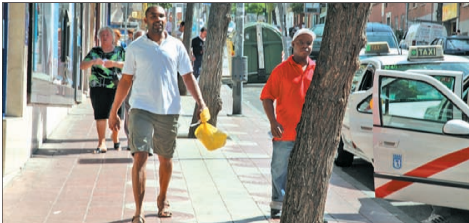
Los inmigrantes llegan al 40% en algunos municipios de la Comunidad de Madrid ANA MARÍA POMAR