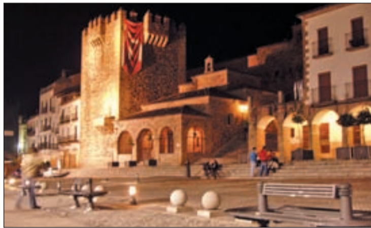
La plaza de Cáceres iluminada al anochecer

Por seguir con las grandes ciudades tampoco podemos perdernos el Madrid de los Austrias, donde podremos saludar a la diosa Cibeles o pasar por la Puerta de Alcalá. No podremos irnos de esta ciudad sin darnos