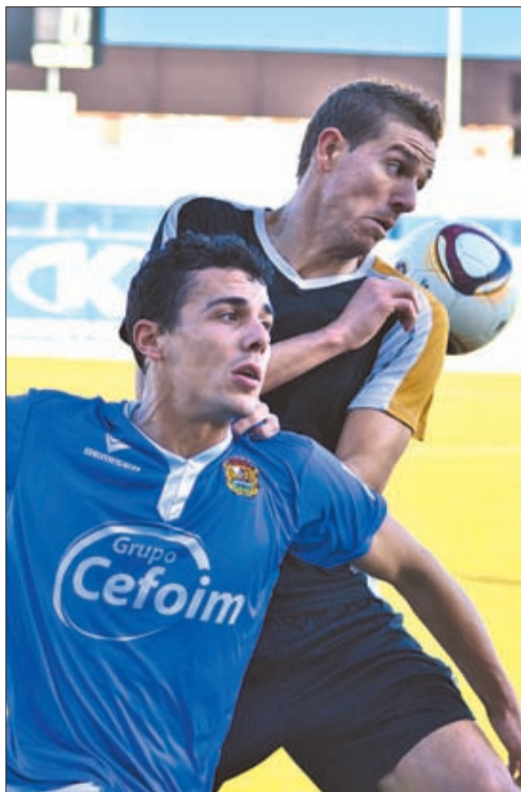
El Sport se mantiene en la zona tranquila