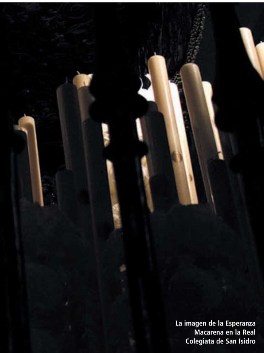
La imagen de la Esperanza Macarena en la Real Colegiata de San Isidro