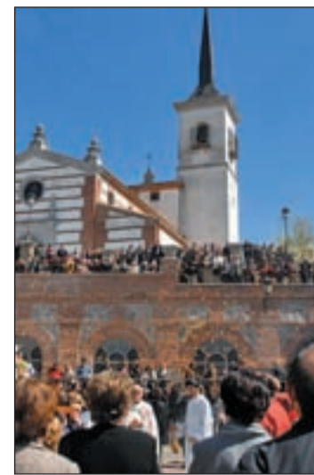
Plaza de la Coronación de Pozuelo

El diseño de las estampas ha ido acompasado a la evolución de los tiempos. Al principio, las Aleluyas eran pequeñas, de cartón y mostraban imágenes de santos. En los años 60 aumentaron su tamaño, pasaron a ser de seda y representaban los oficios más tradicionales de los madrileños y la vida de su patrón, San Isidro. Y en la actualidad son los propios vecinos los que partici-