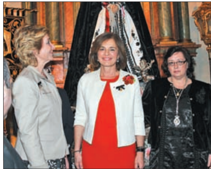
Aguirre y Botella ante la Virgen de la Soledad

En la historia de la congregación otras mujeres han tenido gran relevancia. Es el caso de Su Majestad Doña Isabel II, a la que se le ofreció la Presidencia de Honor. En 1866, sancionó los Estatutos de la Congregación y le concedió los títulos de Real e Ilustre.