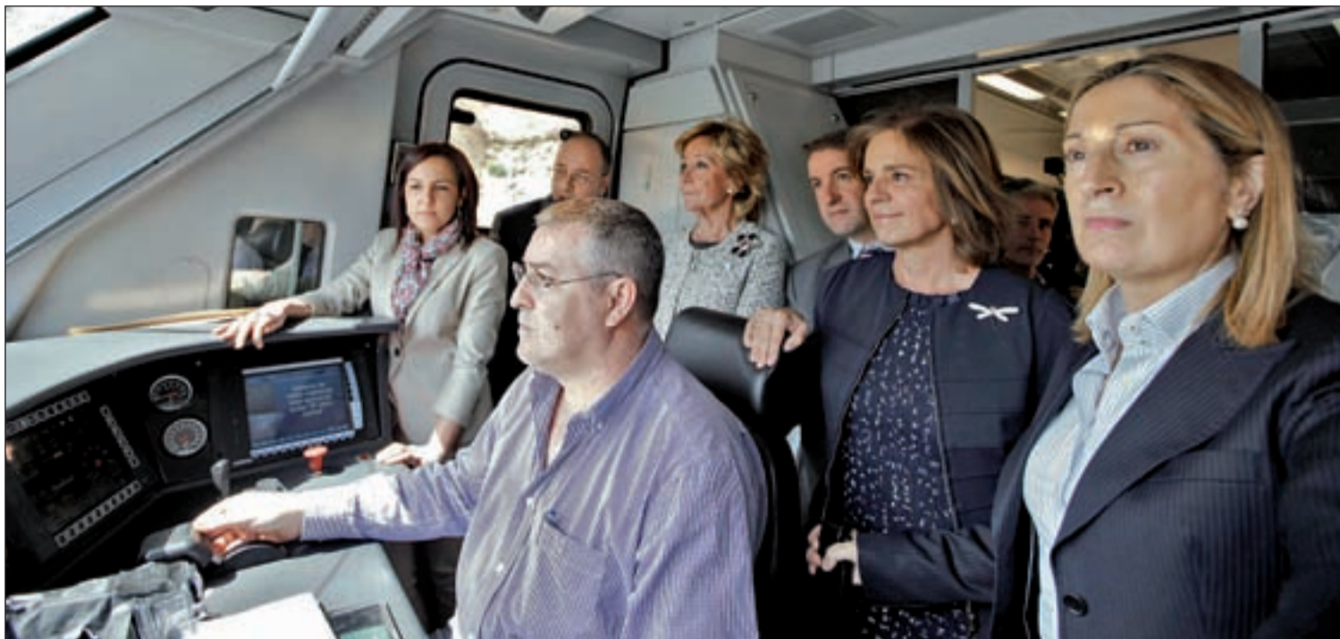
La ministra de Fomento, la presidenta de la Comunidad y la alcaldesa de Madrid en el trayecto entre Tres Cantos y Sol