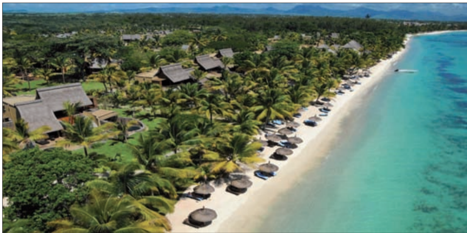
¿Por qué no salir de España? Beaachcomber Hotels, la principal cadena hotelera de Isla Mauricio, ha lanzado ofertas especiales para celebrar sus 60 años