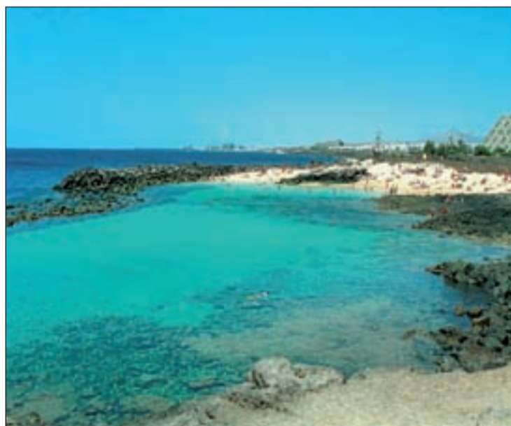
LAS CANARIAS, EL CARIBE OCCIDENTAL Este paraíso alojado en España cuenta con un clima suave y primaveral, además de temperaturas estables (unos 22°C) durante los 365 días del año, ¡siempre es una opción viable!

El portavoz de la AEMET, Fermín Elizaga, ha explicado que hasta el jueves predominarán también los cielos despejados y el tiempo seco y soleado por toda España, excepto en el área del Estrecho y