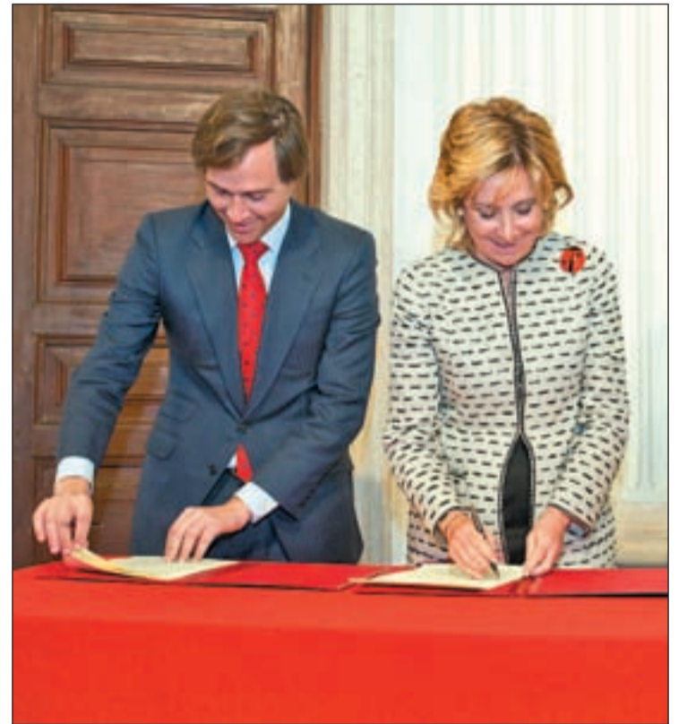
Momento de la firma del convenio en la planta baja del Palacio

Durante la visita al Palacio, ambos regidores fueron testigos directos del deterioro que ha sufrido el edificio en los últimos años. Agujeros en las paredes, fachadas inestables por el des-