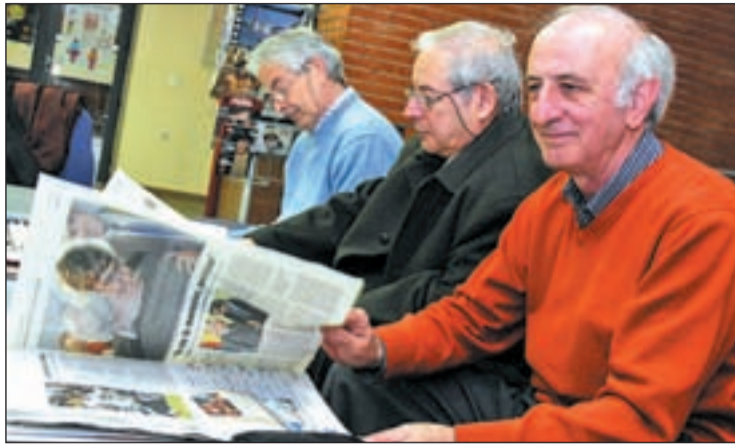
Los jubilados se ven afectados por las medidas del Gobierno FABIÁN OVIEDO