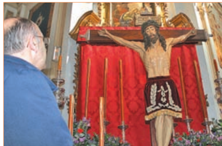
El Cristo de los Alabarderos en la Iglesia Catedral Castrense RAFA HERRERO

Pero los actos religiosos de la Semana Santa madrileña no se inician con los días festivos. El miércoles 4 de abril se celebra la procesión de Nuestro Padre Jesús de la Salud “Los Gitanos”, que parte de la Parroquia Nues-