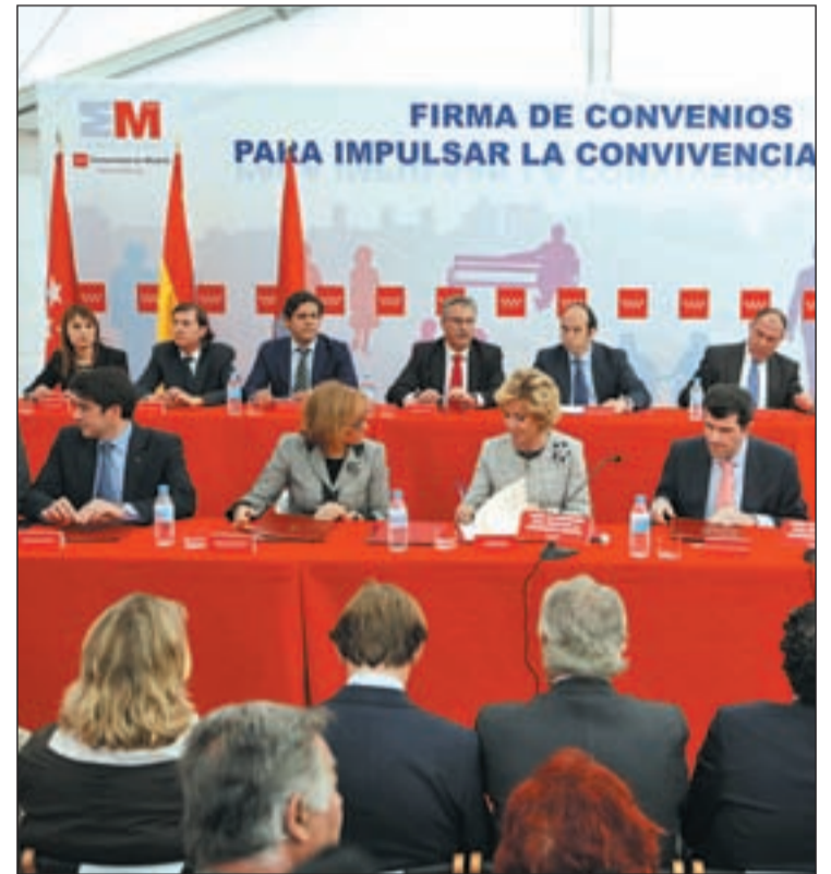
Aguirre firma los convenios con los alcaldes de varios municipios

Ahora, este servicio ha dado un paso más tras la firma de un convenio de colaboración entre la Comunidad de Madrid y los ayuntamientos de Alcorcón, Arganda, Ciempozuelos, Coslada, Collado Villalba, Fuenlabrada, Getafe, Leganés, Navalcarnero, Torrejón de Ardoz y Valdemoro, un convenio que también se hizo extensivo a Alcalá de Henares y Parla, que contribuirá a que es-