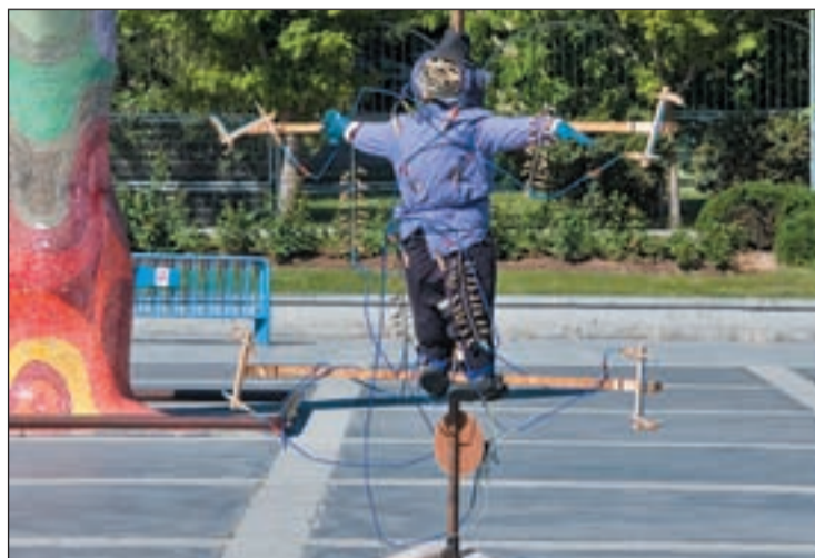
Momento de la quema en la Plaza de la Constitución de Majadahonda