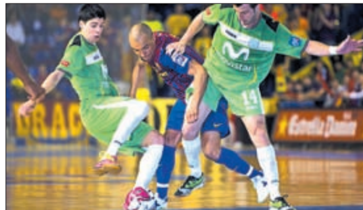
El equipo alcaláino se llevó los tres puntos del Palau LNF.S.ES

Sin embargo, la gran cita de la semana en el Pabellón Caja Madrid llegará este martes (21:00 horas) en el partido de vuelta de las semifinales de la Copa del Rey. En ese encuentro, los interesados deberán remontar el 3-1 adverso que se trajeron del partido de ida, por lo que intentarán repetir su actuación liguera del Palau para jugar una final en la que se vería las caras con el vencedor del Lobelle-ElPozo.