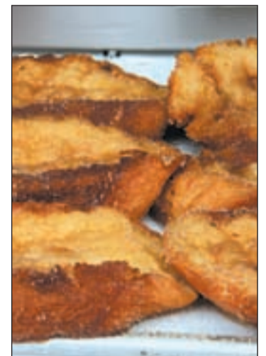
Las torrijas son clásicas

Propias de Cataluña y Valencia principalmente, son las Monas de Pascua. En Valencia también es conocida como pan quemado o Toña. Se hace una masas