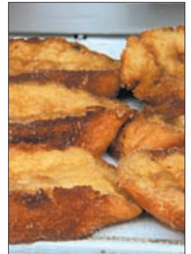
Las torrijas son clásicas

Propias de Cataluña y Valencia principalmente, son las Monas de Pascua. En Valencia también es conocida como pan quemado o Toña. Se hace una masas