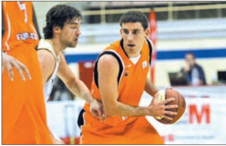
El equipo de Fisac jugará el martes su partido aplazado