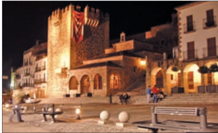
La plaza de Cáceres iluminada al anochecer

Por seguir con las grandes ciudades tampoco podemos perdernos el Madrid de los Austrias, donde podremos saludar a la diosa Cibeles o pasar por la Puerta de Alcalá. No podremos irnos de esta ciudad sin darnos