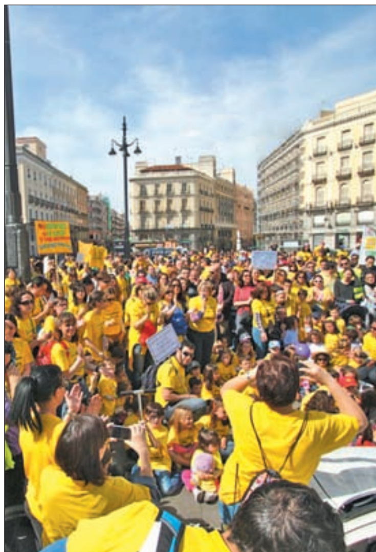
Manifestación de las AMPAS en Sol, el pasado domingo

En este colegio, la Consejería ha habilitado seis aulas, pero queda pendiente una segunda fase que comprende otras doce aulas, un gimnasio y un comedor, de las que ni siquiera hay todavía indicio de obras, tan solo la promesa de la dirección de