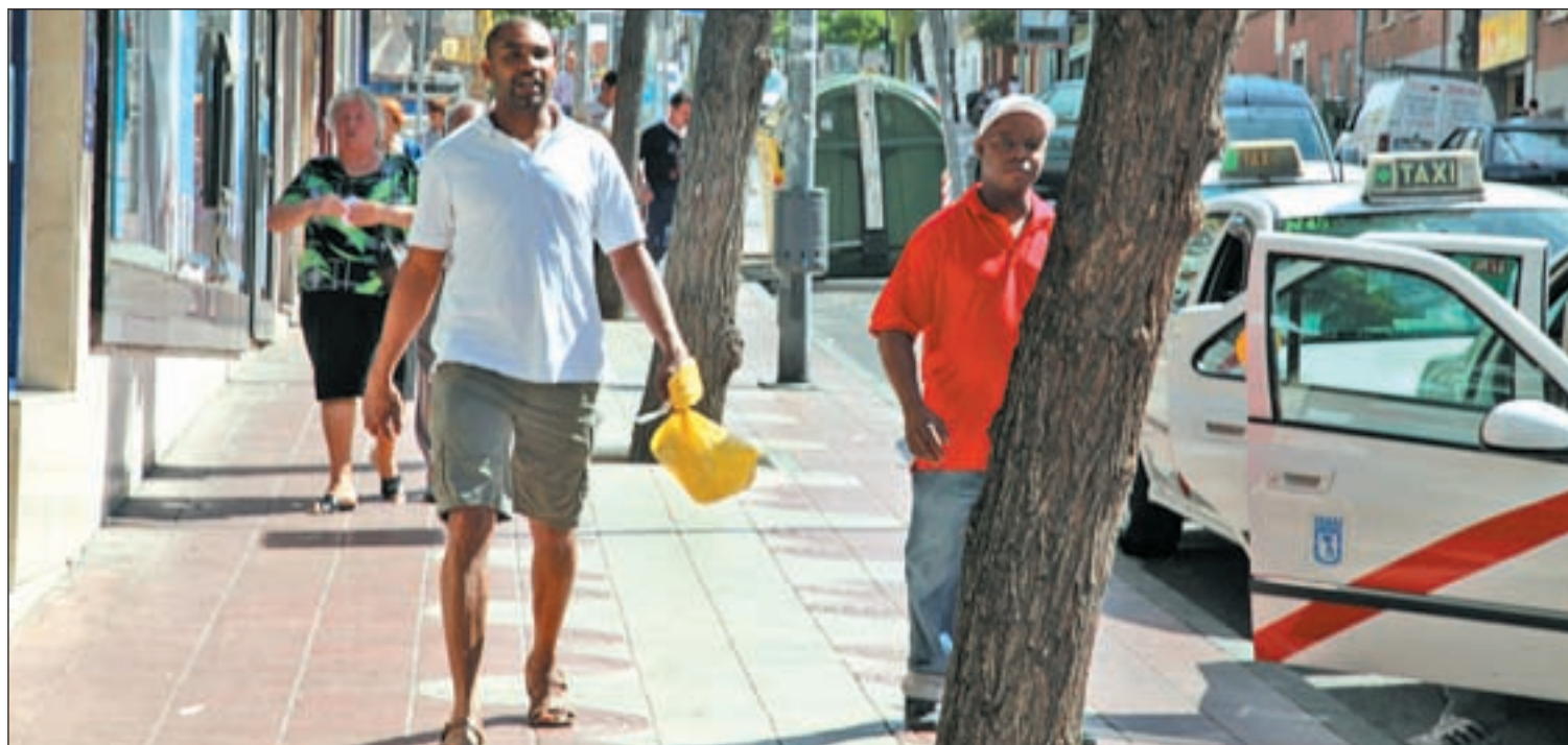
Los inmigrantes llegan al 40% en algunos municipios de la Comunidad de Madrid ANA MARÍA POMAR