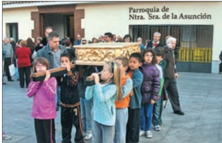
Imagen de los pequeños durante los ensayos

El paso saldrá de la propia parroquia ubicada en la plaza de Ernesto Peces y recorrerá la travesía de Ricardo Médem, la calle Antonio Hernández, la plaza del Pradillo y la calle Sitio de Zaragoza, para retornar nuevamente por la travesía de Ricardo Médem hasta la plaza de Ernesto Peces, donde la comitiva pondrá fin a esta iniciativa que cumple