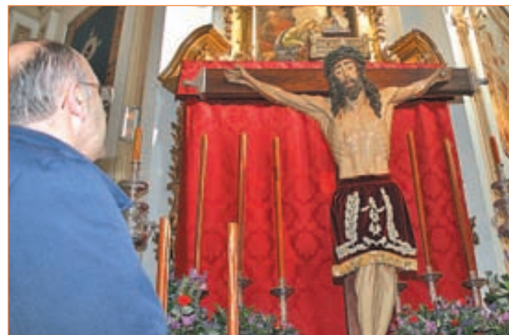
El Cristo de los Alabarderos en la Iglesia Catedral Castrense RAFA HERRERO

Pero los actos religiosos de la Semana Santa madrileña no se inician con los días festivos. El miércoles 4 de abril se celebra la procesión de Nuestro Padre Jesús de la Salud “Los Gitanos”, que parte de la Parroquia Nues-