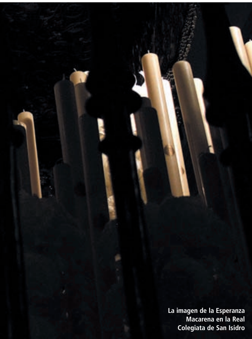
La imagen de la Esperanza Macarena en la Real Colegiata de San Isidro