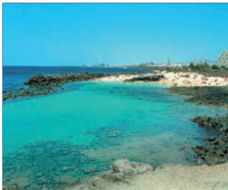
LAS CANARIAS, EL CARIBE OCCIDENTAL Este paraíso alojado en España cuenta con un clima suave y primaveral, además de temperaturas estables (unos 22°C) durante los 365 días del año, ¡siempre es una opción viable!

El portavoz de la AEMET, Fermín Elizaga, ha explicado que hasta el jueves predominarán también los cielos despejados y el tiempo seco y soleado por toda España, excepto en el área del Estrecho y