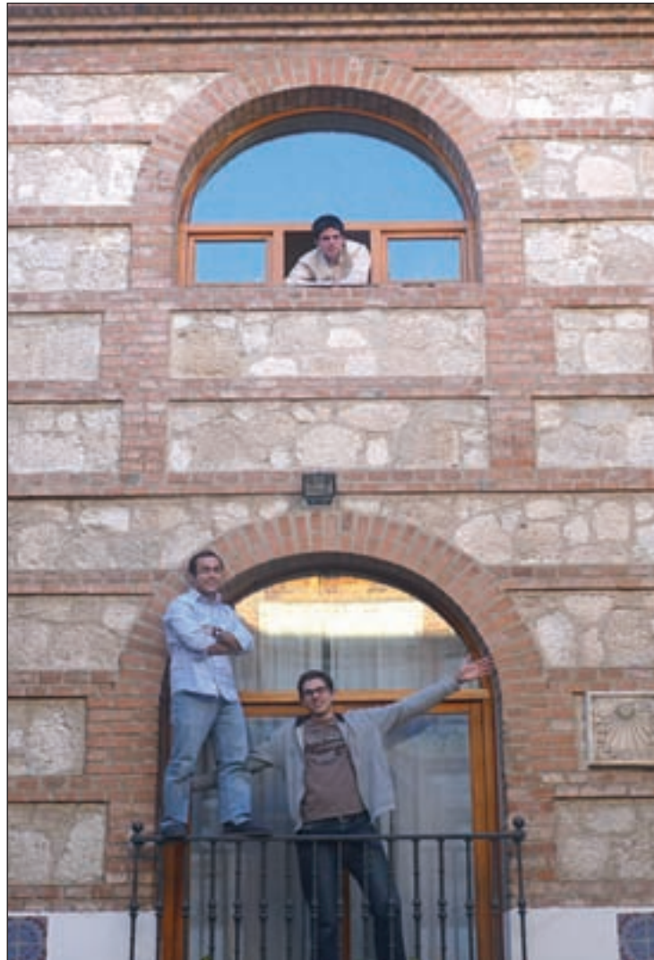
Jóvenes residentes en el seminario de Nuestra Señora de los Apóstoles

Sin embargo, no son suficientes, a pesar de que hace sólo unos días la Conferencia Episcopal anunciaba un aumento del 4,2% de seminaristas mayores en el curso 2010-2011. La vocación al sacerdocio preocupa y mucho.