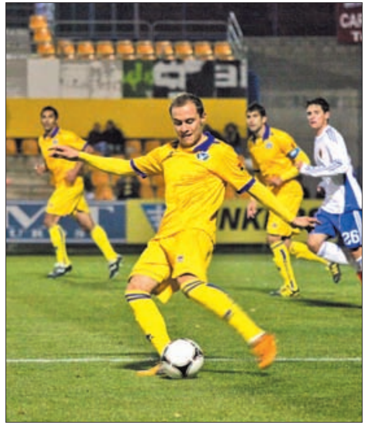
El equipo alfarero jugará otra vez fuera de casa

El equipo que también parece decidido a ponerle un poco de picante al tramo final de la campaña es el Alcorcón. Los hombres de Anquela sacaron tres puntos de oro en su visita al campo del Recreativo de Huelva y por primera vez en lo que va de temporada se pudo escuchar al técnico jienense hablar de "soñar con algo bonito", aunque sin perder de vista que el objetivo principal "es conseguir la salvación cuanto antes". Esta situación choca de lleno con la del ri-