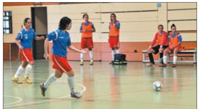
El FSF Móstoles no pasó del empate en casa

en Segunda División. En el grupo IV de esta categoría, el Ciudad de Alcorcón sigue marcando el ritmo. Las chicas de Ángel Orejón se impusieron con autoridad en el derbi ante el Leganes Masdeporte y mantienen una ventaja importante respecto a sus perseguidores antes de visitar al Ciudad de Ourense.