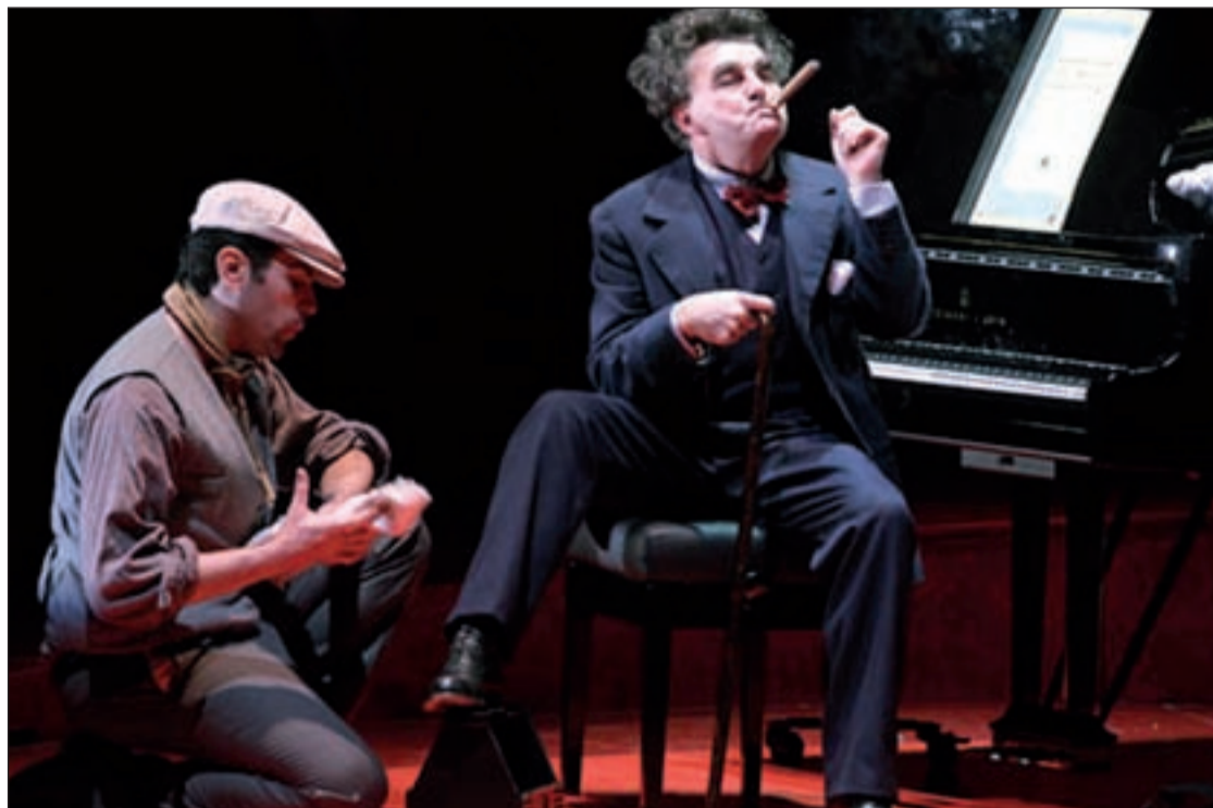
Antoni Comas como el compositor Amadeu Vives

Amadeu pone de manifiesto un combate generacional, con el