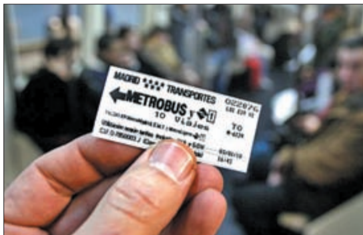
Un usuario con su metrobús

Sin embargo, el billete sencillo de la EMT mantendrá su precio en 1,50 euros. Será sólo el de los autobuses, porque este tipo de billete en el metro desaparecerá en mayo para dar paso a un nuevo título de transporte que será por estaciones. Así, si el usuario quiere recorrer un máximo de cinco estaciones, el precio del título se mantiene como hasta ahora, en 1,5 euros. No obstante, si el viajero va a utilizar entre 5 y 10 estaciones, el precio se le incrementará 10 céntimos por estación adicional hasta un máximo de 2 euros para quienes recorran diez o más.