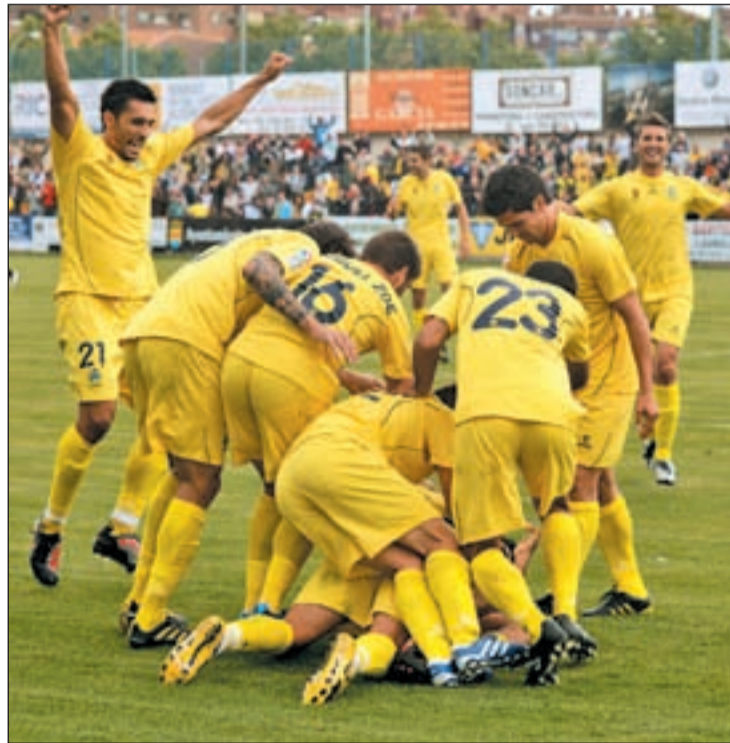
Los alfareros acumulan tres triunfos consecutivos

Pese a ser un equipo que en las dos últimas temporadas se ha movido por la zona peligrosa, el Nástic de Tarragona es uno de los pocos equipos de la categoría que puede presumir de no haber perdido aún contra el Alcorcón. El curso pasado arañó un empate a uno en Santo Domingo y en la vuelta acabó ganando por 2-0. El antecedente de la primera vuelta también es favorable a los tarraconenses que se llevaron los tres puntos de Alcorcón gra-