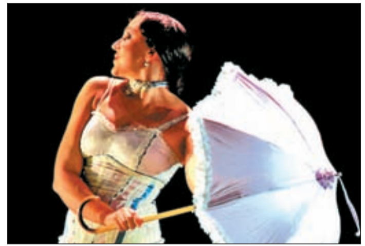
Escena del espectáculo firmado por Choni Compañía Flamenca

"Los dispositivos instalados, en caso de un incipiente fuego, emiten una señal acústica de alto volumen con objeto de alertar a los habitantes, especialmente en horario nocturno, que es cuando se produce el mayor número de víctimas por incendio en España", explican desde el Consistorio. Los bomberos de Alcorcón se encargarán de su puesta en marcha.