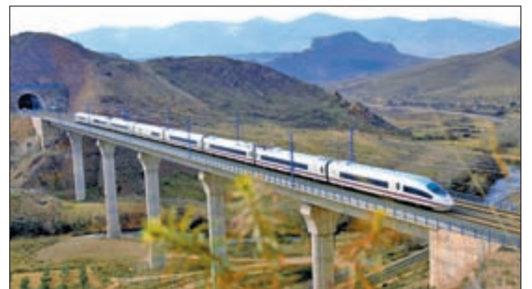
El eje Madrid-Valencia es una oportunidad para empresarios

Entre los elementos de colaboración "aún por potenciar y desarrollar", apuntaron al turismo y la cultura, con propuestas como la posibilidad de crear una noche cultural Valenciana en Madrid y una noche madrileña en Valencia para que cada región muestre en esa velada sus atractivos gastronómicos y culturales.