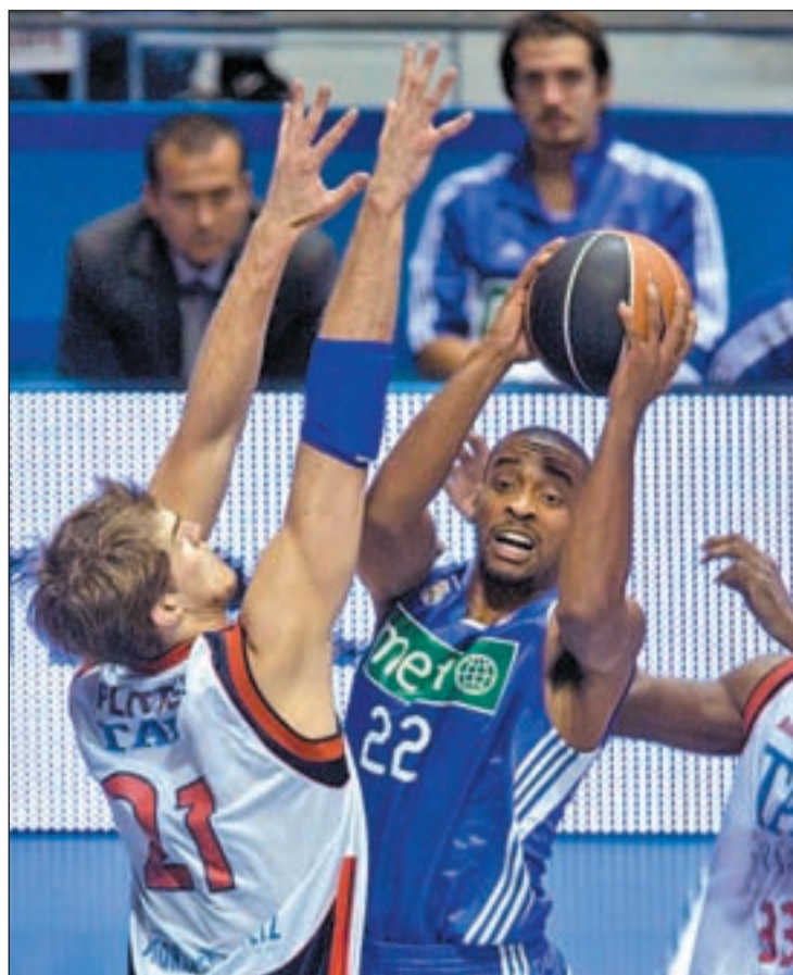
El americano ya brilló en el Real Madrid

Por su parte, el Real Madrid sigue haciendo gala de una irregularidad que ha sido aprovechada por el Barcelona para distanciarse en la cabeza de la clasificación. Los blancos cayeron en su visita a la remozada pista del Ca-