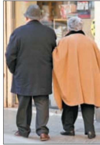
Los madrileños, los más longevos

La cifra, 83,4 años, supera con creces a todos los países de la Unión Europea y a la mayoría de las Comunidades Autónomas de España. En concreto, supera a