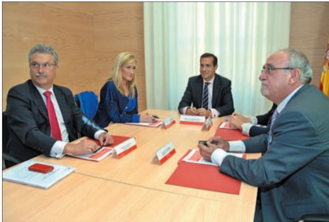
La delegada del Gobierno, el consejero de Asuntos Sociales y los alcaldes de Rivas y Coslada.

El plan consistirá en reuniones semanales de la Consejería de Asuntos Sociales con las demás administraciones.