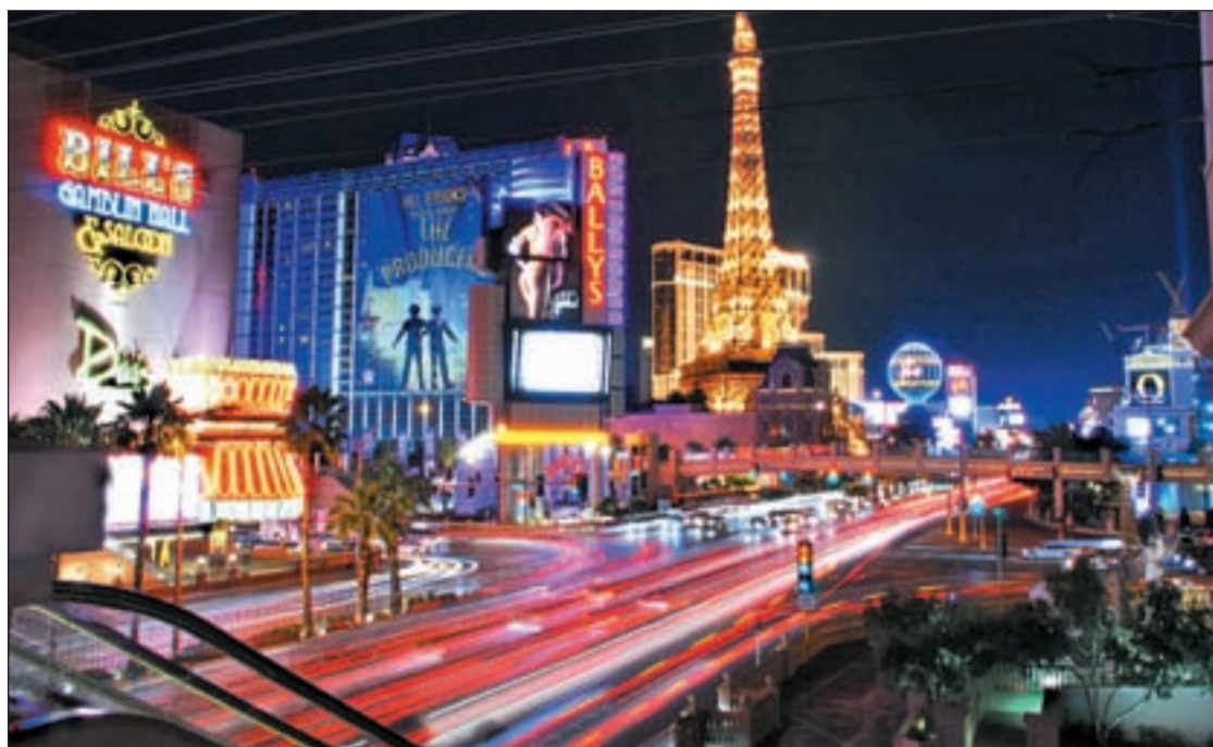
Una imagen de Las Vegas en Estados Unidos

En la cola, se encuentran las comunidades de Extremadura, con apenas un 37,8 por ciento, Navarra, con 36,9 por ciento, y, por último, el 25, 2 por ciento de los internautas de La Rioja.