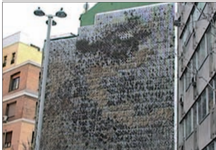
JARDÍN VERTICAL EN LA PLAZA DE LA LUNA Cuatro años han pasado entre la primera imagen y la segunda, y el deterioro en el jardín se aprecia a simple vista y se comprueba que el césped esta seco por falta de riego.