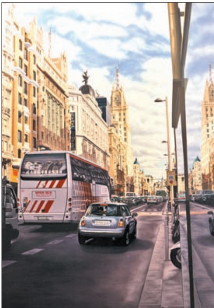
La Gran Vía madrileña retratada por José Miguel Palacio