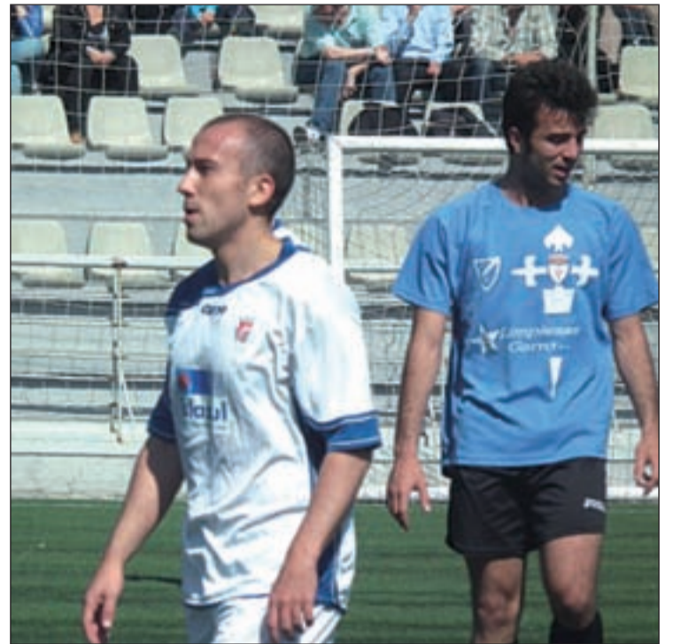
El Puerta Bonita se impuso a sus vecinos de Carabanchel JESÚS JIMÉNEZ

Ante esta igualdad, buena parte de las miradas se centrarán en el partido que este domingo jugarán el Carabanchel y el Parla en La Mina. Ambos equipos están empatados a puntos, por lo que su enfrentamiento directo podría deparar cambios en la zona alta. Además, otros dos candidatos como Puerta Bonita y Colonia Moscardó se ven las caras en