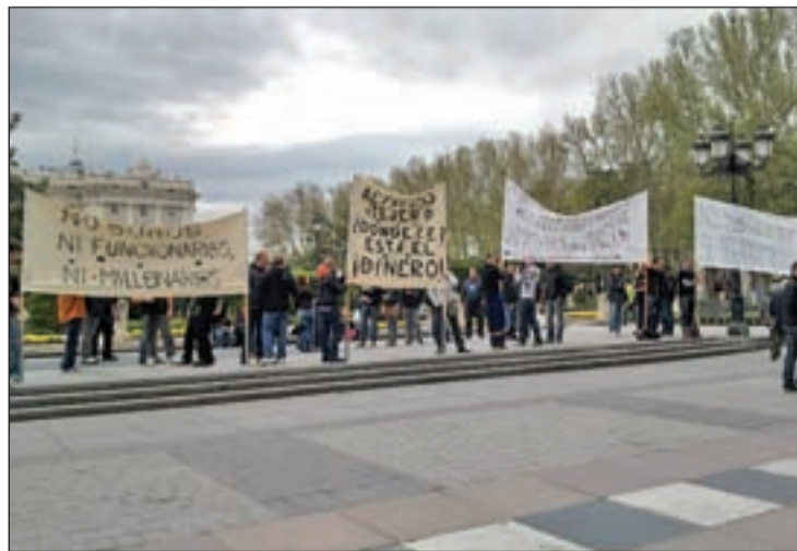
Protesta de los trabajadores a las puertas del Teatro Real GENTE

Los trabajadores del Real amenazan con una huelga durante las próximas representaciones de la ópera de "Cyrano de Bergerac", en la que actuará Plácido