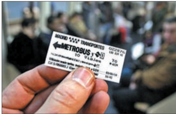
Un usuario con su metrobús

Sin embargo, el billete sencillo de la EMT mantendrá su precio en 1,50 euros. Será sólo el de los autobuses, porque este tipo de billete en el metro desaparecerá en mayo para dar paso a un nuevo título de transporte que será por estaciones. Así, si el usuario quiere recorrer un máximo de cinco estaciones, el precio del título se mantiene como hasta ahora, en 1,5 euros. No obstante, si el viajero va a utilizar entre 5 y 10 estaciones, el precio se le incrementará 10 céntimos por estación adicional hasta un máximo de 2 euros para quienes recorran diez o más.