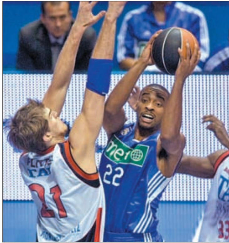
El americano ya brilló en el Real Madrid

Además, el Estudiantes también deberá seguir con atención a partir de ahora los partidos del