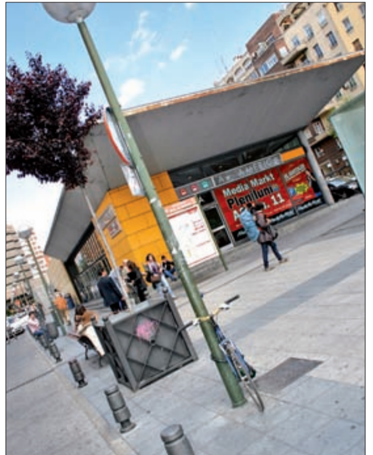
Exterior del Intercambiador de Avenida de América ROBERTO CÁRDENAS

Para los usuarios de vehículo propio se han facilitado unos itinerarios alternativos previstos mientras duren las obras de esta segunda fase. En el caso de sentido salida de Madrid, el Ayuntamiento recomienda utilizar la M-30 y a M-40 y desde la zona centro el paso inferior de María de Molina con acceso desde la propia calle y desde Velázquez. En el sentido entrada de la capi-