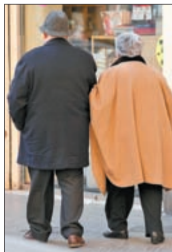
Los madrileños, los más longevos

La cifra, 83,4 años, supera con creces a todos los países de la Unión Europea y a la mayoría de las Comunidades Autónomas de España. En concreto, supera a