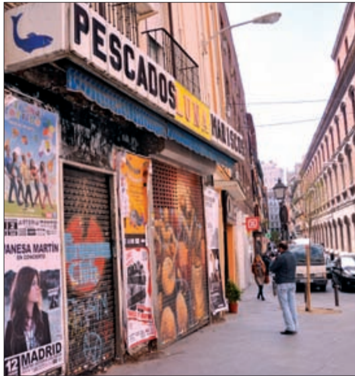
Pintadas en el barrio de Malasaña

Desde la Asamblea de Vecinos Barrio de la Universidad (ACIBU) critican la falta de actuación por parte del Ayuntamiento de Madrid, a quien reprochan la "falta de sensibilidad" a la hora de tomar decisiones ya que no tiene en cuenta a las asociaciones vecinales. "Hemos hablado con ellos y de vez en cuando limpian alguna pintada, pero resulta absurdo", asegu-