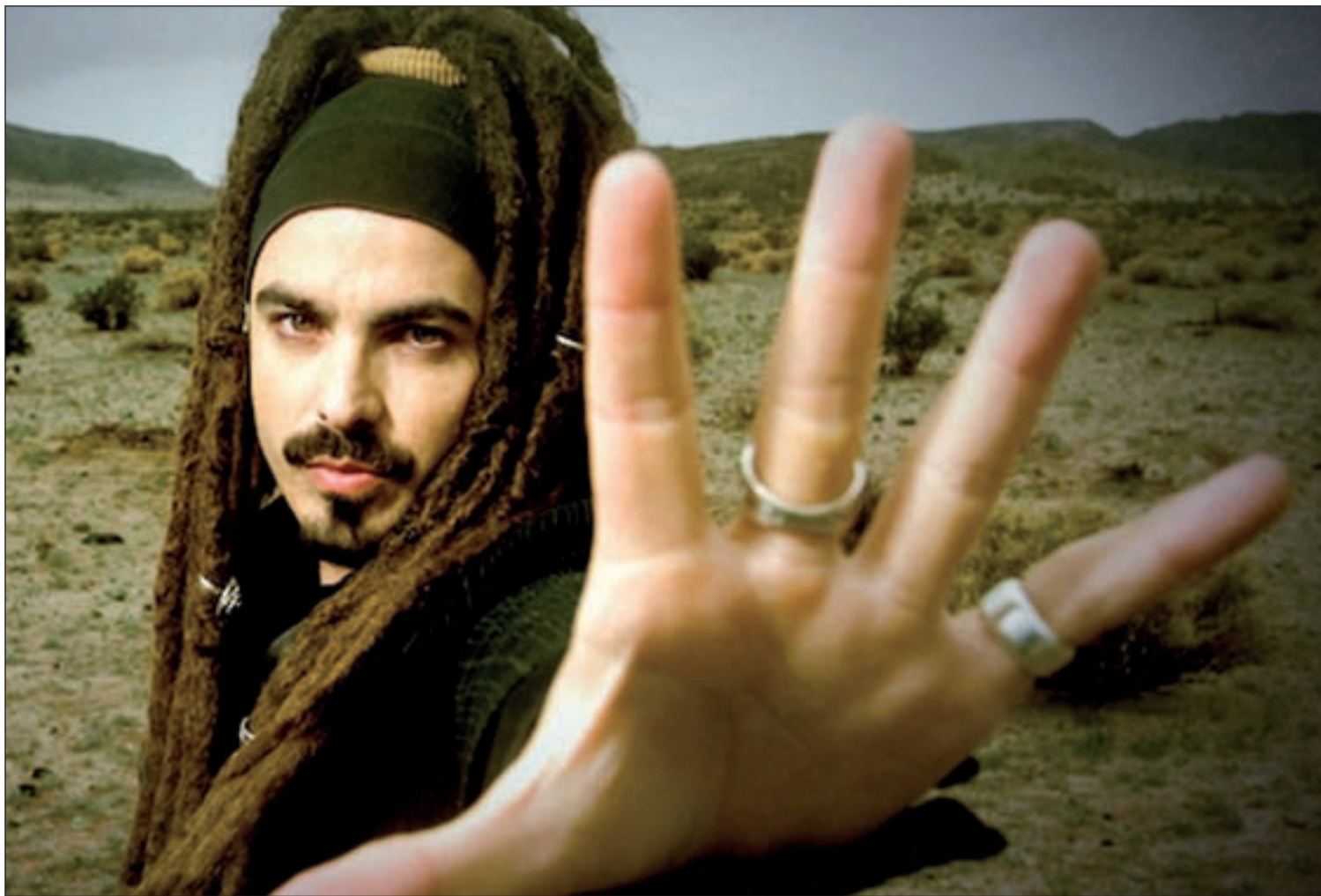
Huecco canta para ayudar a los demás y desde ahora se pone al frente de la Fundación 'Dame Vida'