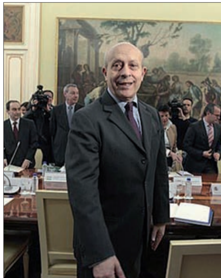
José Ignacio Wert, ministro de Educación

Por otra parte, Wert también ha propuesto aplazar la implantación de los módulos de 2.000 horas de Formación Profesional hasta el curso 2014-2015. También ha propuesto suspender la obligatoriedad de ofertar todas las opciones de Bachillerato y anular la creación de nuevos complementos retributivos del profesorado. Finalmente, ha señalado que las bajas inferiores a los diez días lectivos deberán ser cubiertas con los propios recursos del centro y no por interinos.