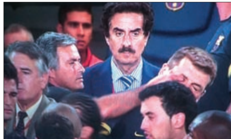
La vuelta de la Supercopa acabó en medio de una tangana

No se antoja sencillo, aunque en el caso de que Madrid y Barça dejen en la cuneta al Bayern y al Chelsea, respectivamente, el 'Clásico' de este sábado habrá sido, sin saberlo, un ensayo para lo que les espera en la capital bávara el próximo 19 de mayo.