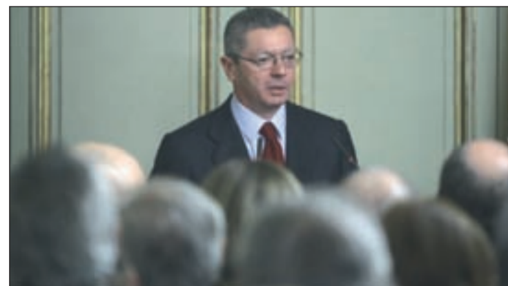
Alberto Ruiz-Gallardón, Ministro de Justicia