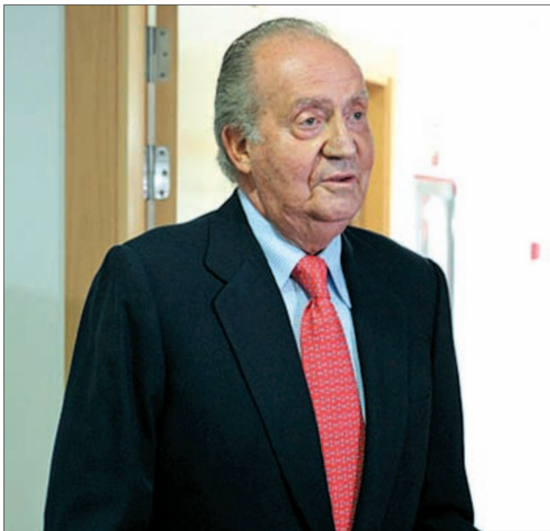
Don Juan Carlos, a la salida de la clínica donde se dirigió brevemente a los medios para disculparse

En un gesto sin precedentes, el Rey pide disculpas por su viaje para cazar elefantes. Reacciona así al malestar generado entre los ciudadanos Pág. 4