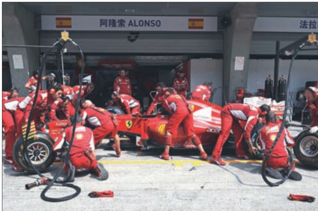
El equipo italiano está viviendo un comienzo de temporada complicado FERRARI ESPAÑA

Con la decisión de Bernie Ecclestone de celebrar esta prueba salvo que los dirigentes locales dijeran lo contrario, la polémica estaba servida. Mientras en el paddock parecía haber unanimidad respecto a no viajar a Bahrein en aras de la seguridad, el director ejecutivo de la Fórmula 1 volvió a hacer oídos sordos. Para aumentar las dudas, el mismo día en el que los equipos llegaban al país asiático, la ciudad de Manama regis-