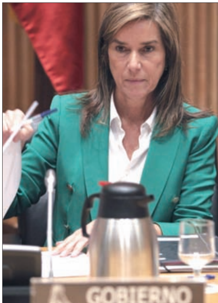
Ana Mato, Ministra de Sanidad, Servicios Sociales e Igualdad

La Ministra de Sanidad, Servicios Sociales e Igualdad, Ana Mato, ante estos datos, mostró su rechazo rotundo ante cual-