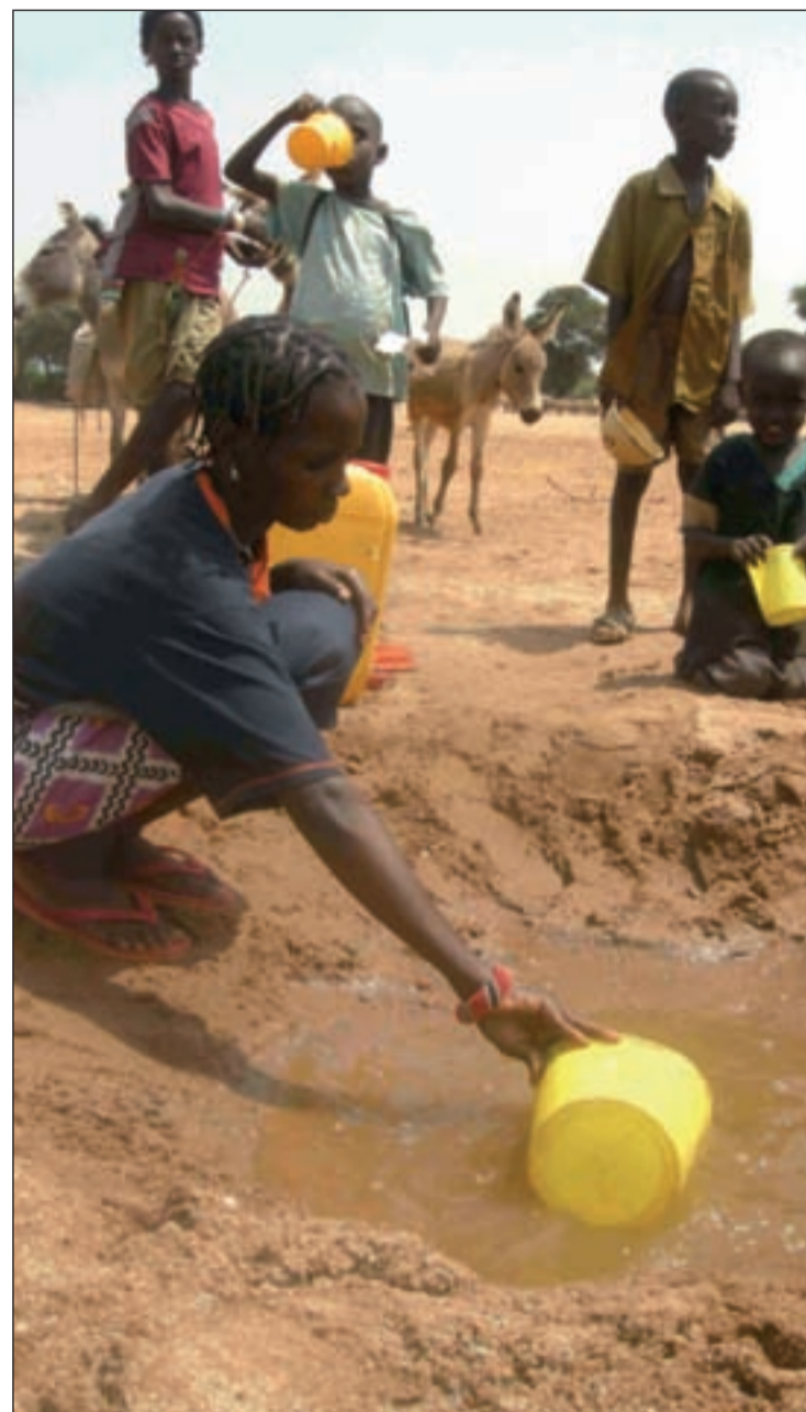
Unas 35 organizaciones podrían dejar de recibir financiación CÁRITAS

Por otro lado, entre las medidas que el ministro de Asuntos Exteriores y Cooperación, José Manuel García Margallo, avanzó durante el pasado mes de marzo