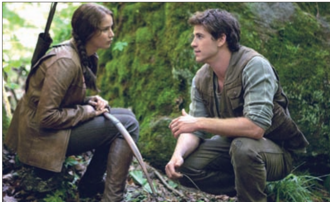
Jennifer Lawrence participará en 'Los juegos del hambre'