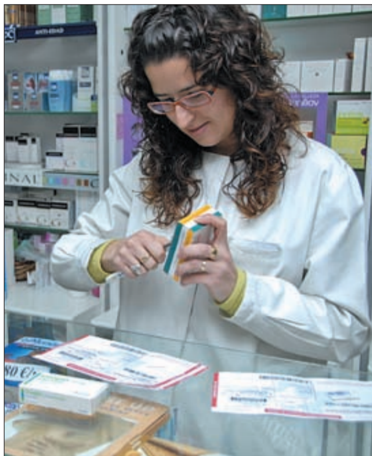
Recetas de jubilados

La ministra también habló con los consejeros autonómicos sobre la importancia de crear un Fondo de Garantía Asistencial. Este fondo cubriría los costes de la atención que los ciudadanos tuvieran que recibir en comuni-