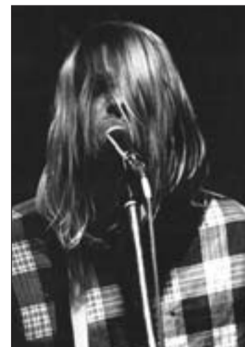
Incluye una versión desgarradora

"Yo estaba realmente emocionado con algunas de las cosas en las que estaba trabajando y quería escucharle en directo, por eso me entristeció tanto su muerte. Su talento se vio interrumpido... quién sabe lo que podría haber llegado a conseguir en la música", responde Erlandson, una