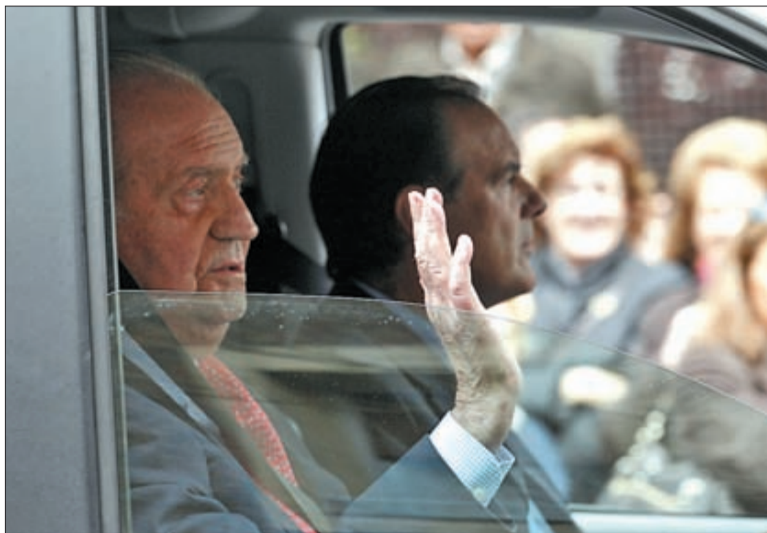
El Rey Don Juan Carlos a la salida del Hospital