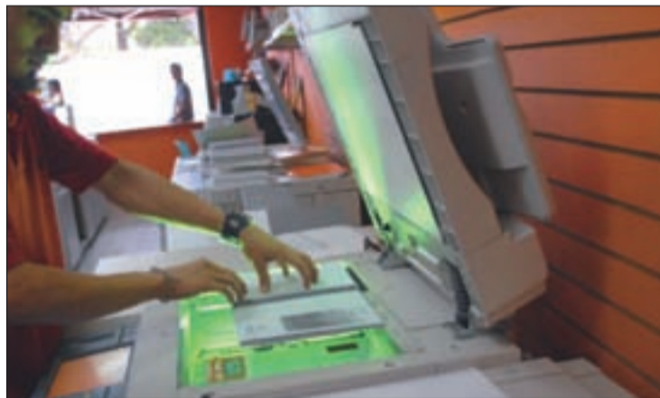
Sala de fotocopias de una universidad española

CEDRO afirma que algunas universidades públicas, y más concretamente las denunciadas, utilizan sus Campus Virtuales para la difusión de ciertas obras de manera ilícita sin respetar los