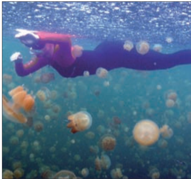
Medusas en su hábitat natural

El dolor es instantáneo y debemos limpiar la herida, pero nunca con agua dulce. Posteriormente hay que aplicar frío sobre la lesión durante unos 15 minutos y bastará con administrar un antiestamínico y un analgésico para el dolor.