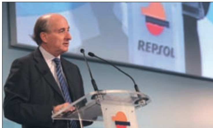
Antonio Brufau, presidente de Repsol

REPSOL EXPROPIACIÓN DE YPF POR ARGENTINA