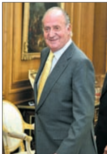
Don Juan Carlos

Don Juan Carlos recibió el alta hospitalaria el miércoles pasado, y desde entonces se ha sometido en Zarzuela a una intensa rehabilitación con fisioterapia para recuperarse de su operación de cadera. El jefe del Estado reanudó su trabajo de despacho nada más regresar a Zarzuela, el viernes mantuvo una de sus reu-