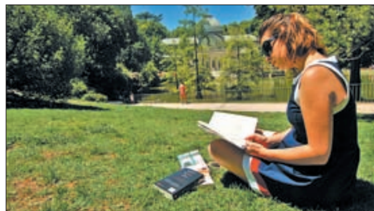
Mujer leyendo en un parque

triste" donde, a modo de nana en verso, Mistral expone la experiencia de una madre durmiendo a su pequeño. De su pluma también surgió "Obrerito", unos versos cantados por un hijo a su progenitora y dirigidos al futuro: "Madre, cuando sea grande, ¡ay..., qué mozo el que tendrás! Te levantaré en mis brazos, como el zonda al herbazal. O te acostaré en las parvas, o te cargaré hasta el mar, o te subiré las cuestras, o te dejaré al umbral", así comienza "Obrerito".