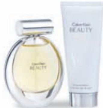
Cofre CALVIN KLEIN BEAUTY Eau de Parfum 50 ml + Luminous skin lotion 100 ml, 55 €