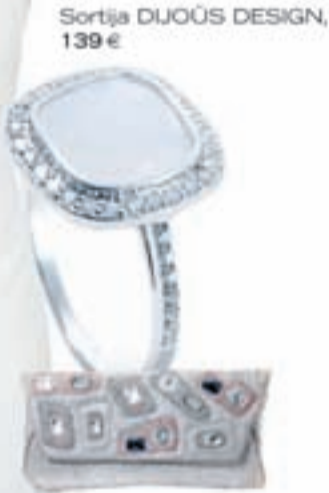
Sortija DIJOÛS DESIGN, 139 €