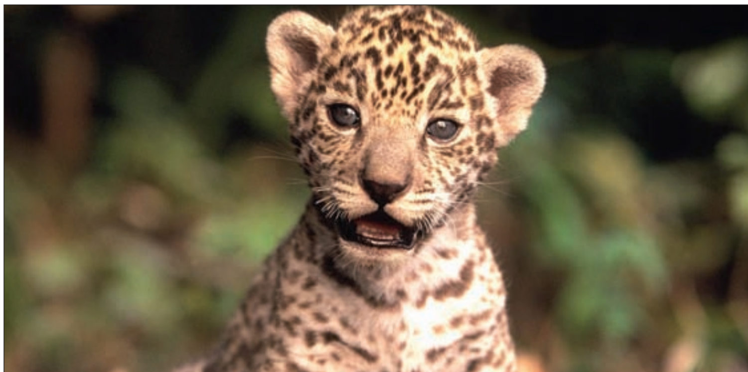
En Selwo Aventura (Estepona) es posible descubrir especies apasionantes como el guepardo