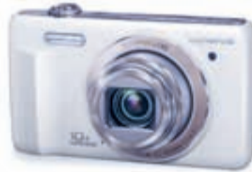
Cámara OLYMPUS VR 350. 16 megapíxeles, zoom óptico 10x, pantalla de 3", con estuche y tarjeta de 4 Gb, exclusiva en El Corte Inglés, 139 €