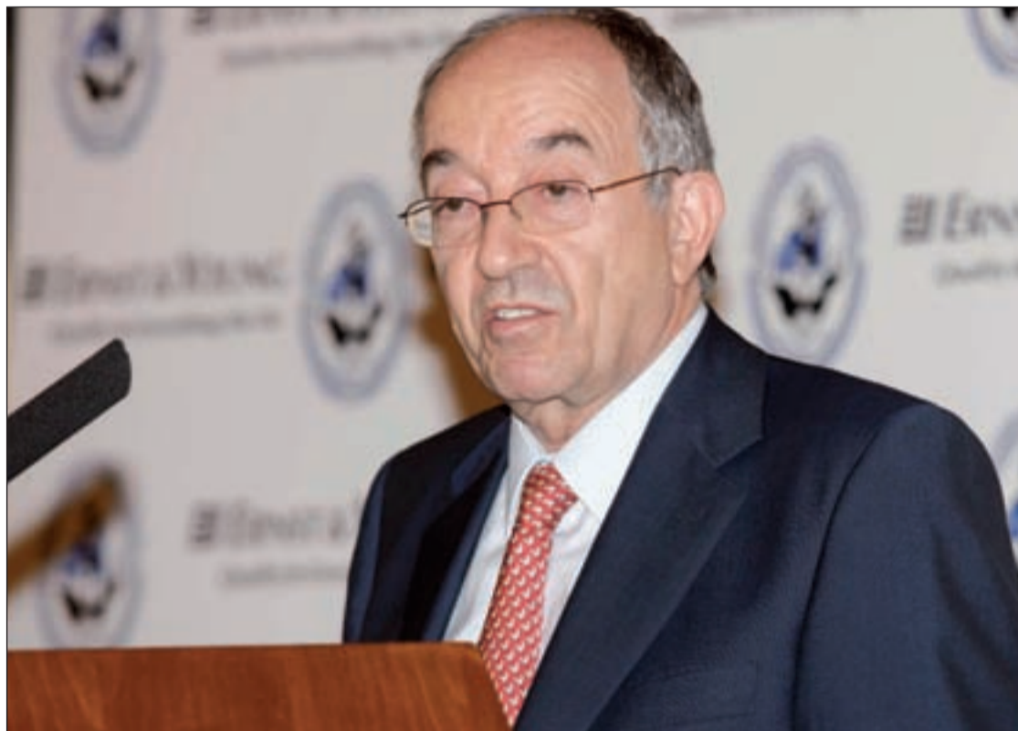
Miguel Ángel Fernández Ordóñez, Gobernador del Banco de España

Sin embargo, el gobernador del Banco de España, Miguel Ángel Fernández Ordóñez, insistió en que lo más importante es recuperar la confianza de los mercados y para ellos es imprescindible