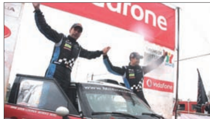
El cántabro firmó una gran actuación en Montecarlo

presente temporada, el segundo puesto obtenido en el rally de Montecarlo. En caso de sumar algunos puntos, el español superaría en la clasificación general a Latvala, precisamente el piloto que ha propiciado su participación en Argentina con Ford. El líder de la general sigue siendo el francés Sebastien Lœb.