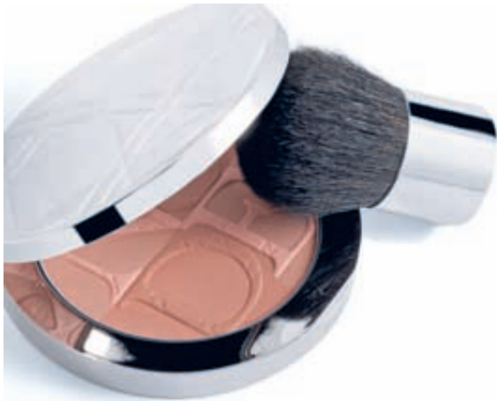
Polvera DIOR NUDE TAN BRONZE, 48,10 €