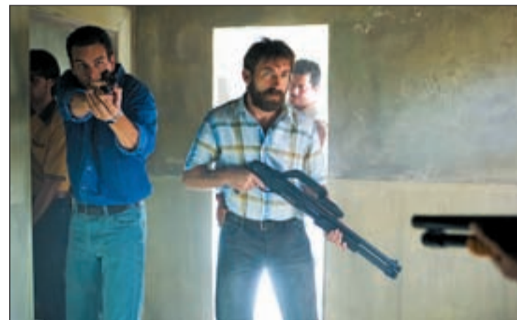
Casas y de la Torre, durante una escena de la película

Quizás uno de los aspectos más interesantes es la contradictoria relación entre el persona de Mario Casas que esta vez sorprende y para bien, y el de Antonio de la Torre, uno de los rostros con más talento del cine español. El primero, blando e inexperto, se verá sucumbido por la maldad y el poder y el segundo, de vuelta de este camino, buscará la redención.