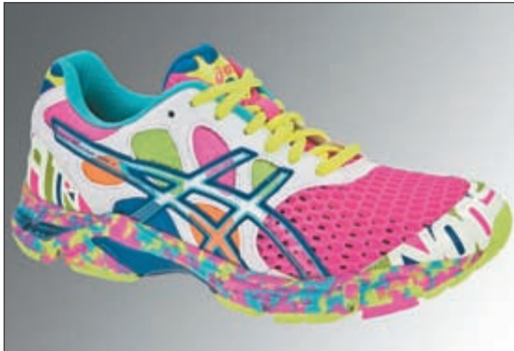
Nueva colección de Asics