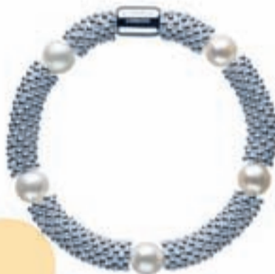
Pulsera LINKS OF LONDON, 285 €