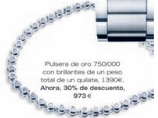
Pulsera de oro 750/000 con brillantes de un peso total de un quilate, 1390€. Ahora, 30% de descuento, 973 €