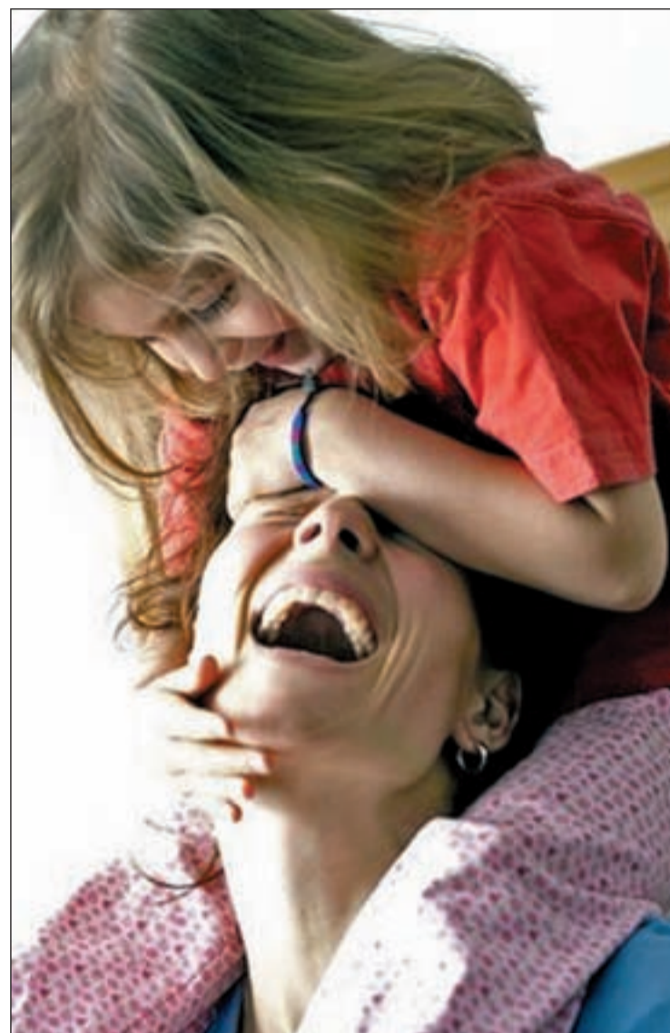
Madre e hija

Hoy en día muchas mujeres no están dispuestas a renunciar a su carrera para tener hijos, pero tampoco lo están a renunciar a su maternidad para desarrollar su carrera. De este modo, ha nacido un nuevo modelo de mujer capaz de compaginar su labor maternal con su actividad profesional. Sin embargo, la armonización de ambos roles ha dervi-