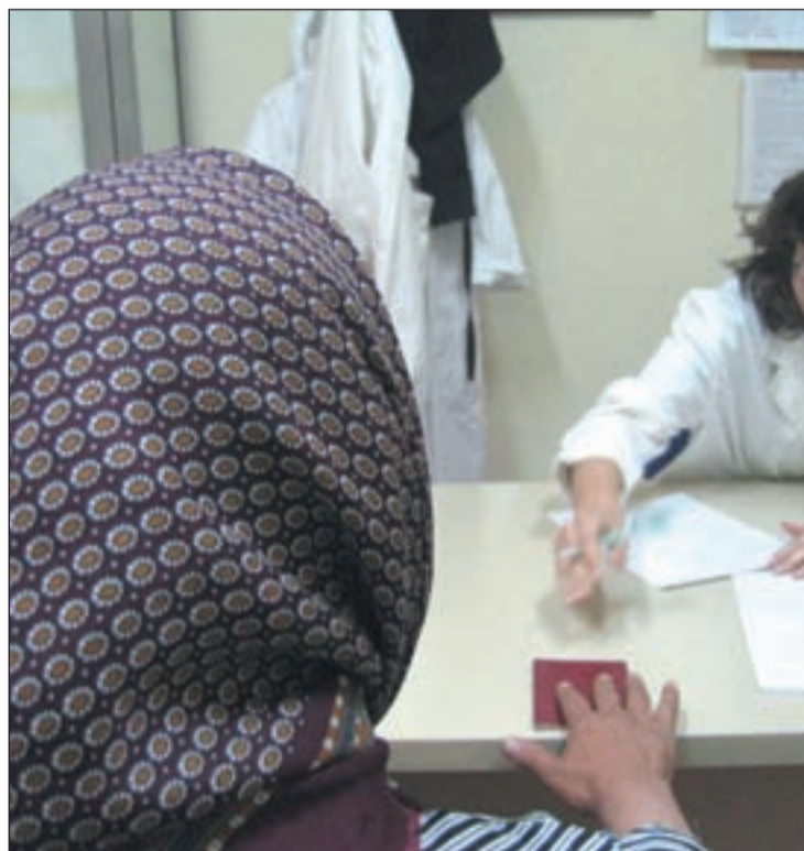
Una inmigrante en la consulta del médico

se recogiera en el artículo 12 de la Ley de Extranjería que los inmigrantes "inscritos en el padrón del municipio en el que tengan su domicilio habitual, tienen derecho a la asistencia sanitaria en las mismas condiciones que los españoles". Esta ley ha sido modificada anteriormente por el PP, pero sin tocar este artículo, hasta este momento. A partir del 31 de agosto las