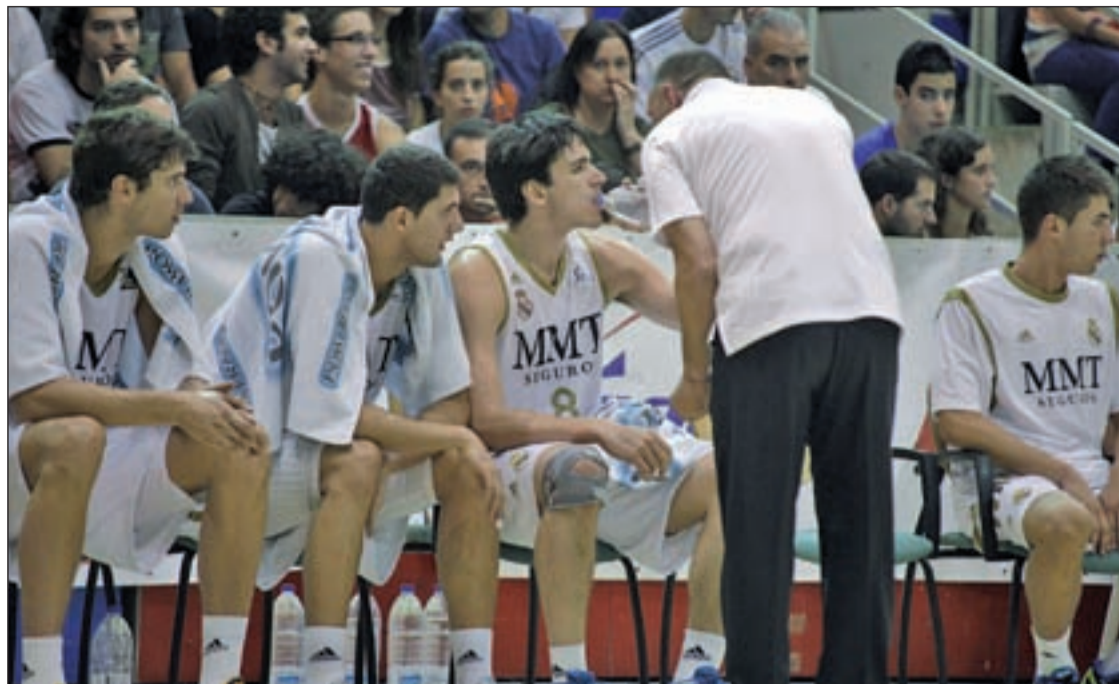
Salvo sorpresa, el Real Madrid acabará en segunda posición

LIGA ENDESA LAS ÚLTIMAS JORNADAS SE COMPRIMEN EN DOS SEMANAS