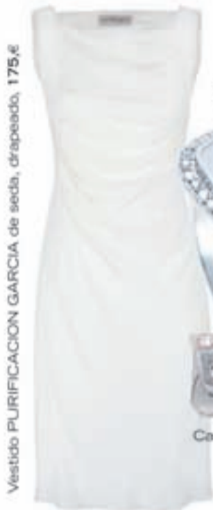
Vestido PURIFICACION GARCIA de seda, drapeado, 175,€