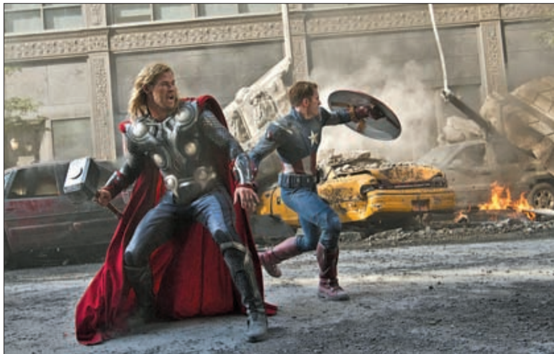
Thor y el Capitán América luchan por evitar un desastre mundial