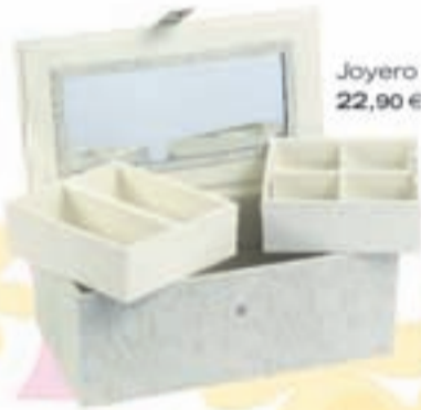
Joyería con espejo, 22,90 €