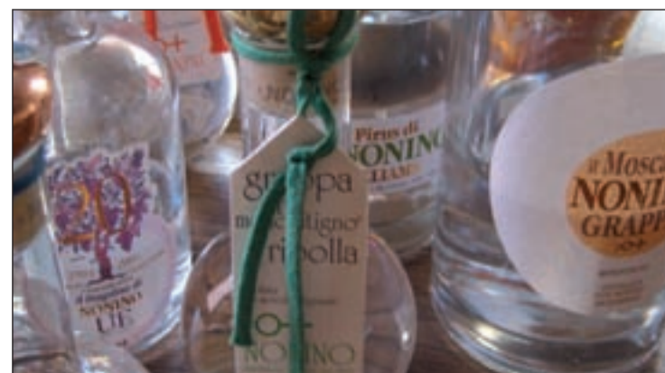
Gama de vinos grappa Nonino

ros) es el vino francés 'Coeur de Grain Rosé de Chateau de Selle', propiedad de las Bodegas Domaine Ott de la zona de la Provenza. Es uno de los rosados -de color bronce- más finos, frescos y afrutados. Por último, para las madres más clásicas y a un precio intermedio (68,20 euros) es recomendable el vino blanco. Como el de la casa Ladoucette, propiedad del Baron Patrick de Ladoucette. Un vino con fuerza y complejidad elaborado a partir de zumos de primera prensada.