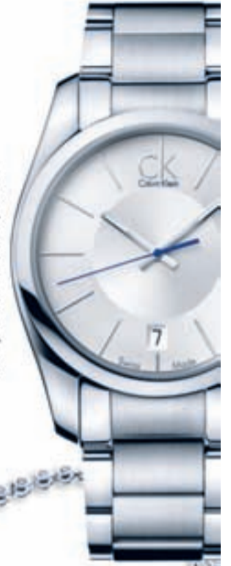
Reloj CALVIN KLEIN, 195 €