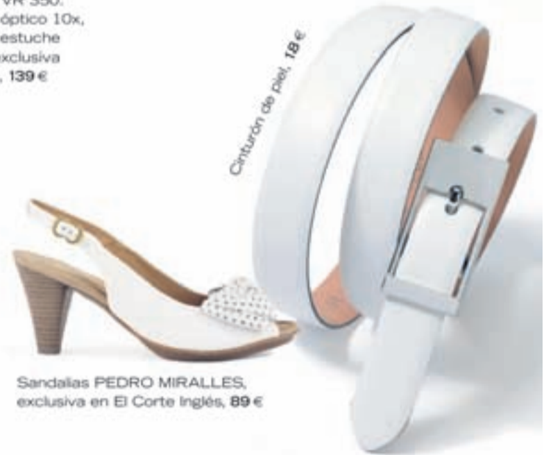
Cinturón de piel, 18 €