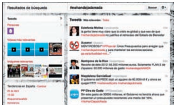
Resultados del hashtag #nohandejadonada en Twitter

HASTAGS #NOHANDEJADONADA FRENTE A #VANAPORTODO