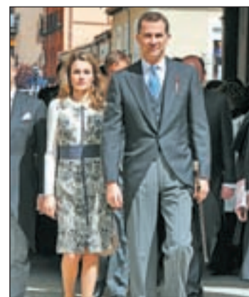
Los príncipes, a la llegada

La llegada de invitados se produjo escalonadamente desde