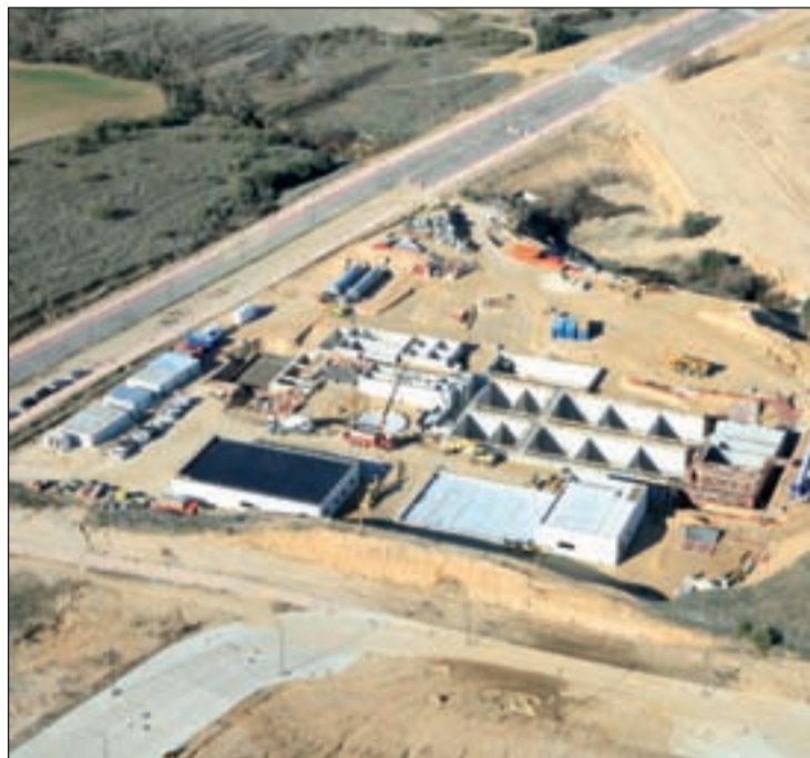
Parcela en el Arroyo del Valenoso, en Boadilla del Monte CANAL DE ISABEL II

La Estación dará servicio a la zona oeste del término municipal, "con capacidad de tratamiento de hasta 12.000 metros cúbicos diarios de agua residual", lo que equivale a unos de 40.000 ciudadanos. En España solo hay 15 depuradoras de este