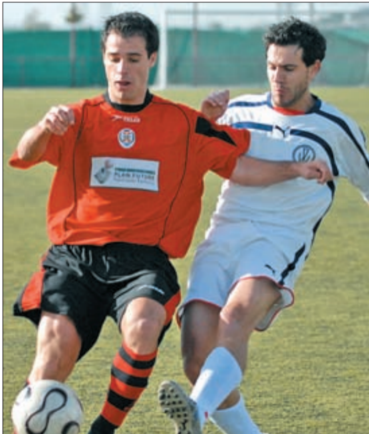
El Villaviciosa visitará el miércoles al Pinto

Sin mucho tiempo para digerir lo que suceda en esta jornada, el Villaviciosa debe centrarse en