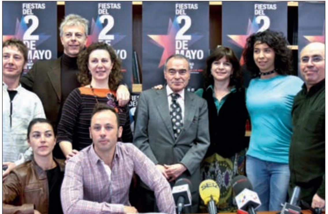
El director de Promoción Cultural de la Comunidad junto a representantes de diversas compañías de danza

El Festimad, por su parte, pondrá la nota de creatividad y biodiversidad musical a las jornadas lúdico-festivas. "Se pone