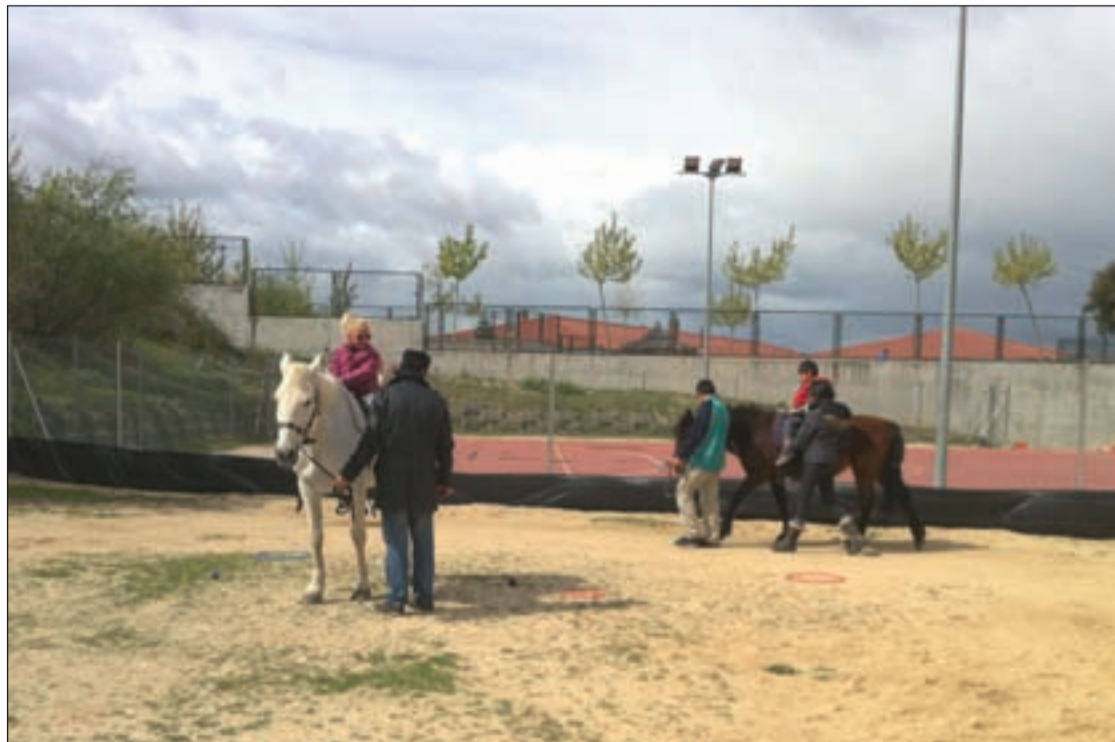
Una de las sesiones de terapia con caballos en el centro Monte Abantos, en la localidad de Las Rozas