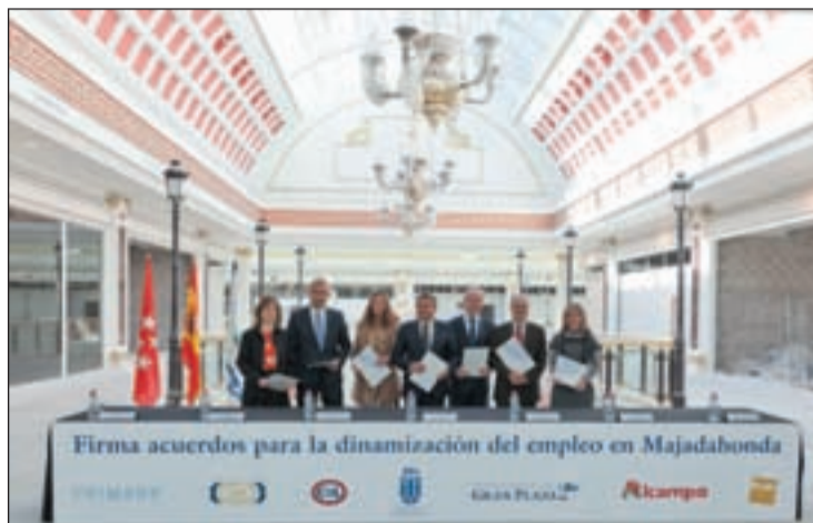
Firma del acuerdo para el empleo en el Gran Plaza 2, de Majadahonda

El mármol cubre el interior del edificio y el cristal respalda su mirada hacia al exterior. Su decoración recrea el recuerdo del barroco veneciano, que toma a la luz como protagonista. Su aspecto neoclásico ha sido diseñado por el estudio de arquitectura Chapman Taylor, establecido desde hace más de 50 años en Londres y 11 años en Madrid. La