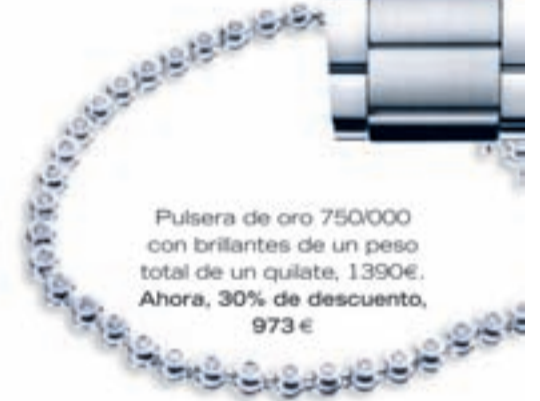
Pulsera de oro 750/000 con brillantes de un peso total de un quilate, 1390€. Ahora, 30% de descuento, 973 €