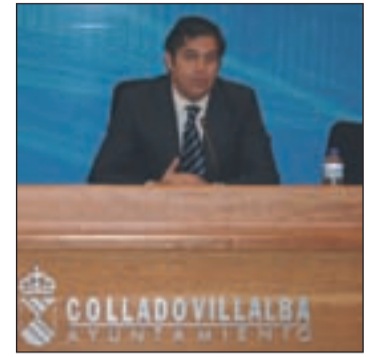
El alcalde en la rueda de prensa

El nuevo edificio, aprobado por valor de 3,2 millones de euros, contará con 4 plantas y una superficie de más de 3.600 m 2 . En su interior se encontrará la sede de la Policía Local, Protección Civil, y las oficinas para la tramitación del DNI y Pasaporte.