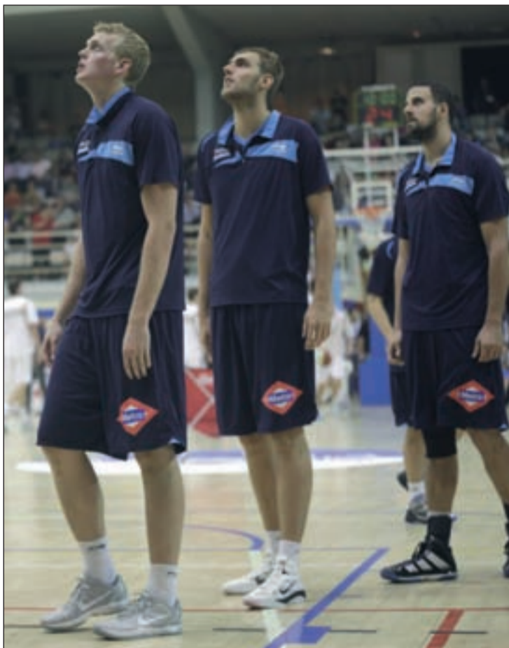
Los estudiantiles se juegan su futuro en diez días

Tres triunfos en los últimos cuatro encuentros han mejorado