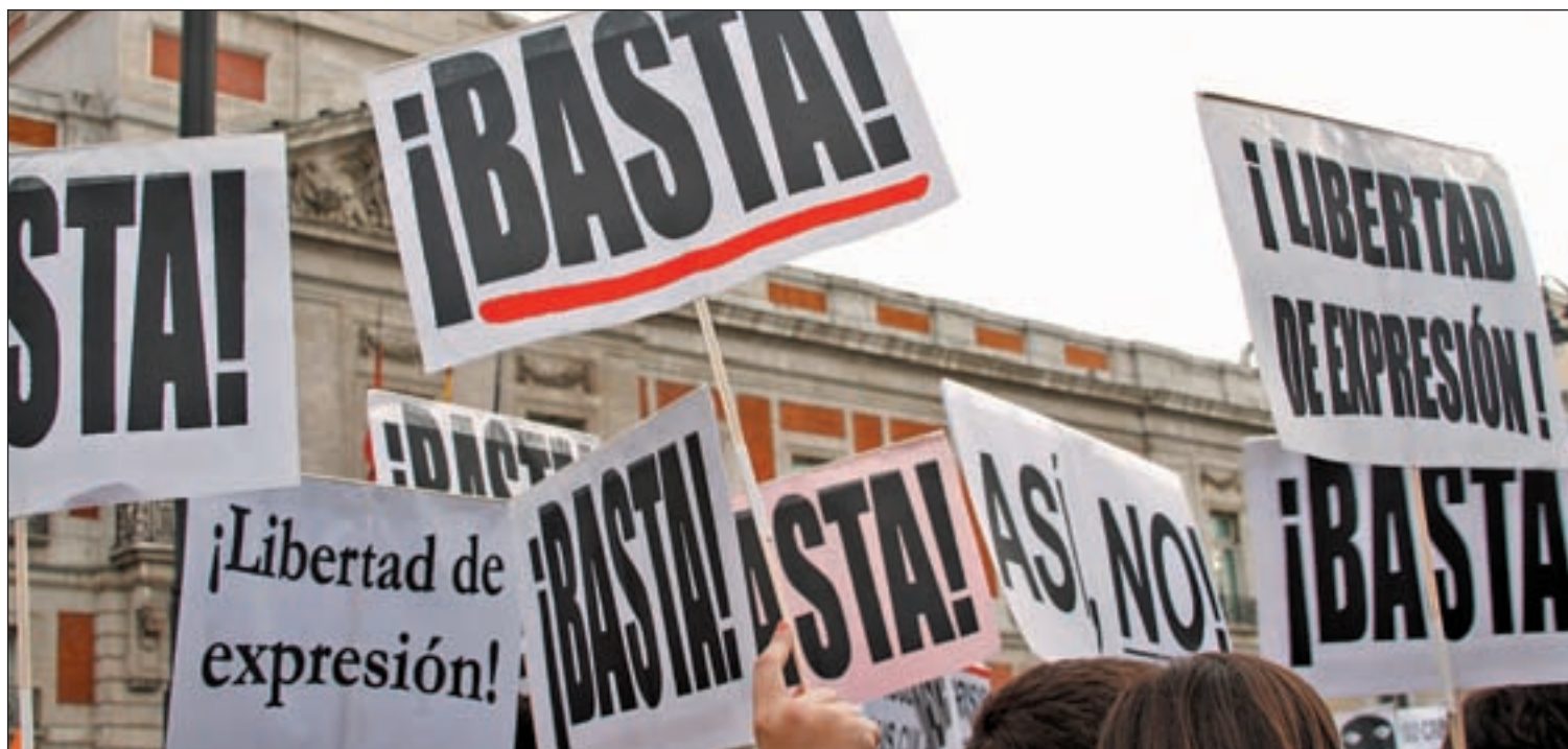
La acampada del movimiento 15-M permaneció tres meses en Sol el año pasado

CC.OO. Madrid Enseñanza convocó el martes una asamblea del Profesorado Interino, con el objeto de proponer nuevas movilizaciones para manifestar su desacuerdo con la propuesta de la Comunidad de cambiar el orden en las listas de las oposiciones de Secundaria. Durante la reunión, se escucharon los lemas de la 'Marea Verde': "Escuela pública de todos" o "No a los recortes". La propuesta de la Comunidad es que cuando "sean necesarios nombramientos de interinos se les oferte en primer lugar a los aspirantes de la lista preferente".