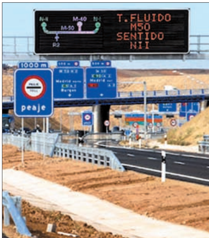
Una carretera de peaje

Esta decisión ha abierto el debate y las críticas no se han hecho esperar. Sin embargo, no es algo que se pueda hacer rápidamente. Y es que técnicos especializados en el campo del transporte por carretera calculan que la complejidad de la instalación de ese sistema les llevaría entre uno y dos años. No obstante, otros auguran que el proceso se puede diluir hasta los 24 meses pues, si bien, todos los dispositivos tecnológicos están más que probados y adaptados a la última, siempre puede haber problemas en las pruebas y se hace necesario un periodo de adaptación. No obstante, habrá que esperar a que el anuncio de la pre-