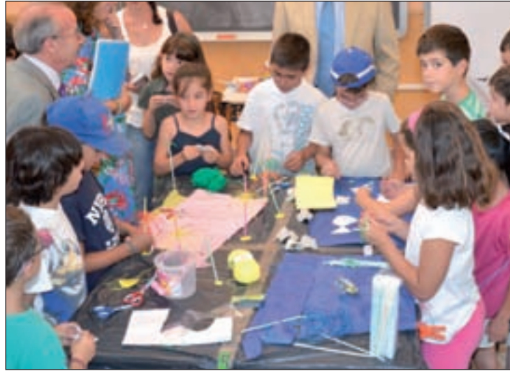
Campamento urbano, el pasado verano

El plazo de inscripción para los campamentos infantiles multiaventura, natación, fitness y campus de fútbol, se encuentra abierto de lunes a viernes, de 8.30 a 20.30 horas, en el punto de