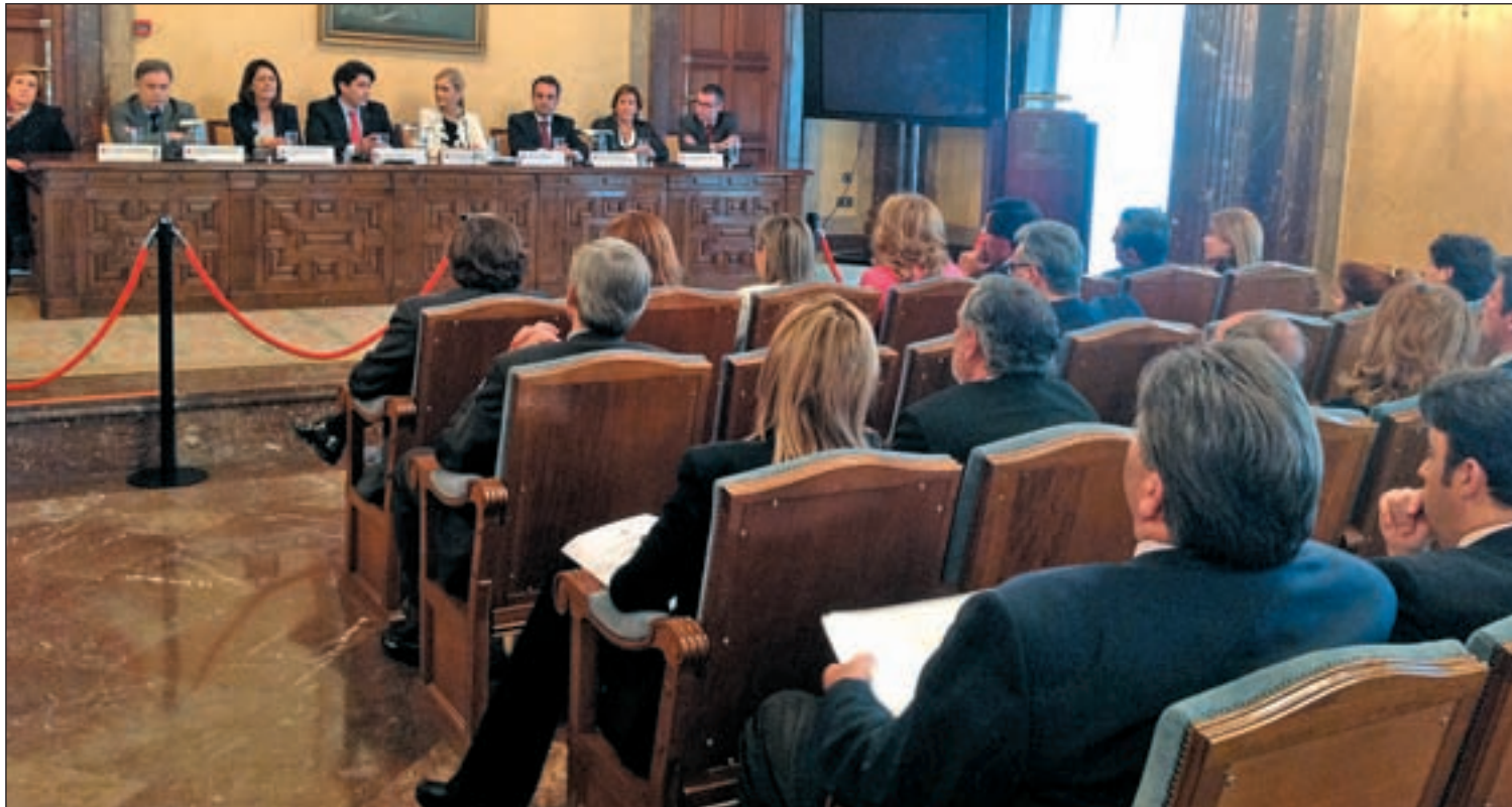
La delegada del Gobierno en Madrid, Cristina Cifuentes, en la reunión con la Junta Directiva de la Federación Madrileña de Municipios