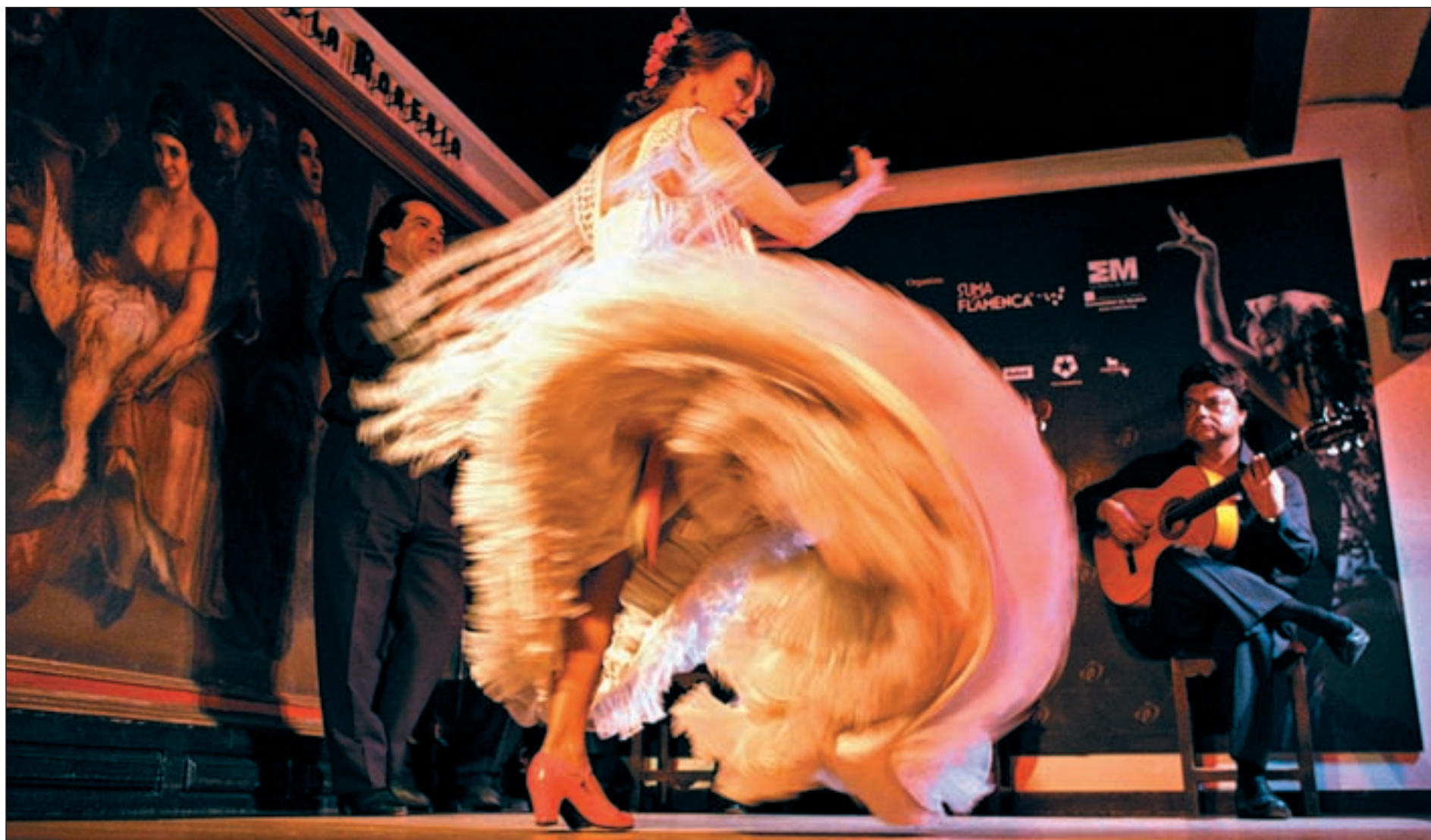
El arte de la bailaora Blanca del Rey inunda el escenario