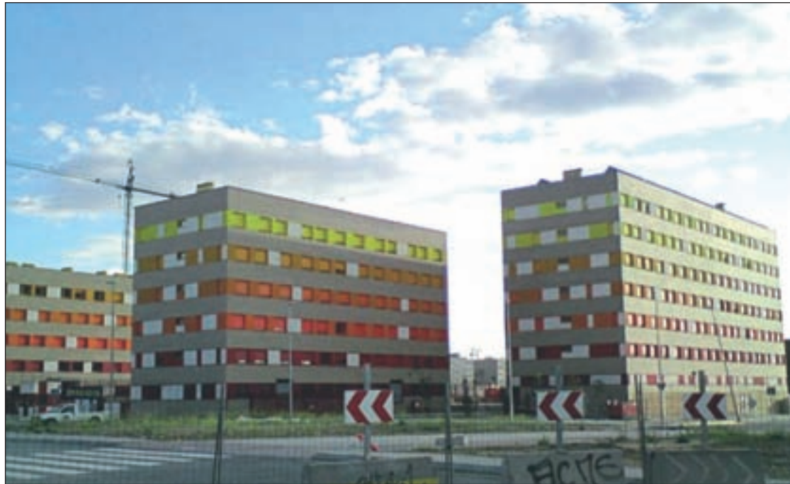
Construcción de viviendas en el Ensanche

El regidor insistió en que, "aunque el Ensanche Sur, al ser el barrio de más reciente construcción de la ciudad, presenta un nivel de conservación mucho mejor que otros, que llevaban años abandonados por el Ayuntamiento. Pero aunque las zonas más deterioradas sean actualmente la prioridad de este Gobierno, en ningún momento va a dejarse de atender ningún barrio de Alcorcón".