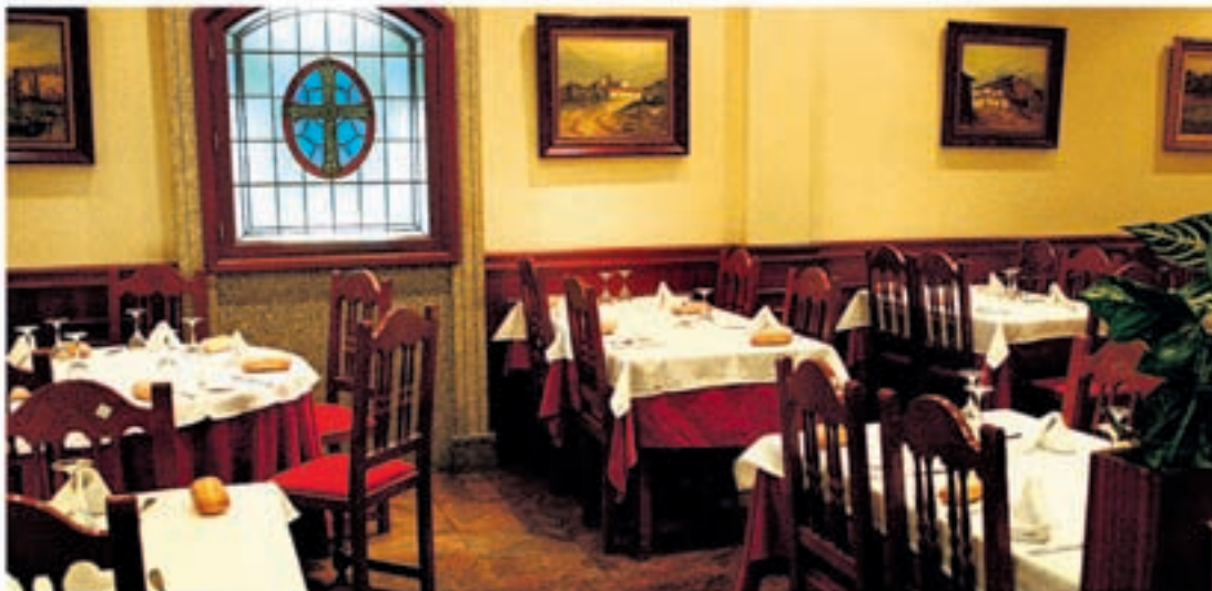
La Cruz de la Victoria de Asturias y varios cuadros decoran el acogedor salón del restaurante Los Cantos

Elaboración: En una sartén calentamos el aceite de oliva y en ella echamos la cebolla, previamente pelada y cortada en juliana. Cuando empiece a tomar color, añadimos el ajo y las dos hojas de laurel. Agregamos harina para que ligue la salsa. Es el momento de verter el vino blanco y la sidra natural. Dejamos que cueza unos minutos y añadimos un poco de salsa de tomate, el azafrán y las almejas. Que continúe cocinando un rato más para que levante la salsa y entonces pondremos la merluza fresca - de unos 300 gramos - bien lavada y escurrida. Se introduce todo en el horno donde cocerá durante unos diez minutos a 180-190°. Y ya está listo este manjar para comer.