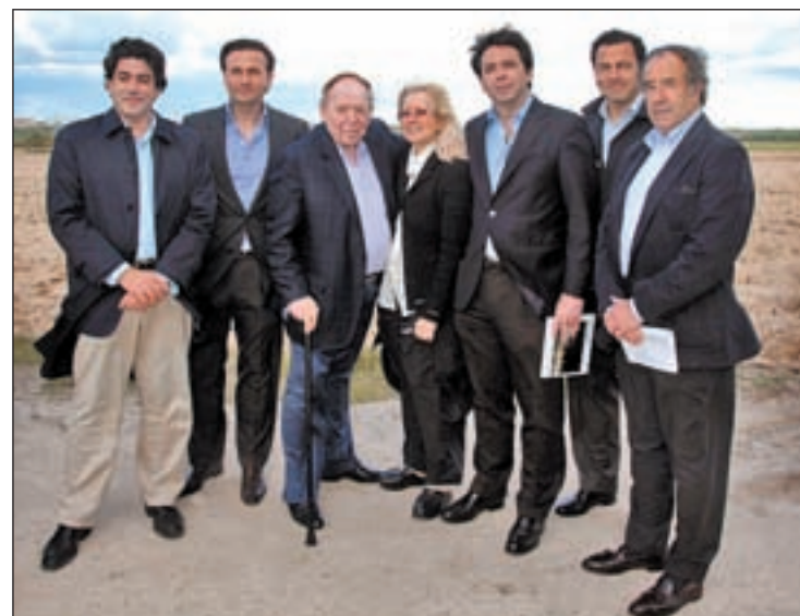
Sheldon Adelson con los consejeros de Economía y Transportes

En declaraciones a los medios, tras inaugurar una jornada el martes con empresarios en