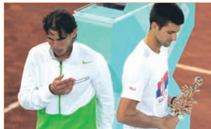
Djokovic superó en la final de la pasada edición a Nadal

del circuito deberán acudir a otro Masters 1000, aunque en esta ocasión será el Foro Itálico de Roma el escenario elegido. Será otra semana repleta de partidos y de carga física para unos tenistas que ya vislumbran en el horizonte la segunda gran cita de la temporada, Roland Garros. El Abierto de París se disputará del 22 de mayo al 10 de junio.