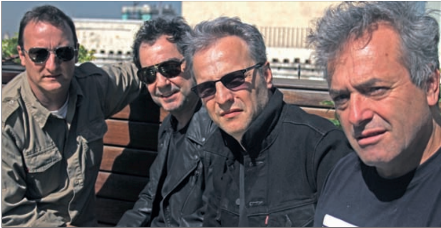
Daniel Mezquita, Javier Molina, David Summers y Rafael Gutiérrez, Hombres G