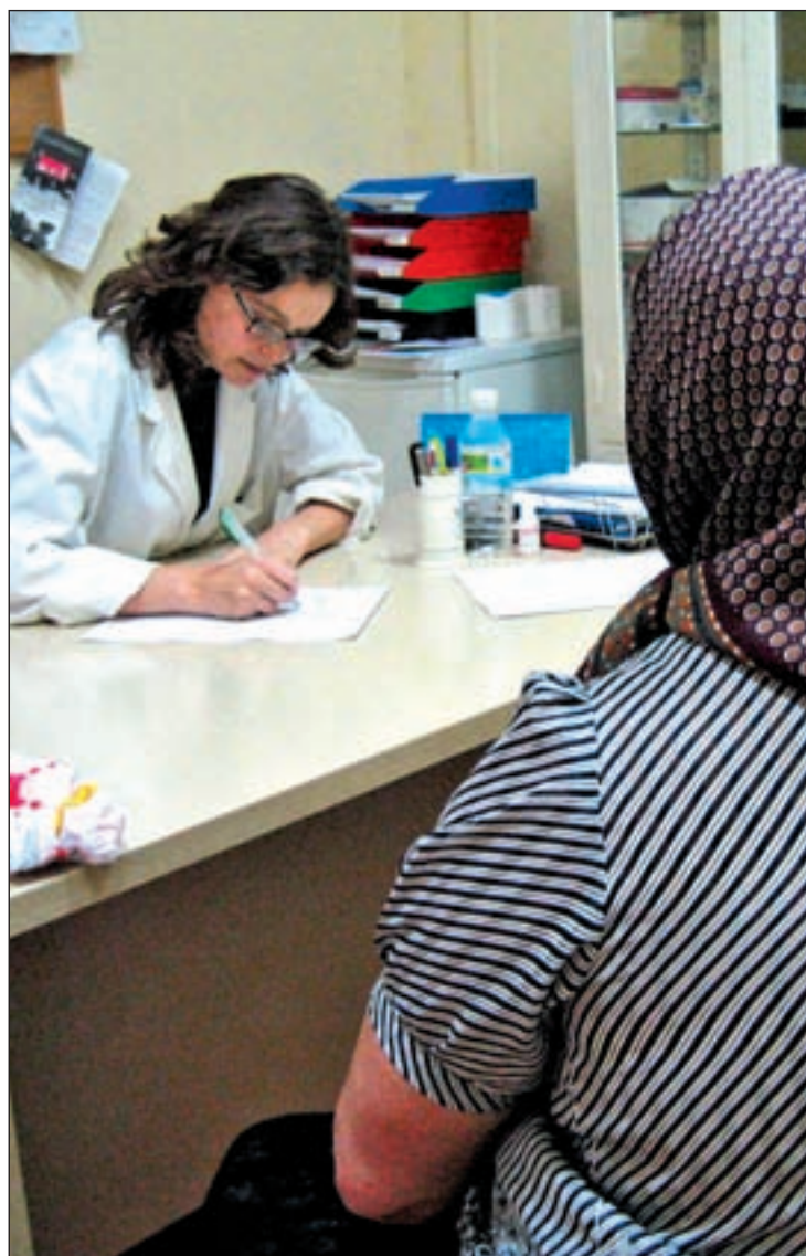
Una mujer inmigrante en la consulta del médico