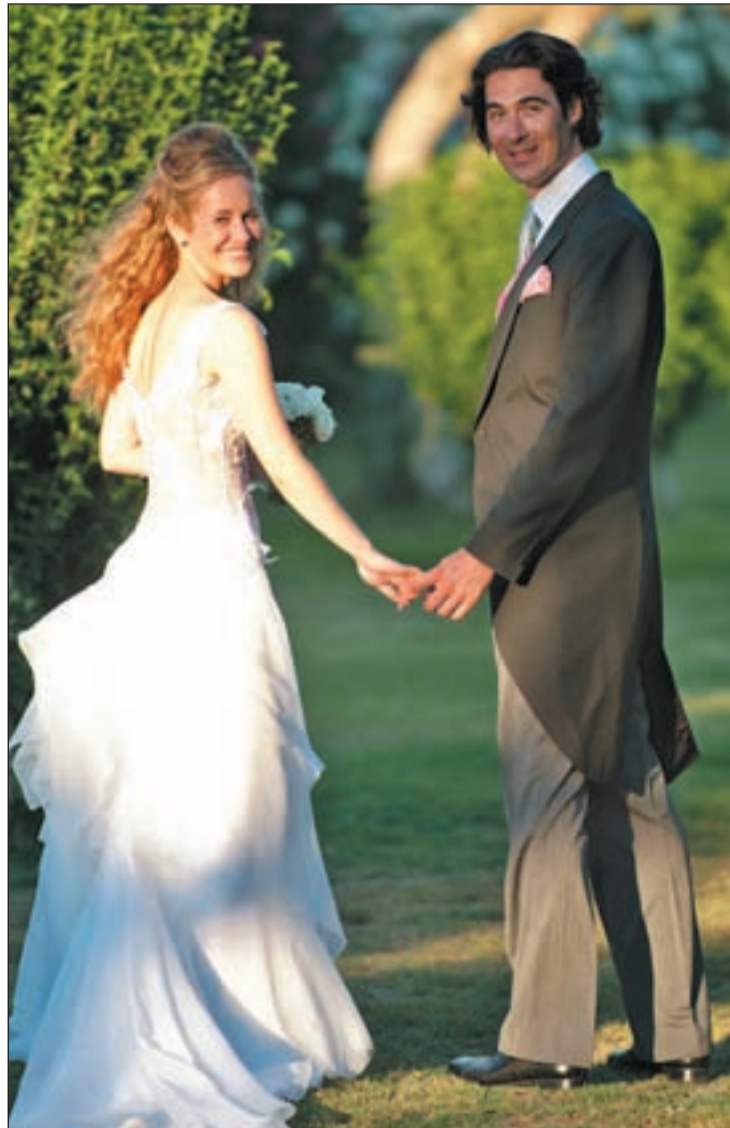
La tasa bruta de nupcialidad también ha descendido

En el caso de los primeros matrimonios, ocurre exactamente lo mismo, ellas son más precoces que ellos para firmar un papel que les ate legalmente a su pareja. Las cifras no distan demasiado de las anteriores: la edad media de los novios tan sólo desciende a 33,4 años para