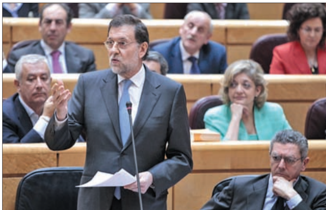
Mariano Rajoy, presidente del Gobierno, comparece ante el Senado

mas y organizaciones de apoyo a esta población. "Todas las comunidades tienen previsto hacer convenios con organizaciones que atienden a inmigrantes de manera irregular para que también se les pueda atender en Atención Primaria", según apuntó en una entrevista en a RNE.