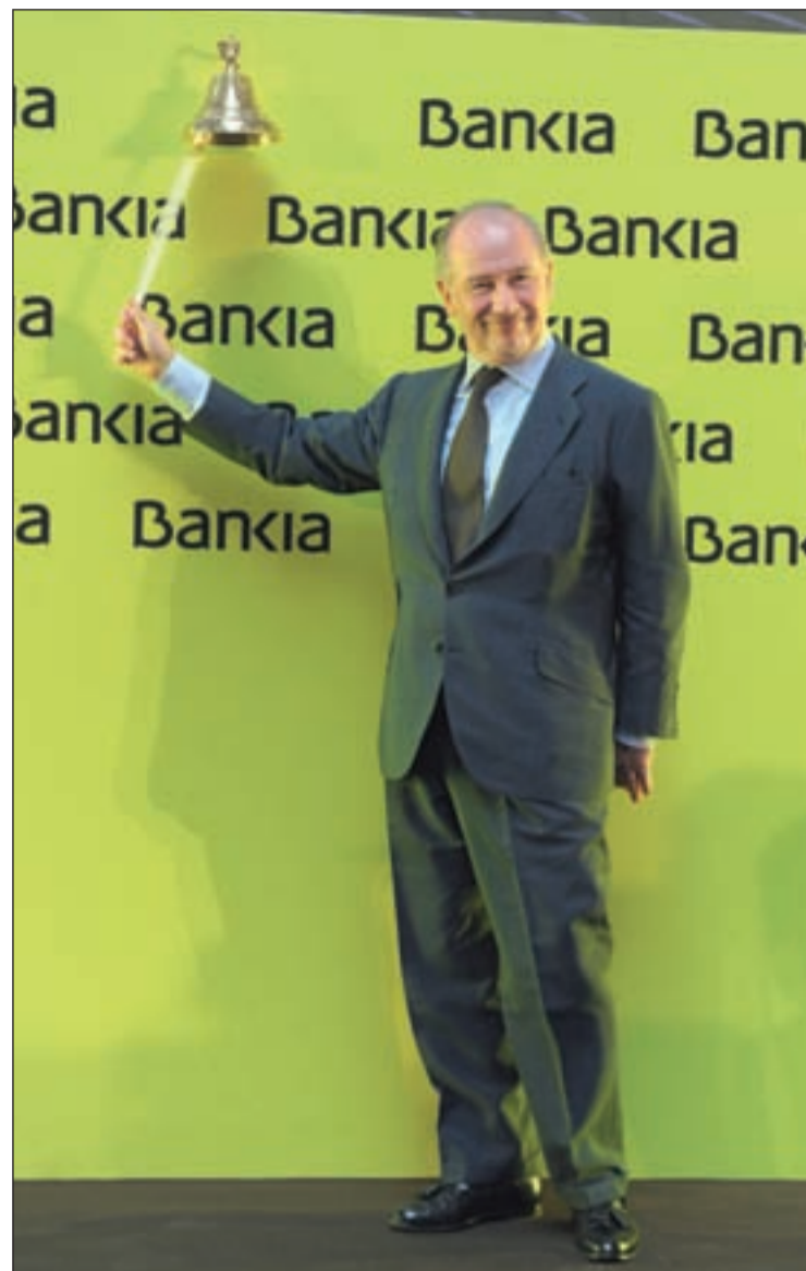
Rodrigo Rato en la salida a Bolsa de Bankia

Si finalmente se materializara la inyección de capital, el Gobierno daría marcha atrás a su intención de no respaldar con fondos públicos a las entidades financieras. "Mi última inten-