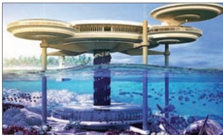
Diseño del hotel submarino de Dubai

Este proyecto recibirá el nombre de 'Water Discus Hotel' y contará con 21 habitaciones bajo el agua y una parte del hotel sobre el mar y se accederá de una planta a otra por medio de ascensores. Además las habitaciones contarán con vistas panorámicas del fondo marino y la