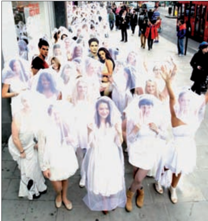
Entrada de la tienda londinense donde Crepúsculo alcanzó el record

Aunque suene surrealista -y propio de la ciencia ficción- en los videojuegos también se celebran enlaces y algunos batidos récords, como es el caso de 'Rift', un vi-