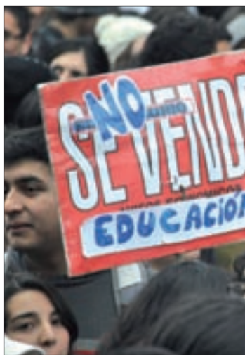
Protestas de educación

Su convocatoria recibió el apoyo de la Plataforma Estatal