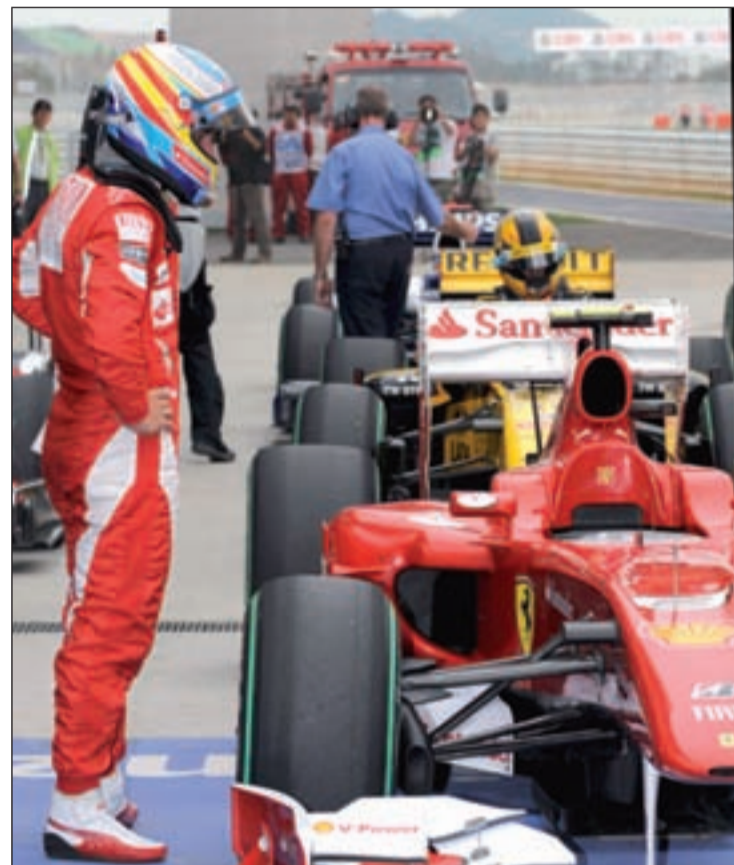
Alonso aspira a subir al podio de Montmeló

Todos los pilotos son conscientes de la importancia de los resultados de la jornada del sábado. Salvo en la edición del año pasado, todas las carreras desde el año 2000 terminaron con el mismo vencedor que en las sesiones de clasificación, un dato que refleja la dificultad que entraña realizar adelantamientos