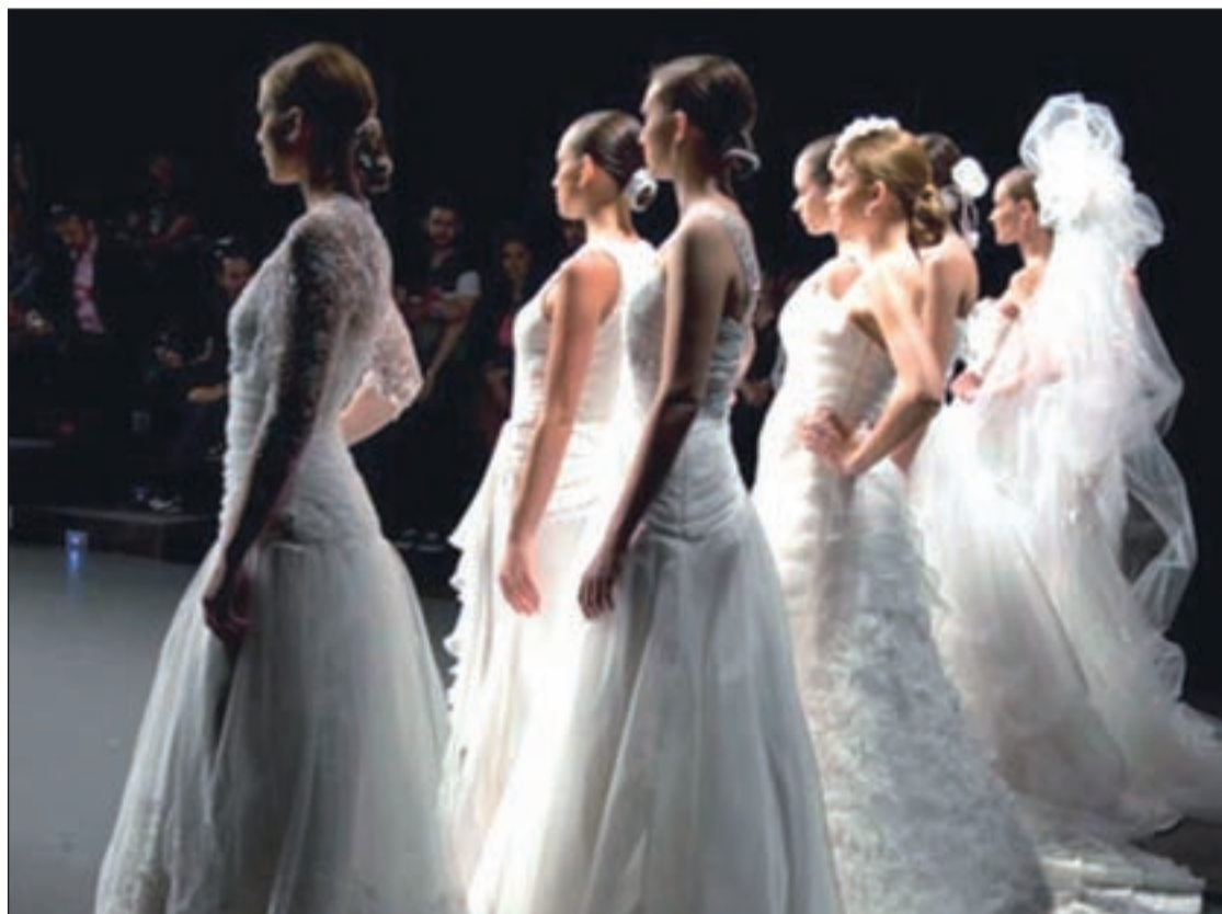
X Edición de Madrid Novias

Sin embargo, sofisticación y novedad no están reñidos. Los tonos marfiles, crudos y blancos comienzan a desaparecer para abrir camino al color en mayúsculas, que en 2013 viene de la mano de gamas más intensas que traerán a las novias el verde