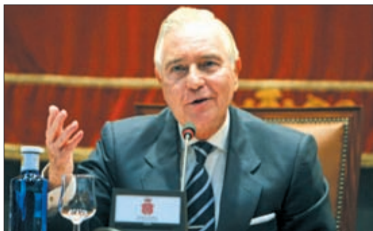
Carlos Dívar, presidente del Tribunal Supremo

El vocal señaló que ahora es el Fiscal General del Estado, Eduardo Torres-Dulce, el que tiene que determinar si estos gastos privados han sido pagados con dinero público. Además, trasladó a Torres-Dulce una nota de Dívar en la que "explicaba el motivo del viaje pero no los gastos".