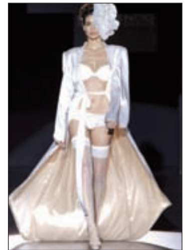
Conjunto lencero blanco

La lencería de una novia no es tan sólo un detalle como los demás: es mucho más. De hecho, un conjunto lencero blanco aporta feminidad, sensualidad, y suele favorecer mucho a la mujer. Esta es una de las razones que ha llevado a la firma Women Secret a la creación de la colección "Just married", válida tanto para novias como para mujeres que deseen darse un capricho ya que es muy accesible al bolsillo. Desde unos 13 euros aproximadamente es posible adquirir una de sus prendas más económicas. Y la prenda más cara asciende a unos 37 euros.