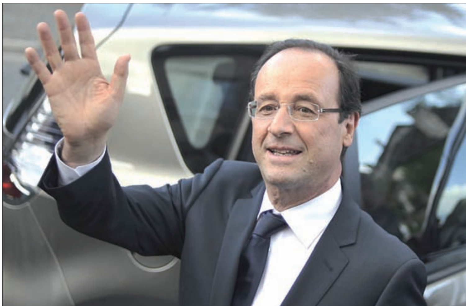
El socialista François Hollande, presidente electo de Francia