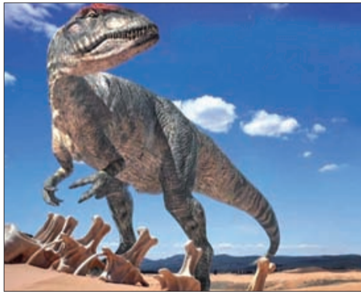
Dinosaurio Saurópodo emisor de metano

Entonces decidieron que si estudiaban la producción de metano a partir de una serie de animales modernos, podrían derivar las ecuaciones que pre-