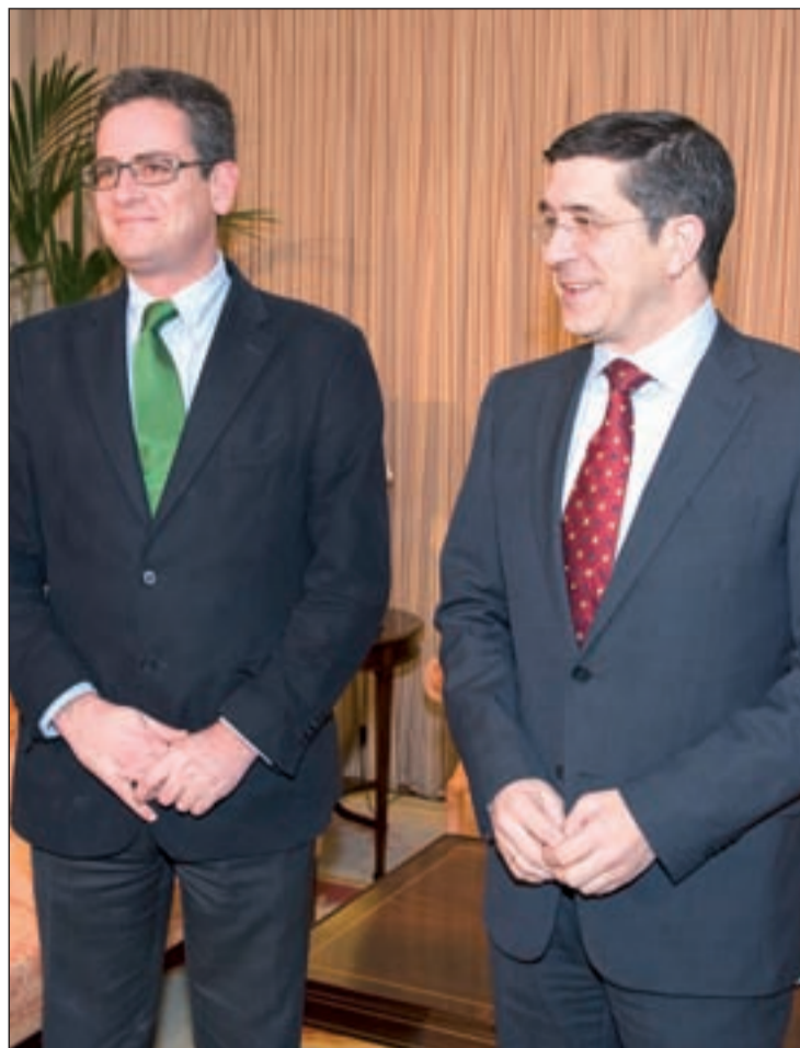
El lehendakari Patxi López y Antonio Basagoiti

También se refirió a las dificultades que puede encontrar el Gobierno vasco para sacar adelante nuevas leyes y para aprobar los Presupuestos de 2013 en el Parlamento tras perder la mayoría que le garantizaba el apoyo del PP. López afirmó que el suyo no será el primer ejecutivo que gobierna "en minoría" y explicó que existen "fórmulas" pa-