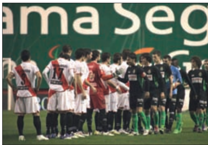
El Rayo podría acompañar al Racing

FÚTBOL EL DESCENSO SE DECIDE EN ESTA JORNADA