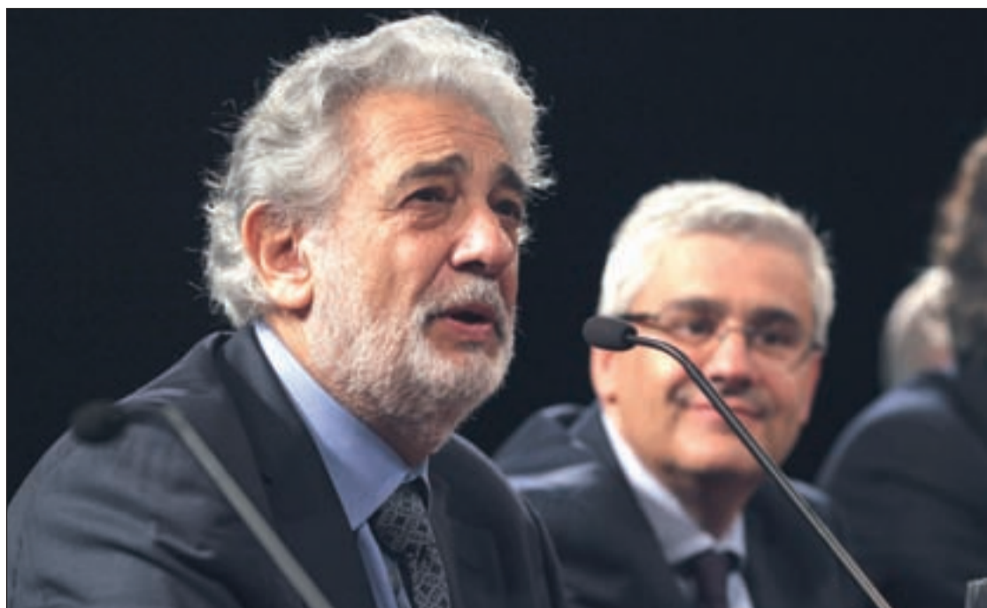
Plácido Domingo participa en la rueda de prensa de presentación de Cyrano de Bergerac

Considerado uno de los más importantes arquitectos de vanguardia, Rafael Moneo nació en Tudela (Navarra) en 1937. Licenciado en 1961 por la Escuela Superior de Arquitectura de Madrid, ha obtenido los más prestigiosos galardones internacionales de arquitectura, como el Premio Arnold W. Brunner Memorial (1993) de la Academia Americana de las Artes y las Letras, el Schock Prize de las Artes Visuales (1993) de Estocolmo, el Premio Pritzker (1996), el Antonio Feltrinelli (1998) de la Academia Nacional del Lincei en Roma y el Mies van der Rohe (2001) de Barcelona.