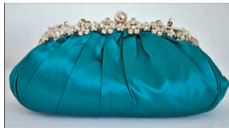
El bolso de mano nunca falla

temporada también se abandona el típico tres piezas, así como el palabra de honor. El cuello barco o el escote halter también es elegido por muchas futuras madrinan. Por otra parte, este año el chal es relegado por las toreras y cubre hombros. El binomio zapato bolso se rompe dando pie a contrastes.