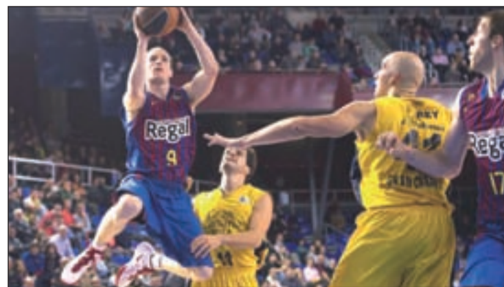
El Barça buscará su tercera Euroliga