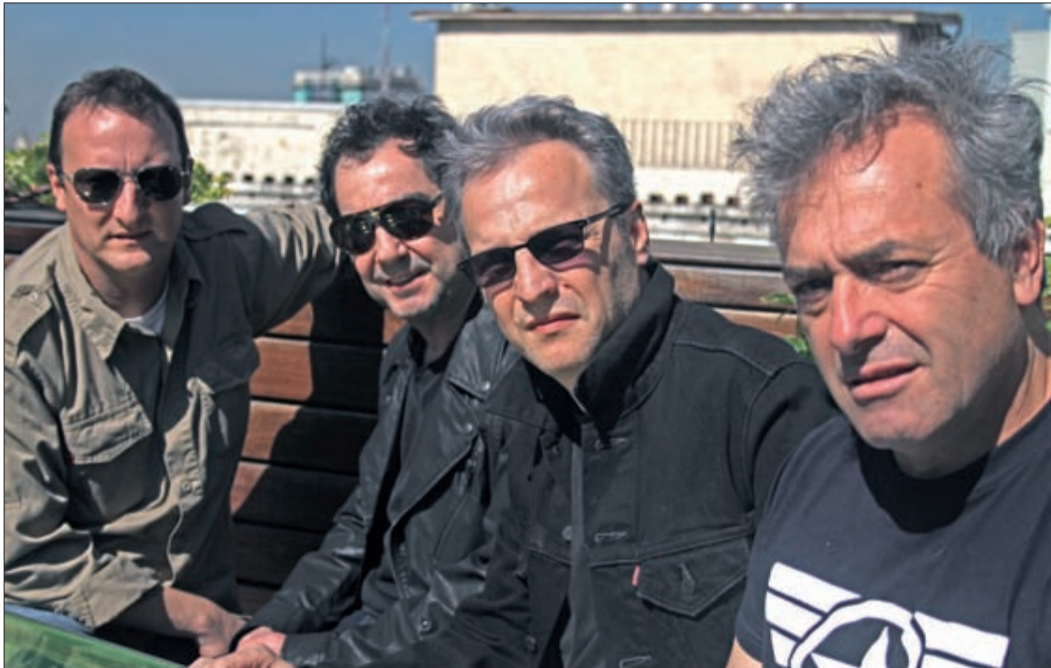
Daniel Mezquita, Javier Molina, David Summers y Rafael Gutiérrez, Hombres G