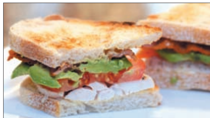
Un ‘Sandwich Club’, indicador de los precios de la hostelería

España es el segundo lugar más “asequible” con una media de 12,30 euros, casi la mitad de precio que el sándwich parisino. Sin embargo, el precio más bajo registrado en los hoteles de Madrid fue de 5 euros, una cifra cercana a los 7,27 euros de Nueva Deli, la ciudad con el ‘Sandwich Club’ con precio más bajo.