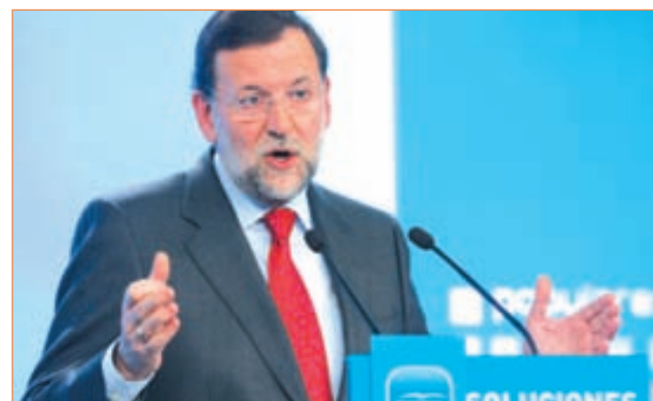
Mariano Rajoy, presidente del Gobierno

dades Autónomas y les advirtió de que no está “dispuesto” a que incumplan el objetivo de déficit establecido y de que el Gobierno “no se va a cansar” de hacer reformas. “Tendrán que cumplir, como tendrá que cumplir el Gobierno de España. Y, desde luego, no estoy dispuesto a que nadie incumpla, yo el primero”, insistió el jefe del Ejecutivo.