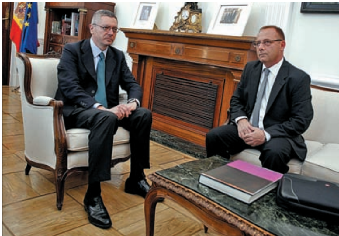
El ministro de Justicia, Alberto Ruiz-Gallardón, con el padre de Marta del Castillo.

El ministro insistió en la idoneidad de esta medida porque será impuesta en función de la peligrosidad del autor del delito. Eso significa, según sus palabras, que no se aplicará exclusivamente a los delitos más graves sino para los que tengan "una previsión de continuidad o agravamiento" de modo que sirva de