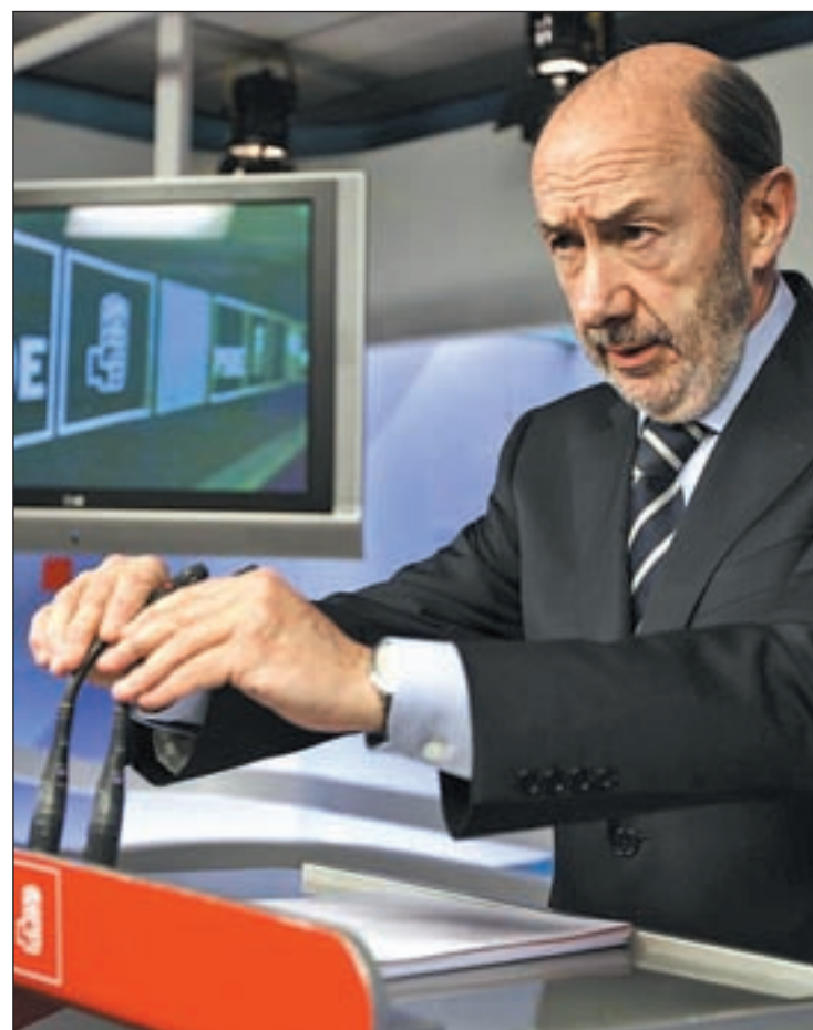
Alfredo Pérez Rubalcaba, líder del PSOE

En esta ocasión, el PSOE prepara para 2015 una agenda reformista que incluirá una propuesta de revisión de todas las estructuras institucionales y políticas que han servido durante estos 30 años pero que ahora se