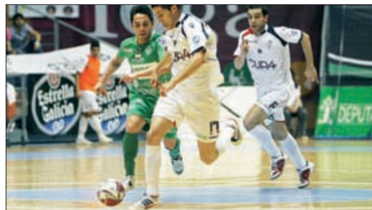
Lobelle y Triman se vieron las caras en la última jornada LNFS.ES

Por su parte, el Inter Movistar se verá las caras ante un Triman Navarra que temporadas atrás ya le dio un serio disgusto en esta fase. Al igual que los alcaláinos, ElPozo se presenta como uno de los candidatos a estar en semifinales, aunque para ello deberá superar al Zaragoza. Caja Segovia-Lobelle es la otra serie.