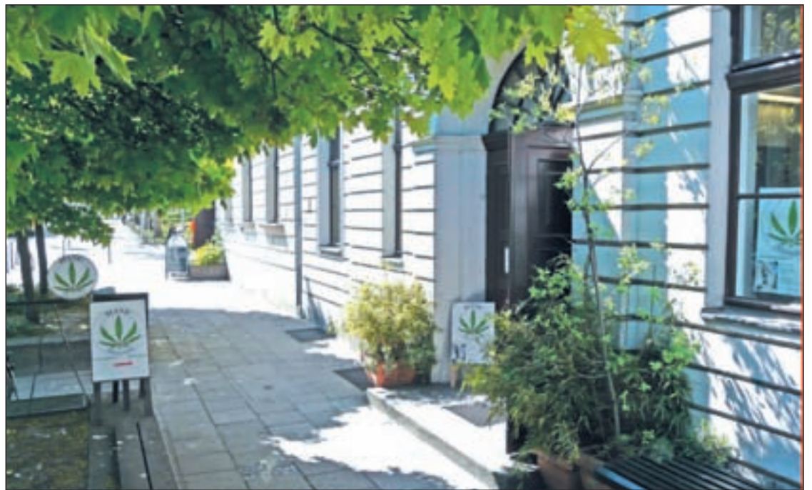
Fachada del Hemp Museum Gallery de Ámsterdam

Las diferentes salas del recinto, al que se podrá acceder pre-