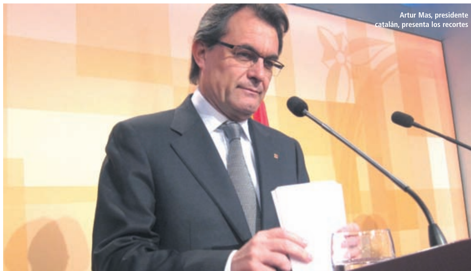
Artur Mas, presidente catalán, presenta los recortes

a “reñir” constantemente a las comunidades.