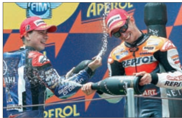
Los dos campeones del mundo se postulan como claros candidatos

Por ese mismo lado del cuadro camina un Caja Laboral que ha demostrado a lo largo de la campaña conocer el camino para derrotar a los dos grandes de la ACB. Sin embargo, el primer examen para los de Ivanovic será ante sus vecinos del Gescrap.