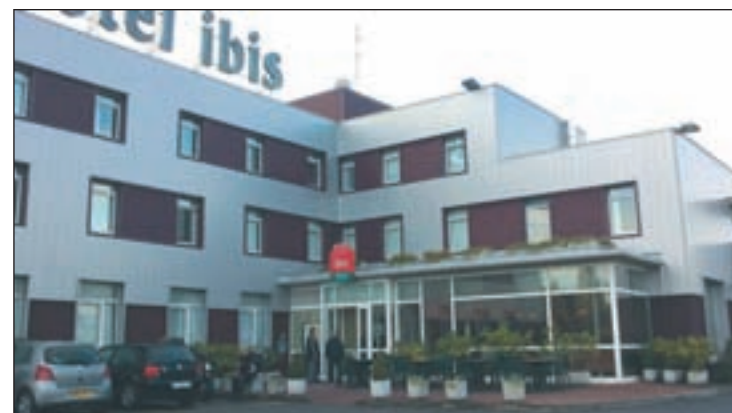
Hotel del Grupo Accor

Con 4.200 hoteles en 90 países, más de 145.000 trabajadores, 56 millones de desayunos servidos cada año y más de 545 millones de litros de agua consumidos al año la cadena hotelera reconoce su impacto en el medioambiente por ello ha buscado disponer de información completa y fiable para profundizar su estrategia en este terreno.