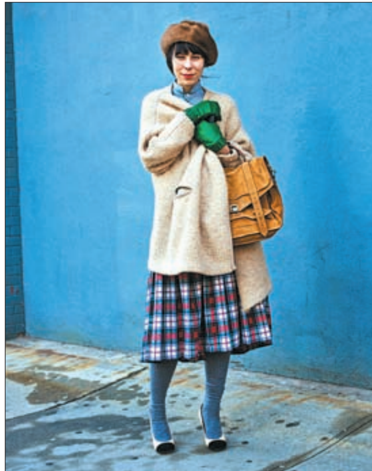
Imagen de la exposición de Scott Schuman

Dentro del programa expositivo subrayar las que albergará el Teatro Fernán Gómez De la Factory al mundo. Fotografía y la comunidad de Warhol, que reúne