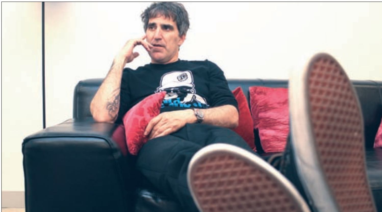
Mikel Erentxun durante la entrevista con GENTE