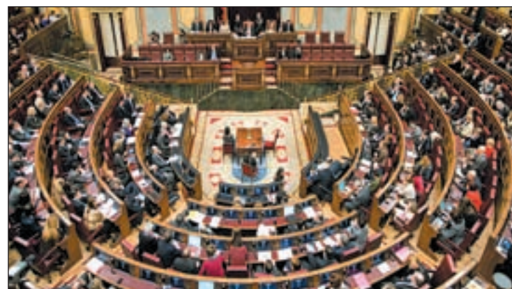
Sesión del pleno del Congreso de los Diputados

sarios), reiteró su oferta por entender que España “lo necesita”. A su entender, la situación económica “ha empeorado” porque los pensionistas “tendrán que pagar más por sus medicamentos” y los estudiantes “más por sus carreras universitarias”, habrá más alumnos por clase y se va a “nacionalizar” Bankia.