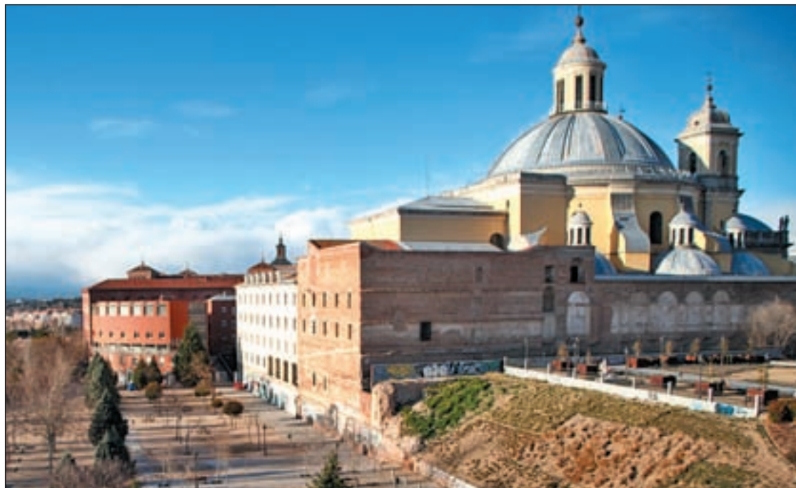
Fachada de las Vistillas

Las negociaciones fueron desde el principio más fluidas con el Partido Socialista, dado que muy pronto Javier Fernández obtuvo el apoyo de IU para la investidura.