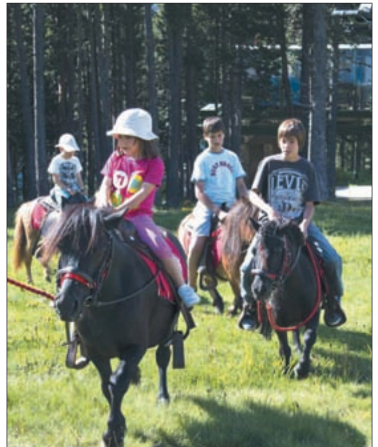
Paseos a caballo por la estación de esquí

Vallnord es también un parque de aventuras donde disfrutar en contacto con la naturaleza. En la Caubella de Pal se ubica el Pekenpark, un espacio único para los