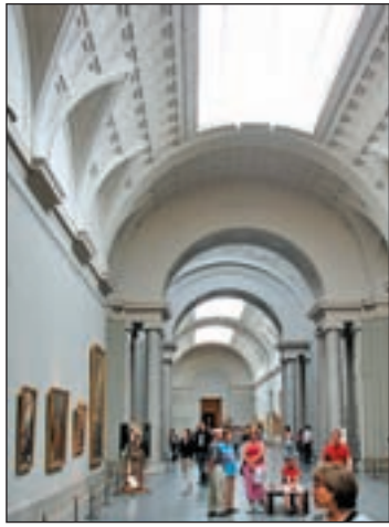
Una sala del Museo del Prado