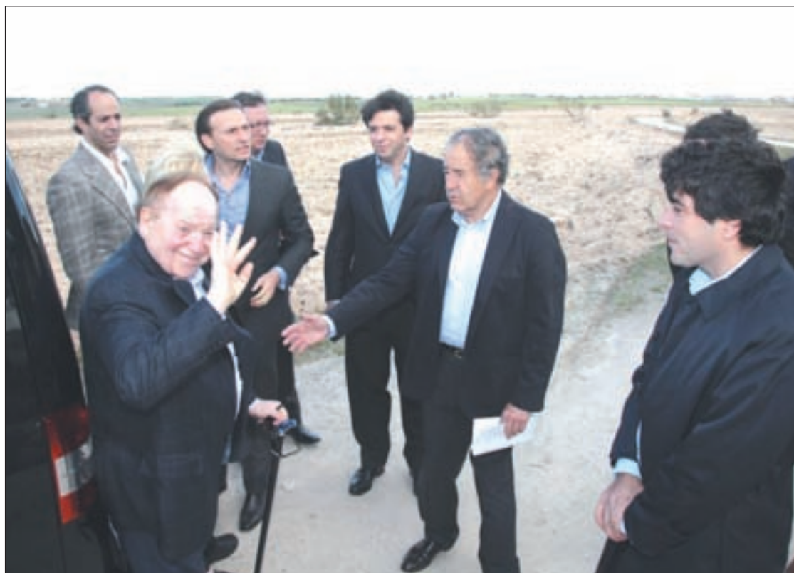
Visita de Sheldon Adelson a Alcorcón

Tras su construcción, Eurovegas aumentará las cifras del turismo de negocio en España, que actualmente ocupa el tercer lugar entre los países que albergan más eventos empresariales, con un total de 451 congresos in-