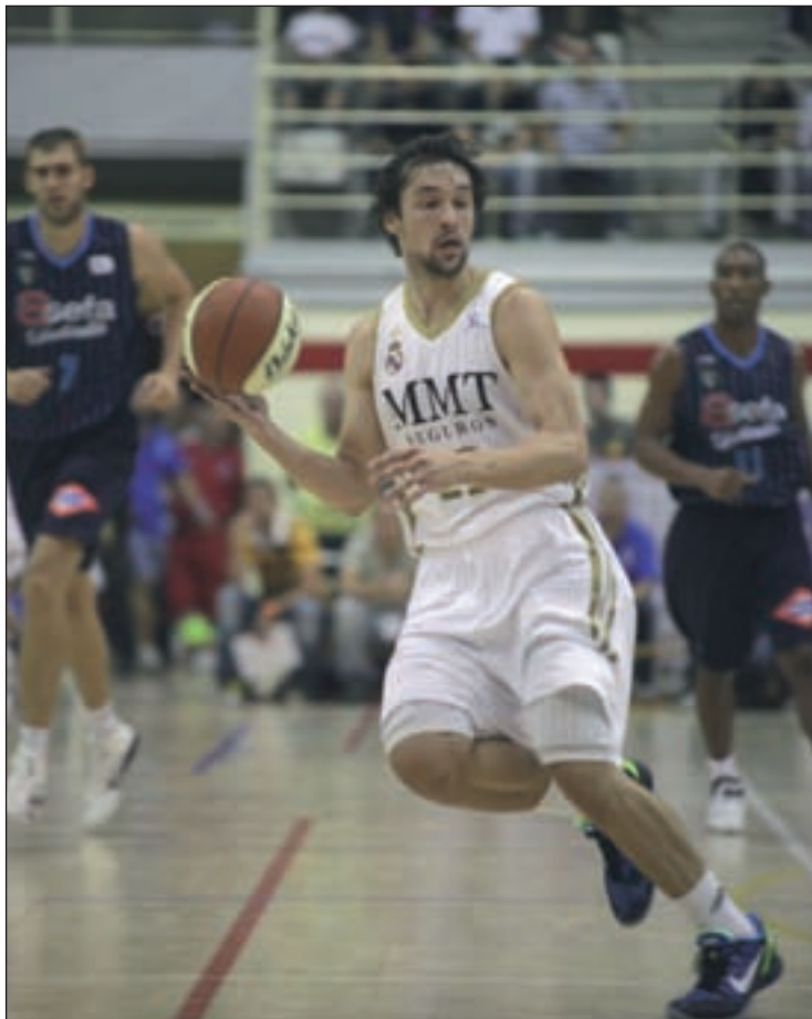
El Real Madrid se presenta como alternativa a los culés

Tras lo visto en la fase regular y mirando el palmarés reciente de la ACB, sería lógico pensar que el gran favorito para levantar el título es el Barcelona Regal, aunque la autoestima del campeón no llega a esta fase del campeonato tan fortalecida como en anteriores temporadas. La derrota en la final de la Copa del Rey y el hecho de quedarse fuera del partido decisivo de la Euroliga pueden minar la moral de un equipo que tenía una aureola de imbatible en las eliminatorias a varios partidos.