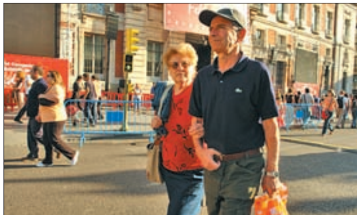
Unas personas mayores pasean por Madrid

EL GASTO AUMENTARÁ 3'6% HASTA 2060 EN ESPAÑA