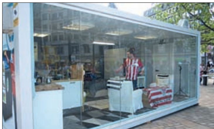
El apartamento situado en el centro de Bilbao