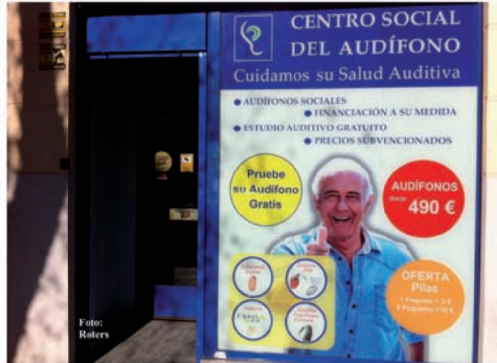
Fachada de uno de los Centros Sociales del Audífono en el momento de una de las emisiones en Madrid Directo (Telemadrid ). B.B. COMUNICACIÓN.

¿Ofrecen ustedes algunas facilidades de pago? “Por supuesto, FINANCIAMOS EL PAGO HASTA 3 AÑOS SIN INTERESES”. Sin duda alguna en el Centro Social del Audífono “miran mucho” por las necesidades de la 3ª Edad. Recientemente en su aparición en el Programa de Telemadrid ,MADRID DIRECTO, hablaron del ESTUDIO AUDITIVO GRATUITO