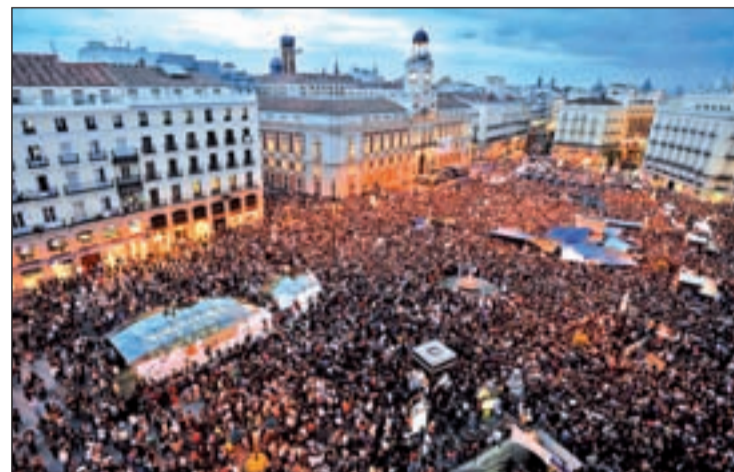
Miles de personas ocuparon la Puerta del Sol el sábado

Por otro lado, la Policía Nacional ha identificado durante las concentraciones a 560 personas que se enfrentan a multas de hasta 300 euros. Eso sí, todo dependerá del motivo de su identificación. Cifuentes ya ha dejado claro que no se multará a nadie sólo por el hecho de que haya estado en la Puerta del Sol más