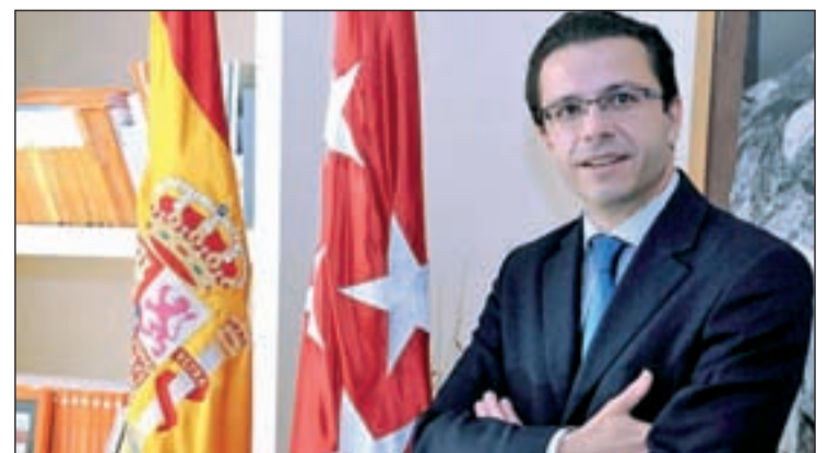
El consejero de Sanidad, Javier Fernández-Lasquetty, presentó el plan

cuatro áreas de actividad fundamental: endocrinología, diabetes, obesidad y nutrición clínica. El segundo nivel es el de especialización para patologías de alta prevalencia como tumores, diabetes complicada u obesidad mórbida. Por último, el tercer nivel es el de tratamientos especializados de baja prevalencia.