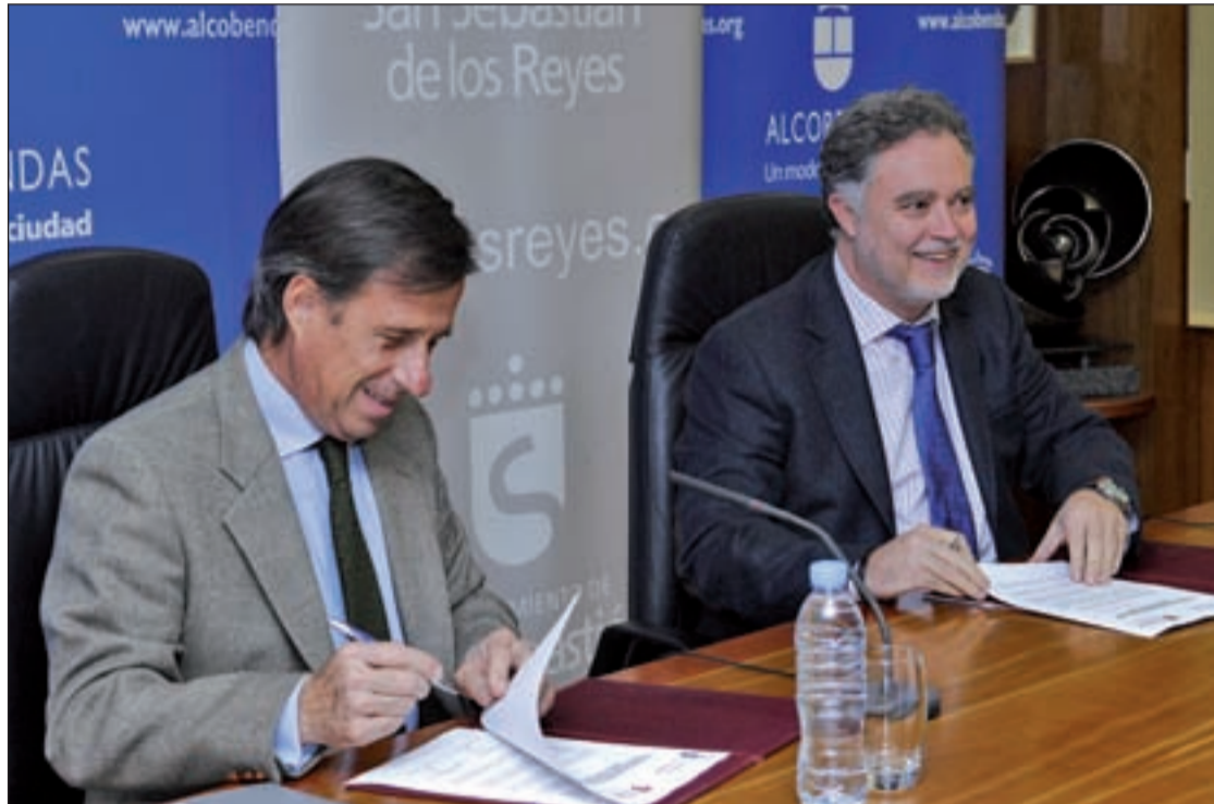
Alcobendas y San Sebastián de los Reyes, claro ejemplo de la fusión de servicios

El portavoz del PP en el órgano parlamentario, Íñigo Henríquez de Luna, ha afirmado que su partido sitúa en "20.000 habitantes la población del municipio eficiente", y ha destacado que apoyarán la fusión o agregación de municipios que "libremente" y "voluntariamente" pongan en marcha las corporaciones locales para lograr "entidades locales