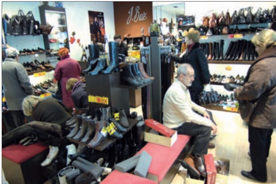
La modificación de la normativa afectará, principalmente, al comercio minorista madrileño

La reforma de la ordenanza, aseguran, no implica una permisividad en el cumplimiento de la normativa. Al contrario, exigirá al Ayuntamiento un mayor esfuerzo en la aplicación de medidas correctoras en los locales incumplidores para que en ningún caso se perturbe la convivencia y la calidad de vida de los ciuda-