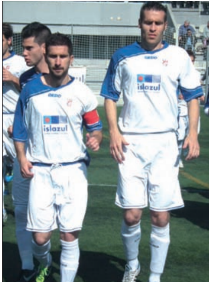
El Puerta Bonita cerró el curso como tercer clasificado