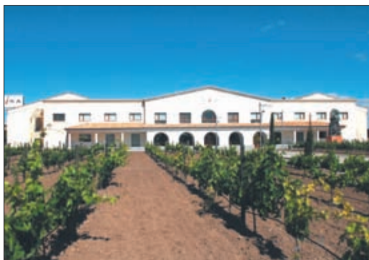
Fachada de bodega y viñedos de Matarromera

Visitmenorca.com presenta actividades para este verano y recorre desde playas con servicios hasta calas vírgenes.