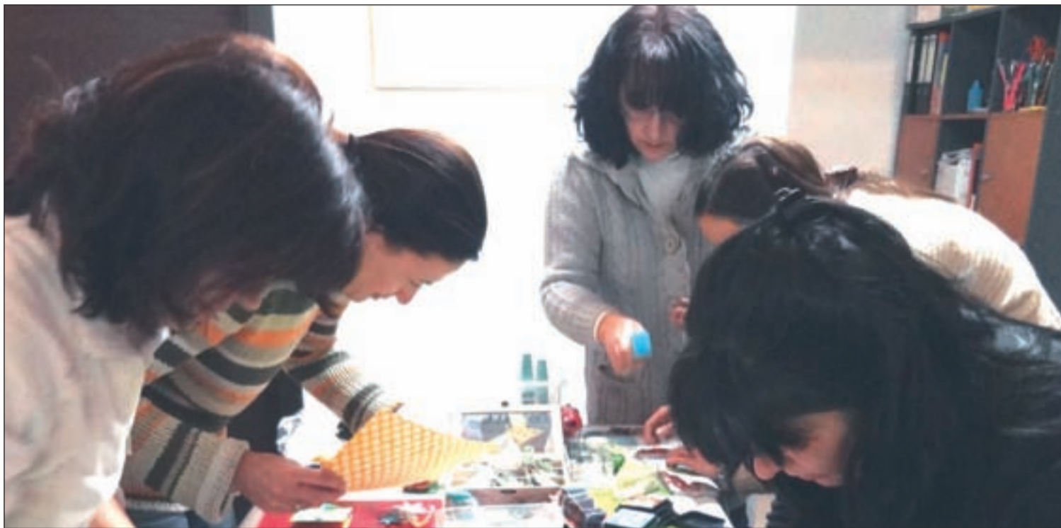
Mujeres realizando un taller de scarpbooking