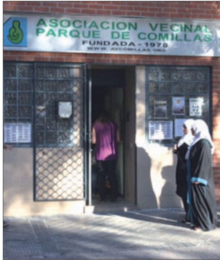
La sede de la asociación de vecinos del barrio