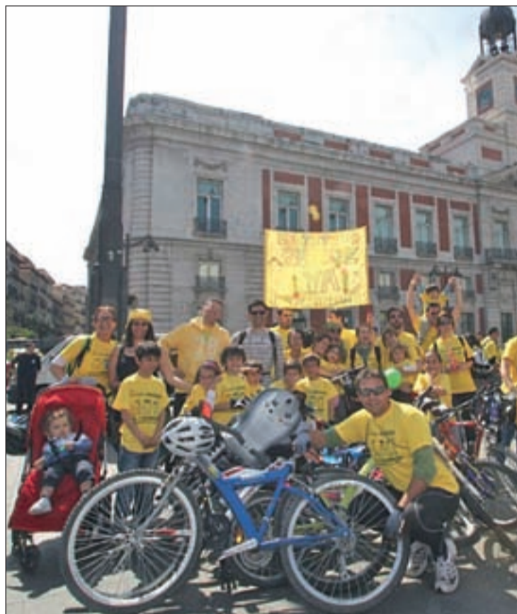
Vecinos y padres de Butarque, en la Puerta del Sol

Cuatro son las iniciativas que tienen previsto organizar en estos dos meses. El 24 de mayo, a