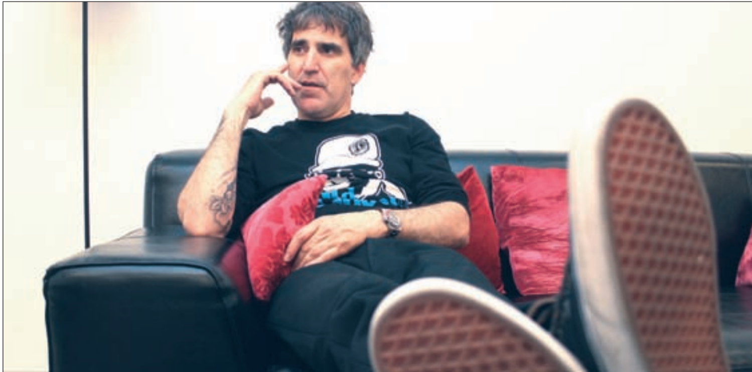
Mikel Erentxun durante la entrevista con GENTE