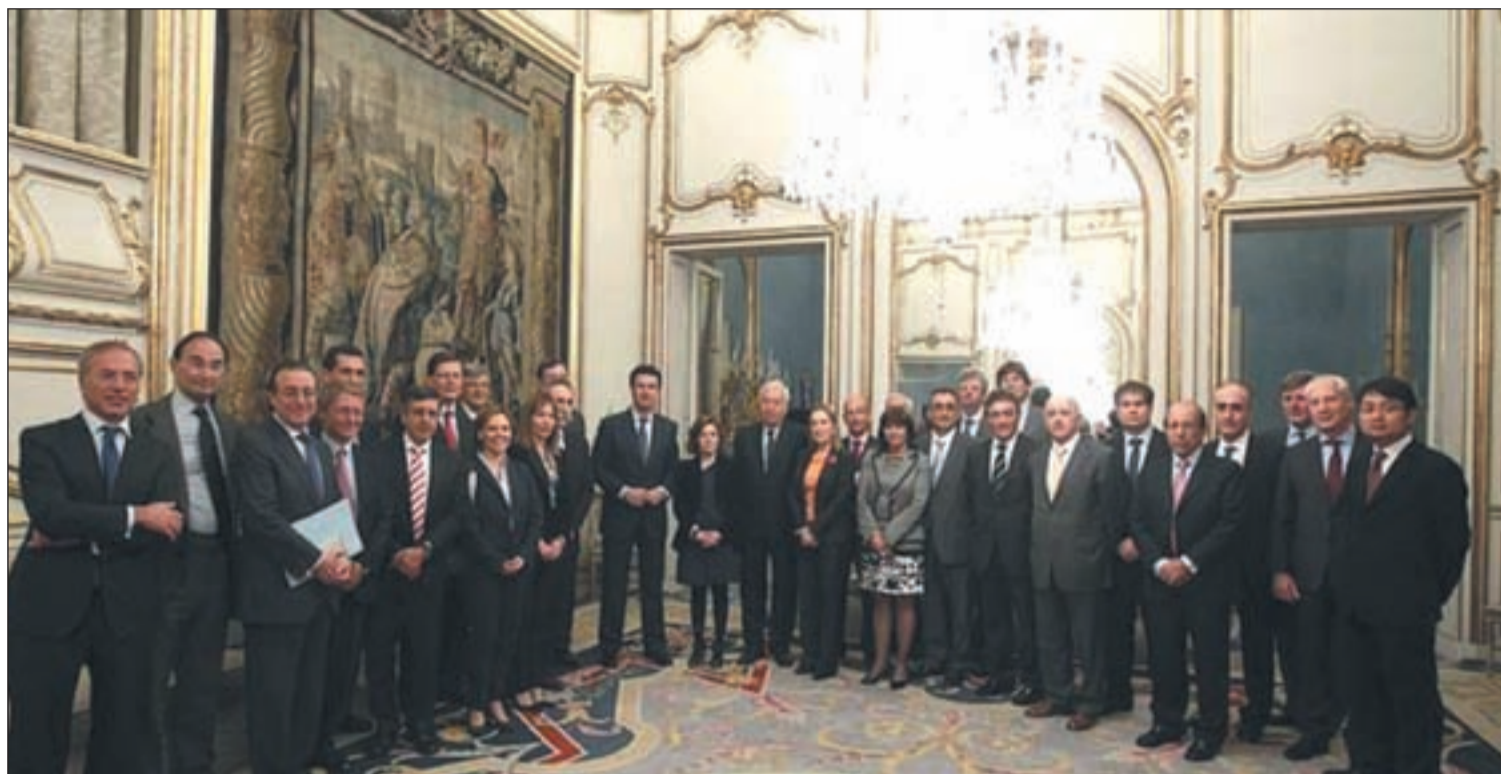
Representantes de multinaciones se reúnen con miembros del Gobierno

El parque PortAventura inaugurará este mes una nueva atracción la montaña rusa 'Shambhala'.