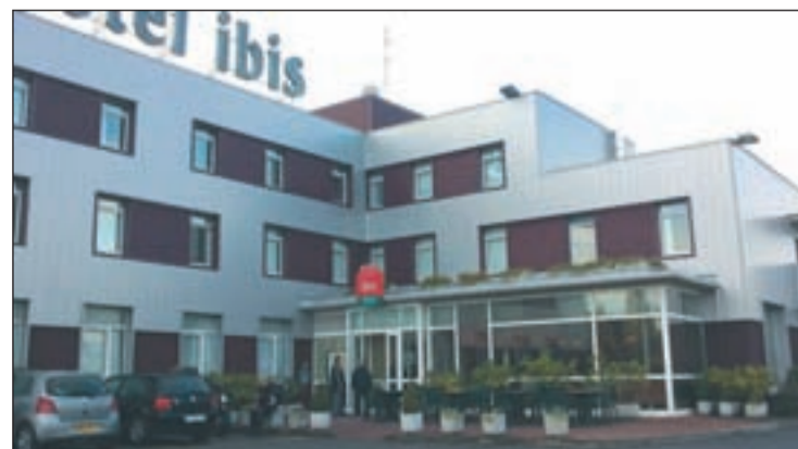
Hotel del Grupo Accor

Con 4.200 hoteles en 90 países, más de 145.000 trabajadores, 56 millones de desayunos servidos cada año y más de 545 millones de litros de agua consumidos al año la cadena hotelera reconoce su impacto en el medioambiente por ello ha buscado disponer de información completa y fiable para profundizar su estrategia en este terreno.