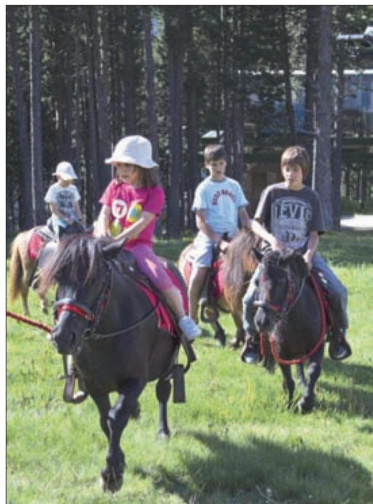
Paseos a caballo por la estación de esquí

Vallnord es también un parque de aventuras donde disfrutar en contacto con la naturaleza. En la Caubella de Pal se ubica el Pekepark, un espacio único para los más pequeños con atracciones como castillos inflables, piscina