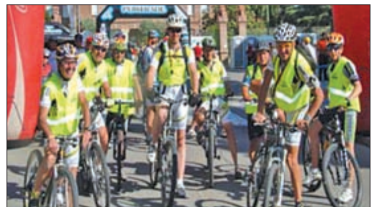
Actividades deportivas celebradas durante el 'Encuentro Filantropic'

Y por supuesto, para los más deportistas la tradicional carrera del Pinar de San Jose.