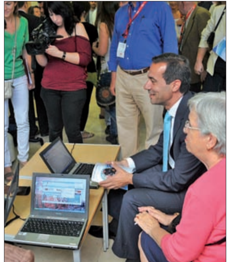
El consejero con un grupo de mayores en la presentación de la red

Victoria se desplazó el pasado miércoles al Centro de Mayores Alonso Heredia, uno de los 32 centros de la Comunidad, para comprobar en primera la destreza de los usuarios en la navegación por Internet, donde ha re-