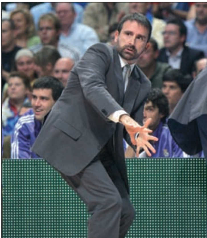
El técnico barcelonés regresa a la que fuera su casa

Los antecedentes entre ambos equipos en los 'play-offs' sonríen al Banca Cívica, ya que en las cinco ocasiones que visitó al Real Madrid en la carrera por el título, en cuatro de ellas se hizo con la victoria, aunque curiosamente su única derrota llegó en su última visita.