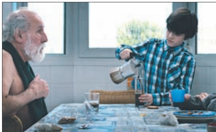
'Zombi', la historia de un nieto y su abuelo, que no recuerda nada

Por otra parte, y gracias a la colaboración de Animaula, los