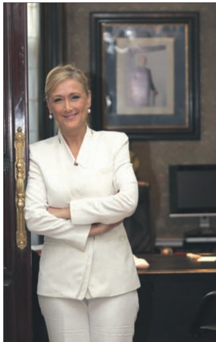
La delegada del Gobierno, Cristina Cifuentes, en su despacho

Creo que ha habido un comportamiento muy cívico y muy bueno de la inmensa mayoría de las personas que fueron a manifestarse, especialmente el sábado, que fue una manifestación numerosa. El resto de los días, las concentraciones fueron notablemente menos numerosas. La ausencia de incidentes el resto de los días se debe, sin duda ninguna, a la actuación policial que fue ejemplar. Que se hayan producido tres desalojos de la Puerta del Sol a altas horas de la madrugada sin ninguna carga poli-