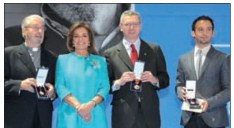
Los galardonados con la alcaldesa de Madrid, Ana Botella

Al acto, celebrado en la Galería de Cristal del Palacio de Cibeles, asistieron personalidades de la vida política, cultural y social de Madrid, entre ellos Soraya Sáenz de Santamaría, Pío García Escudero, Cristina Cifuentes o Romay Beccaría.