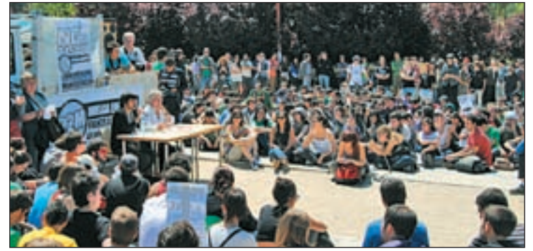
Concentración de los universitarios en el campus de Somosaguas