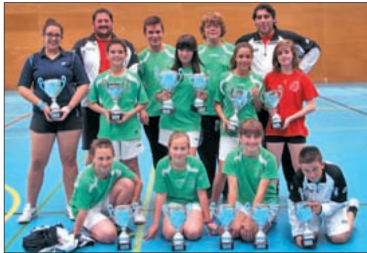
Foto de familia de los premiados