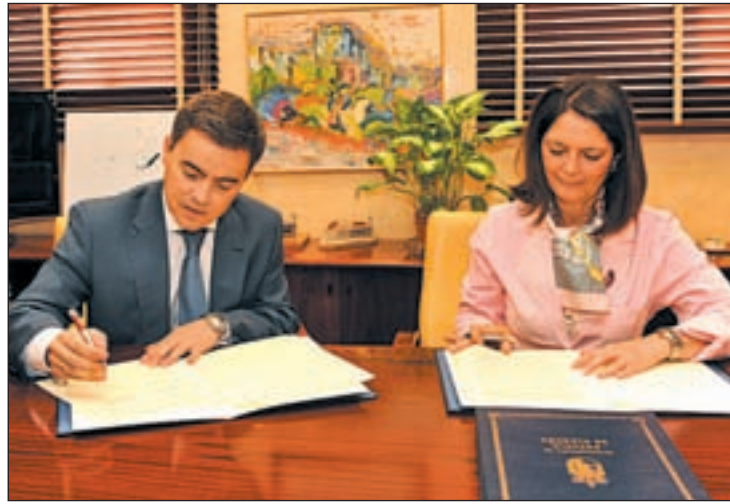
La alcaldesa de Pozuelo y el director general de MLO, durante la firma

Este acuerdo de colaboración permitirá que los escolares pozueleros de Primaria participen en diversas actividades como la realización de rutas ciclo ambientales por las zonas verdes de la localidad en las que, además, trabajarán las normas básicas de Seguridad Vial. Los pequeños también visitarán parques como el del Cerro de los Perdigonos o el Parque Forestal de Somosaguas. Todas estas acciones se complementarán con rutas ciclo sostenibles por el Parque Forestal, el recorrido por las sendas adaptadas para personas con movilidad reducida que tiene este paraje y las visitas, en metro ligero, a las cocheras de