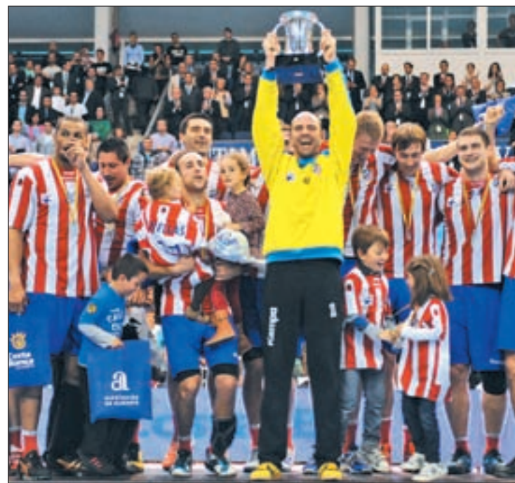
Los rojiblancos ya han levantado dos títulos en la presente temporada

Con el objetivo de lograr su primera Liga de Campeones como