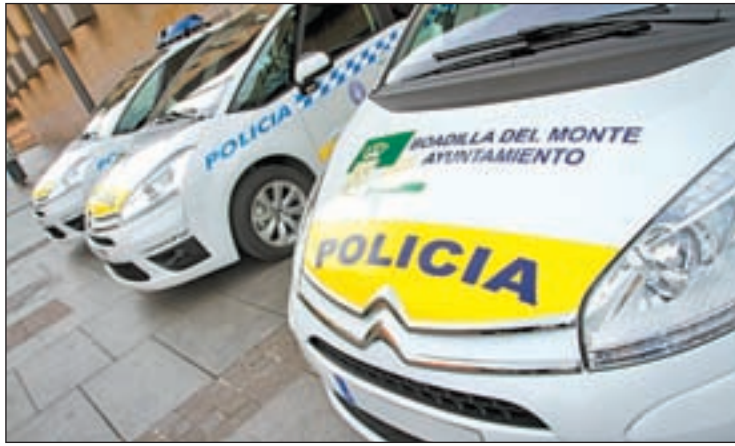
Nuevo flota de vehículos de la Policía de Boadilla del Monte

PLATERBO NUEVO PLAN TERRITORIAL DE PROTECCIÓN CIVIL