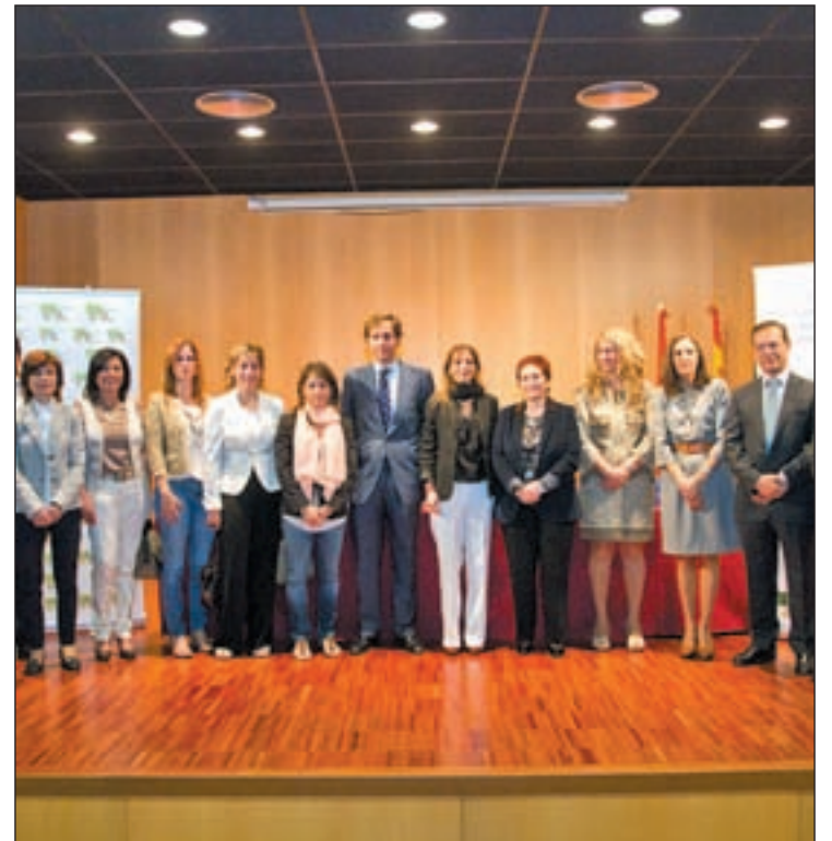
III Encuentro de Observatorios de Violencia de Género en el Noroeste

También han puesto encima de la mesa el nuevo reto al que se enfrentan los expertos, con las 'nuevas formas' de violencia de