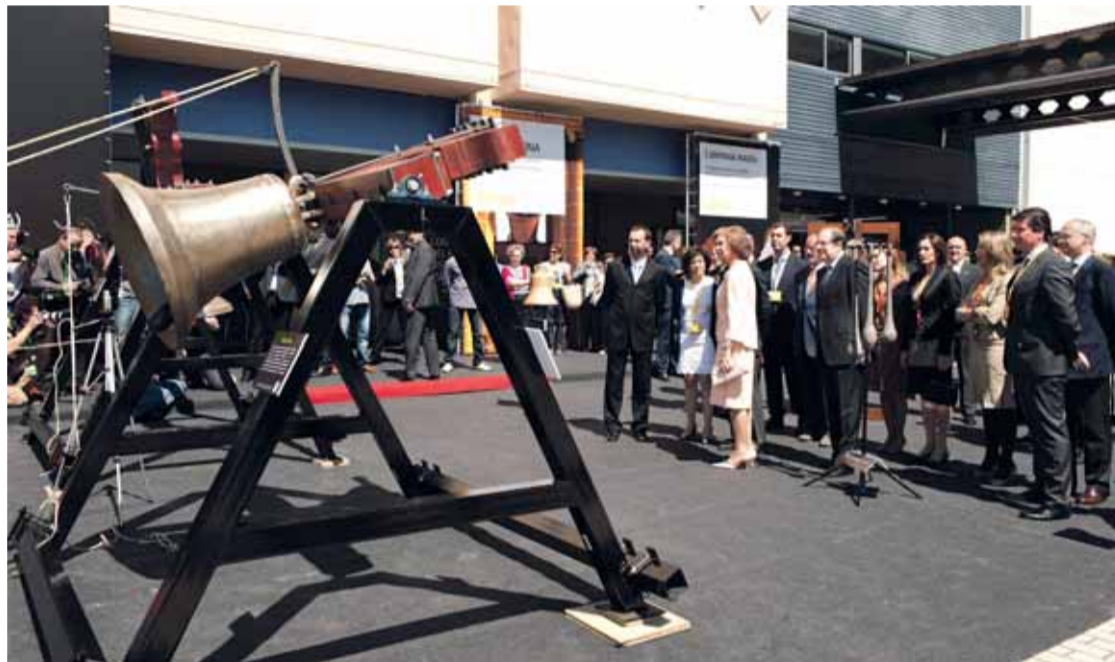
Doña Sofía asiste a la muestra musical con las campanas restauradas de la Catedral de Ciudad Rodrigo.

hasta el domingo, 27 de mayo, cuenta con más de 150 expositores, lo que supone un incremento de un 40 por ciento respecto de la última edición, más de 100 jornadas técnicas y reuniones profesionales y casi 70 ponencias y