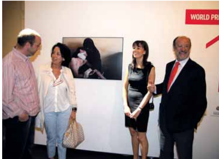
El alcalde inaugura la exposición.

J.I.F. La exposición sobre los premios World Press Photo llega a la Sala Municipal de Exposiciones de las Francesas para traernos una muestra de las fotografías que han sido galardonadas en el certamen de este año, el cual ha sido record en cuanto a estadísticas en participación con un total de 101.254 fotografías y 5.247 fotógrafos de 124 nacionalidades diferentes. Además este año tiene un aliciente ya que el español Samuel Aranda se hizo con el prestigioso premio gracias a su particular representación de la Piedad al estilo miguelangelés. La imagen ganadora fue tomada el pasado 15 de octubre en Yemen, en una mezquita de la capital de Saná, con motivo de las revueltas de protesta contra el régimen del entonces presidente de ese país islámico, el militar Ali Abdalá Saleh, y muestra a una mujer cubierta con velo que consue-