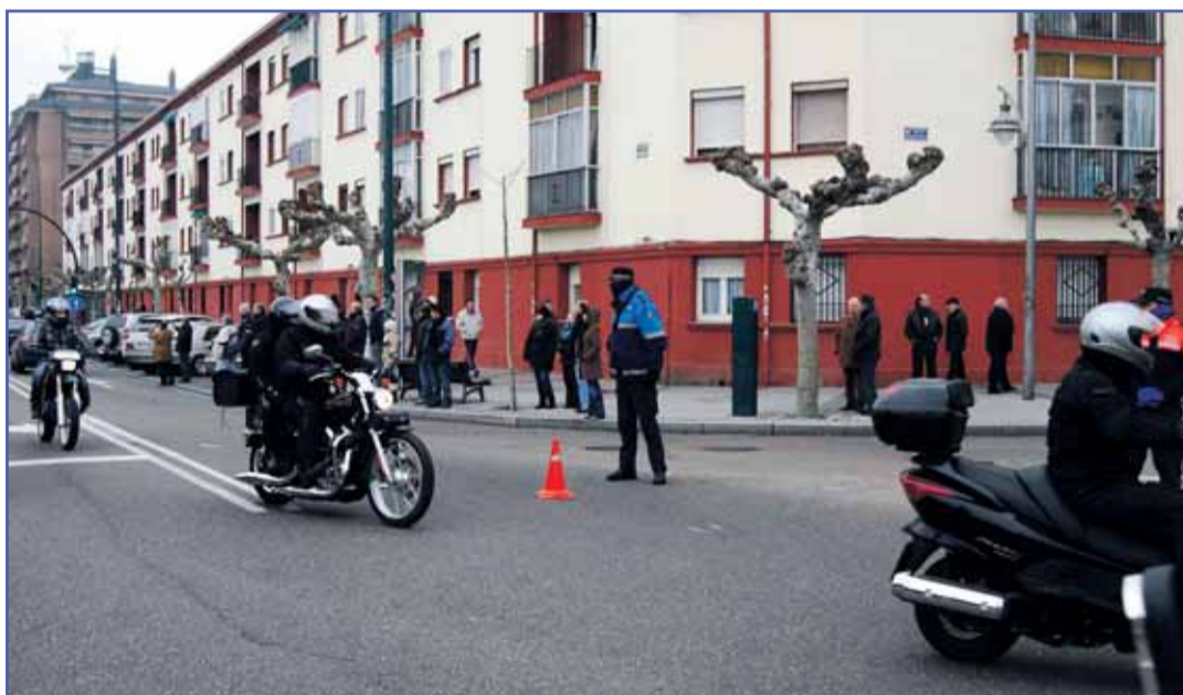
Agentes de la Policía Local controlan el paso de varios motoristas por las calles de la ciudad.

El Ayuntamiento de Valladolid es consciente de que la circulación en el medio urbano constituye el primero de los escenarios donde el conductor