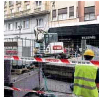
Obras en la calle Santiago.