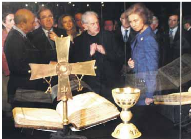
Son muchas las joyas de 'Monacatus' que la Reina observó detenidamente.

La muestra, conformada por 138 piezas y con la vida consagrada en la Iglesia Católica como eje central, se extiende por la iglesia, la sacristía, la sala capitular y el claustro del monasterio. Aborda diferentes aspectos de la vida contemplativa, la vida cotidiana, la oración, los