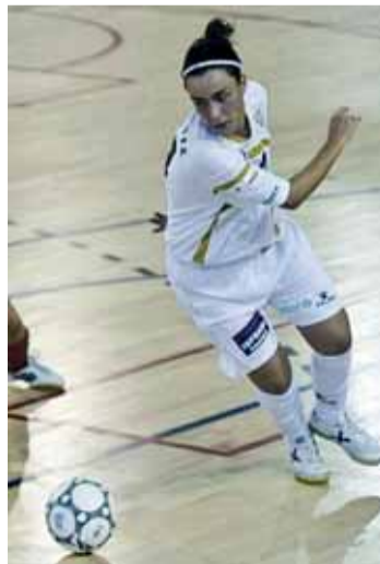
El Valladolid FSF se la juega.