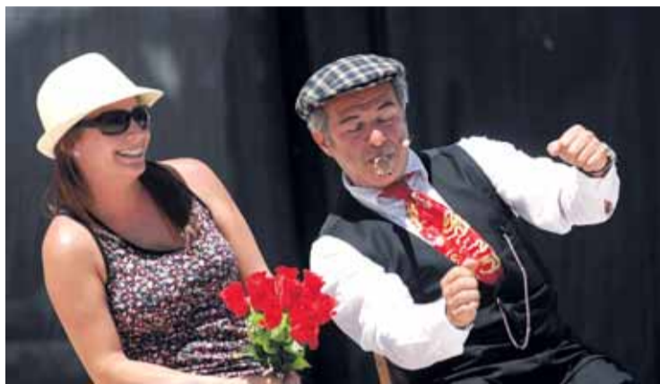
Actuación de los franceses Ulik &amp; Le Snob en la Plaza Mayor.

El Mercado del Val será el escenario donde cinco de los espectáculos coproducidos por el festival se puedan ver entre las 12.00 y las 14.00 horas. El Fakir Eduard presentará un montaje donde utilizará serpientes, fuego, clavos y cristales, entre otros elementos. La última coproducción del TAC que podrá verse durante la jornada será '¿Tragas o escupes? Jes Extender', de Xtrañas Producciones, que regresan en esta edición con una revisión del espectáculo multidisciplinar que presentaron el año pasado durante el certamen. El montaje tendrá lugar en tres pases a las 22.30, 23.30 y