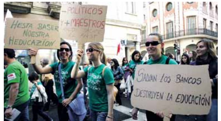
Miles de personas participaron en la marcha.

Por su parte, la Consejería de Educación ha cifrado en un 36,12% (1.583 en huelga de los 4.383 efectivos).