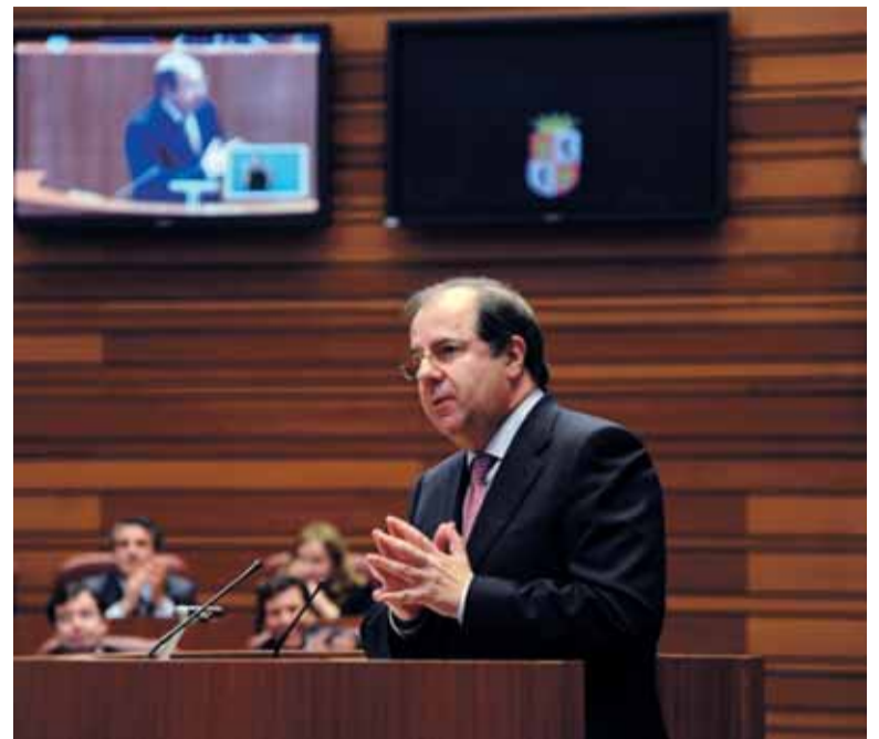
Juan Vicente Herrera durante una intervención en las Cortes.

La presentación de estos presupuestos se produce tras el visto bueno del Gobierno al Plan Económico-Financiero de Castilla y León para el horizonte 2012-2014 y que prevé un ajuste por 859 millones sin más impuestos y con la congelación del empleo público hasta 2014.