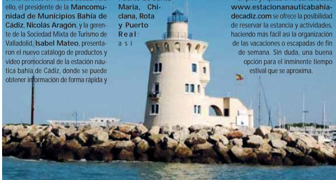
La oferta de deportes y las actividades complementarias es amplia en Cádiz.

El objetivo es aumentar la demanda turística y, por lo tanto, generar empleo y riqueza en la Bahía. Desde www.estacionnauticabahia-decadiz.com se ofrece la posibilidad de reservar la estancia y actividades, haciendo más fácil así la organización de las vacaciones o escapadas de fin de semana. Sin duda, una buena opción para el inminente tiempo estival que se aproxima.