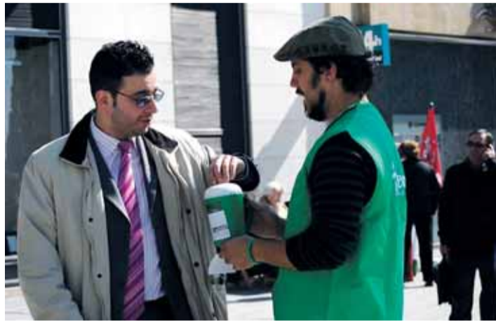
Un vallisoletano hace su donación a la AECC.

Los fondos recaudados en esta provincia, servirán a la AECC para continuar con las tareas que viene desempeñando desde hace 51 años: financiar proyectos en investigación oncológica, llevar a cabo programas de apoyo y acompañamiento a las personas