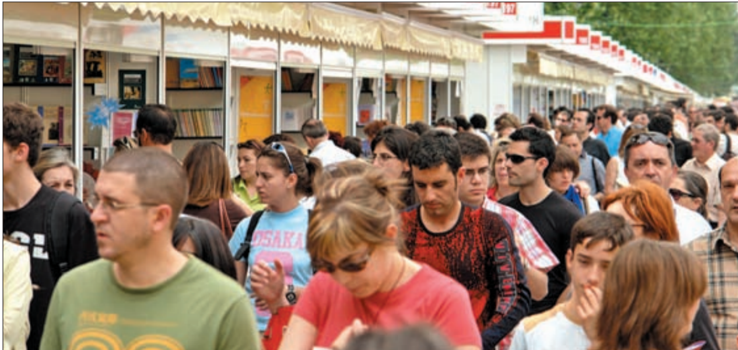
Feria del Libro en el Parque del Retiro