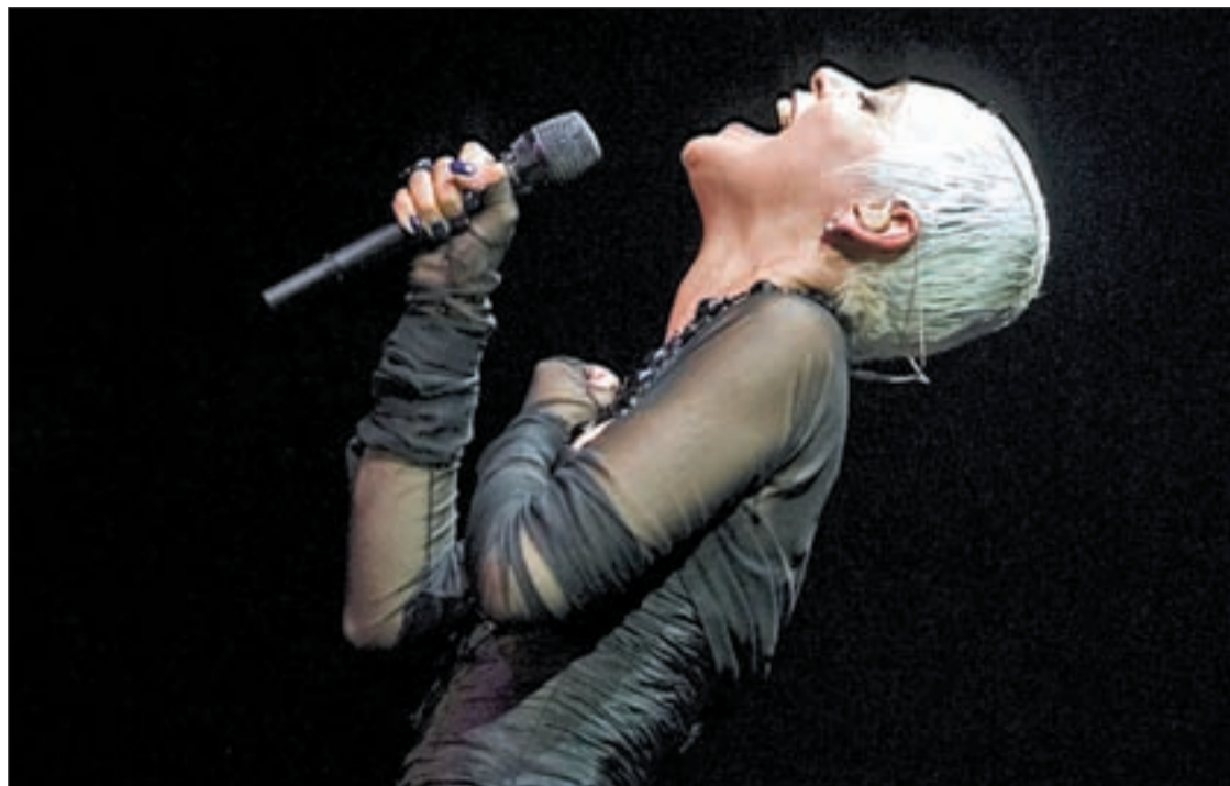
La cantante de fados, Mariza