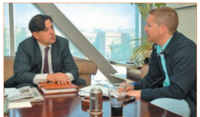
Un momento de la entrevista con 'Gente'

una solución. Habilitó un procedimiento por el cual el gerente o el concejal tienen la posibilidad de solucionar un problema que afecta al vecino. Directamente pueden invocar al delegado del área y en un plazo de 24 horas tener una contestación de si se actúa y cómo, y si no, el por qué. De esta manera, he conseguido avances notables", concluye.