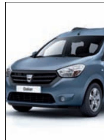
Llegará a España en septiembre

El Dacia Dokker es un vehículo de cinco plazas polivalente, con una o dos puertas laterales deslizantes, dirigido a los clientes que necesitan cargar objetos voluminosos, viajar con la familia o combinar ambas posibilidades. Por su parte, el Dacia Do-