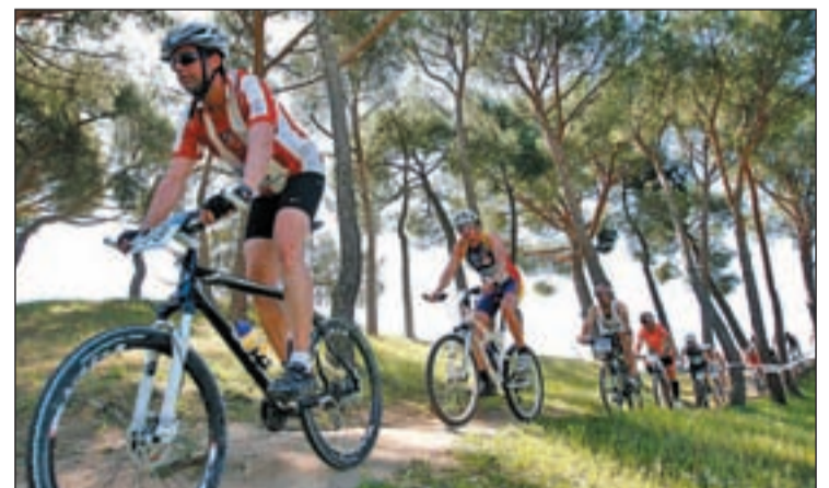
El ejercicio de mountain bike puede marcar las diferencias

Al tratarse de una competición no pensada para profesionales, se ha dado la posibilidad a los participantes de formar equipos de tres personas, en la que cada miembro acometería cada uno de los segmentos de los que