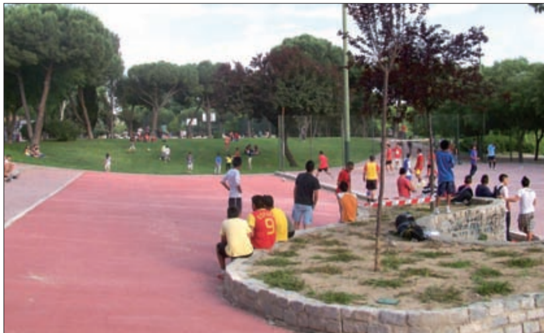
Una de las actividades del proyecto de Integración Comunitaria en el distrito