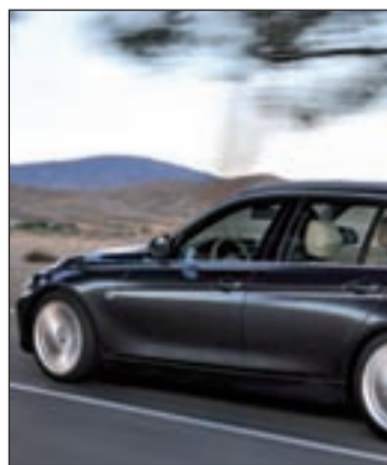
BMW Serie 3

Así, el BMW Serie 3 Touring montará un propulsor de gasolina de cuatro cilindros con una potencia de 245 caballos y un remodelado motor diésel de 2.0 litros y de 184 caballos. La oferta se completa con un propulsor diésel de seis cilindros optimizado, que desarrolla una potencia de 258 caballos.