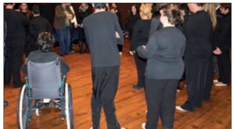
Los discapacitados participarán en talleres de expresión

sonal. El trabajo culmina con un certamen donde se representan todas las obras. La XI edición se inaugurará el 30 de mayo en el Centro Cultural Municipal Antonio Machado, de San Blas, y es el punto de encuentro de los representantes de los 27 centros implicados en el proyecto durante este curso escolar.