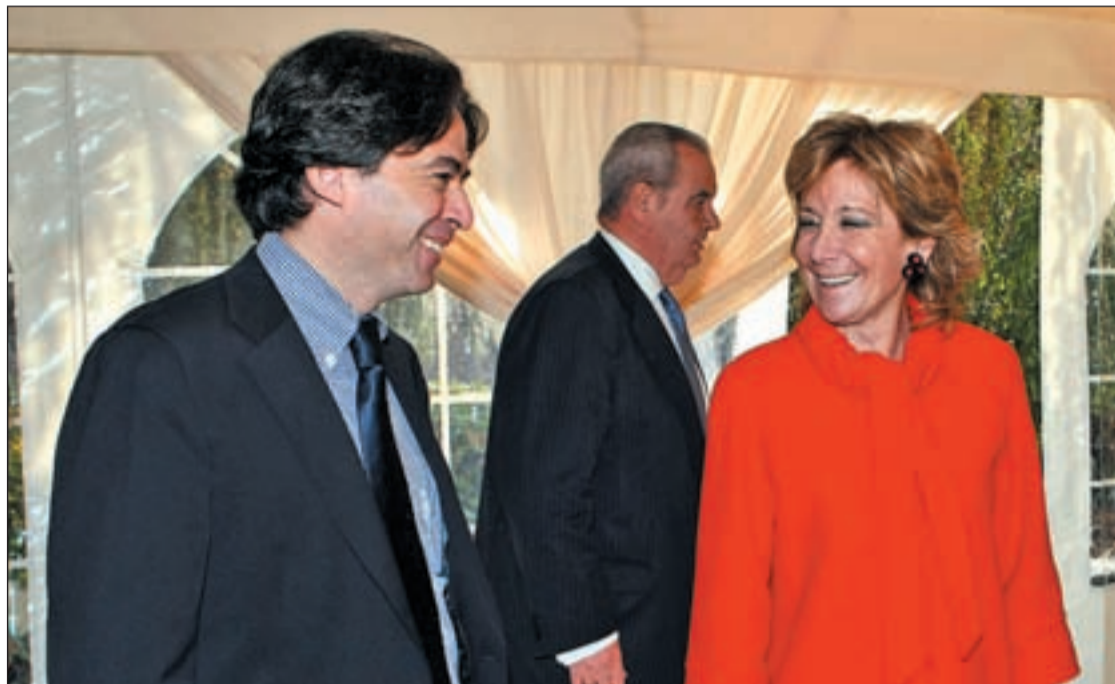
La presidenta de la Comunidad de Madrid junto al consejero de Economía en un acto

Y es que, según el consejero, al poder acceder a mayor financia-