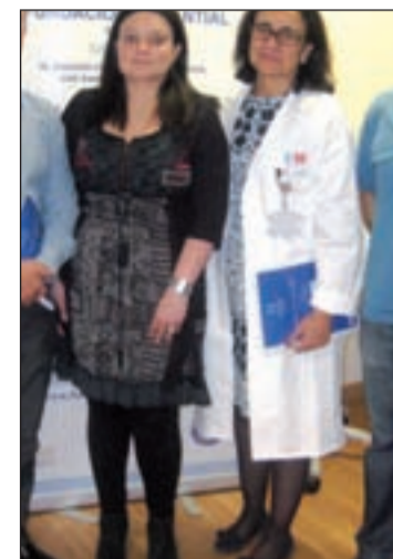
Un momento de la presentación

Esta experiencia piloto se ha desarrollado durante el último año en colaboración con los Centros de Salud Mental Rafael Alberti, de Villa de Vallecas, y Peña Gorbea, de Puente. En su transcurso fueron atendidos 63 usuarios.