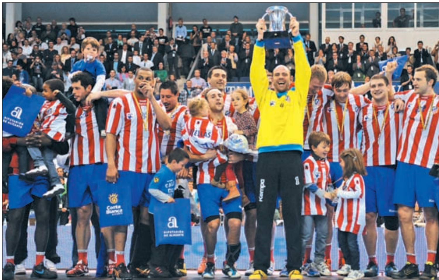
Los rojiblancos, con Hombrados a la cabeza, ya han levantado dos títulos en la presente temporada

EL BM ATLÉTICO DISPUTA LA FINAL FOUR EUROPEA EN COLONIA