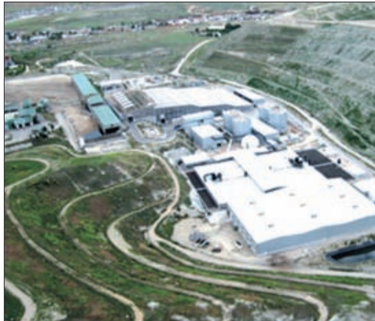
Una vista aérea del complejo tecnológico de Valdemingómez