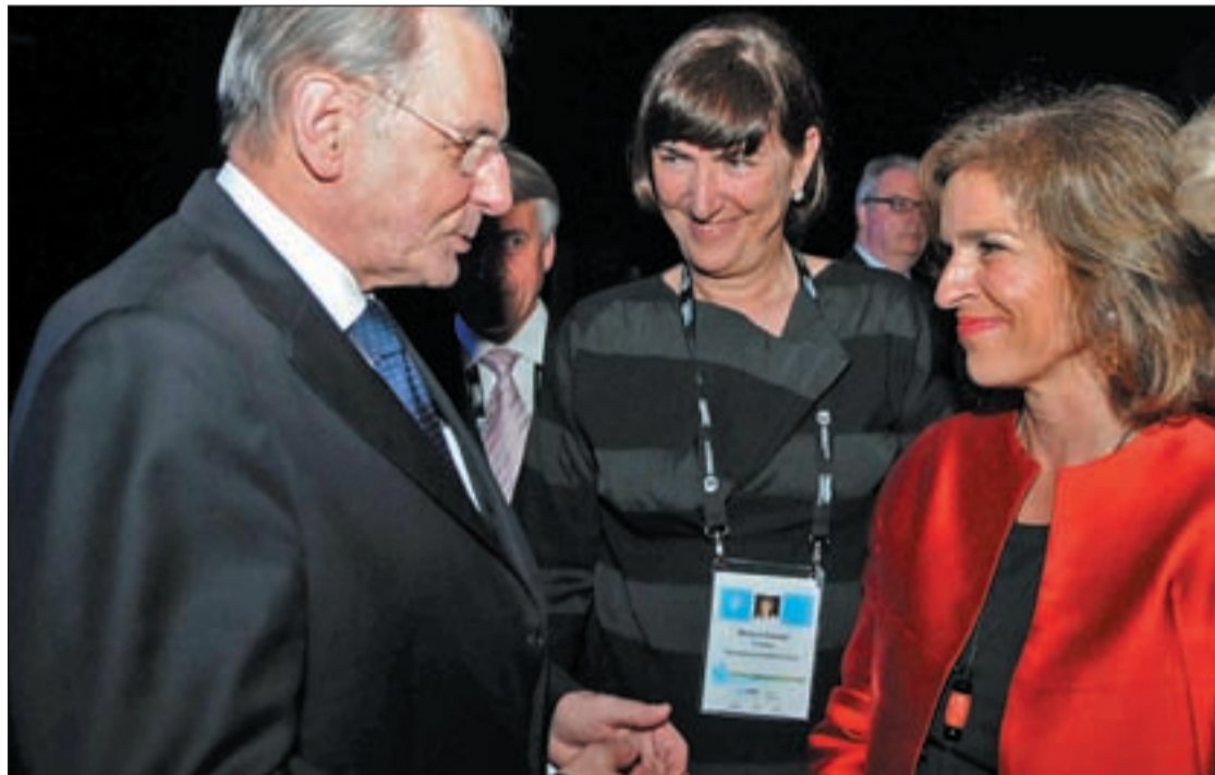
La alcaldesa de Madrid, Ana Botella, junto al presidente del COI, Jacques Rogge

Los miembros de Izquierda Unida celebran la noticia aunque han sido más críticos con la candidatura de la capital madrileña. "Resulta complicado recortar políticas sociales y gasto público que va en detrimento de los servicios a los ciudadanos y, al tiempo, decirles a los madrileños con una sonrisa de oreja a oreja que se están preparando