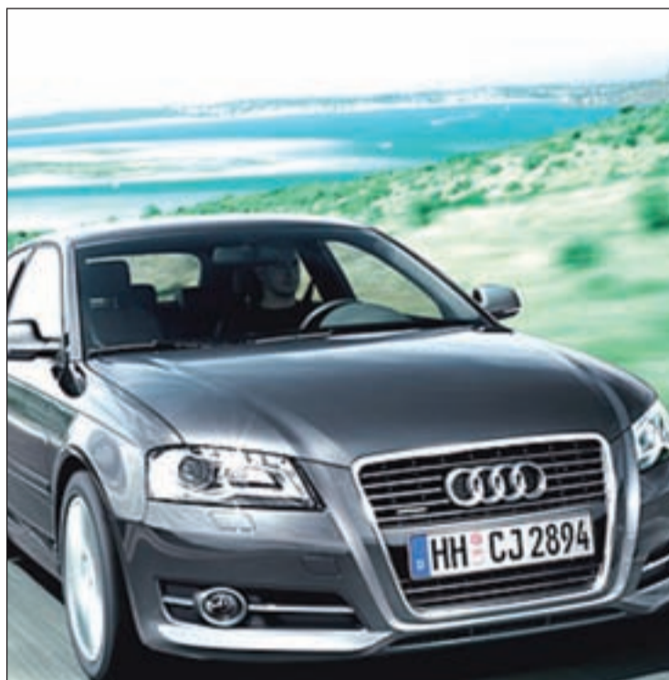
El nuevo A3 estará disponible con potencias entre 122 y 180 caballos

Audi ampliará la gama del nuevo A3 en 2012 con un motor diésel "ultraeficiente". Se trata de un TDI de 1,6 litros que ofrece un consumo de 3,8 litros a los cien kilómetros, con unas emisiones de CO2 de 99 gramos por kilómetro. Posteriormente llegará un 1.4 TFSI con tecnología 'cylinder on demand'. Este nuevo modelo de Audi destaca asimis-