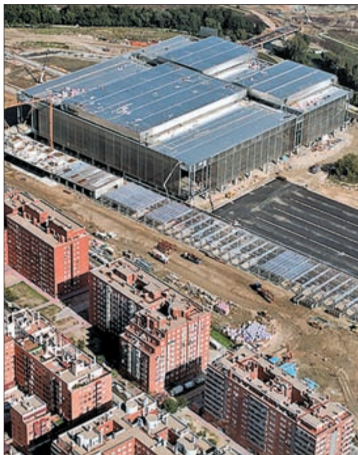
La Caja Mágica, una de las apuestas de Madrid 2020

En este sentido, la candidatura para 2020 se asienta sobre las mismas bases que la presentada con motivo de los Juegos de 2016. Madrid contaría con dos