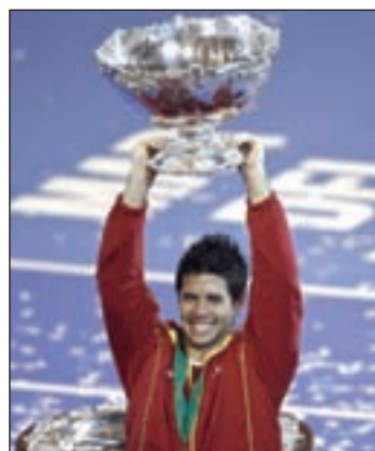
España aspira a revalidar título

minatoria su cuarta final en cinco años. La pasada temporada, que terminó con la consecución de la 'ensaladera' por parte del equipo español, la selección ya tuvo que superar a Estados Unidos, en aquella ocasión en cuartos de final y viajando hasta Austin, en Texas, para jugar en pista dura. El equipo norteamericano