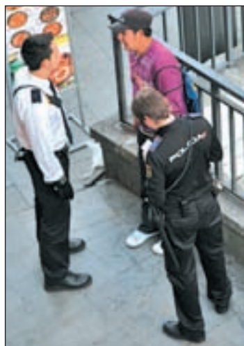
Un control policial