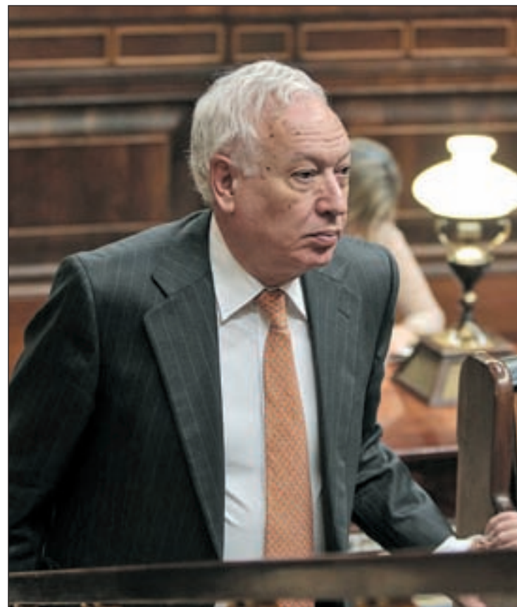
José Manuel García-Margallo, ministro de Asuntos Exteriores

García-Margallo adelantó que uno de los mensajes que trasladará a su colega británico, William Hague, será la necesidad de "volver a la aplicación del acuerdo de 1999", por el que se permitía a la flota gaditana faenar en las aguas en disputa, siempre y cuando no se adentraran a menos de 225 metros de la costa.