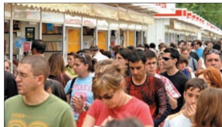
Feria del Libro de Madrid

En esta 71ª edición la Feria cuenta con Italia como país invitado. Bajo el lema de 'Italia, un país para leer', la Embajada de España y el Instituto Italiano de Cultura de Madrid han diseñado un programa en el que participarán 26 personalidades del mundo de la cultura y de las ideas de este país