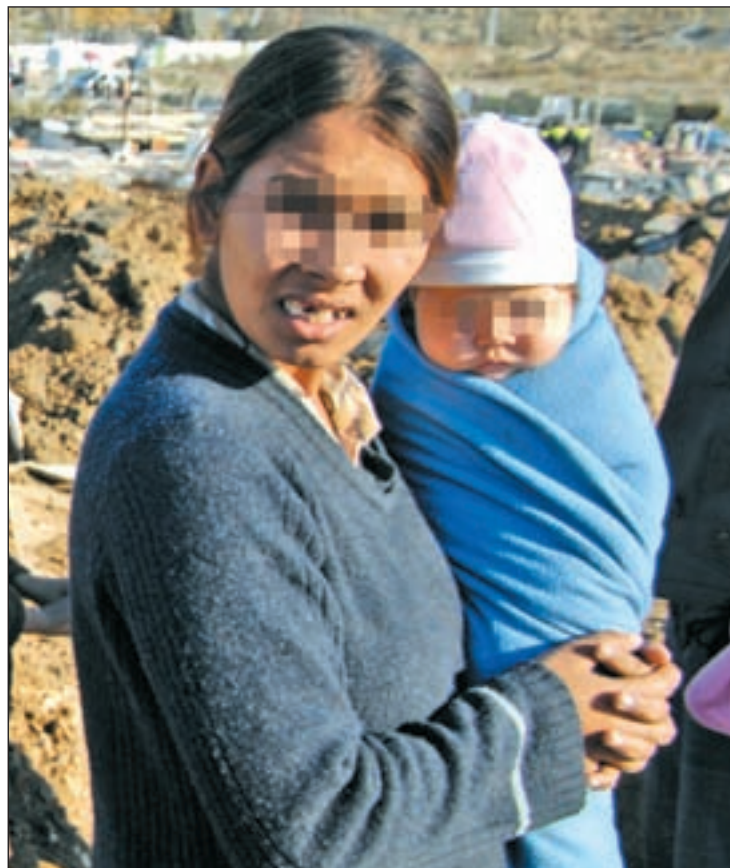
Una familia en la Cañada Real de Madrid

Por otro lado, el número de familias con bajos ingresos que reciben ayuda de la Seguridad Social por cada hijo a cargo se sitúa en más de un millón en 2011, lo que ha supuesto un crecimiento de casi 100.000 en los últimos dos años. Estos datos han producido, según Unicef, que haya un cambio en las costumbres de consumo, afectando en un primer momento a activida-