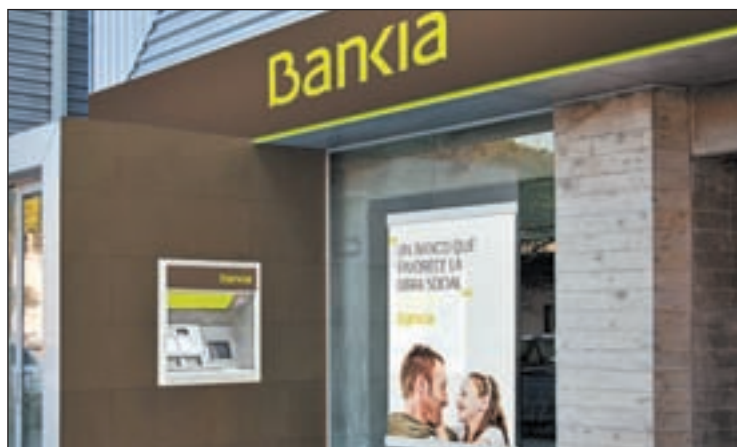
Una sucursal de Bankia

FINANZAS UNIRÍA BANKIA Y CATALUNYA CAIXA