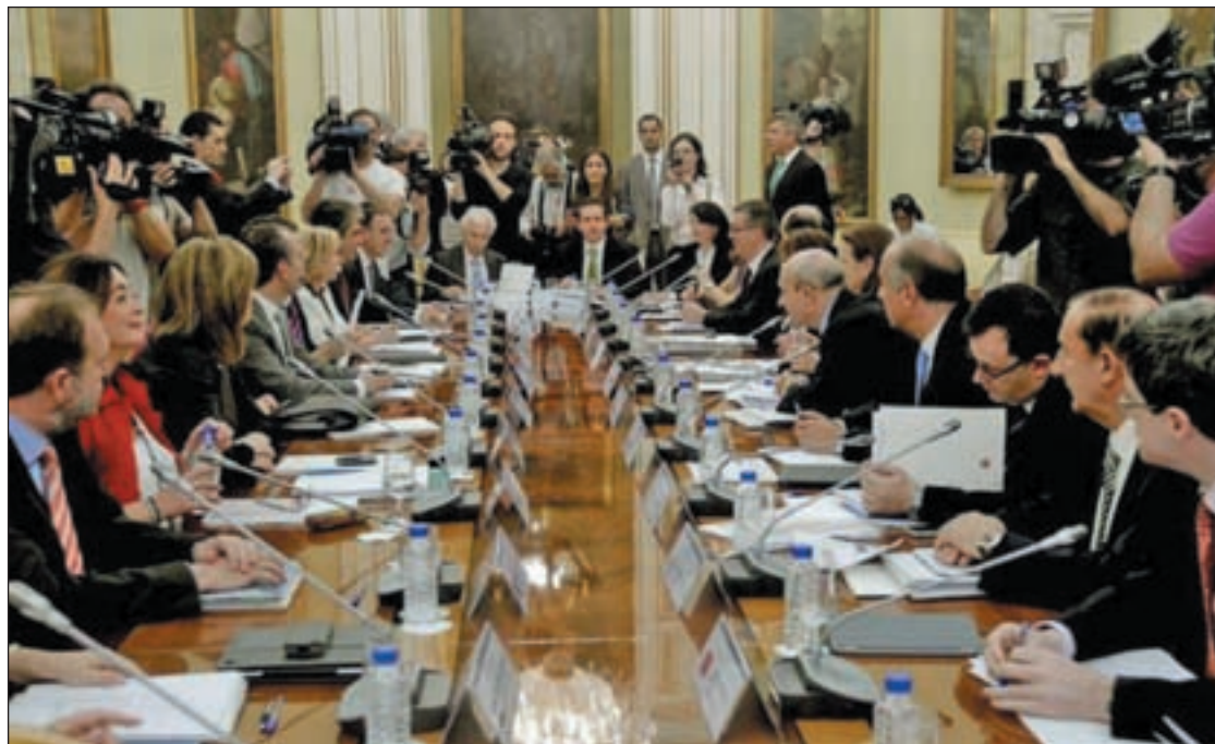
El ministro y los consejeros en la Conferencia Sectorial de Educación este jueves

De esta forma, y según informó la FSA-PSOE, el Gobierno contará con ocho consejerías debido a la fusión de Educación con Cultura y Deportes; además, Bienestar Social y Vivienda y Agroganadería pasarán a manos de IU, con quien previsiblemente gobernará en coalición y que contará, también con una dirección general.