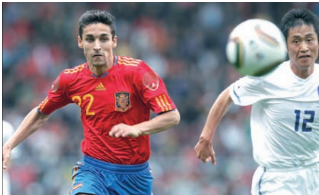
España ya jugó un amistoso ante Corea como preparación del Mundial de Sudáfrica

DEL BOSQUE TENDRÁ A SUS ÓRDENES A LOS 23 CONVOCADOS EL 1 DE JUNIO