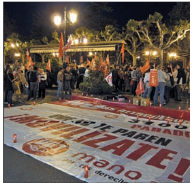
Una protesta contra la reforma laboral este miércoles

La reforma laboral incluirá nuevas bonificaciones por contratación, más allá de las ya anunciadas para el contrato de emprendedores. Así, los familiares de trabajadores autónomos o por cuenta propia que se den de alta en el RETA para poder colaborar en dichas actividades gozarán de una bonificación del 50% de la cuota de la Seguridad Social durante los primeros 18 meses de actividad.