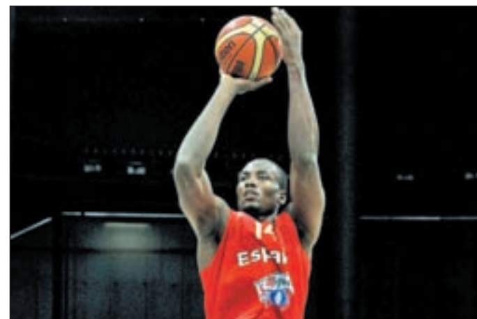
El jugador de origen congoleño es clave en los Thunder

El seleccionador español Sergio Scariolo no perderá de vista lo que acontezca al otro lado del Atlántico, al mismo tiempo que seguirá con atención el desenlace de los 'play-offs' por el título de la Liga Endesa, donde compiten la mayoría de los jugadores que tienen opciones de formar parte de la lista final que defenderá la plata obtenida en Pekín. Completaría la convocatoria un Marc Gasol que ya descansa desde hace varias semanas tras caer eliminado en la primera ronda por el anillo.