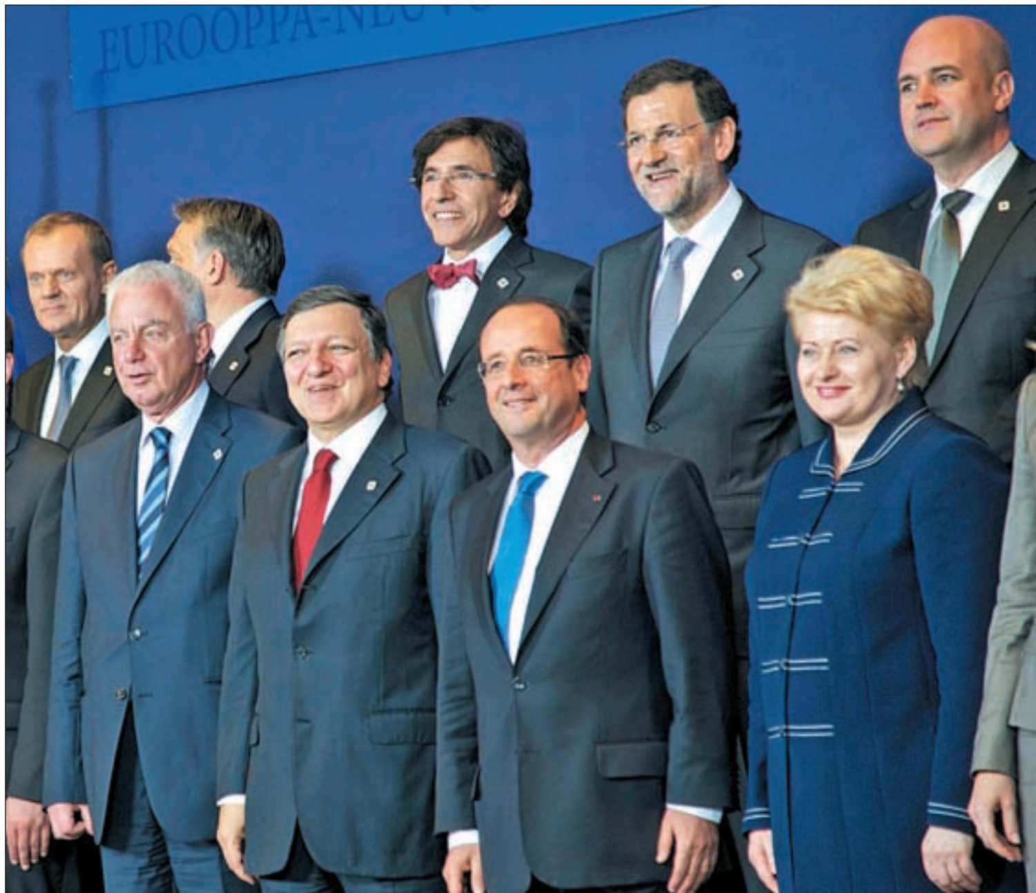
El presidente del Gobierno, Mariano Rajoy, posa en la foto de familia de la cumbre de líderes europeos

El presidente del Gobierno reclama que el BCE garantice la liquidez y la sostenibilidad de la deuda pública • Merkel veta la emisión de eurobonos a pesar de la presión de Hollande y Monti Pág. 9