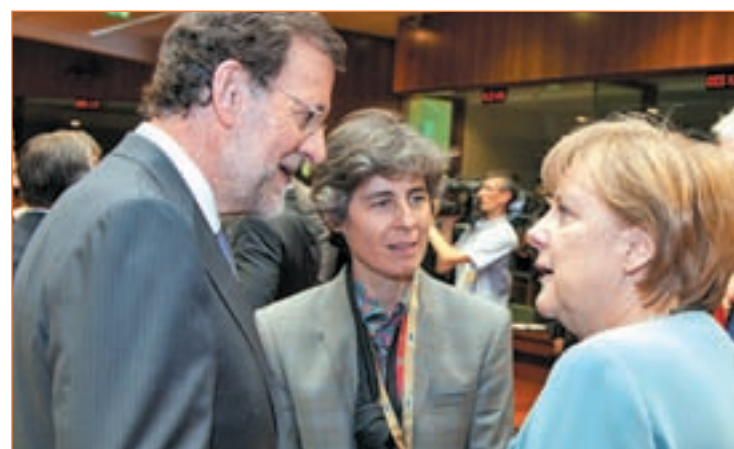
Mariano Rajoy conversa con Angela Merkel

"Los eurobonos no son una contribución al crecimiento", zanjó Merkel a su llegada a la cumbre extraordinaria de líderes de la UE.