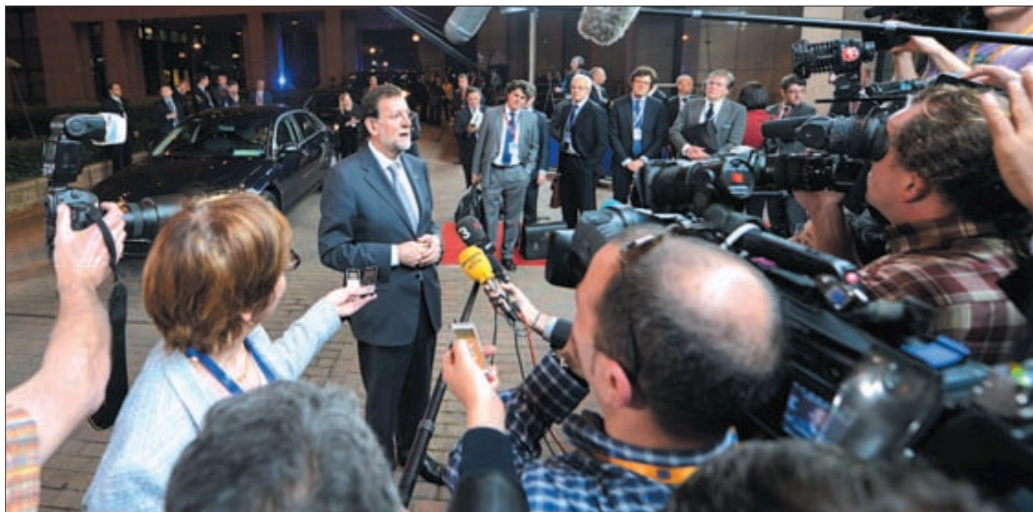
El presidente del Gobierno, Mariano Rajoy, atiende a la prensa a las puertas de la Cumbre