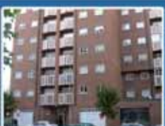
Edificio Orotava Piso en Parquesol de 3 dormitorios amplios, salón muy luminoso, cocina y 2 baños. Garaje, trastero y piscina comunitaria. 185.886 €