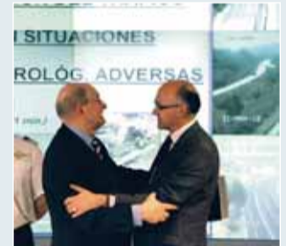
El director provincial de Tráfico, Ángel Toriello.