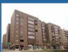
La Castellana Amplio estudio, 61 m 2 . 1 dormitorio, cocina, garaje trastero. 109.360 €