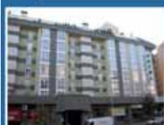
Edificio Sofia Piso muy bien distribuido junto Hotel Trip Sofia. Dos dormitorios, 1 baño. Garaje, trastero y gimnasio comunitario. Sólo 121.604 €