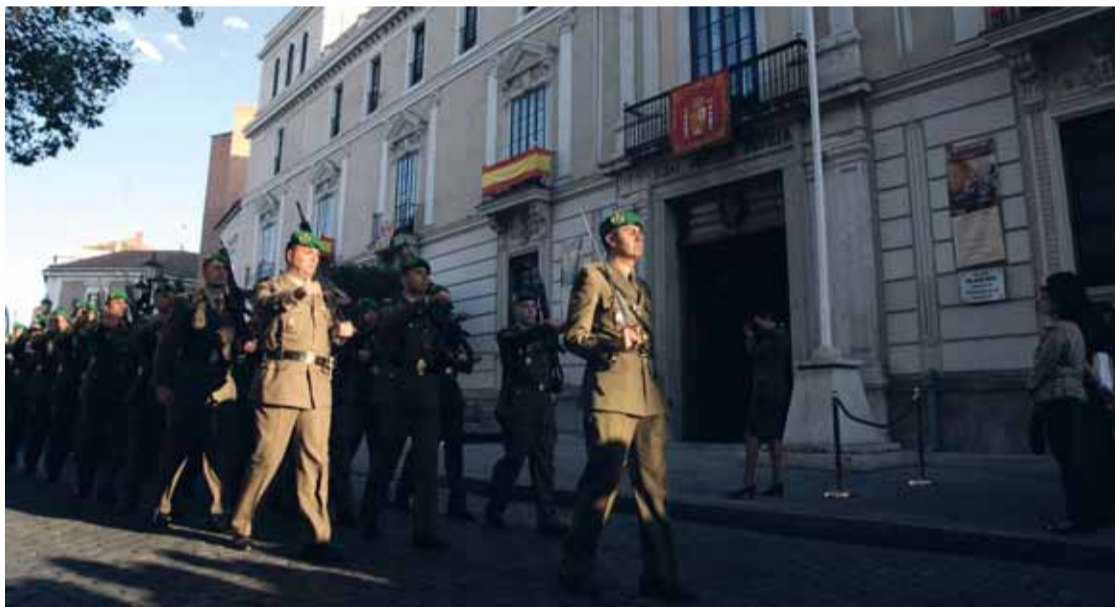
Actos del Arriado solemne de la Bandera Nacional celebrado esta semana en el Palacio Real.

Por último, a las 18.15 horas de ese día se celebrará un pasacalles que culminará en la Academia de Caballería, con un concierto de música militar gratuito a partir de las 20.00 y para el que se instalarán 2.000 sillas para el público.