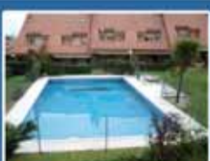
Residencial Tomillares Adosados en una ubicación privilegiada en Parquesol. 3 dormitorios más buhardilla. Muy luminoso. Garaje para 4 vehículos. Piscina comunitaria. 293.462 €