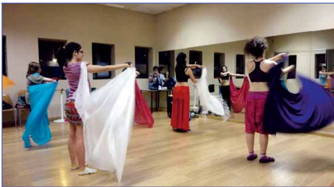
Uno de los talleres de baile celebrados en la programación de actividades de Vallanoche.

El objetivo principal de estos programas, coordinados por el Centro de Programas Juveniles, de la Concejalía de Bienestar Social y Familia es "proporcio-