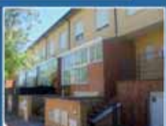
Atrio-Veracruz Preciosos adosados en Parquesol. 3 dormitorios, salón, cocina amueblada, 2 baños y un aseo. Parcela de 48 metros. Garaje 4 vehículos. Excelentes calidades. Para entrar a vivir. Sólo 186.460 €