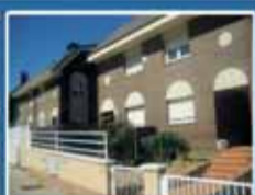
Parque Avenida Chalet 3 dormitorios, buhardilla, garaje y parcela. Desde 240.960 €. Última vivienda a la venta