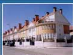
Jardín Botánico Espectacular y amplísimo adosado en Martín Santos Romero. 252 metros. 3 dormitorios más buhardilla. Amplio garaje y preciosas bodegas. Mejor visto. 290.202 €