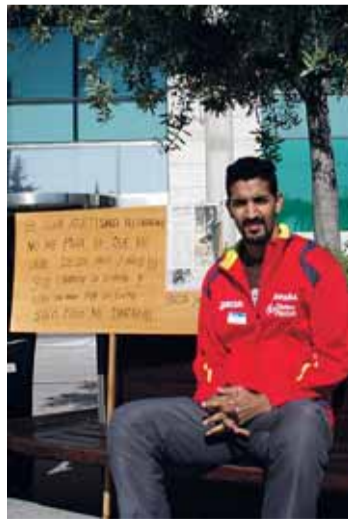
Elbendir durante su acampada.

mo de Alcobendas afirma que no debe "cantidad alguna". Y explica que ese dinero corresponde "a los premios de la última temporada que tenía licencia por este club (2008-2009), si bien como de sobra él conoce, al igual que el resto de atletas del Club, es requisito indispensable para su devengo, la renovación de la ficha federativa con el Club, circunstancia esta que no se produjo, por exclusiva voluntad del atleta". El atleta de Viana de Cega está recibiendo numerosas muestras de cariño, como él mismo asegura, de concejales de la oposición en el Ayuntamiento y de vecinos.