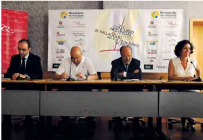
Presentación del XIV Concurso de Pinchos de la ciudad.

La económica no es la única novedad en el que será el primer concurso presidido por Jaime Fernández. Este año se hace una apuesta por las nuevas tecnologías y se contará con la aplicación 'Tappas 2012' para móviles Iphone y con tecnología Android, mediante la cual los interesados podrán encontrar mapas para localizar los establecimientos participantes, hacer comentarios sobre los pinchos degustados y votar para otorgar el premio 'popular'. Por otro lado,