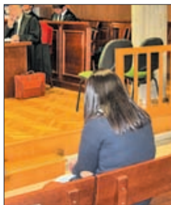
La cuidadora en el juicio

El ministerio público pide penas de 14 años de prisión por un delito contra la salud pública y otros cinco de lesiones.