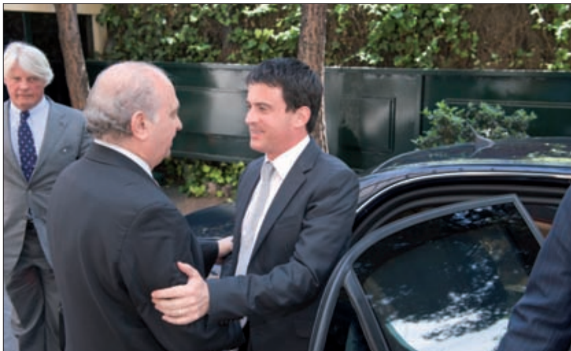
El ministro del Interior Jorge Fernández Díaz recibe a su homólogo francés Manuel Valls

Picardo quiere imponer a la flota gaditana el cumplimiento de una ley de protección medioambiental de 1991 que prohíbe que se pesque con determinadas artes. Margallo aclaró que España no tiene "nada que objetar" al objetivo de la norma. El problema estriba en "dónde se puede aplicar esa ley", pues existe una disputa en torno a la soberanía de las aguas que rodean el Peñón. España no reconoce a Reino Unido más aguas que las del interior del puerto.