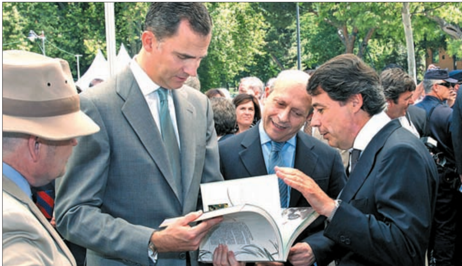
El Príncipe Felipe en la inauguración de la Feria del Libro en el Parque del Retiro