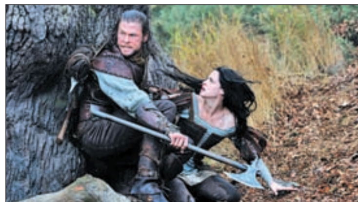
Fotograma de 'Blancanieves y la leyenda del cazador'

un corazón de oro", señala Hemsworth que también relata cómo el primer encuentro con Blancanieves cambiará a su personaje. "La primera vez que la ve queda cautivado. Esa chica tiene algo especial", revela el actor australiano que apunta como la conciencia de el cazador "empieza a despertar".