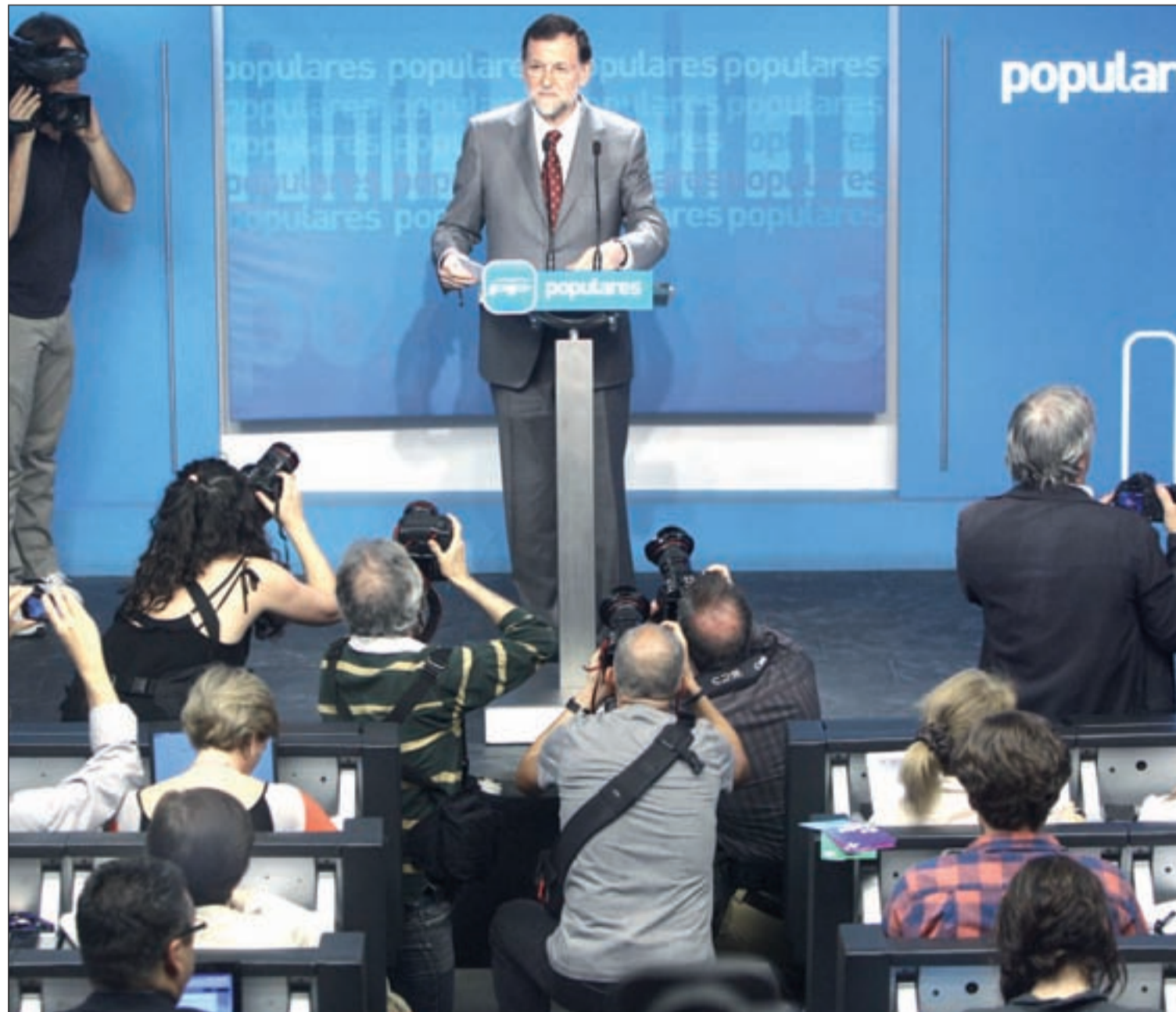
El presidente del Gobierno, Mariano Rajoy, comparece ante los medios de comunicación

El presidente del Gobierno resalta que "las entidades financieras no pueden caer porque caería el país" y asegura que la alternativa a la nacionalización de Bankia "era la quiebra" Pág. 6