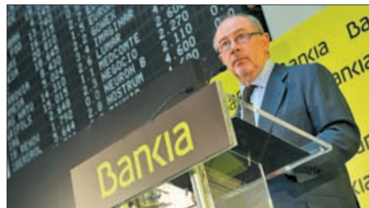
Rodrigo Rato, ex gerente de Bankia y del FMI

De esta forma se abre el primer paso para la apertura de un proceso penal por la gestión llevada a cabo en Bankia, que cerró 2011 con unas pérdidas de 2.979 millones de euros y su matriz, Banco Financiero y de Ahorros (BFA), que anunció este lunes 'números rojos' de 3.318 millones de euros.