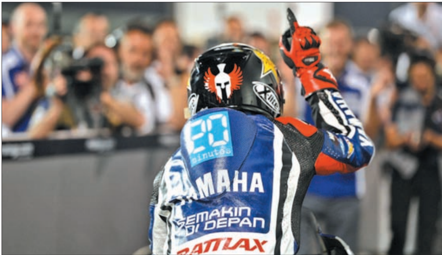
Lorenzo llega a esta prueba como líder del Mundial de Moto GP

EL CIRCUITO DE MONTMELÓ ALBERGA EL GP DE CATALUNYA CON LORENZO COMO FAVORITO