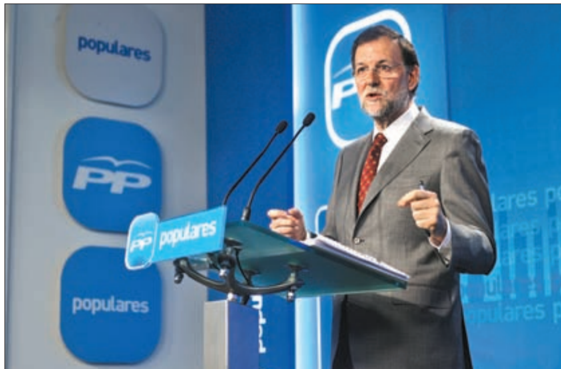
Mariano Rajoy comparece ante los medios de comunicación

"Los ahorros están más garantizados que nunca", insistió el presidente del Gobierno, para quien la entrada del Estado en