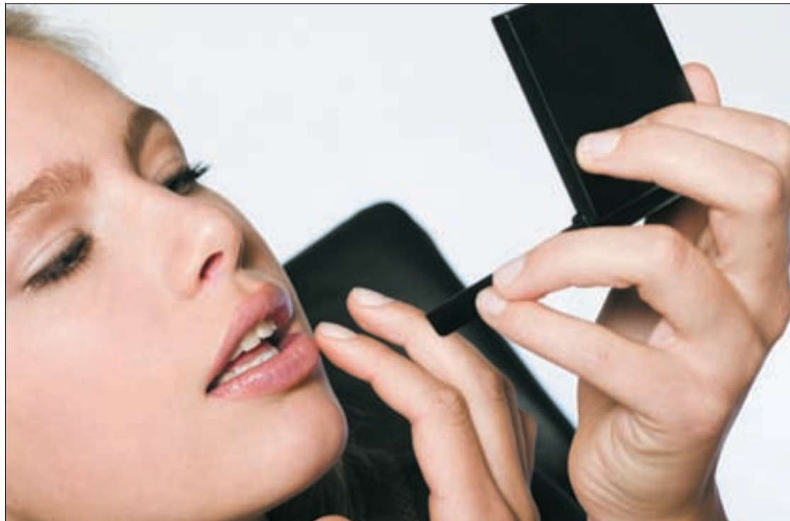
El maquillaje debe ser fresco, de un tono similar al de la piel, para conseguir un resultado más natural

Por su parte, la piel de la típica mujer mediterránea con cabello y ojos oscuros acepta los excesos y lucen muy bien los labios de color rojo fuerte. Los tonos que más favorecen a estas