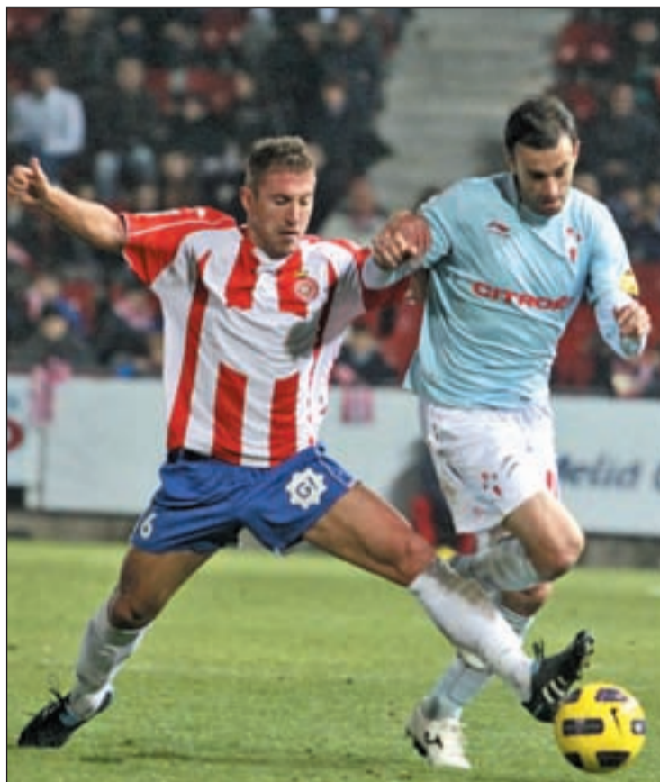
El Celta depende de sí mismo para acabar en segunda posición

Con el descenso ya adjudicado a Villarreal B, Alcoyano, Cartagena y Nástic de Tarragona, la atención se centra en conocer los equipos que jugarán las eliminatorias de ascenso a Primera División. Celta o Valladolid son los únicos que tienen asegurado un billete para estas dramáticas series, mientras que otros cuatro equipos dirimen las tres plazas restantes. A Córdoba y Alcorcón les basta con un punto en sus encuentros ante Celta y Numancia, aunque ambos equipos buscarán un triunfo que les haga albergar esperanzas de contar con el factor campo a su favor en la