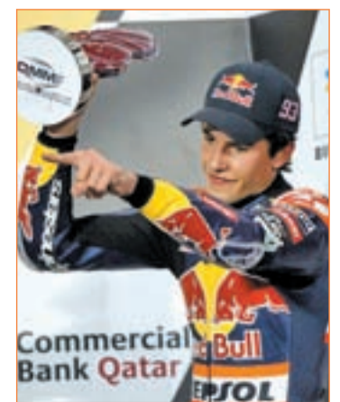
Márquez es segundo

El italiano se presenta por tanto como uno de los candidatos a robar protagonismo a Dani Pedrosa. El catalán se quedó en Le Mans fuera del podio por primera vez en la temporada y se espera que dé un paso al frente ante su público para repetir el triunfo de 2008 y de paso añadir aún más picante al pulso entre Stoner y Lorenzo.