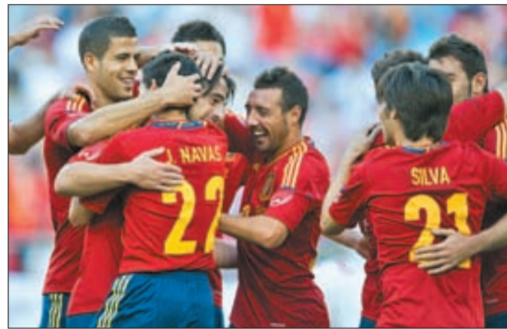
España ya superó a Serbia el pasado sábado en Saint-Gallen

Huesca, al Almería no le queda otra alternativa que ganar en el Juegos del Mediterráneo al descendido Alcoyano y esperar un tropiezo de sus rivales directos para mantener viva la posibilidad de regresar a una categoría en la que ha militado durante cuatro campañas consecutivas.