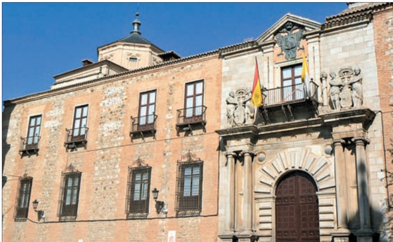
Fachada del Palacio Arzobispal de Toledo