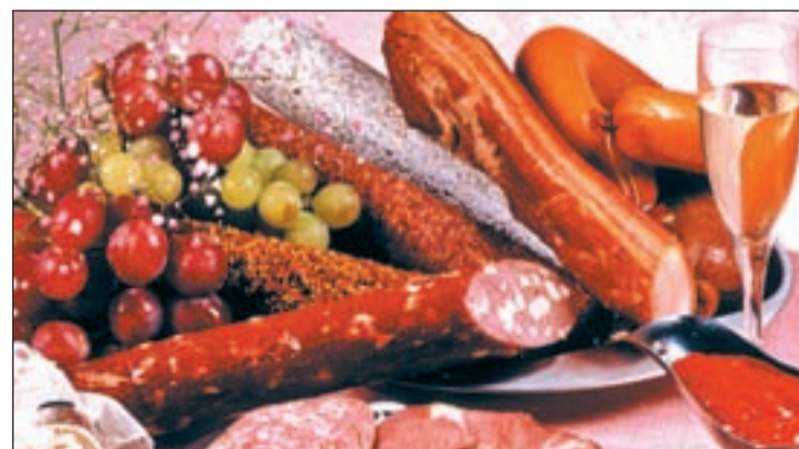
Los horarios de las comidas son tan importantes como el qué se come

El reciente descubrimiento sugiere que las consecuencias para la salud de una dieta pobre, puede ser el resultado de, en parte, un desajuste entre nuestro reloj biológico y los horarios de las comidas.