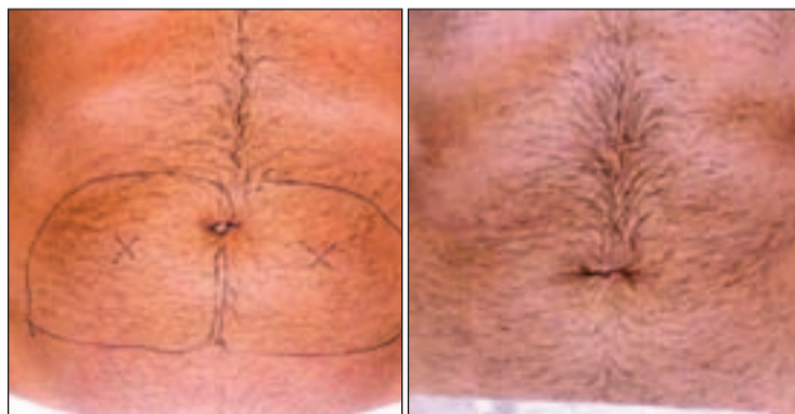
ANTES/DESPUÉS Los efectos pueden empezar a notarse entre la cuarta y la octava semana, aunque cada caso es distinto. Cualquier persona puede hacer este tratamiento excepto aquellas que presentan sensibilidad al frío.

"La técnica consiste en aplicar frío desde el exterior para llegar al tejido de la grasa", explica