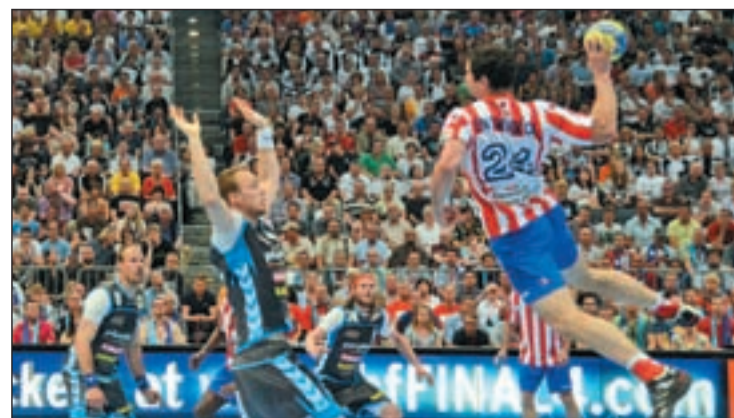
Los rojiblancos cayeron en la final europea ante el Kiel

vocar el conjunto leonés una huelga para protestar por la difícil situación económica que atraviesa la entidad. En caso de no presentarse, el Cuatro Rayas Valladolid podría arrebatarle la tercera plaza de la clasificación. Los pucelanos reciben a Amaya Sport San Antonio que aspira a mejorar su décima posición.