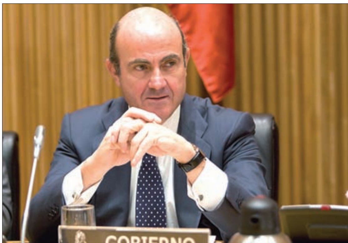
Luis de Guindos, ministro de Economía y Competitividad

La última idea la adelantó el periódico alemán Die Welt. El rotativo aseguró esta semana que las autoridades europeas consideran ofrecer a España una línea de crédito preventiva a través del fondo de rescate europeo para ayudar a apuntalar su débil sector bancario. Esta línea de crédito daría a España la opción de intentar captar fondos propios para la recapitalización de los bancos y después recurrir a la ayuda externa en caso de que no logre la financiación suficiente.