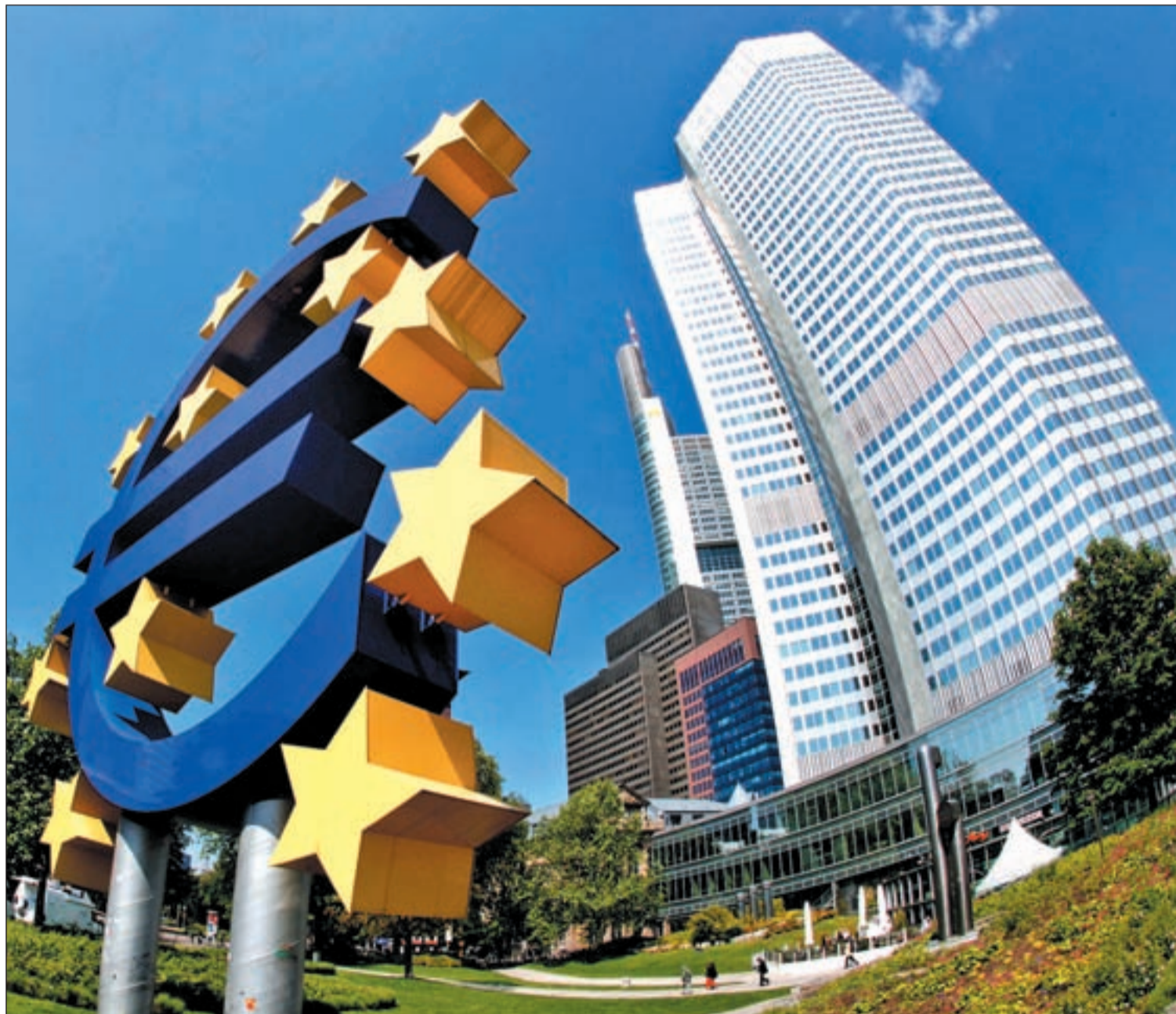
La Comisión Europea propone avances en la unión bancaria

El Gobierno decidirá su actuación sobre el sistema financiero tras los informes del FMI y las consultoras • La unión bancaria europea no solucionaría a tiempo los problemas de Bankia Pág. 4