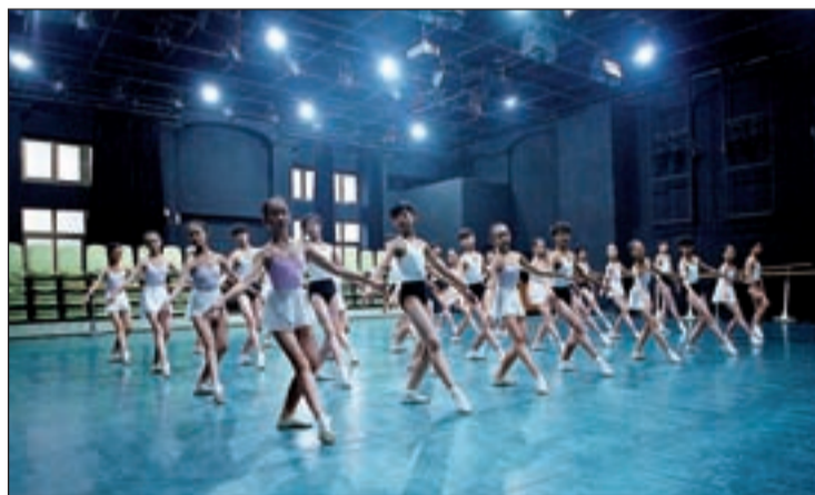
La obra 'Bailarina joven', de Daxin Wu

Ansiedad de la imagen, examina la incertidumbre del pre-