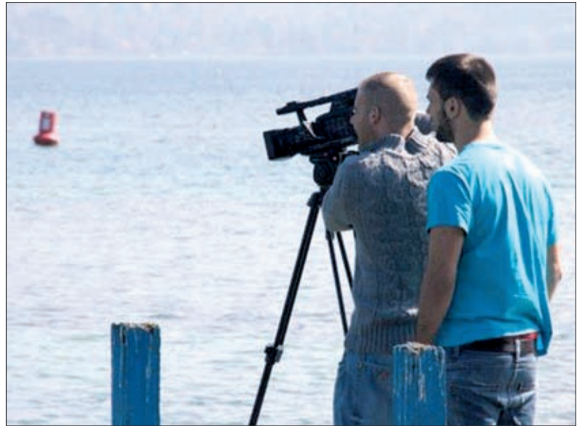
Una clase del Curso Intensivo de Documentales de la Universidad Camilo José Cela

Partiendo de la experiencia práctica de un emprendedor, la iniciativa, que incluye un taller de creación de empresa y elaboración de un plan de negocio, incide también en aspectos como la automotivación, el Coaching, la inteligencia emocional, la gestión del miedo y del estrés, las