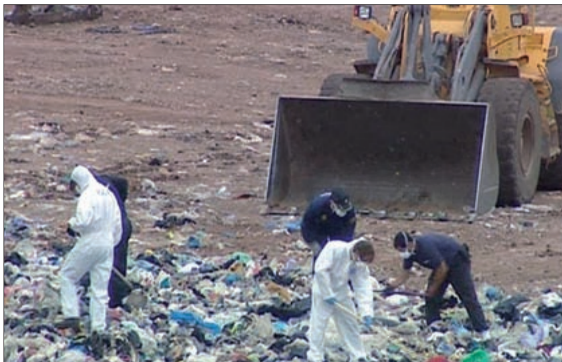
La Policía Científica trabaja en el vertedero de Dos Aguas