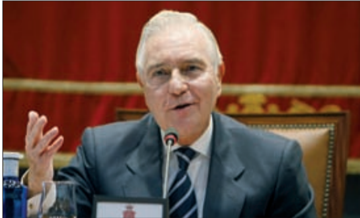
Carlos Dívar, presidente del CGPJ y del Tribunal Supremo

Los representantes del PP y de CiU han votado en el órgano de gobierno de la Cámara Baja contra las peticiones de comparecencia de Dívar formuladas