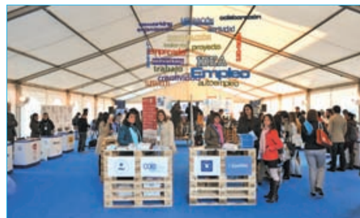
Jornada de emprendedores celebrada en la Universidad

en las mejores empresas. Sin embargo, el centro educativo no se queda ahí. Con el objetivo de adaptarse a la nueva sociedad, fomenta la actitud emprendedora entre la comunidad universitaria a través de distintas actuaciones y programas de formación y de uso de habilidades y destrezas para poner en práctica una actividad empresarial.