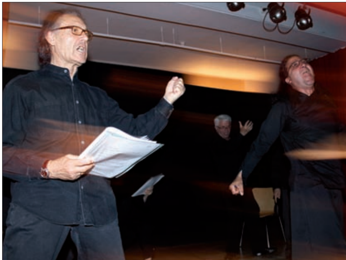
Ensayo de 'Proceso por la sombra de un burro', en la Escuela de Teatro

La obra, basada en 'La Fábula de la sombra de un burro', de Esopo, narra el proceso judicial