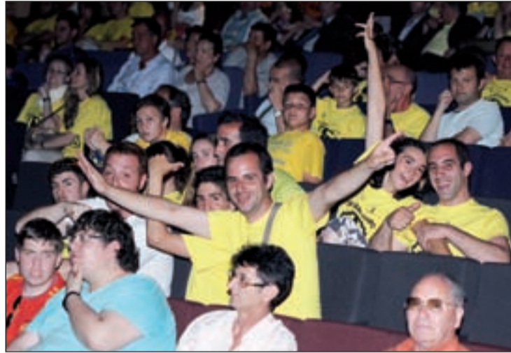
El partido de ida se pudo seguir en el Buero Vallejo

El estadio alfarero vestirá sus mejores galas para un partido