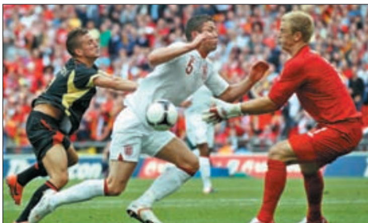
El combinado inglés de Roy Hodgson ha sido uno de los más afectados

Ingllaterra ha sido la que ha salido peor parada. Dos campeones de Europa con el Chelsea como Lampard o el central Gary Cahill no estarán a las órdenes de un Roy Hodgson cuyo estreno en el banquillo sigue marcado por los contratiempos, ya que Gareth Barry también ha tenido que volver a casa antes de