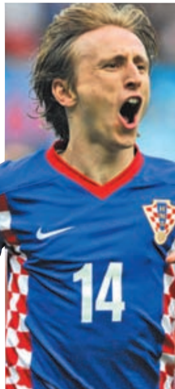
Modric es la gran estrella croata

Hace cuatro años, Croacia llegó al torneo continental tras dejar fuera a Inglaterra y con el buen fútbol por bandera se plantó en cuartos de final, donde sólo la falta y la lotería de los penaltis