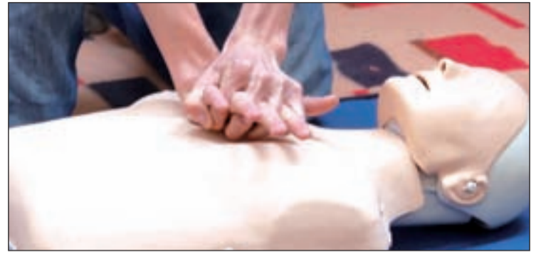
La reanimación cardiopulmonar formaría parte de los contenidos

La idea inicial es que este temario se proyecte a través de la nueva asignatura Educación Cívica y Constitucional que sustituirá a Educación para la Ciudadanía. Más información en el portal Edcivemerg.com .