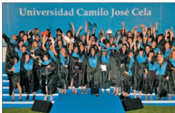
Graduados del curso 2010-2011

La ceremonia, amenizada por el Coro universitario, estará pre-