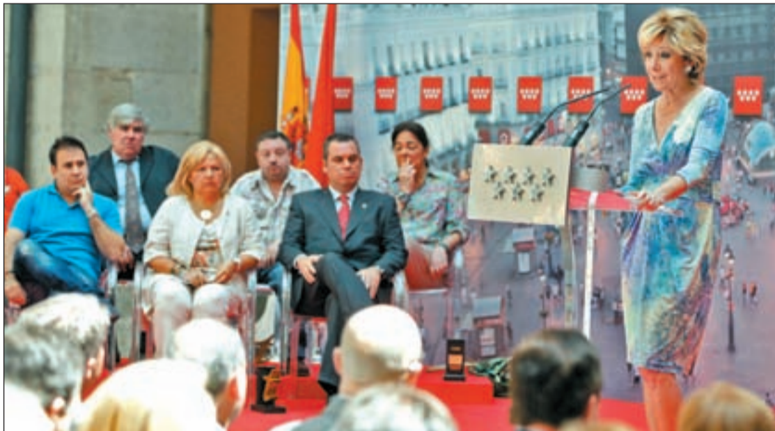
Esperanza Aguirre durante su discurso en la entrega de premios

En palabras de la presidenta de la AVT, Ángeles Pedraza, éste ha sido un año "duro" para ella, tanto a nivel personal como a nivel colectivo debido las víctimas han tenido que presenciar como "los amigos del terrorismo han burlado el Estado del Derecho y