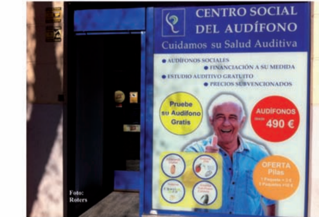
Fachada de uno de los Centros Sociales del Audífono en el momento de una de las emisiones en Madrid Directo (Telemadrid ).

“ Pues sí, la realidad es que no dejamos de pensar en los pensionistas y sus dificultades para llegar a fin de mes,