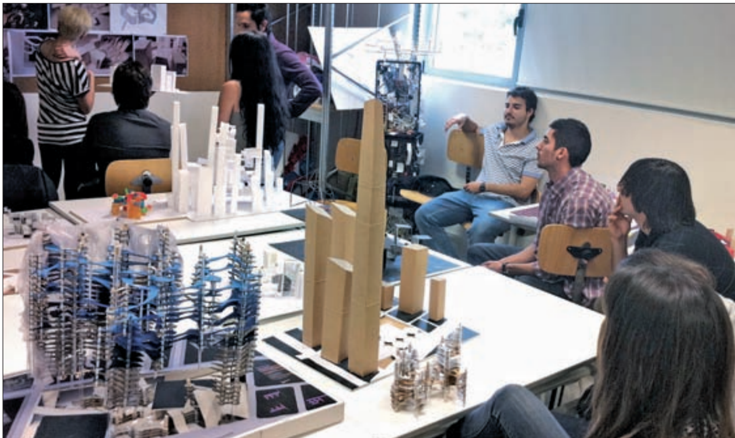
Un grupo de alumnos participa en una clase de la ESAYT