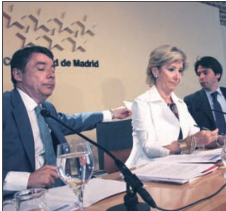
La presidenta de la Comunidad durante la rueda de prensa RAFA HERRERO

En los peajes, también se han confirmado las sospechas. El Gobierno regional va a estudiar su implantación en todas las carreteras autonómicas. La presi-