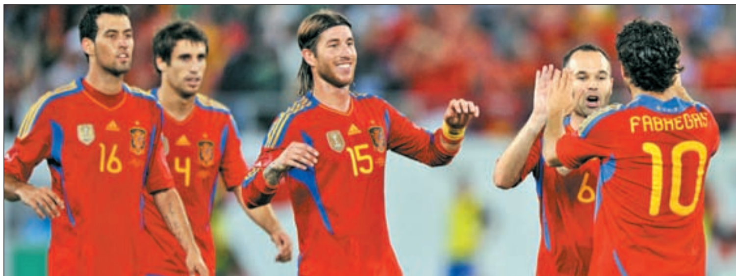
La selección sueña con alargar un ciclo exitoso que ya se ha traducido en la consecución de los dos torneos más importantes

Alemania encabeza el palmarés de esta competición con tres títulos. España aspira a igualar ese récord.