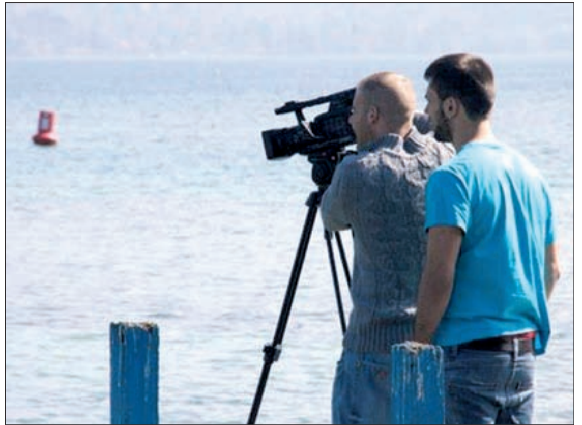
Una clase del Curso Intensivo de Documentales de la Universidad Camilo José Cela

Partiendo de la experiencia práctica de un emprendedor, la iniciativa, que incluye un taller de creación de empresa y elaboración de un plan de negocio, incide también en aspectos como la automotivación, el Coaching, la inteligencia emocional, la gestión del miedo y del estrés, las