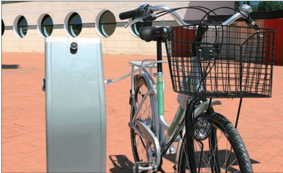
Una de las nuevas bicicletas del servicio de préstamo