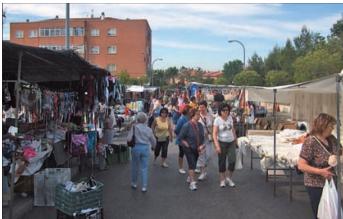
El mercadillo este jueves en Colmenar

Esta decisión del traslado del mercadillo se adoptó en el pleno de la semana pasada, en el que el PP presentó esta propuesta de cambio de día y de unión de ambos mercadillos, algo, que fue