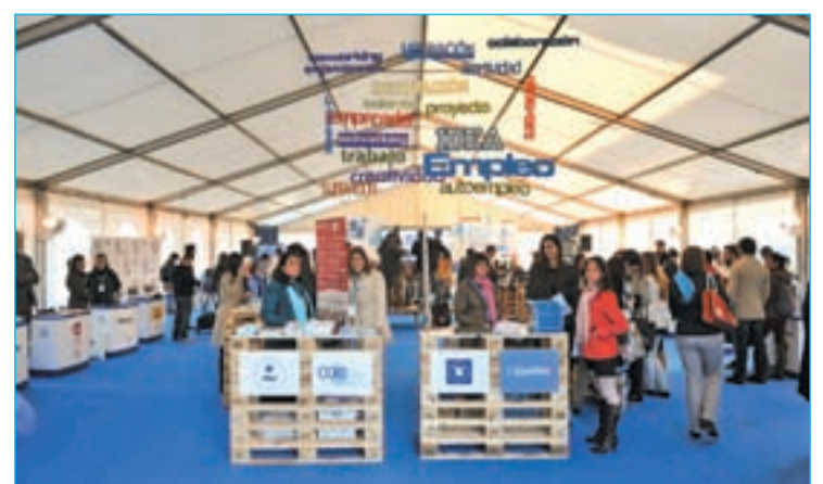
Jornada de emprendedores celebrada en la Universidad

Sus apuestas por la excelencia educativa, la innovación o el deporte como seña de identidad han marcado la historia de esta joven universidad, que cuenta con unas magníficas instalaciones donde los alumnos pueden llevar a la práctica los conocimientos teóricos previamente adquiridos en las aulas. Laboratorios, estudios de radio y televisión o pistas deportivas son algunas de las instalaciones de las que dispone el campus de Villafranca del Castillo, enclavado en un entorno natural maravilloso y dotado con servicios de residencia y de un club deportivo para realizar actividades al aire libre.