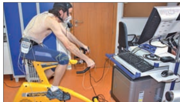
Laboratorio de entrenamiento y fisiología del ejercicio

tulo de Entrenador Nacional de Fútbol con la RFEF (Nivel III) y el Título de Profesor Nacional de Tenis con la RFET (Nivel III). Para reforzar este conocimiento, lidera diversos estudios científicos, cuenta con un laboratorio de entrenamiento y fisiología del ejercicio y oferta un Máster en programas deportivos.