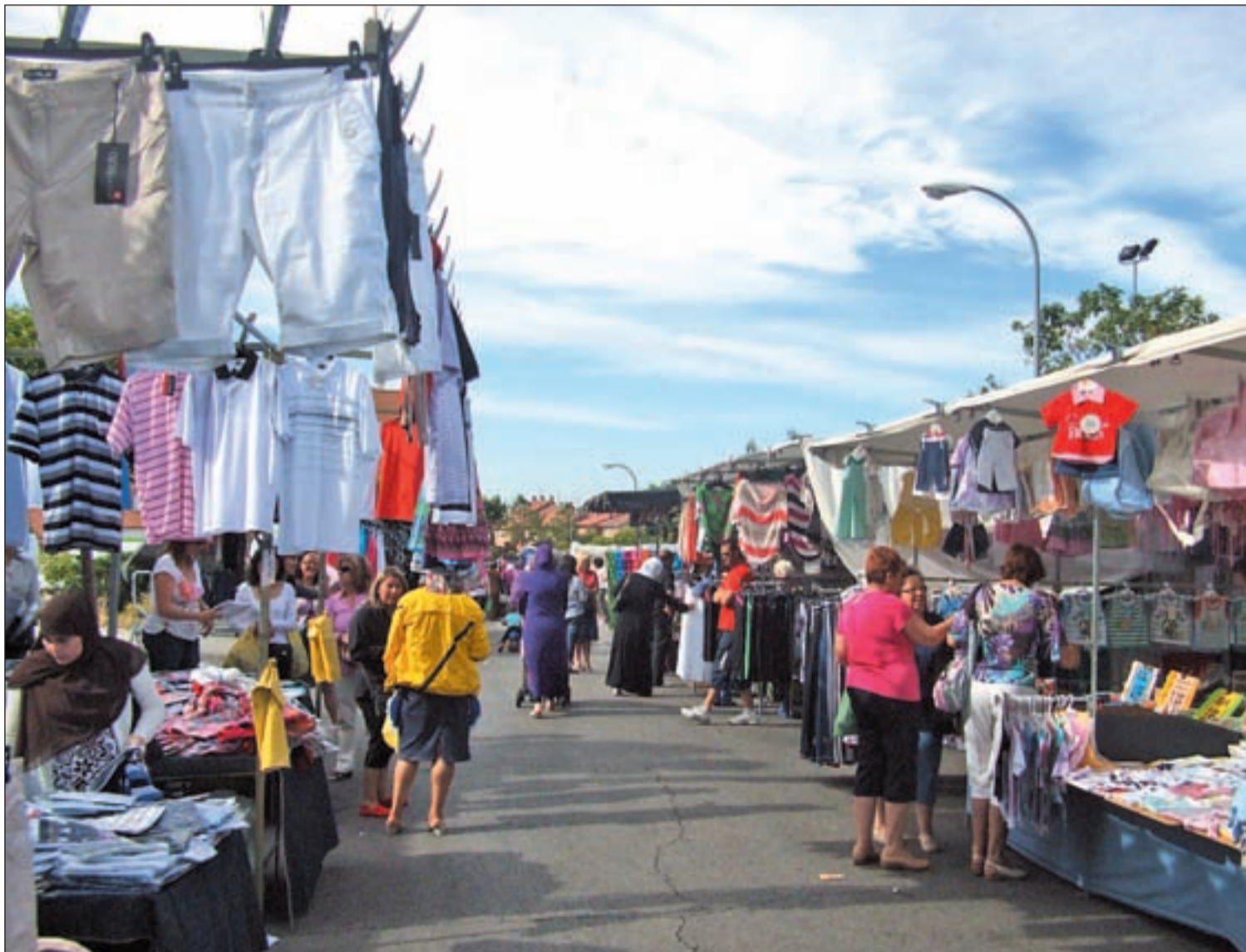
El mercadillo de la ropa que hasta ahora se celebra los jueves