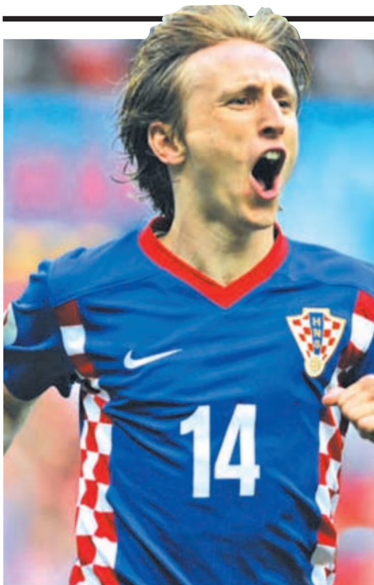
El centrocampista Luka Modric es la gran estrella de Croacia