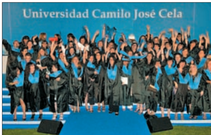
Graduados del curso 2010-2011

La ceremonia, amenizada por el Coro universitario, estará pre-