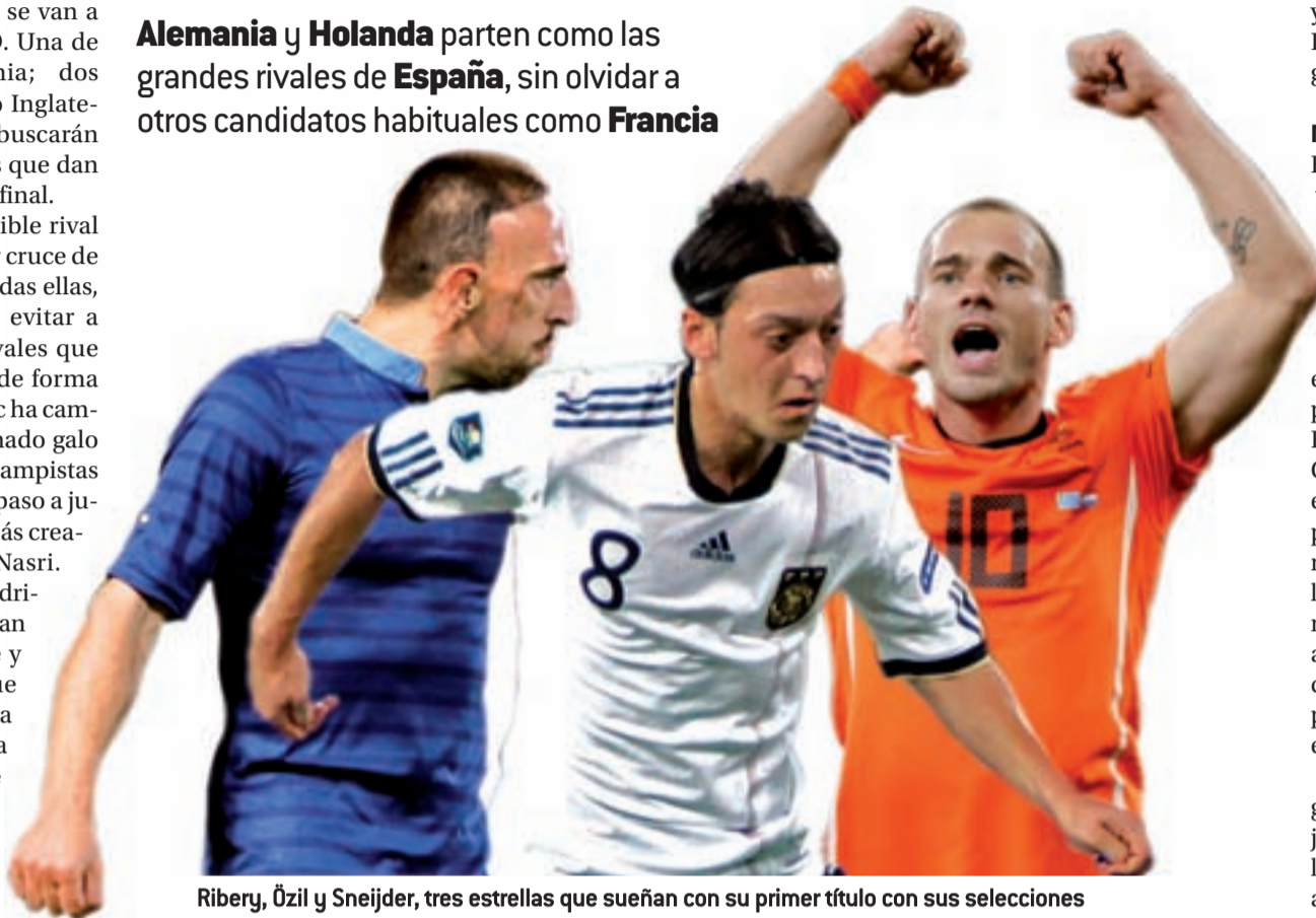
Ribery, Özil y Sneijder, tres estrellas que sueñan con su primer título con sus selecciones

Alemania y Holanda parten como las grandes rivales de España , sin olvidar a otros candidatos habituales como Francia