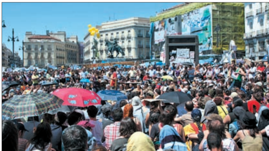
La Puerta del Sol en las manifestaciones del 15-M