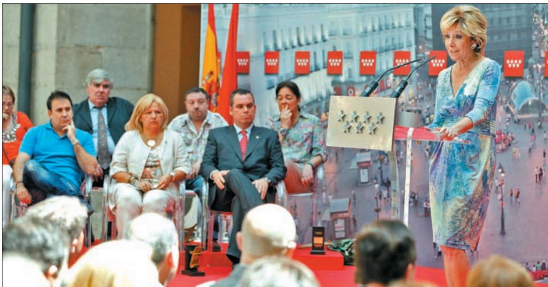
Esperanza Aguirre pronunció el discurso final de la versión 2011 de los Premios a la Tolerancia que la Comunidad de Madrid entrega desde el año 2001