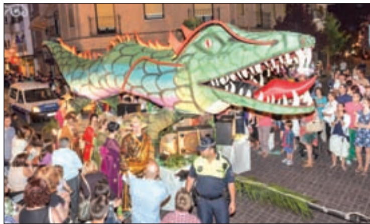
Carroza ganadora del concurso