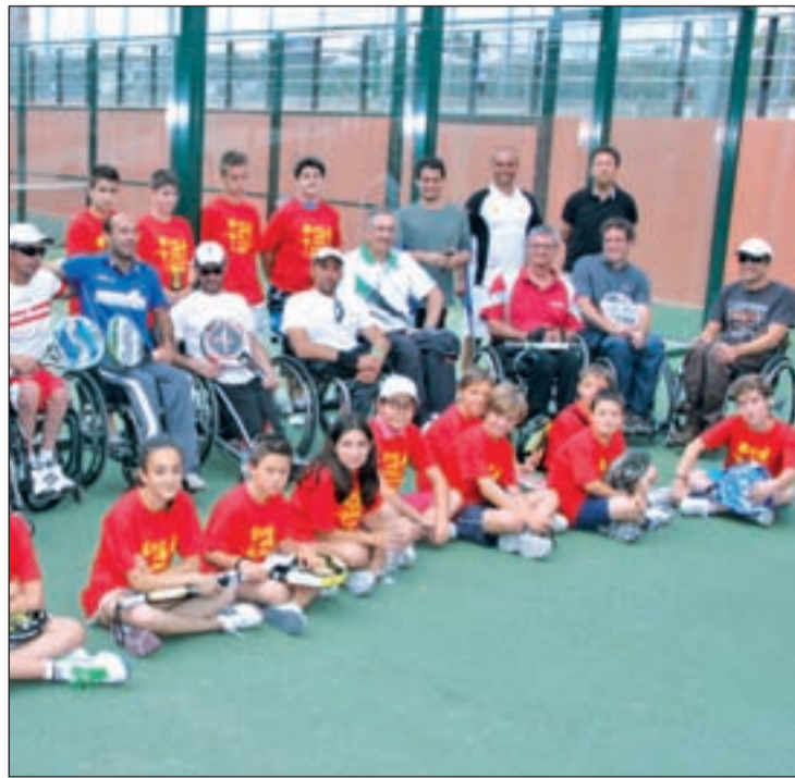
Participantes del Torneo

Por otro lado, más de 300 participantes se dieron cita esta semana en la XXX Olimpiada de la Asociación de Padres y Amigos de Niños Diferentes (APANID). En el evento, que se celebró también en el Juan de la Cierva, las pruebas, adaptadas a personas con discapacidad intelectual, incluyeron disciplinas como el lanzamiento de jabalina, carre-