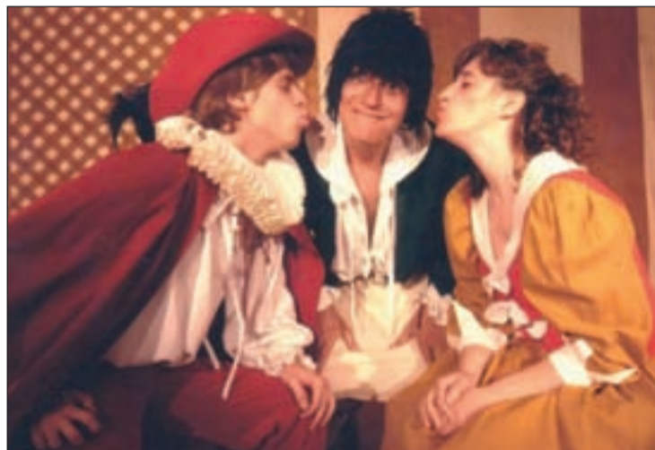
Escena de 'Cómicos de la legua'