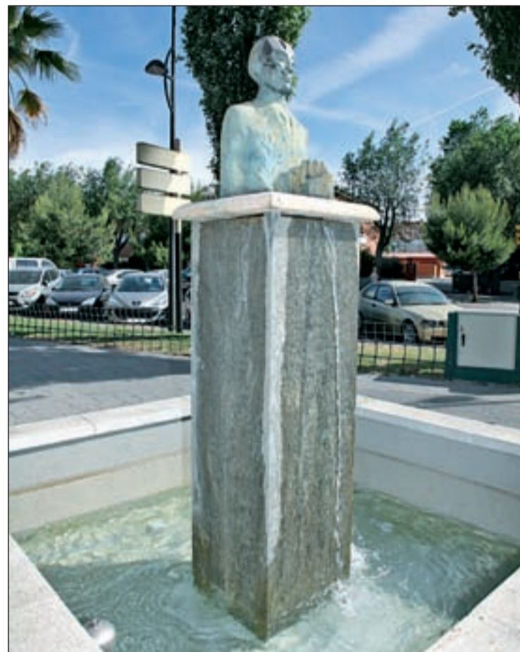
Una de las plazas recientemente rehabilitadas

Por otro lado, el Ayuntamiento de Getafe aprobó esta semana la realización de los estudios para que la Comunidad de Madrid declare como áreas de rehabilitación integral a cuatro barrios de la localidad: La Alhóndiga, El Bercial, San Isidro y Juan de la Cierva. Así, la Junta de Gobierno local ha adjudicado a la firma José Pérez-Mateos Peña la elaboración del informe pertinente por 35.400 euros, lo que conlleva la toma de 2.000 muestras de