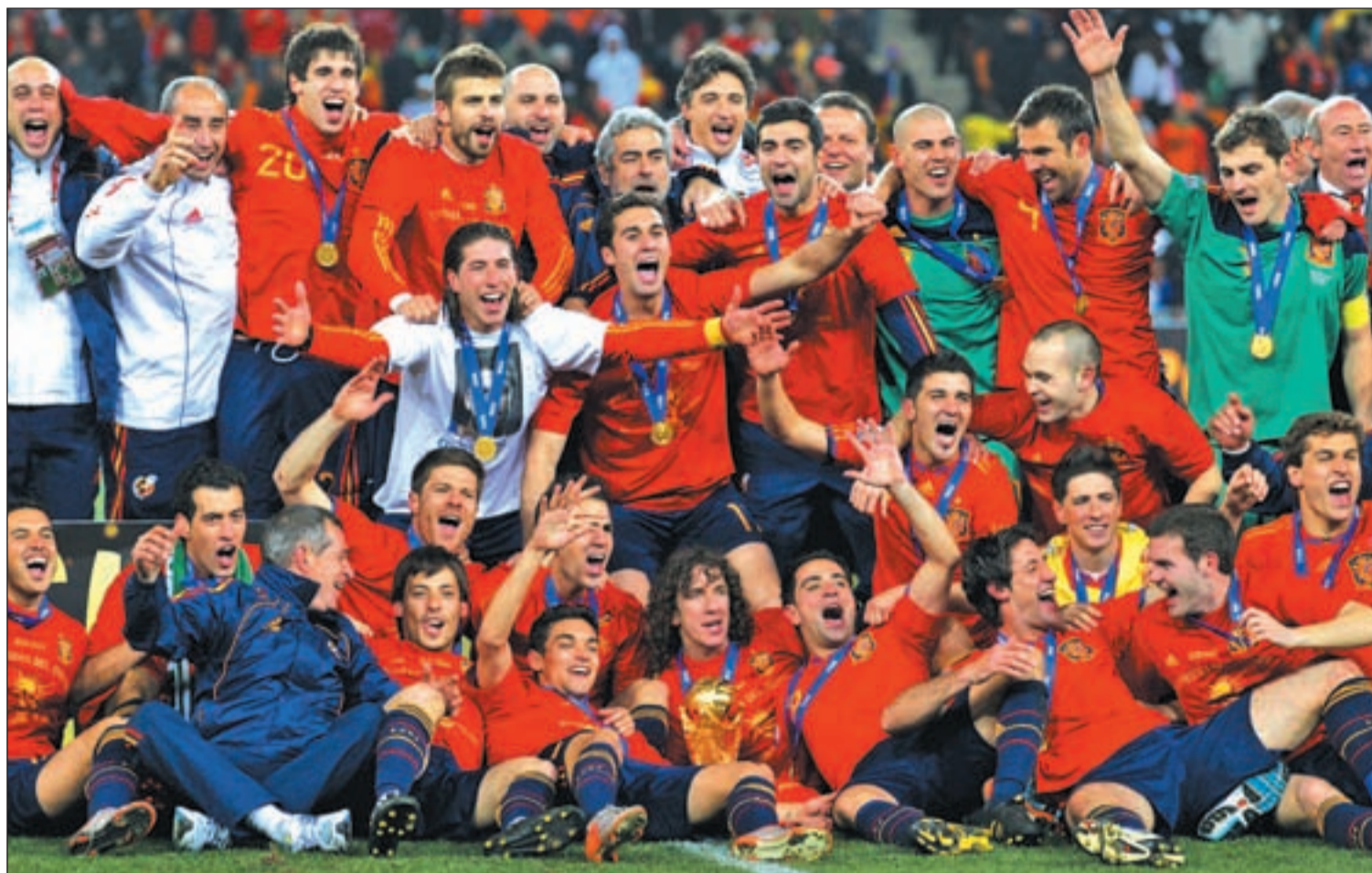
La selección sueña con alargar un ciclo exitoso que ya se ha traducido en la consecución de los dos torneos más importantes

Alemania encabeza el palmarés de esta competición con tres títulos. España aspira a igualar ese récord.