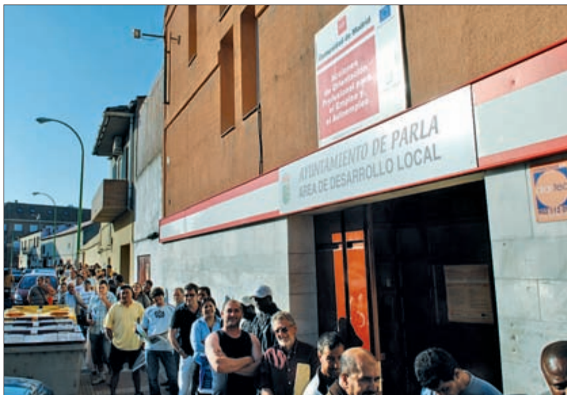
Getafe registró el mes pasado 1.334 parados más que en el mismo periodo de 2011

Por sectores, el más dañado sigue siendo Servicios, al que se han añadido 85 nuevos vecinos sin trabajo con respecto a abril (10.451), seguido de la Cons-