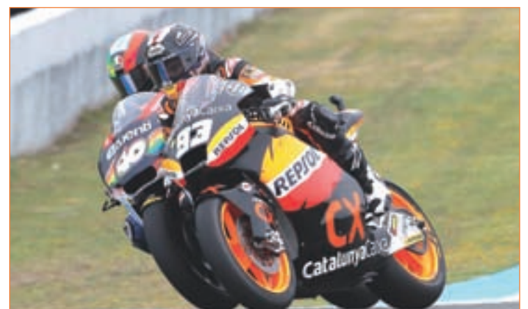
El piloto de Pons 40 acabó cayéndose en el GP de Cataluña

Tras estarse recuperando de unos problemas en el tobillo, Espargaró intentará sumar algún punto que le mantenga en la zona alta. El morbo está servido.