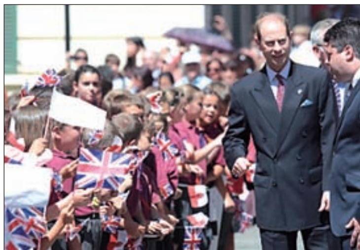
Los ciudadanos de Gibraltar reciben al Príncipe Eduardo

En un comunicado, el Gobierno gibraltareño aseguró que los condes recibieron una “calurosa” bienvenida por parte de todos los sectores de la comunidad gibraltareña. “El pueblo de Gibraltar les ha hecho estar orgullosos”, afirmó el ministro principal, Fabian Picardo, que