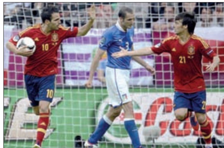
Cesc Fàbregas anotó el primer tanto de España en el torneo

En caso de lograr la ansiada clasificación, la selección aguardará con impaciencia a los resultados del martes dentro del grupo D, del que saldría su rival en cuartos de final. En caso de terminar como primera, España jugaría el sábado 23. Si acaba segunda, lo haría un día después.