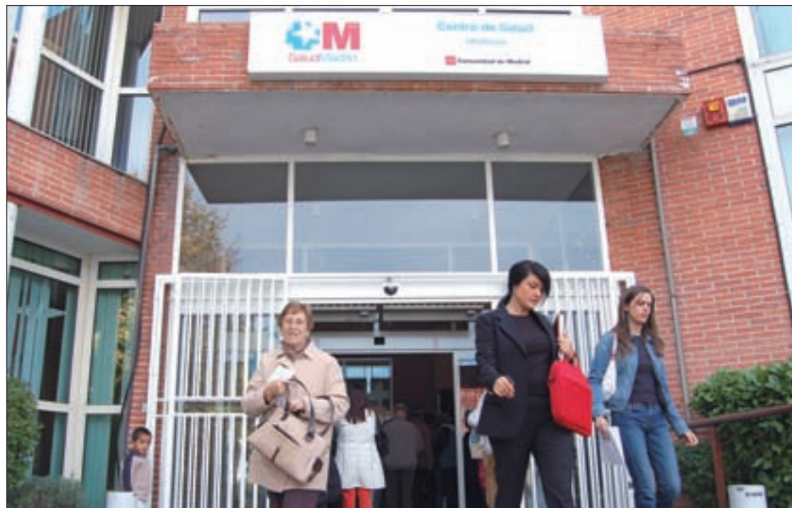
La Atención Primaria y la educación no entran en la cartera de competencias municipales

En el texto se propone una lista de competencias de los municipios (artículo 25) de la que desaparecen la participación en la gestión de la atención primaria sanitaria y la cooperación en la