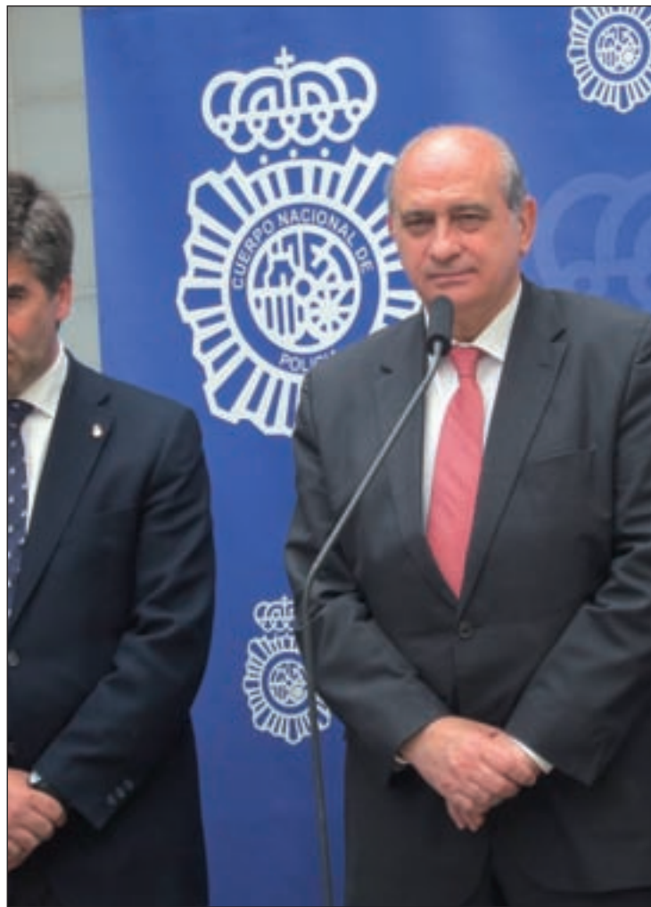
El ministro de Interior, Jorge Fernández, visitó el CIE de Aluche

tela de juicio por el Defensor del Pueblo y las ONG especializadas, Fernández aseguró que se "externalizará" el servicio y se ampliará la cobertura, hasta un horario de 08.00 a 22.00 horas los laborables y "un horario más intenso los fines de semana". Asimismo, afirmó que jueces, fiscales y abogados "van a estar más presentes" en los centros, ya que el reglamento dará "mejor ga-