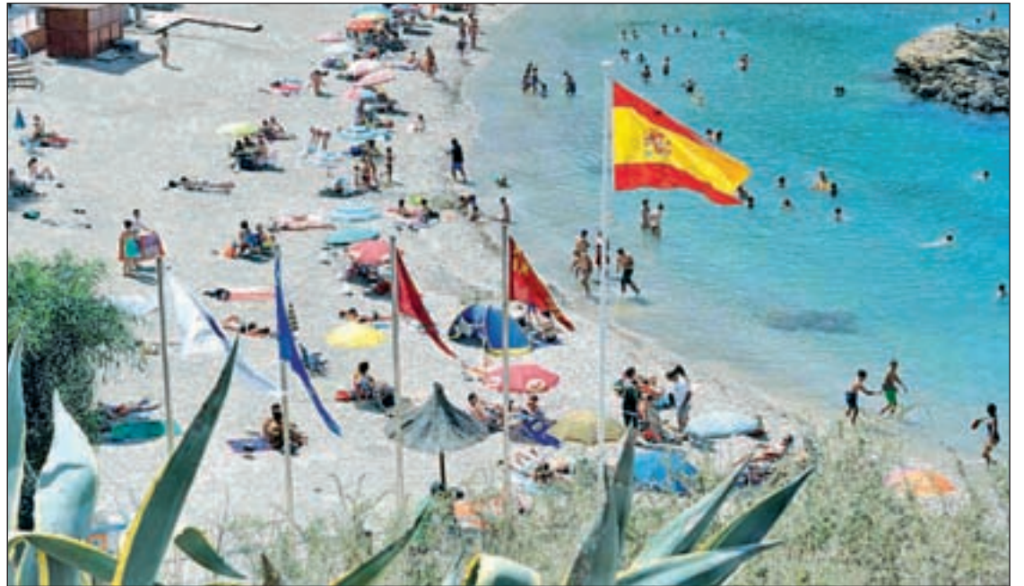
Cala Cortina, una playa de la costa de Cartagena, en la Región de Murcia

Destinos exóticos, grandes ciudades, lugares con historia o belleza salvaje. El destino, cual-