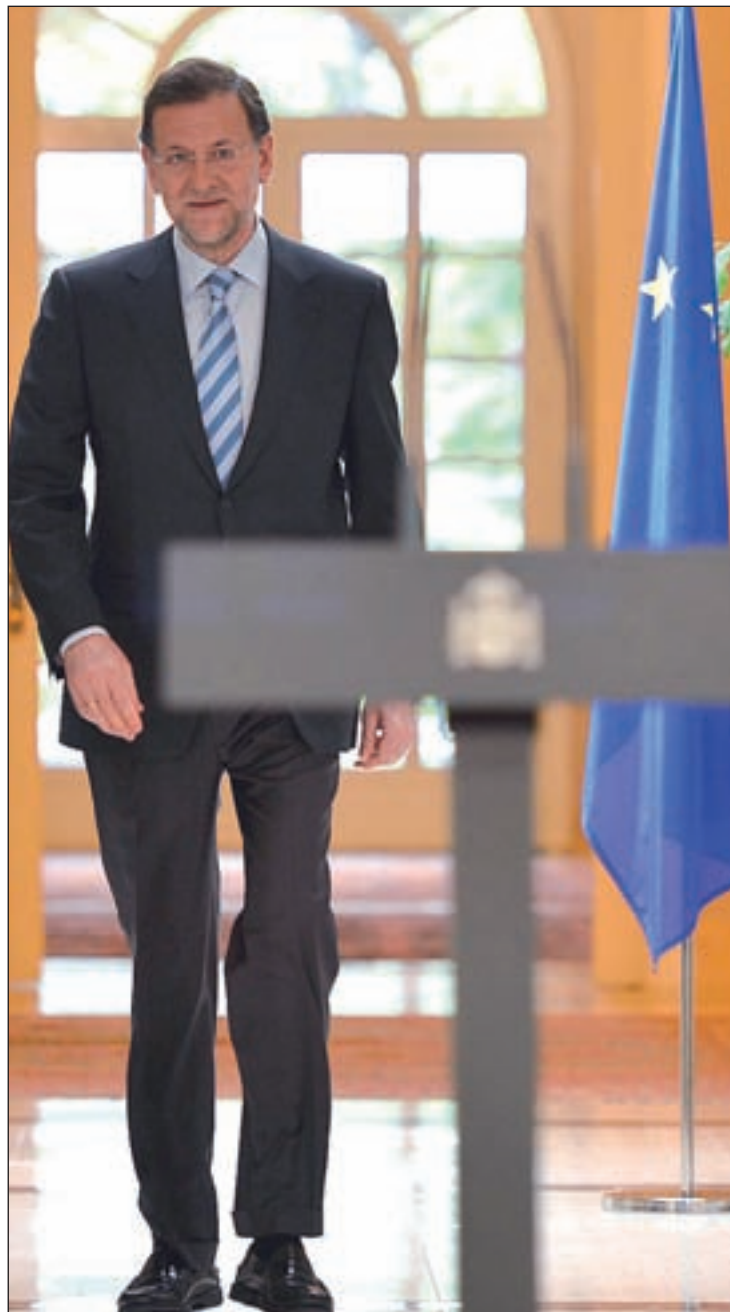
Mariano Rajoy comparece para explicar el rescate a la banca

Olli Rehn, comisario de Asuntos Económicos y Monetarios, lo dejó claro. "(La ayuda) incluirá condiciones políticas en el campo del sistema financiero y del