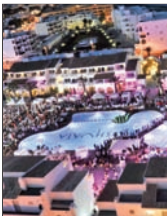
El Ushuaia Ibiza Hotel

Es un proceso rápido y completamente seguro en el que el usuario vincula sus huellas dactilares a sus datos personales y a una o varias tarjetas de crédito. A partir de ese momento, podrá