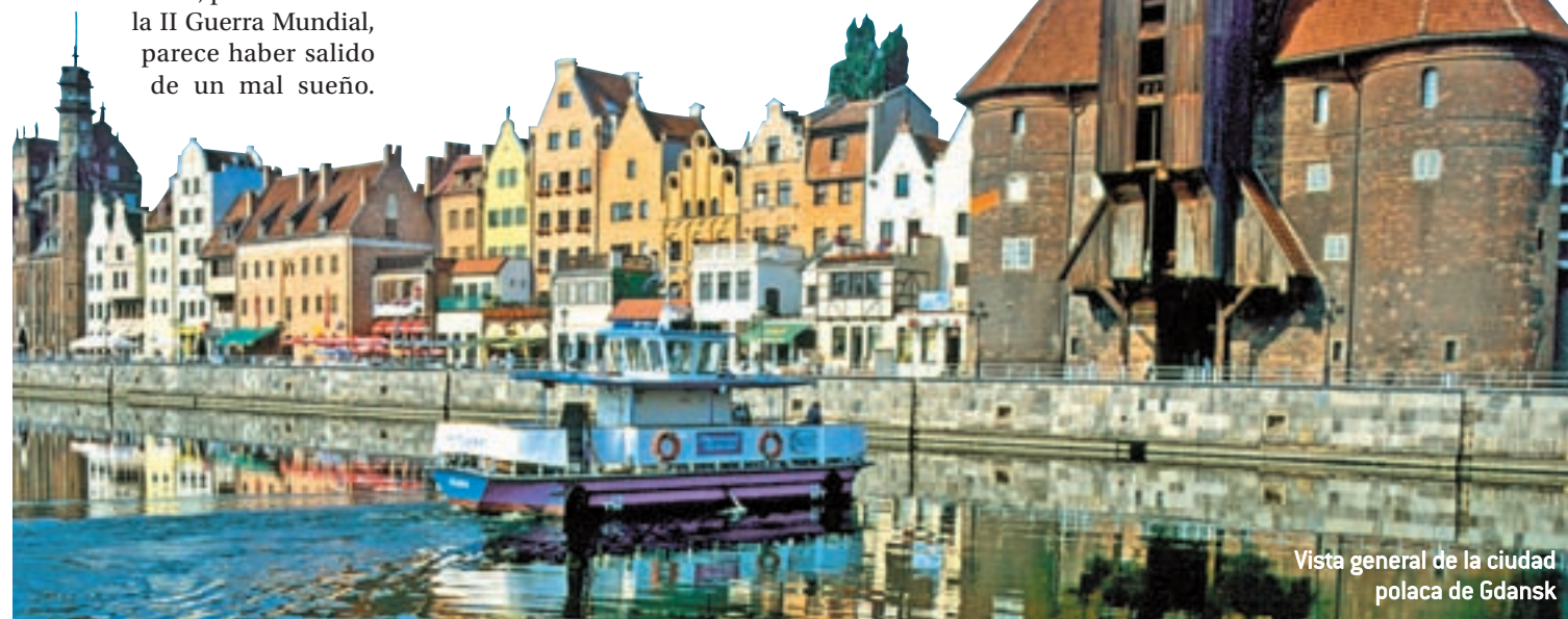
Vista general de la ciudad polaca de Gdansk

de la Eurocopa 2012 cuenta con la Ciudad Vieja, con su catedral del siglo XI y antiguas iglesias. Los aficionados quizá puedan celebrar la histórica victoria de la selección nacional paseando por su paseo marítimo o por la calle más hermosa de la capital ucraniana: Andriyivsky.