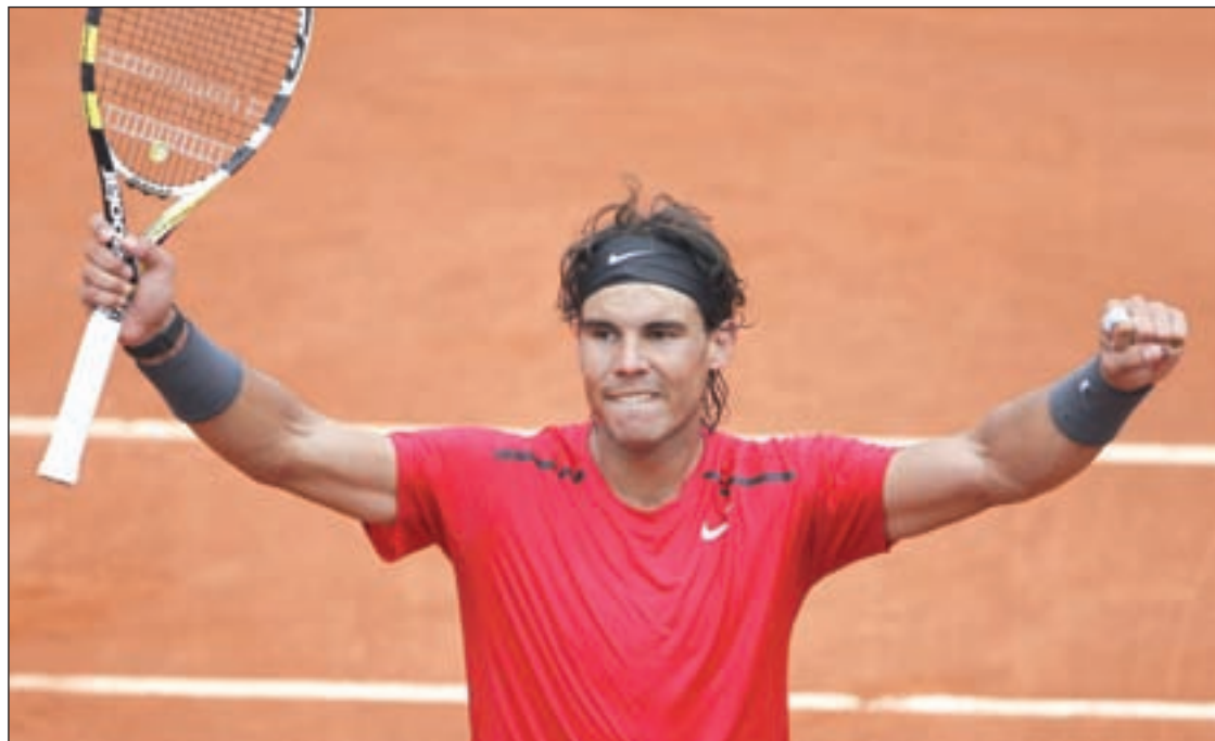
El tenista balear sumó su séptimo título en Roland Garros

TENIS WIMBLEDON COMIENZA EL PRÓXIMO 25 DE JUNIO