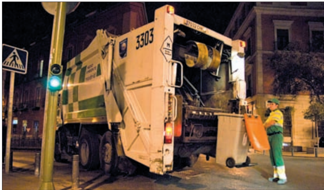
Un camión recoge la basura una noche en Madrid

El caso de Madrid es diferente ya que en la capital sí hay tasa de