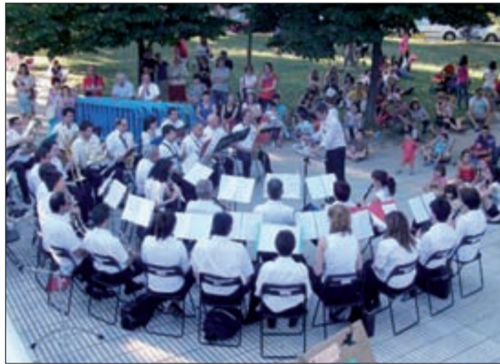
Actuación musical en Madrid Sur

Todos los que se acerquen a Madrid Sur durante este fin de semana podrán disfrutar de la I Feria de la Tapa que se desarrollará en todos los bares del barrio. También habrá espacio para la práctica deportiva por medio del torneo triangular de fútbol. Ade-