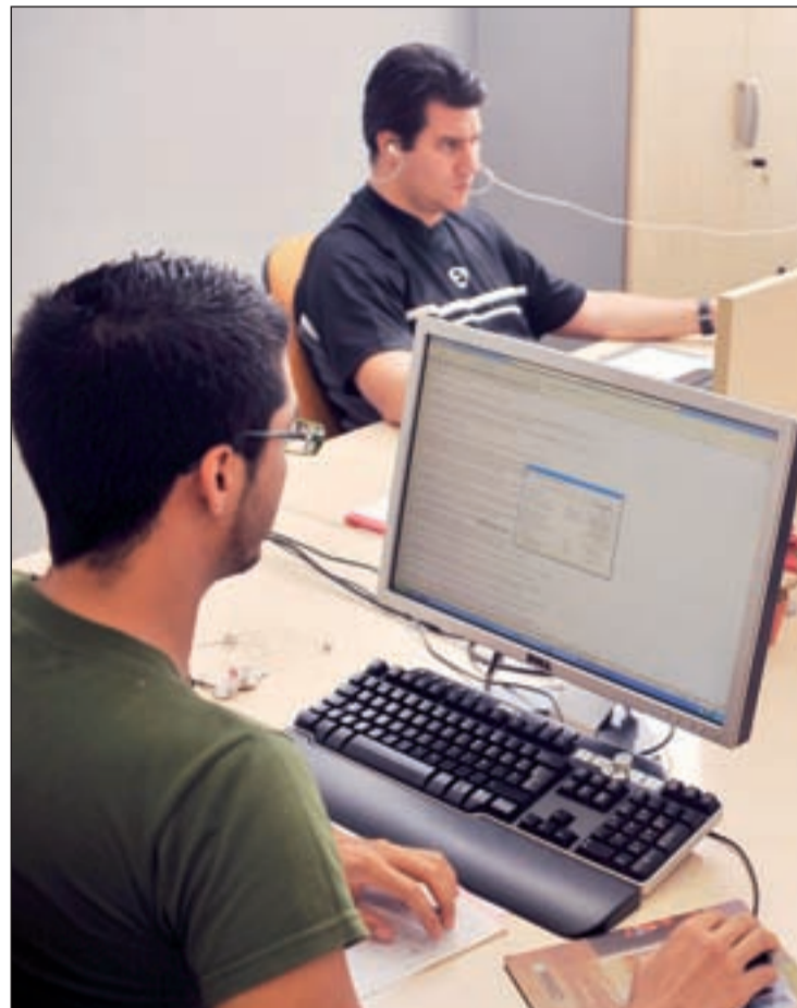
Vivero de Empresas Carlos III, en la Comunidad de Madrid

Bajo el lema "Alfombra roja a los emprendedores por parte de las Administraciones Públicas", la vicepresidenta anunció otras medidas como facilitar el acceso