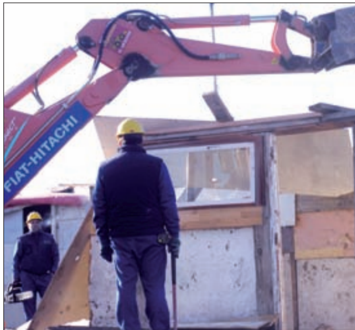
Uno de los derribos efectuados en el asentamiento OLMO GONZÁLEZ

El edil comentó que quedó claro que el Ayuntamiento entiende "por intervención social el derribo y el desalojo" y consideró que en estas actuaciones existe "intencionalidad urbanística". En ese sentido, aseguró que el plan de intervención es una