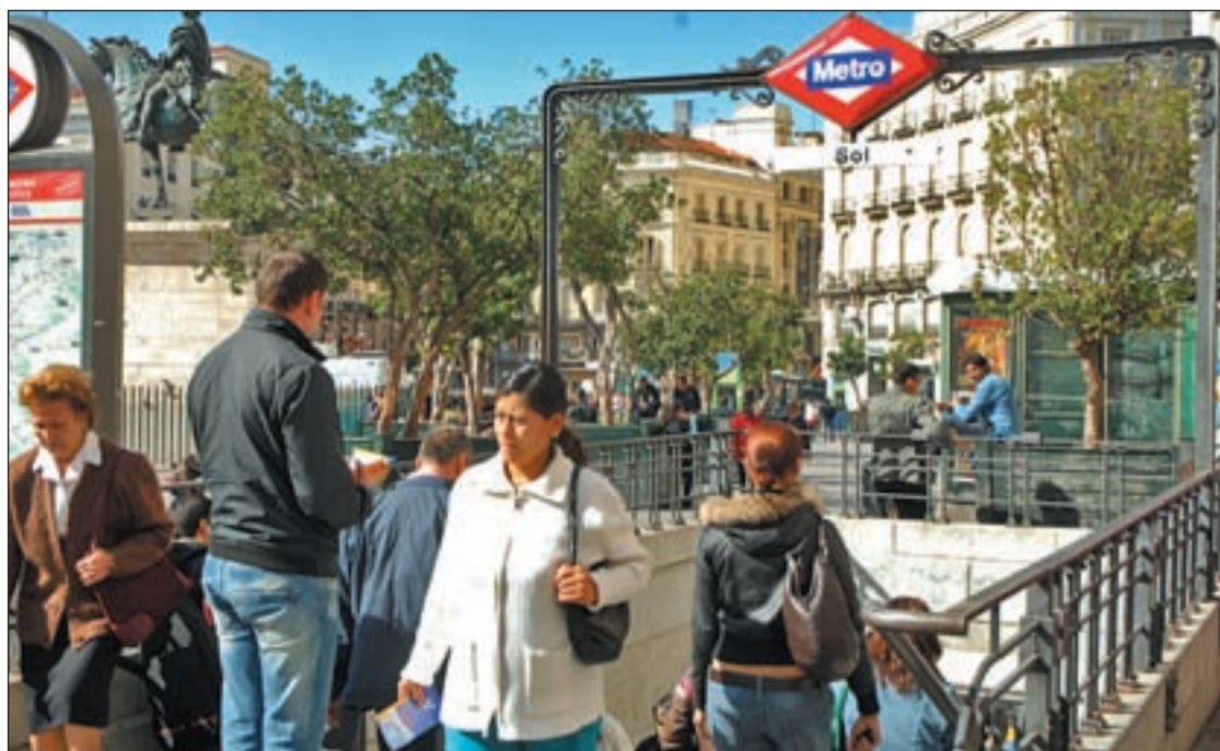
El metro adelantará su cierre de domingo a jueves a las 12 de la noche

En el auto, la Sala de lo Civil y Penal del TSJM, acuerda estimar el recurso de apelación interpuesto por la representación procesal de Reneses contra el auto dictado el 11 de enero de 2011 que imputó al diputado regional. Reneses, pedirá a su grupo (IU) que le restituya en sus "responsabilidades" en el Grupo Parlamentario.