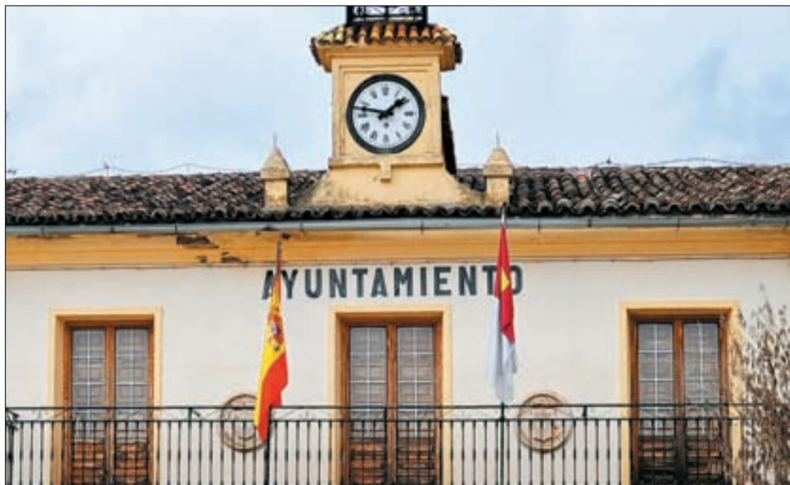
La fachada de un ayuntamiento, los salarios de los alcaldes están en boca de todos

En la Comunidad de Madrid, supera al presidente la alcaldesa de la capital, Ana Botella, que