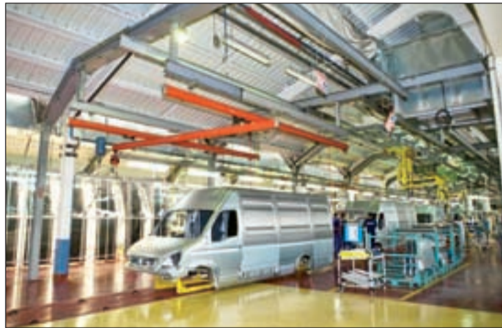
Una de las cadenas de montaje de la compañía en Madrid