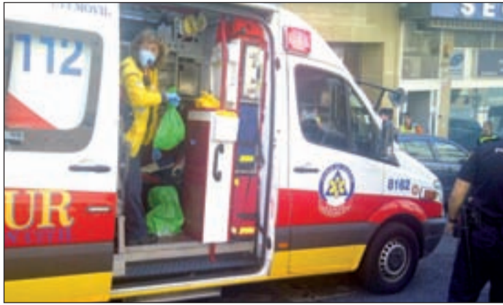
El Sasmur atendió a otras tres personas en el lugar de los hechos