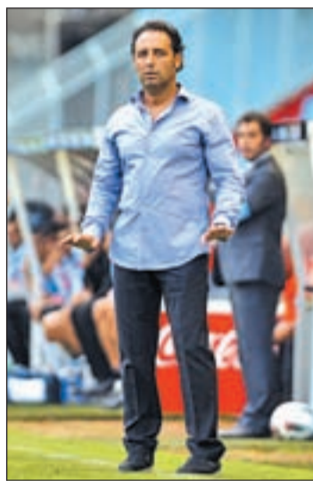
El Alcor ya tiene nuevo 'mister'

Tras pasar tres temporadas en el conjunto ilicitano, fue destituido la pasada campaña, a pesar de haber llevado a este equipo a disputar en la 2010-2011 la final del 'play-off' de ascenso a Primera División, una eliminatoria en la que el Granada acabó cortando de raíz las esperanzas blanquiverdes. Con anterioridad, Bordalás también dirigió a varios equipos de la Comunidad