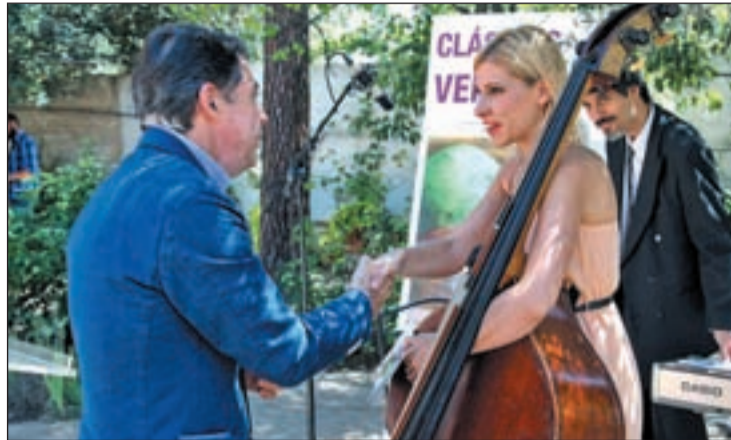
Ignacio González, vicepresidente de la Comunidad, en la presentación

Entre ellos destacan las formaciones de El Trío Arbós, la Orquesta de Pulso y Púa de la Complutense, el Cuarteto Ercolani, Tango XXI, el Chamber Ensemble Atenay o Spanish brass Luur Metals. Mención especial para la Orquesta Nacional de Jazz, que brindará una actuación especial en el Castillo de Buitrago de Lozoya. En el bando internacional, habrá representación