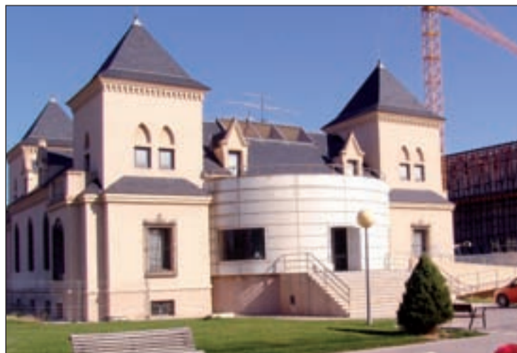
La actividad se desarrollará en el CC Los Castillos

En lo que se refiere a la cerámica, la meta del taller será familiarizar al niño con todo el proceso técnico de producción, desde la manipulación a la cocción, el secado, los materiales y las herramientas, para que consigan fabricar pequeños objetos de cerámica. En cuanto a la fusión de vidrio, la clase tratará de transmitir a los participantes el compor-