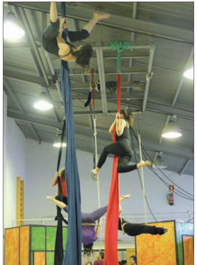
Alumnos practicando aéreos