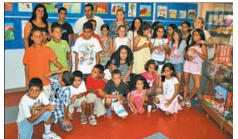
Recepción oficial de los niños