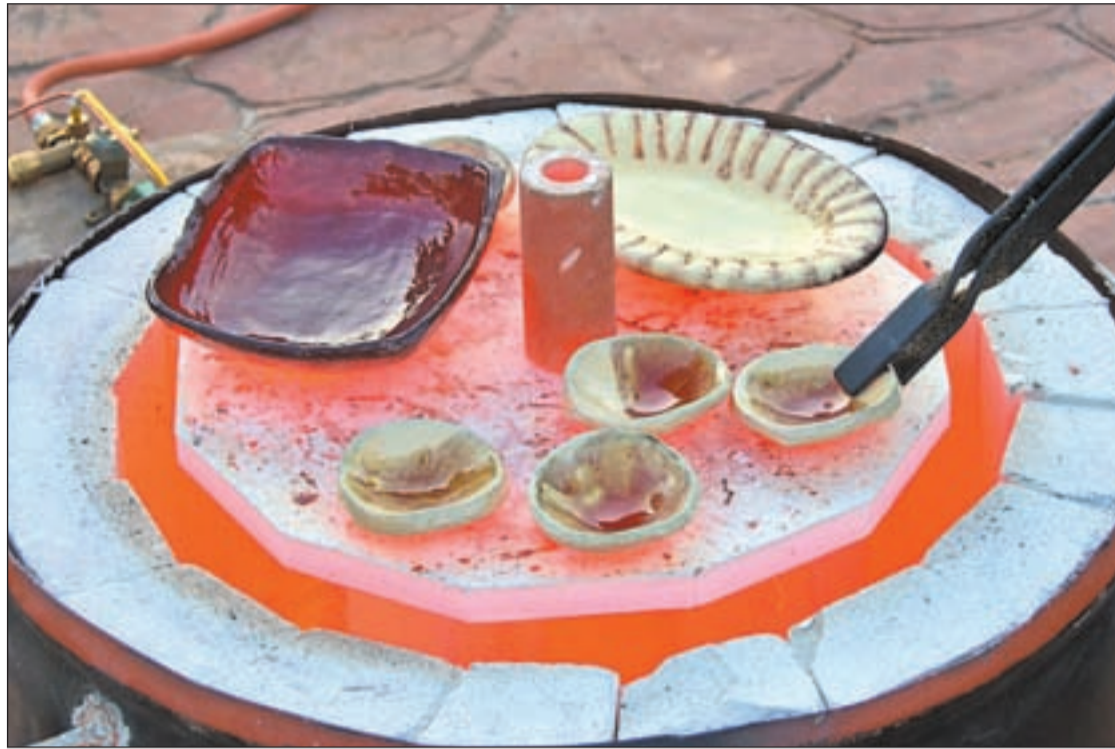
El rakú como técnica de diseño protagonizará las clases en la segunda quincena de julio

Durante la primera quincena de julio se desarrollará el taller 'Colores y signos. Serigrafía', en el que "trabajaremos sobre seda, sobre madera, entrando en procesos lentos", avanza Robles. Estas clases, en las que se darán a conocer técnicas de estampa-