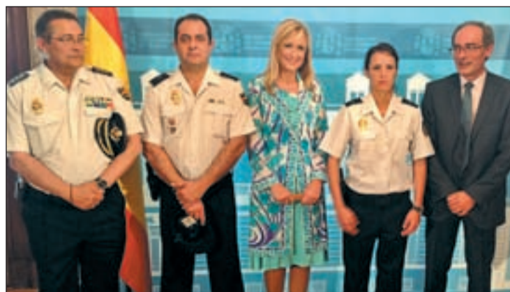
La delegada del Gobierno con los policías premiados

Además, ha señalado que este homenaje es extensivo a todo el Cuerpo Nacional de Policía por "la excelente labor" que está haciendo en su conjunto para incrementar la seguridad del sector de la joyería.