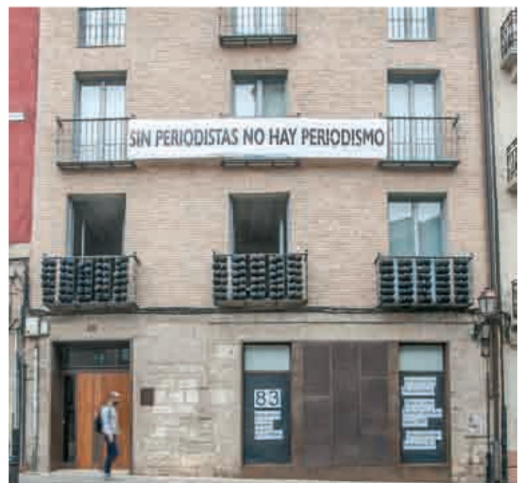
Globos negros en la fachada de la Asociación.

de 2008 y, según datos de FAPE (Federación de Asociaciones de Periodistas de España), se han perdido más de 6.000 puestos de trabajo en medios de comunicación en España, hemos vivido el cierre de decenas de medios y hemos sufrido multitud de ERES”, dicen desde la Asociación. “Lo peor es que estos datos empeoran cada día”, sentencian en el comunicado.