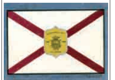
Portada del programa de 1921.