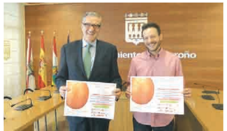
Presentación del Torneo en el Ayuntamiento.

7 DE JULIO EN LA PISTA MULTISPORT DE LAS NORIAS