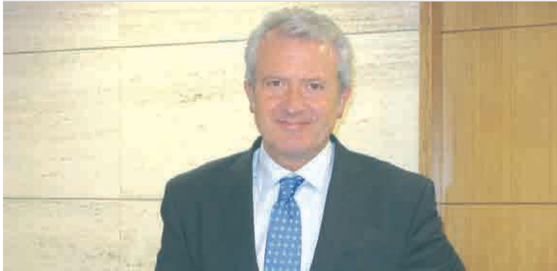
Emilio del Río, consejero de la Presidencia y portavoz, durante la rueda de prensa posterior al Consejo de Gobierno.

Entre otras medidas, el Ministerio de Educación, Cultura y Deporte fija en 20 el mínimo de períodos lectivos semanales, y en el caso de La Rioja se han acordado diferentes medidas en función de los niveles educativos, teniendo en cuenta que según el Real Decreto Ley 14/2012, a partir del 1 de septiembre todos los funcionarios públicos tendrán una jornada semanal de 37 horas y media.