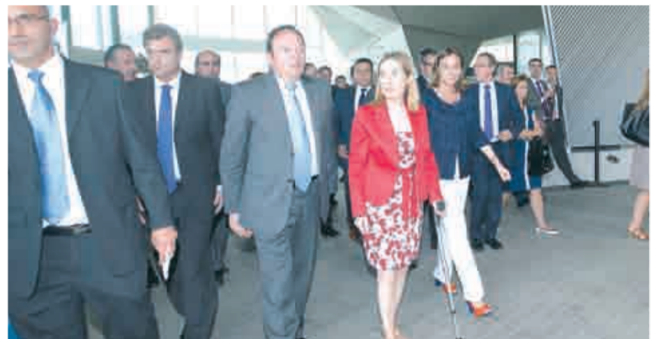
Ana Pastor visitó la nueva estación de ferrocarril de Logroño.