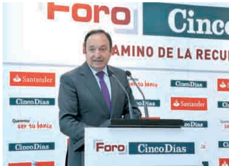
Pedro Sanz, presidente de La Rioja, en su intervención.

Para La Rioja “es menos complejo que para otras regiones estar a la altura de los retos que ha marcado el Gobierno de España”, indicó Sanz durante su intervención en el Foro de Política y Eco-