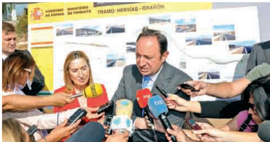
La ministra de Fomento visitó el tramo Hervías-Grañón de la A-12.

En materia de transporte aéreo, la ministra defendió el plan implantado en los pequeños aeropuertos, entre ellos el de Logroño-Agoncillo, para “adaptar las instalaciones a la demanda de los ciudadanos”. “Se abrirán cuando haya vuelo, y además tenemos la flexibilidad de que cuando alguien pida, con una antelación de cuatro horas, salida o aterrizaje se le ofrecerá”, concluyó Ana Pastor.