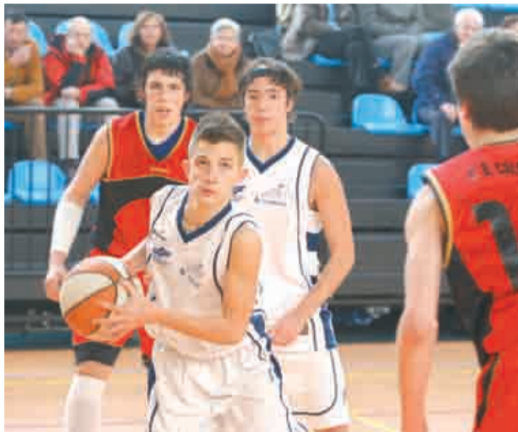
Participantes en los Juegos Deportivos Escolares.

Son las cifras más elevadas en la historia de los Juegos Deportivos Escolares en nuestra comunidad autónoma. El 60,7% de los alumnos escolarizados en La Rioja con