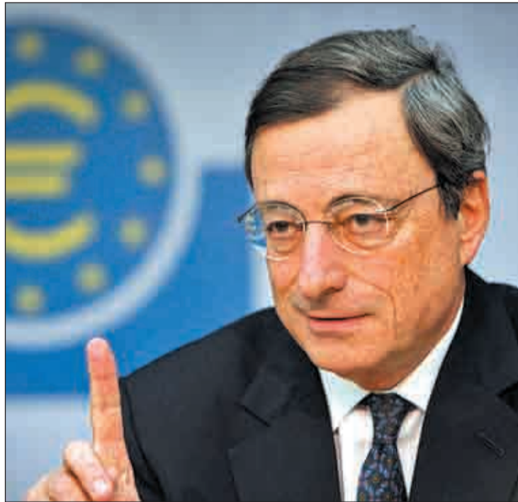
Mario Draghi, presidente del Banco Central Europeo

En esta misma línea, el BCE también ha decidido dejar de remunerar los depósitos a un