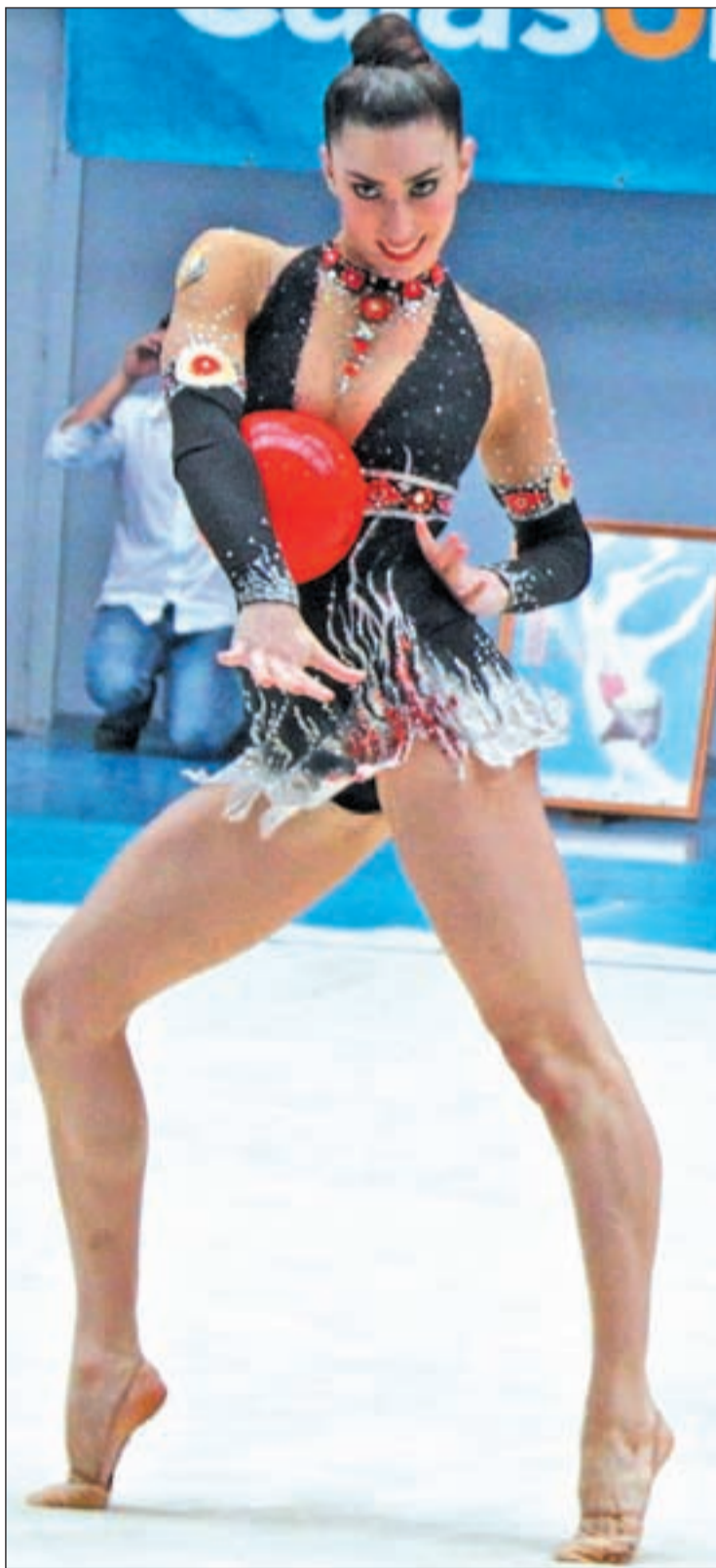
La pinteña llega con ilusión a la cita de Londres

«Soñamos con lograr una medalla, aunque está difícil»