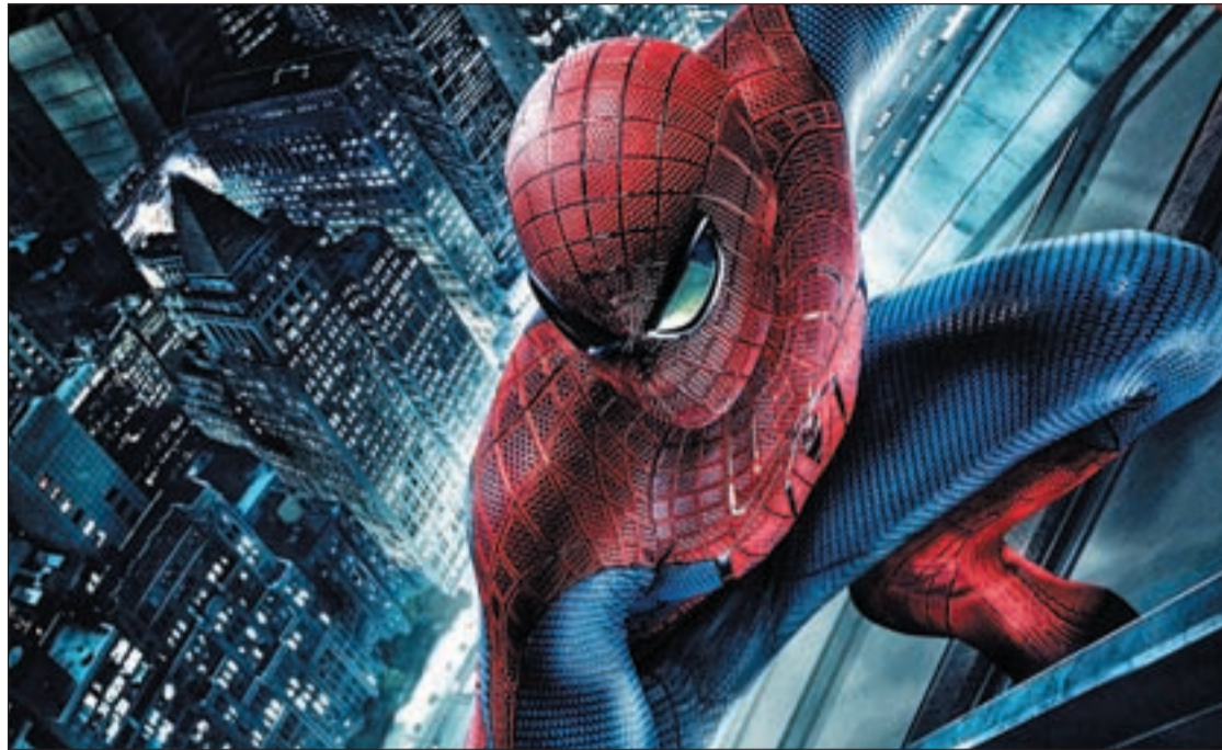
El hombre araña busca su identidad como adolescente y como superhéroe

Para Smith, el calificativo de "visionario" alude a la capacidad de este artista para trabajar "a partir de la imaginación".