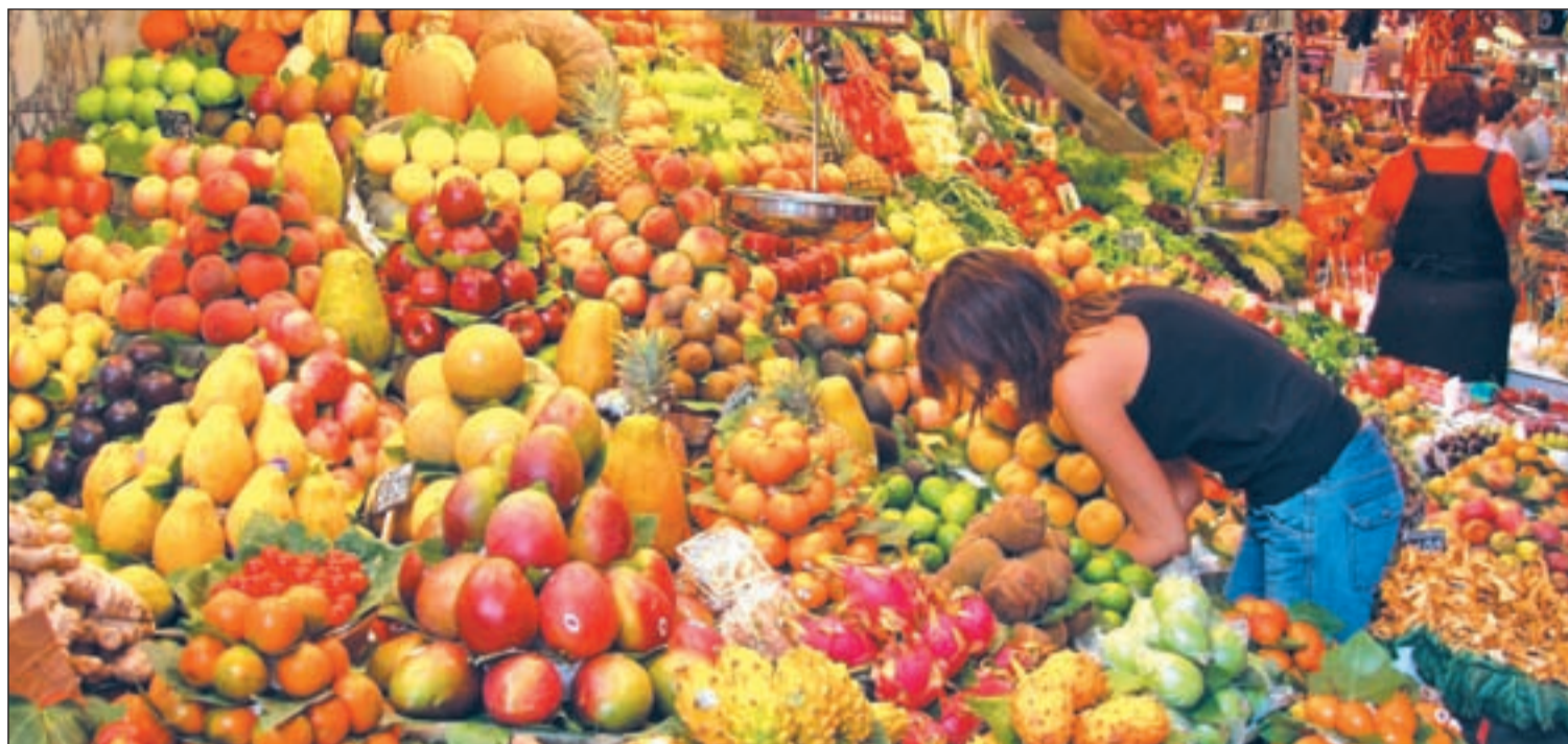
El resveratrol, obtenido de las pepitas de uva, es un gran antioxidante