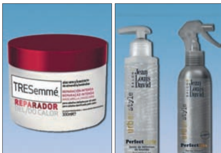
Productos de TRESemmé y Urban Style de Jean Louis David

No es el único producto. La gama Urban Style de Jean Louis David presenta tres novedades ideales para todo tipo de cabello, para mantenerlo con brillo y fijarlo de manera natural.