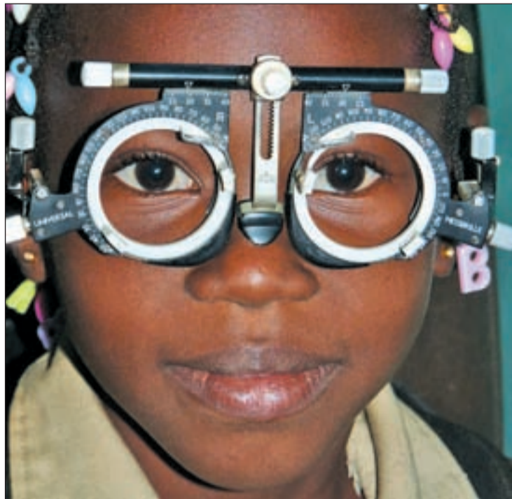
Revisión de una niña en Clínica Baviera