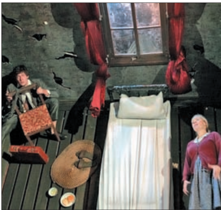
'Metamorphosis' es representa dins el Festival Grec. GENTE

Aquesta força física és necessària per mantenir Gregor Samsa penjat en un segon nivell, ja que l'escenari està dividit en dos espais, la sala d'estar vulgar i a peu pla de la família Samsa, que contrasta amb la visió zenital del dormitori de Gregor distorsionat. La música que acompanya la peça és original de Nick Cave i Warren Ellis, i la veu de baríton de Cave emfatitzen el dramatisme del text.