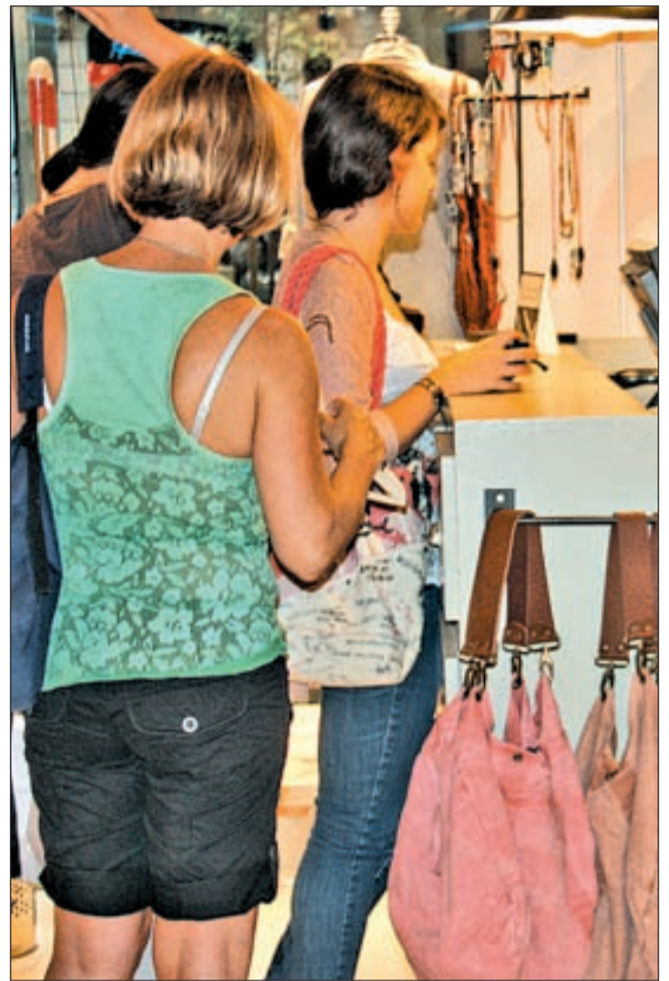
L'anunci del govern central ha encès el sector del comerç. GENTE

Per la seva part, el portaveu del Govern, Francesc Homs, ha advertit l'Estat que no podrà "imposar" el seu model comercial, ja que podria acabar provocant que la Generalitat portés la nova llei al TC per envair competències. I és que segons Homs, a Catalunya no es farà cap canvi sense comptar amb el suport i l'acord del sector del comerç. En aquest sentit, el portaveu ha assegurat que "qualsevol moviment de caràcter estructural, legislatiu o organitzatiu ha d'anar