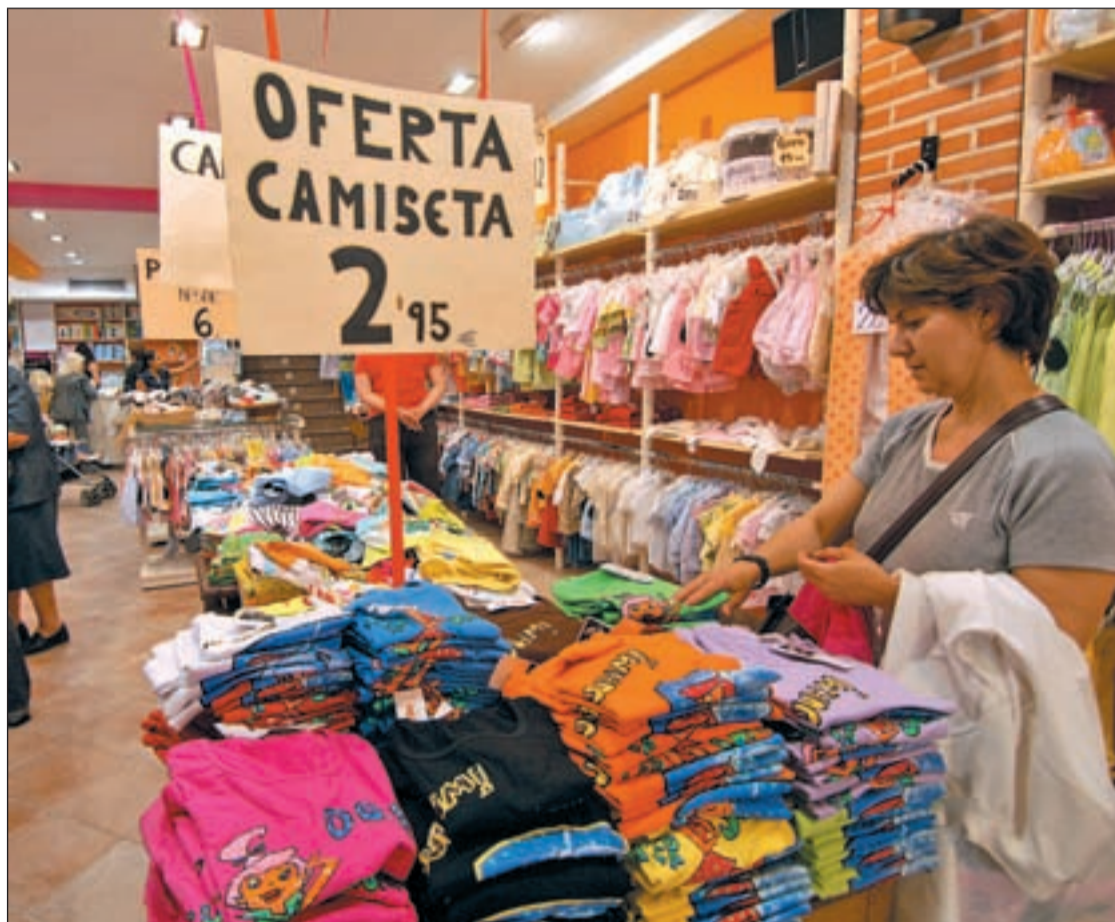
Este verano se llevan los toques étnicos y los flecos