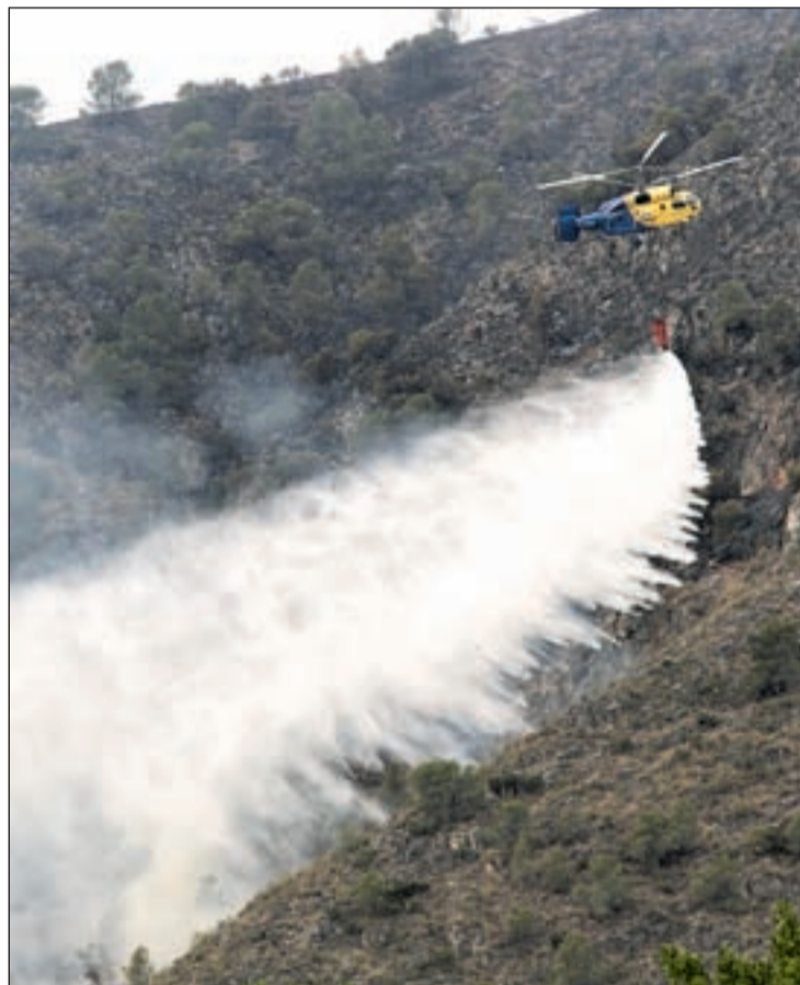
Un helicóptero trata de apagar el incendio

La sección sindical en las Brigadas de Emergencia del Sindicato Profesional de Policías Locales y Bomberos criticó que "la falta de recursos, la descoordi-