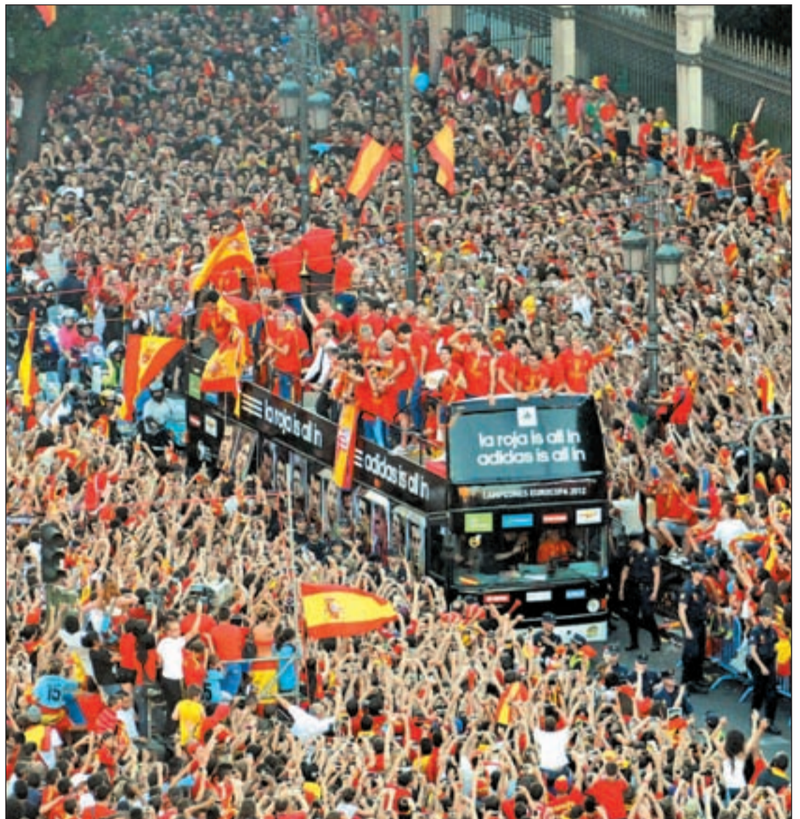
Los internacionales celebraron por todo lo alto su éxito

un jugador italiano, porque aquello fue una lluvia de buen juego y de goles. Si nos dicen que las cosas iban a salir así, no lo hubiéramos creído. Al día siguiente, tocó celebrar. Madrid se volcó con la selección, que se mostró agradecida con esta afición que tiene marca propia: España. Si los indicadores económicos se basaran en el buen juego o en la pasión de los españoles, este fin de semana hubiéramos salido definitivamente de la