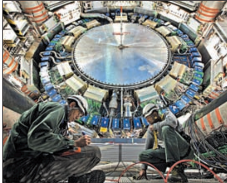
La investigación se desarrolló en el Gran Colisionador de Hadrones

El Modelo describe las partículas elementales y sus interacciones, pero queda una parte importante por confirmar, precisamente la que da respuesta al origen de la masa. Sin masa, el Universo sería un lugar muy diferente. Si el electrón no tuviera masa no habría átomos, con lo cual no existiría la materia como