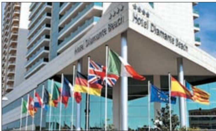
Hotel Diamante Beach, donde ya hubo otro brote a principios de año

Por su parte, el jefe de servicio de Protección Civil y Emergencias, Humberto Gutiérrez, aclaró que la situación actual se mantiene estable, y recomendó a la población que siga atenta a la información y a los consejos de autoprotección que se repartieron cuando comenzaron los movimientos sísmicos.