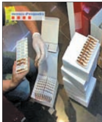
Els fàrmacs interceptats.

Elixir Clinic, situada al carrer Muntaner, 328, procedien del mercat negre. El dia que la policia va inspeccionar la clínica, el 2 de juliol, celebraven la jornada 'Botox Day', amb descomptes publicitats a través de xarxes socials com Facebook i Twitter. El centre ha estat clausurat.