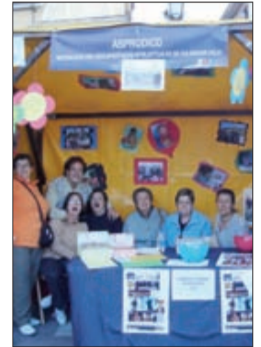
La asociación Asprodico

“Somos conscientes del extraordinario trabajo que realizan es-