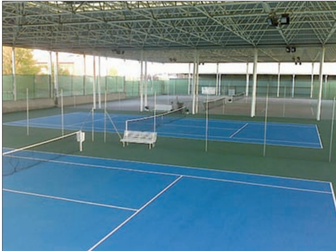
Las pistas de tenis y padel costarán más el próximo curso

Los precios para los mayores de edad también se han visto incrementados. Antes los mayores pagaban una cuota de alrededor de 25 euros al año por el uso de todas las instalaciones deportivas de Tres Cantos. Desde el próximo curso tendrán que abonar