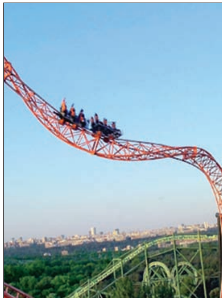
La atracción 'El Abismo' del Parque de Atracciones

El lugar de la diversión. El Parque de Atracciones de Madrid se caracteriza por ser el parque más antiguo de la capital y por ser el lugar en donde la emoción y la diversión se juntan y se disfrutan en cada metro cuadrado. Este año, además, está de estreno ya que una nueva montaña rusa familiar ha llegado al parque. Se llama 'La Mina TNT', que hace vibrar los corazones de grandes y pequeños en las subidas y bajadas que recorre a alta velocidad. También en el parque se puede disfrutar del 'Abismo'