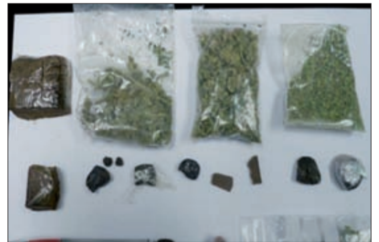
El alijo incautado en la operación conjunta