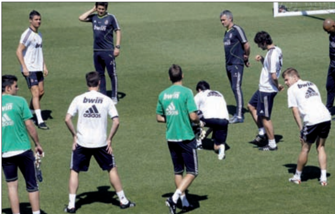
José Mourinho afronta su tercera temporada como entrenador del Real Madrid

A medio camino entre la puesta a punto y la promoción de la marca del club, el Real Madrid llevará a cabo el grueso de su pretemporada en Estados Uni-