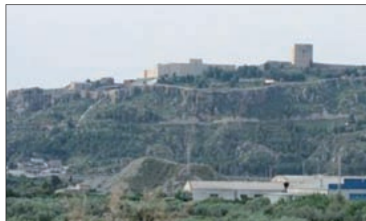
El Castillo de Lorca es la imagen de la localidad murciana

En el ámbito de la alimentación también se puede recortar. No solo visitando los restaurantes donde comen los locales sino comprando en un supermercado e improvisando un bocadillo ¿Hay algo más barato y parisino que comer a la orilla del Sena?