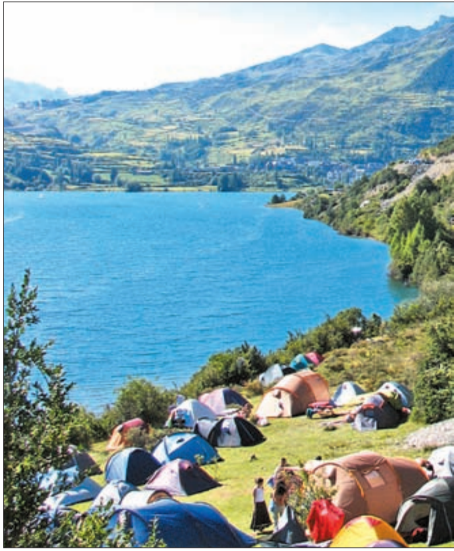
La acampada es un forma barata de alojamiento durante las vacaciones y permite conocer

Controlar el peso del equipaje también puede ayudar a contener el gasto. Pesar la maleta antes de salir, llevar encima prendas o, incluso, aprovechar el