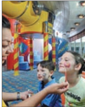
Un espacio del crucero

Así, por ejemplo, los bebés de 6 a 18 meses pueden participar en Royal Babies, que incluye actividades para promover su desarrollo físico. Royal Tots, pensado para niños de 18 a 36 meses, motiva a los menores a explorar su mundo con juegos creativos, a desarrollar su imaginación y a fomentar la confianza en sí mismos. Aquanauts, de 3 a 5 años, incluye, entre otras actividades, pintura con dedos, disfraces,