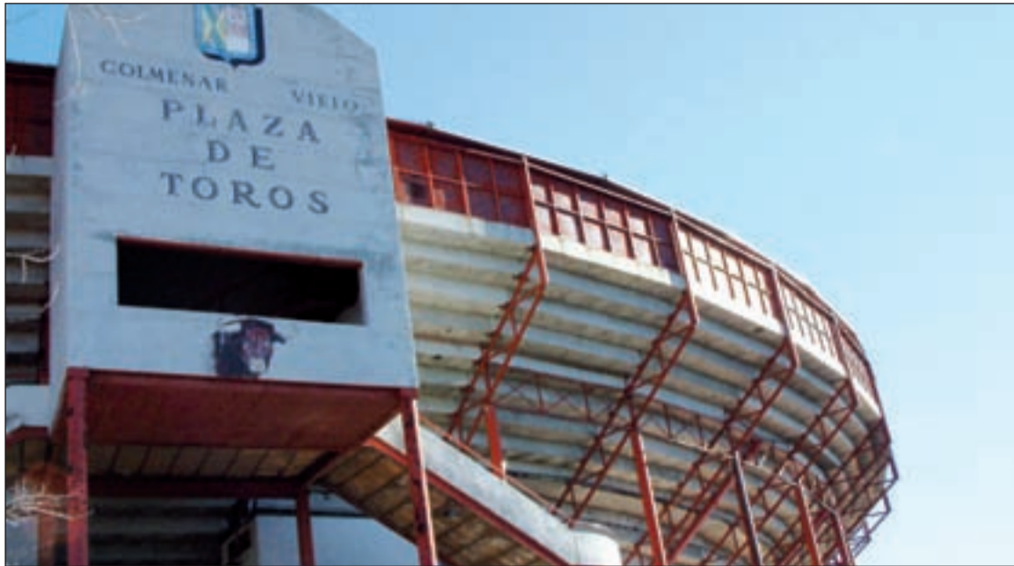
La Plaza de Toros en donde tenía lugar la suelta de vaquillas