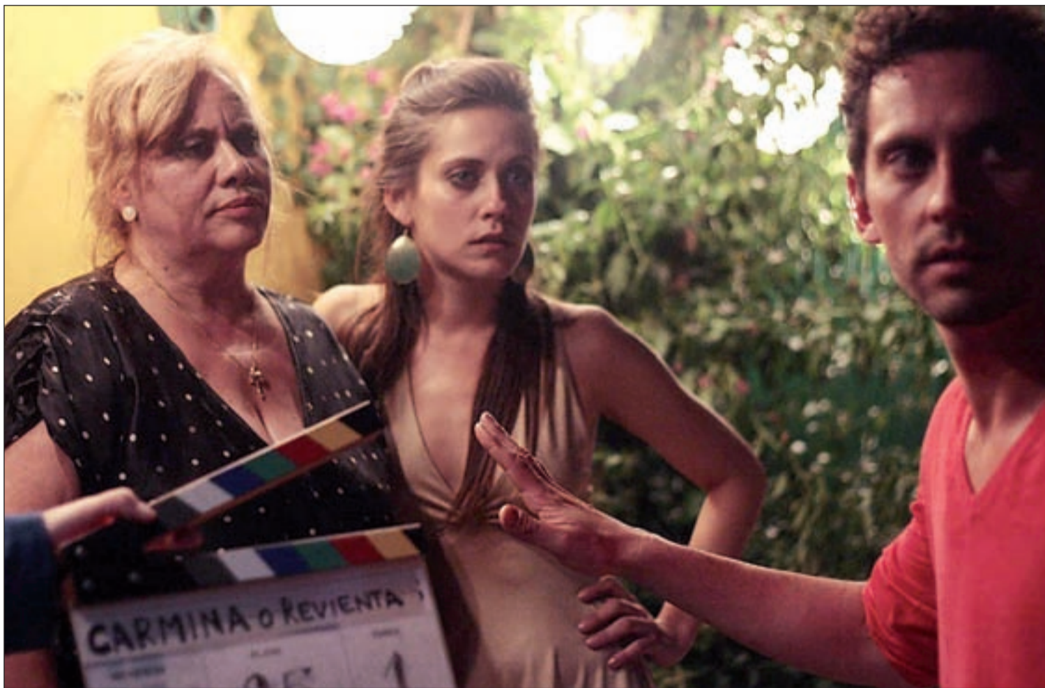
Paco León da instrucciones a su madre y su hermana durante el rodaje de la película