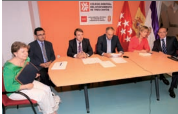
La directora general y el alcalde en el primer caso de arbitraje

En estos casos, un empleado público del consistorio, previamente acreditado como árbitro por la Junta Regional Arbitral, actúa como presidente del colegio arbitral. Este tipo de audiencias suelen celebrarse cuando el