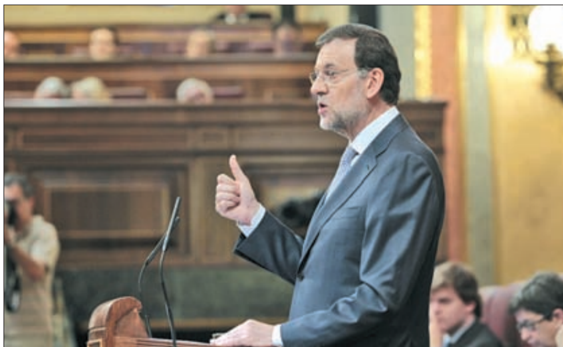
El presidente del Gobierno, Mariano Rajoy, anunció sus medidas en el Pleno del Congreso

En un comunicado, los rectores han manifestado la necesidad de "preservar" una universidad pública "de calidad" como medio para "favorecer la salida de la crisis", lo que, en su opinión, es "contradictorio" con los nuevos recortes a la financiación de las universidades de Madrid.