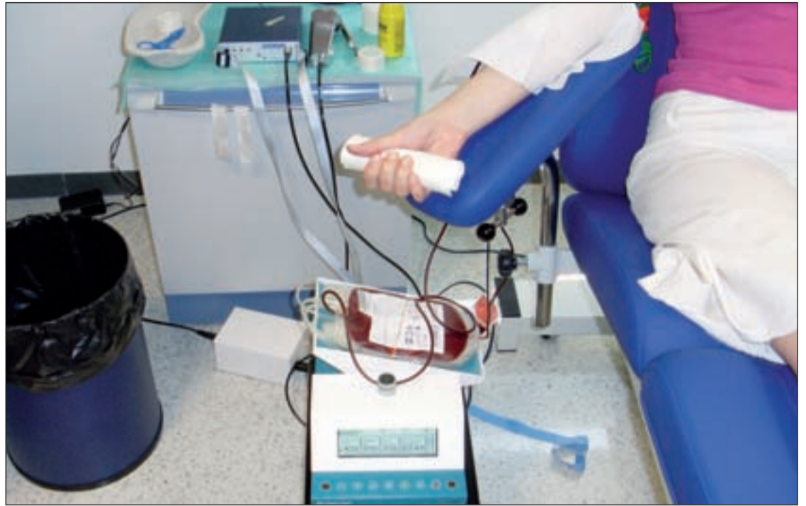
Los ciudadanos de la Comunidad de Madrid podrán donar sangre este verano

Durante la campaña, el Centro de Transfusión reforzará las labores de difusión y sensibilización con los ciudadanos, a través de la colaboración estrecha con los ayuntamientos y actividades con diferentes colectivos. Así, el Centro ha ofertado talleres a los campamentos infantiles urbanos que se desarrollan en las localidades que visitarán las uni-