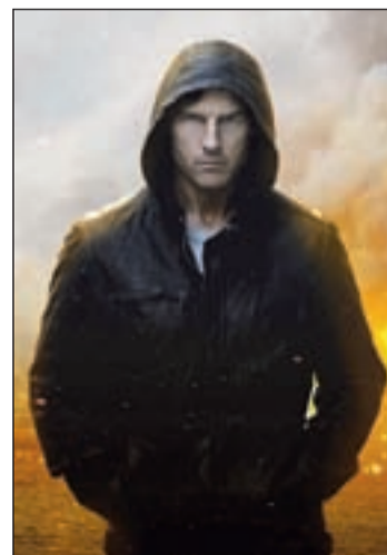
Tom Cruise en 'Misión Imposible'

La Plaza de la Familia tricantina será el escenario para disfrutar de las mejores películas que hemos visto en las salas de cine durante esta temporada. Las sesiones comenzarán el día 14 con la proyección desde las diez y media de la noche de la cuarta película de 'Misión Imposible'. Tom Cruise se pone en el papel de Ethan Hunt para continuar