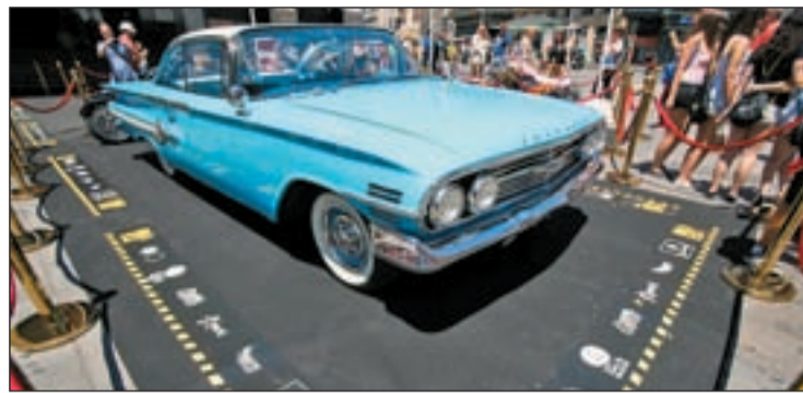
Los clásicos toman la Plaza de Callao

Las entradas se pueden adquirir en la página web de ‘Mulafest’, en las taquillas del Cine Callao y a través de ‘www.ticketea.com’. la entrada de día tienen un precio de 20 euros y el abono de 4 días, 50 euros.