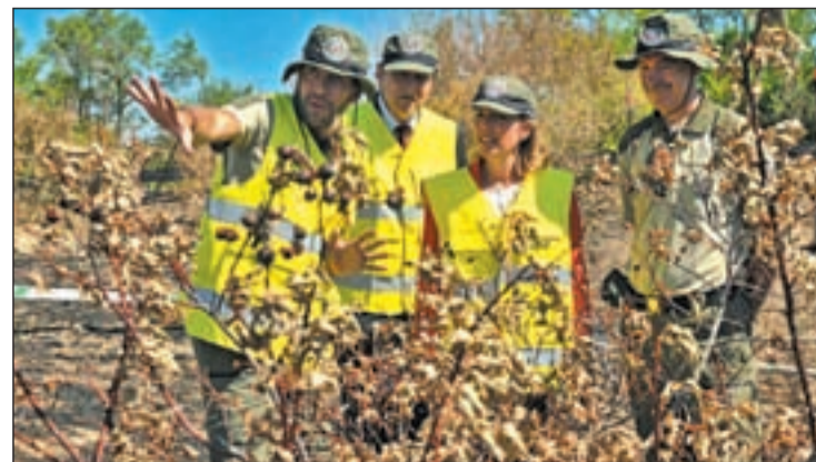
La consejera durante la visita a una práctica de investigación de fuegos

Estos 110 incendios suponen un "repunte adicional", dijo la consejera debido a las condiciones meteorológicas de abril.