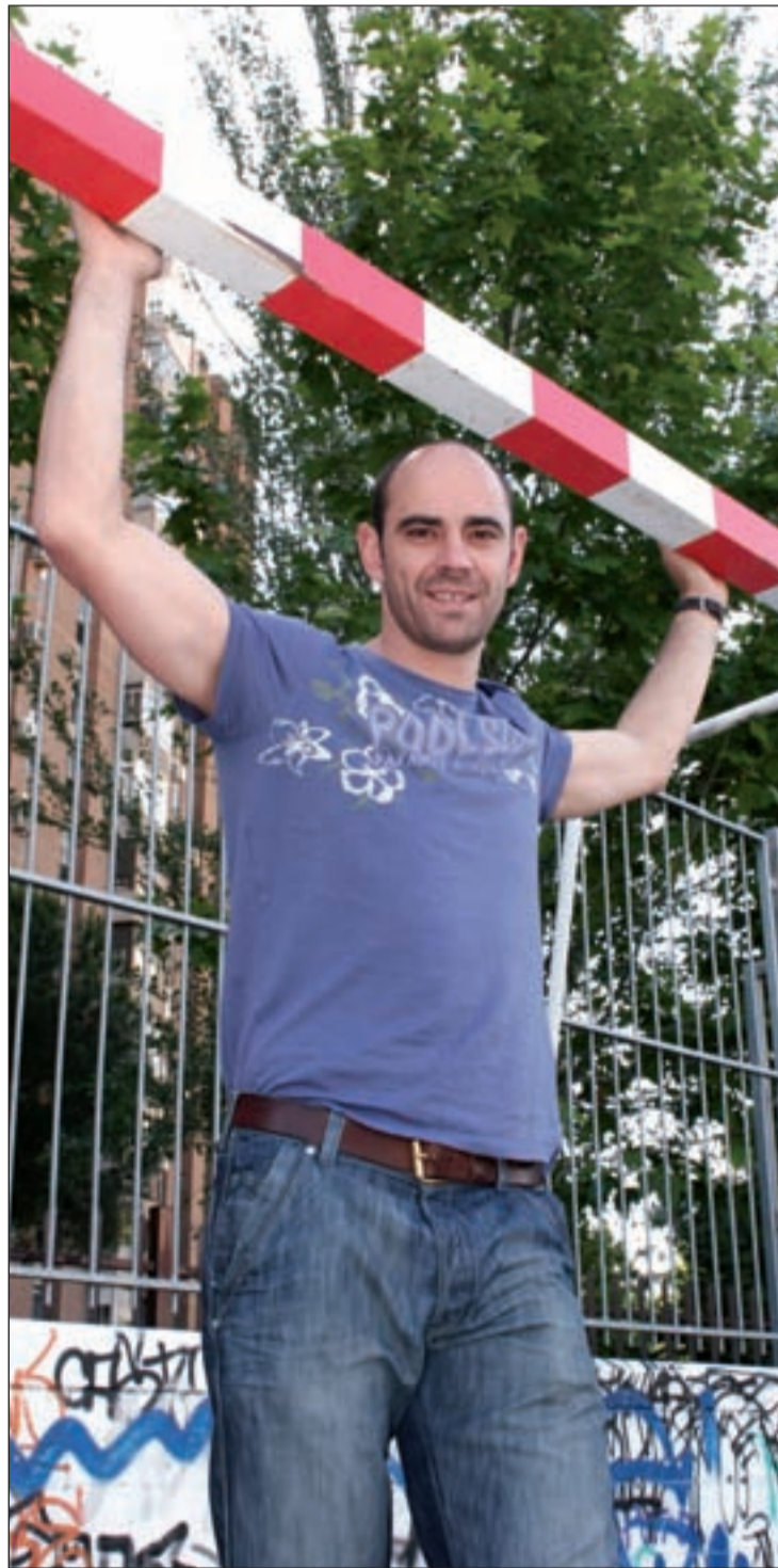
Hombrados lleva más de dos décadas en la élite

Todos estos equipos son viejos conocidos, aunque algunos de infausto recuerdo como Corea