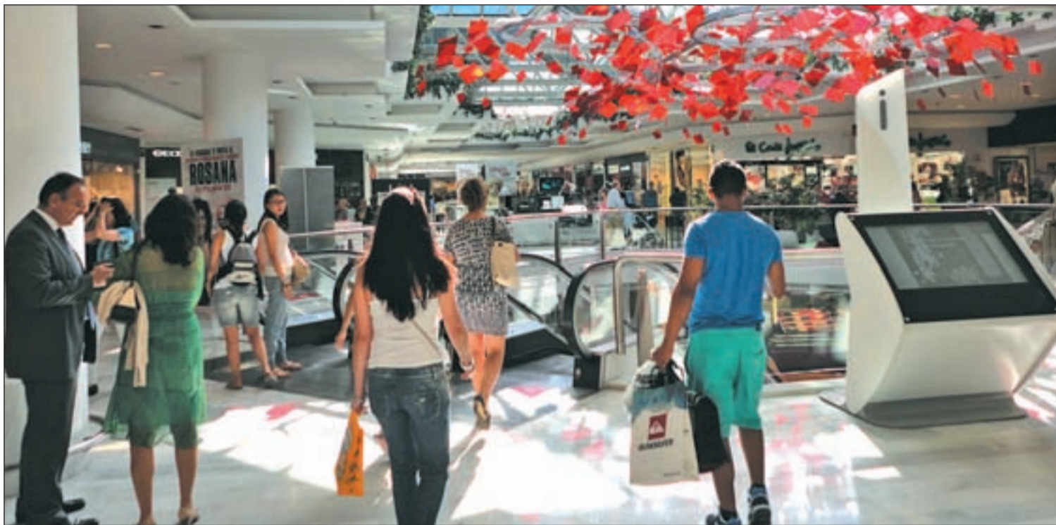
La Vaguada es uno de los centros comerciales que abrirán todos los domingos y festivos en la Comunidad de Madrid