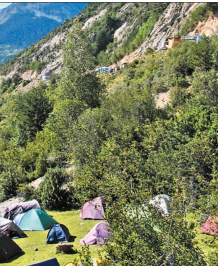
y disfrutar de la naturaleza

El interés de los turistas por las regiones del norte de España como destino vacacional ha crecido un 22%