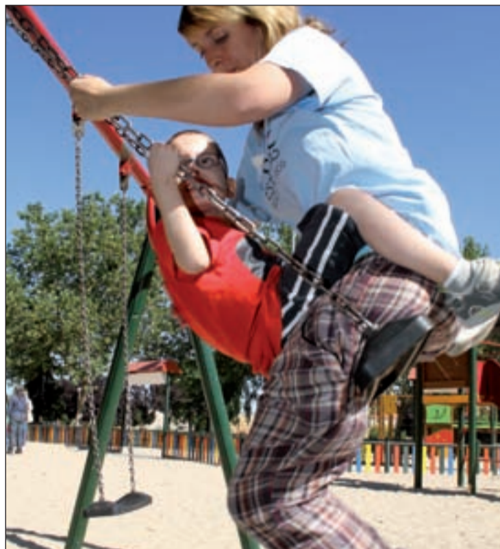
Un momento del campamento, el pasado jueves

En total, el Ayuntamiento ha ofrecido 21 plazas para esta iniciativa, con el patrocinio del Centro Comercial TresAguas, que la financia con 3.500 euros. “Estos campamentos tienen un doble objetivo: ayudar a los cuidadores, porque el verano es muy largo y desestructura bastante a los chavales; y dar una respuesta de ocio adaptada, en un espacio adaptado y con ma-