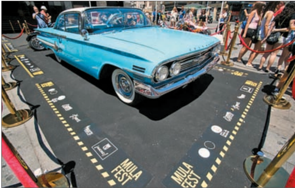
Exhibición de un vehículo antiguo en la Plaza de Callao