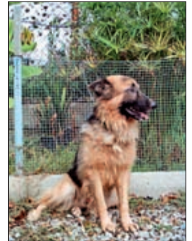
Crece la adopción de animales

En otro orden de cosas, el Ayuntamiento de Alcorcón ha modifi-