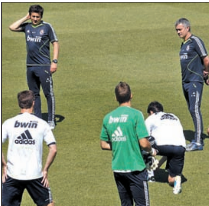
Mourinho afronta su tercera temporada como entrenador merengue

medio camino entre la puesta a punto y la promoción de la marca del club, el Real Madrid llevará a cabo el grueso de su pretemporada en Estados Unidos. Ese es el destino que le espera a la plantilla merengue a partir del 28 de este mes, pero antes deberá jugar dos encuentros amistosos. El primero de ellos se iba a jugar en Tánger ante el Atlético Tetuán, pero tras una serie de problemas el club de Concha Espina busca otro rival para el 24 de julio. Tres días después, los blancos viajarán a Lisboa para jugar ante otro histórico del viejo continente como el Benfica den-